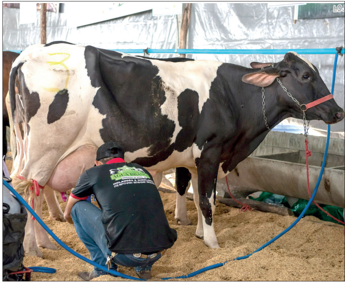
Uma das atividades já confirmada é o tradicional Torneio Leiteiro

A ExpoPinda 2024 é um evento para toda a família, que busca unir conhecimento e tecnologia a serviço da sustentabilidade no agronegócio. Em breve, divulgação da programação completa.