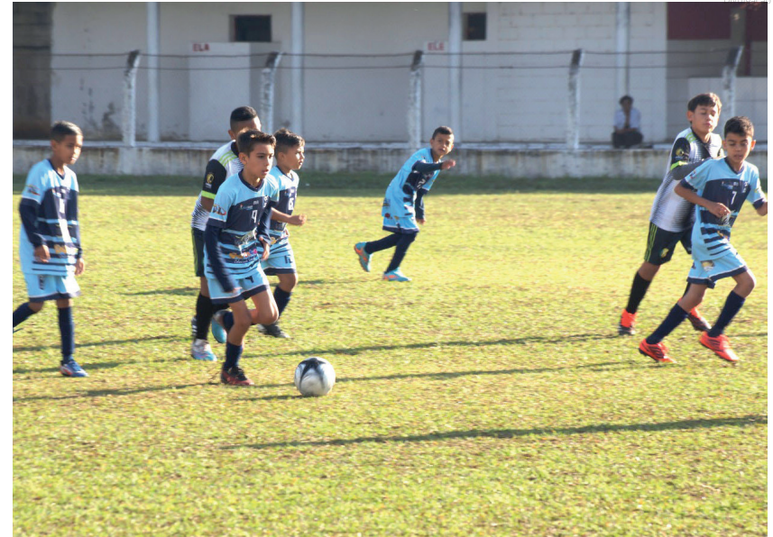
Boas oportunidades e muitos gols em muitos campos da cidade

Começando no sábado (27), com as categorias de base, pelo SUB 11, destaques para as goleadas de Sabatinão/Minicraque de 6x0 sobre o Paulista, Cantareira 0x5 Jardim Rezende A e Tipês 0x4 Gerizim.