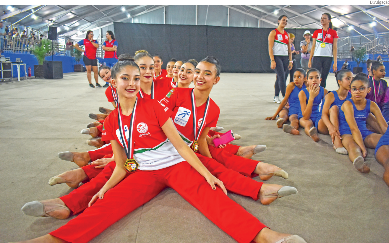
As meninas da Ginástica Rítmica brilharam no último sábado e ficaram com o ouro da modalidade