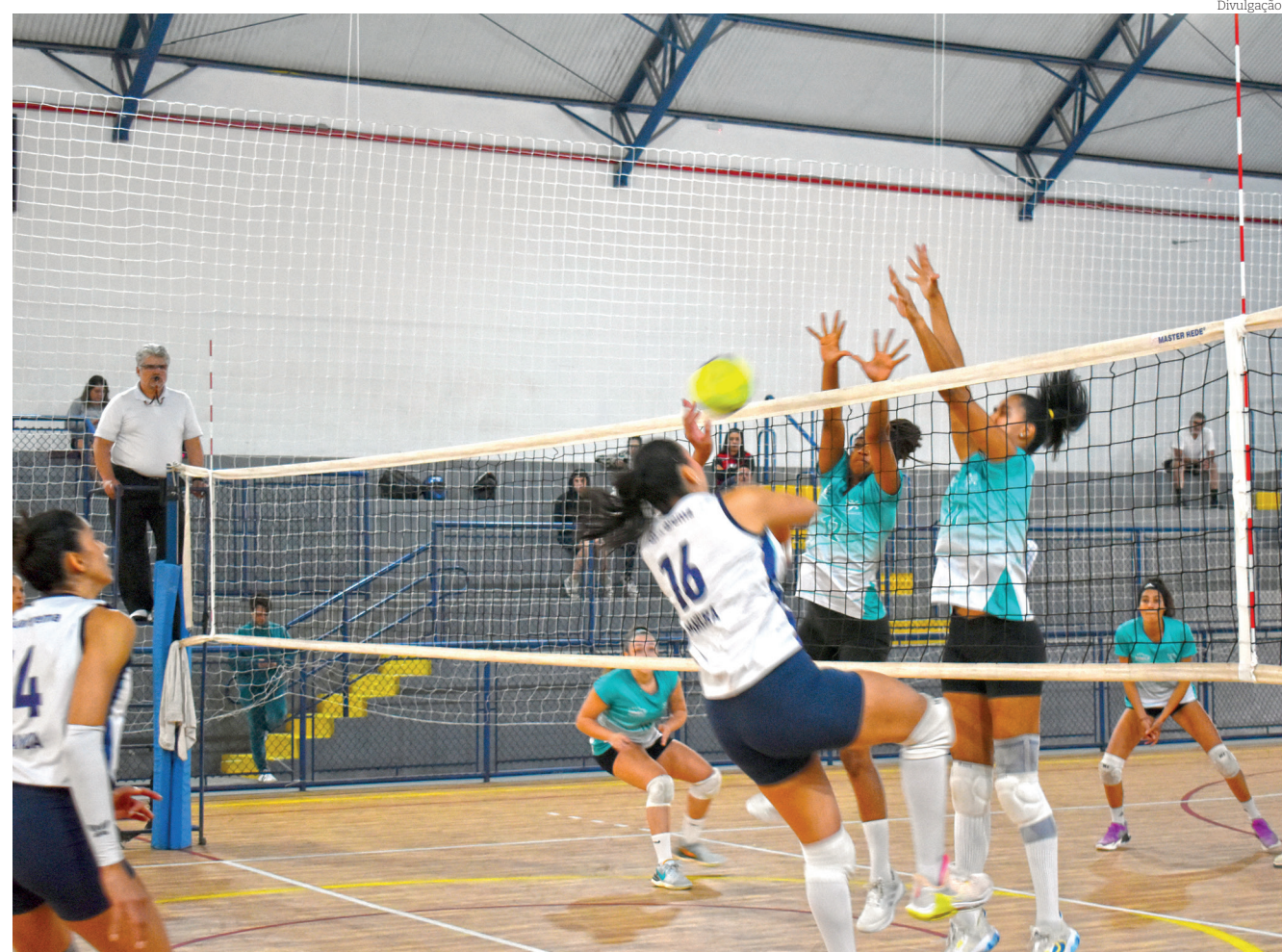
As meninas do vôlei lutaram muito e conquistaram a prata no último dia de competições

damonhangaba repetiu o feito dos últimos anos, abaixo apenas de São José dos Campos.