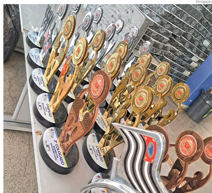
Foram 14 medalhas de ouro, 12 de prata e seis de bronze

Com ampla vantagem sobre Mogi da Cruzes, que ficou na terceira colocação, a equipe de Pin-