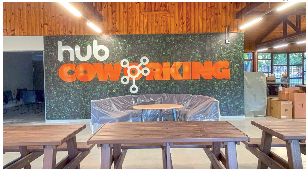
O antigo espaço da biblioteca do Bosque foi transformado num ambiente de empreendedorismo