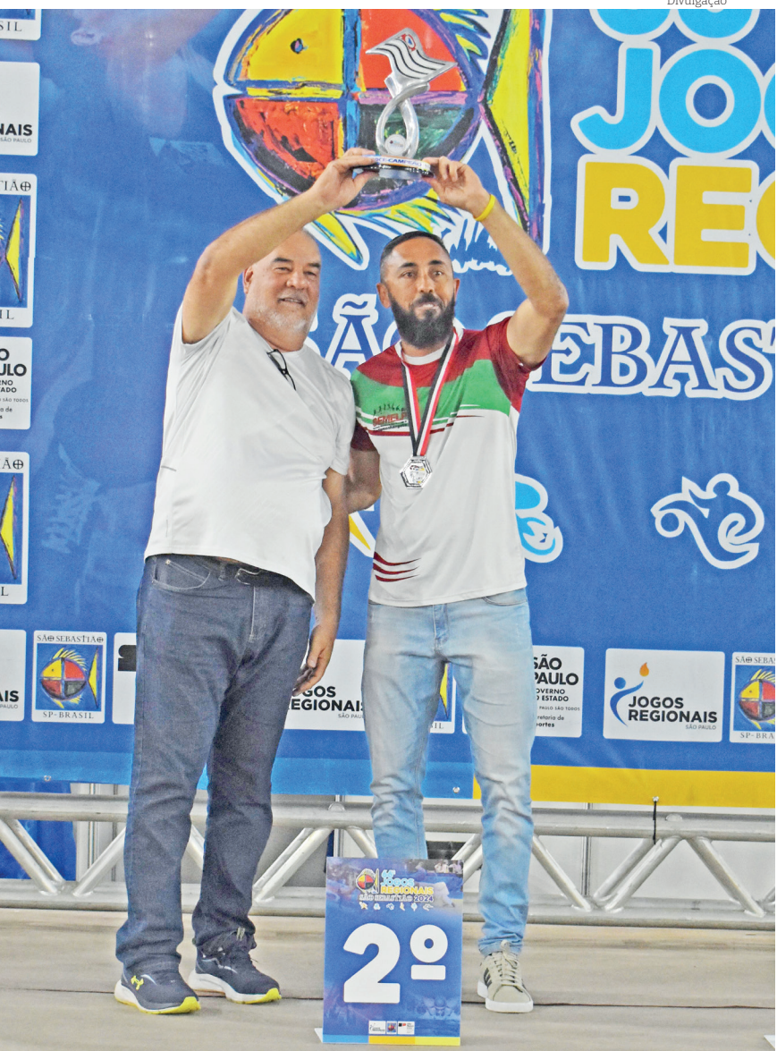
Foram 14 medalhas de ouro, 12 de prata e seis de bronze