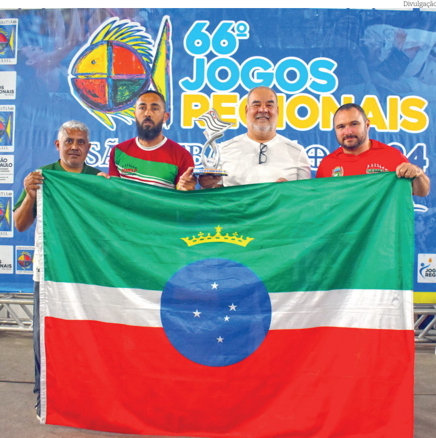
Pindamonhangaba foi vice-campeã com 272 pontos