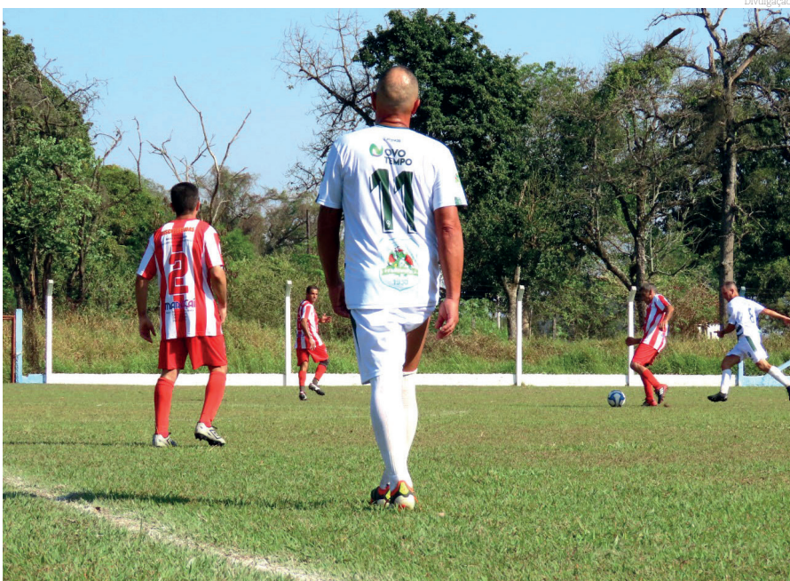
As semifinais do Sênior 50 foram bem agitadas neste final de semana