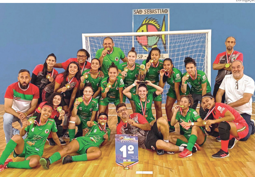
Futsal feminino foi campeão da modalidade no último sábado (27)