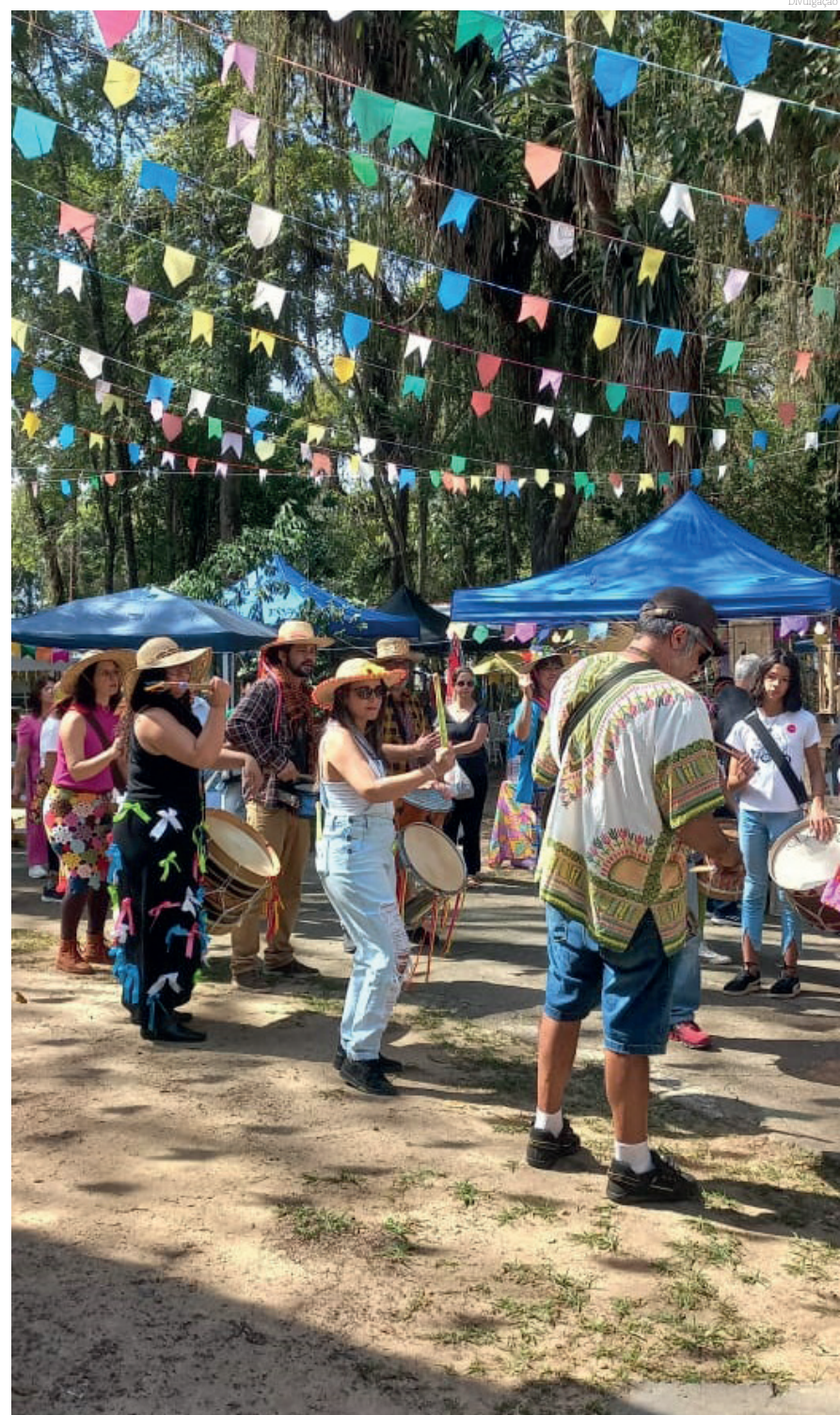
A Feira da Vila levou um grande público ao Bosque da Princesa

Quem quiser ficar por dentro das novidades do Coletivo da Vila é só seguir o instagram deles @afeiradavila.