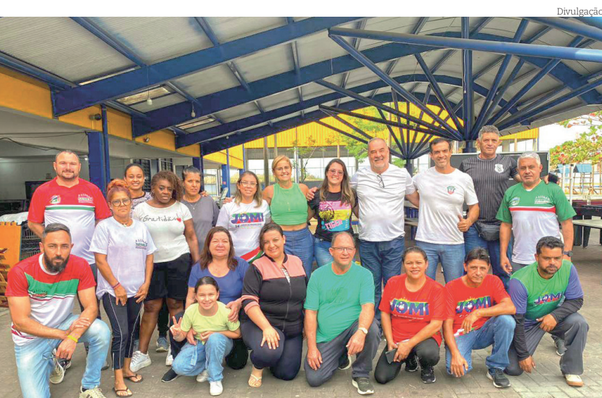
Tradicional pose para a foto e consciência do dever cumprido

Com 32 pódios, Pindamonhangaba se sagrou, no último sábado (27), vice-campeã dos Jogos Regionais 2024. As disputas aconteceram na cidade de São Sebastião, no Litoral Norte Paulista. Foram 10 dias intensos de competições em diversas modalidades. Ao fim, São José dos Campos somou 224 pontos e foi a vencedora.