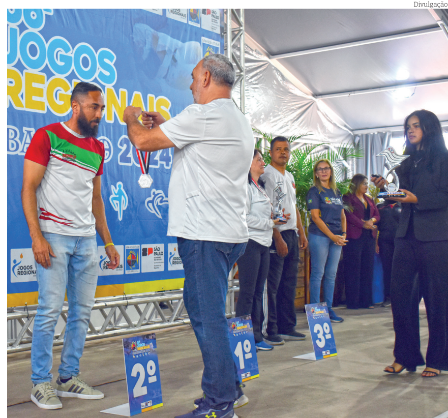
Pindamonhangaba ficou em 2º lugar nos Jogos Regionais

O bronze veio com o Taekwondo, badminton masculino, damas feminino, judô feminino e tênis masculino.