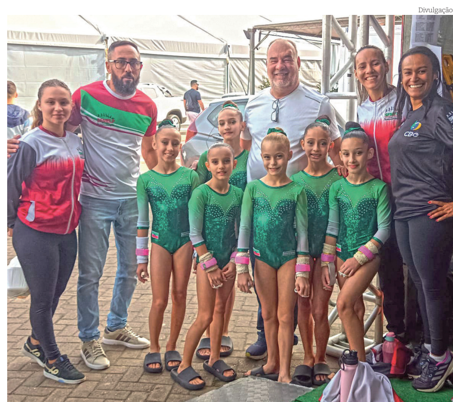
Atletas da ginástica artística de Pinda desfilaram sua graça