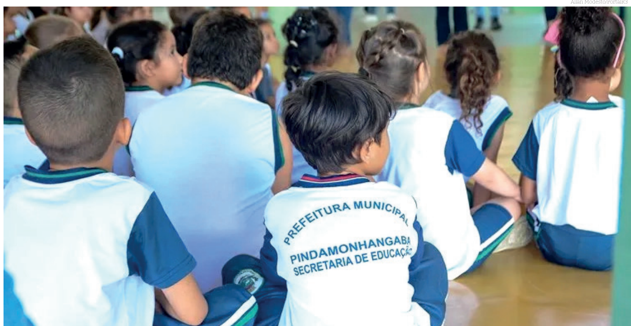
Cerca de 15 mil estudantes voltam às aulas nesta sexta-feira

O retorno das aulas na Rede Municipal de Pindamonhangaba é um momento importante para a continuidade do aprendizado dos alunos e o fortalecimento das práticas pedagógicas. Espera-se que o segundo semestre proporcione muitas oportunidades de crescimento e desenvolvimento para os estudantes.