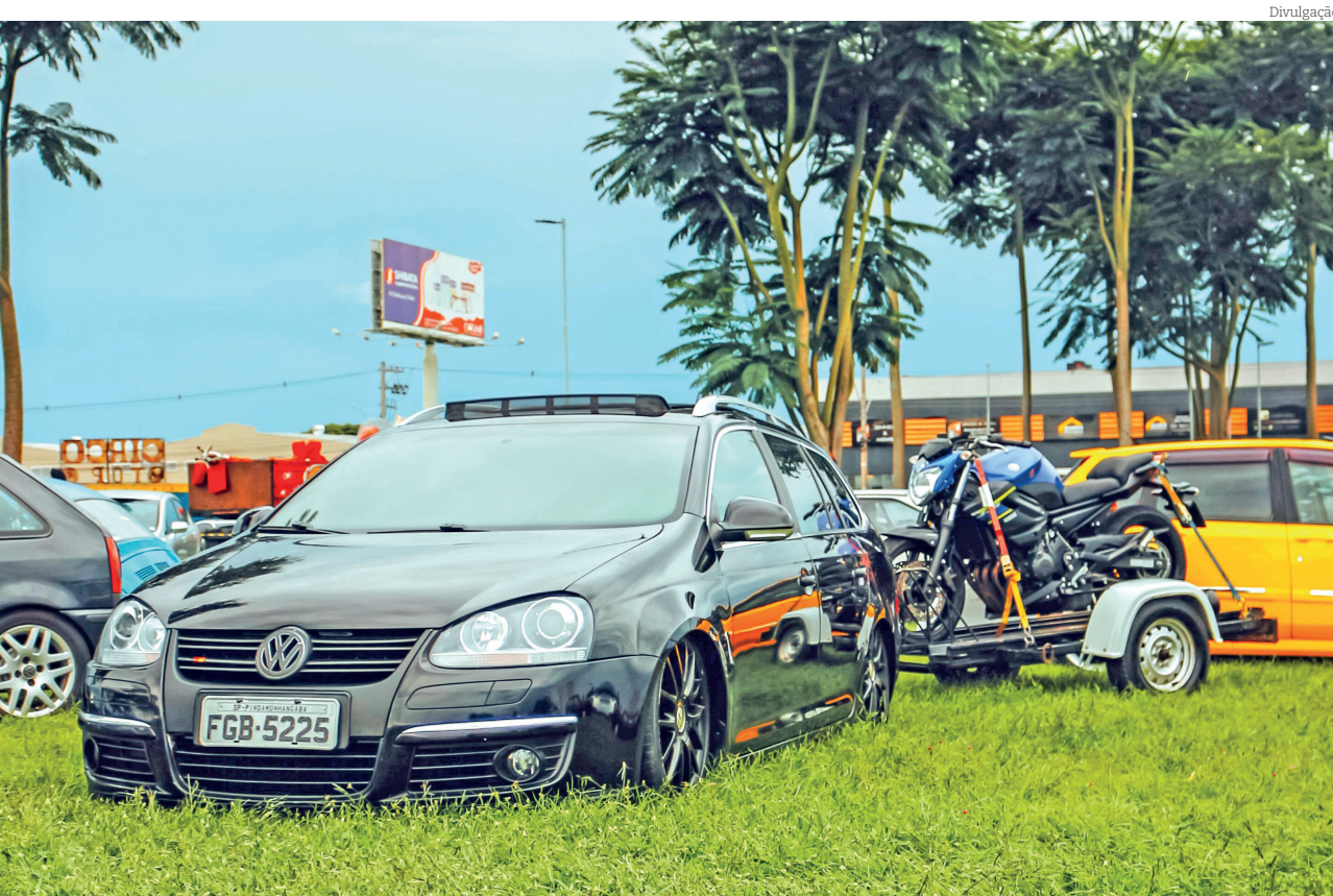
'Encontro de Carros Street Valley' é destinado aos amantes de carros modificados

A intenção do projeto é contribuir com a implantação do Plano Municipal de Resíduos Sólidos, apresentando um olhar aprofundado para os ciclos de produção, consumo e gestão dos resíduos, dando visibilidade ao trabalho de lideranças femininas do setor e produzindo um material inclusivo, com linguagem acessível e recursos de acessibilidade.