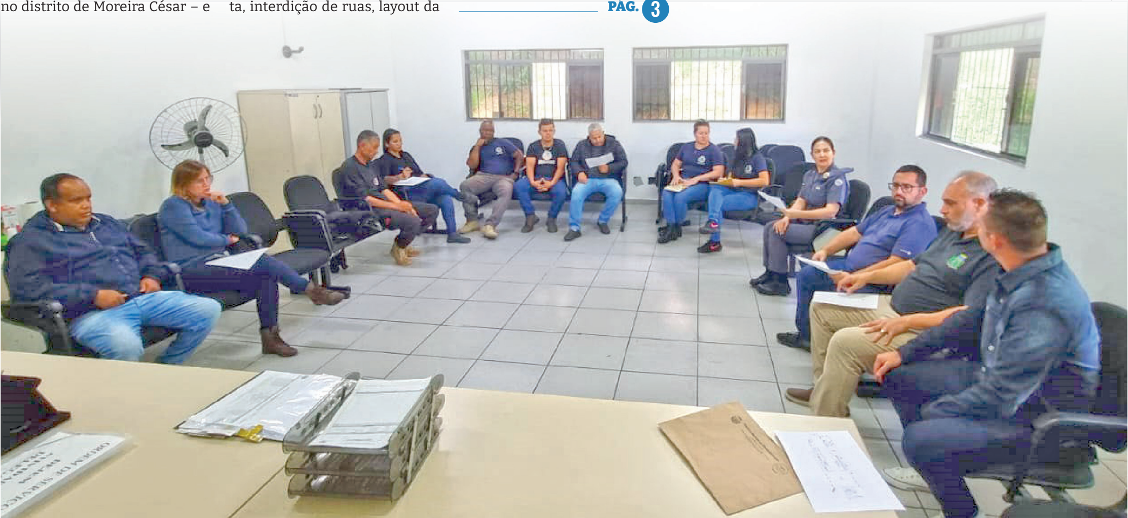
Foram acertados os detalhes relacionados à segurança do festival, que conta com show de Sérgio Reis no domingo (28), logo após a apresentação de Bruno e Hiago

Encerrando a programação comemorativa dos 319 anos de Pindamonhangaba, o 'Festival Julino 2024' acontece na praça Santa Rita entre os dias 26 e 28 de julho