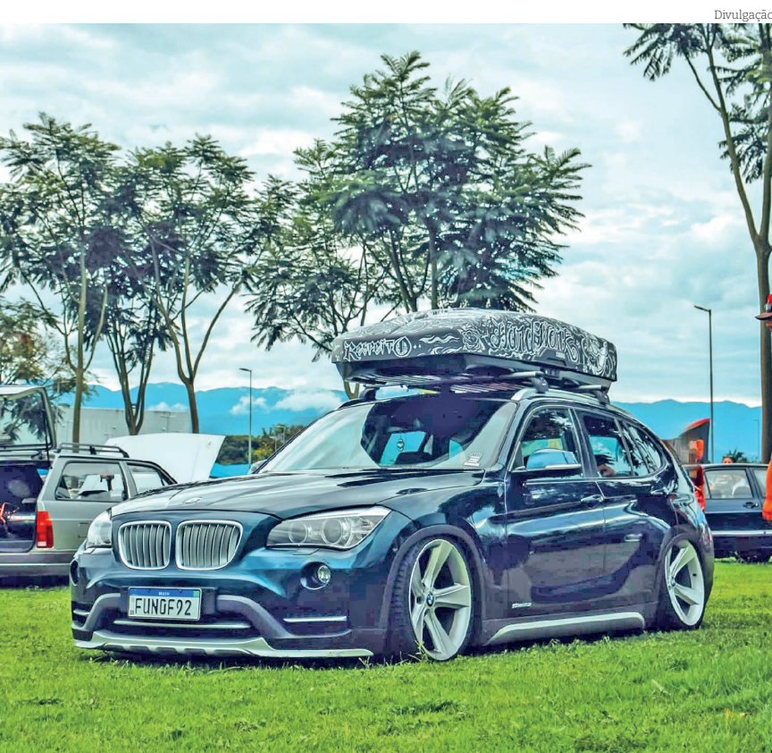
Exposição é dedicada aos amantes de carros modificados