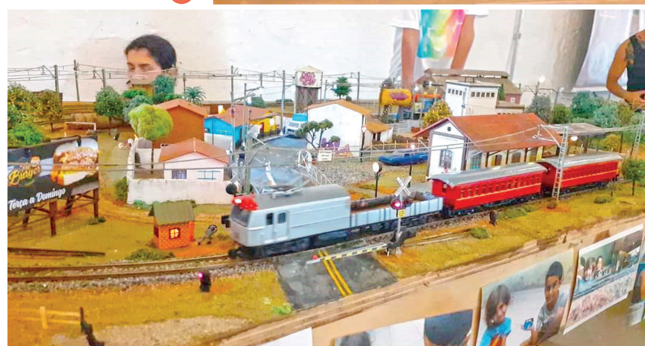
Público poderá conhecer algumas maquetes e obter informações sobre o ferreomodelismo