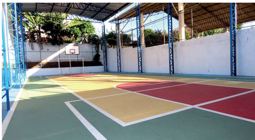
A escola foi reformada e entregue à população

Foi entregue na tarde desta quarta-feira, dia 24, a reforma e ampliação da Escola Municipal Professor Alexandre Machado Salgado, localizada na rua José Benedito Quirino, 280, no Bairro das Campinas.