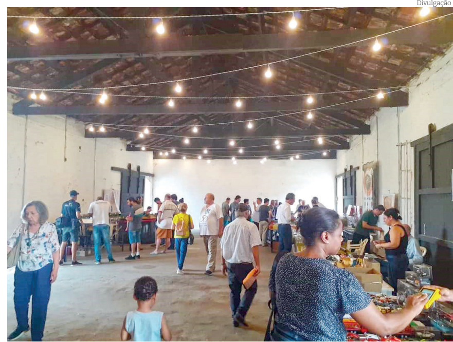
Aguardada com expectativa pelos aficionados, exposição acontece pela quarta vez em Pindamonhangaba

Seja para relaxar, divertir-se, desestressar ou mesmo cultivar o amor pelas ferrovias, muitas pessoas têm aderido ao hobby do ferreomodelismo, afinal, o trem elétrico é uma excelente opção para quem está procurando algo para entreter a mente e passar o tempo.