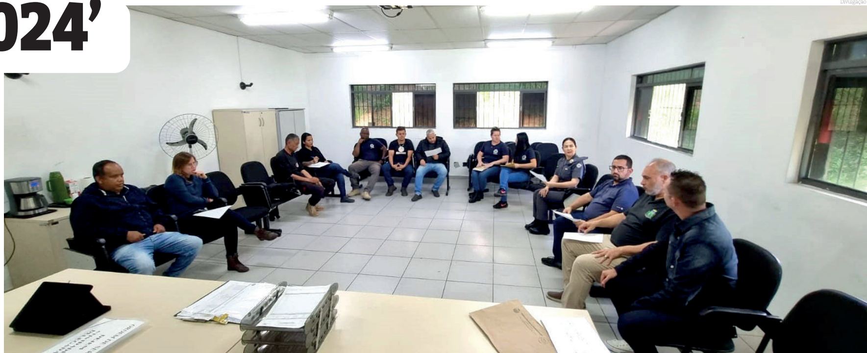
Foram discutidos problemas de 2023 com melhorias para a edição deste ano

O 'Festival Julino', que encerra a programação comemorativa dos 319 anos de Pindamonhangaba, acontecerá na praça Santa Rita entre os dias 26 e 28 de julho. O grande destaque da programação deste ano fica por conta do show de Sérgio Reis, que subirá ao palco no domingo, dia 28, a partir das 21 horas, logo após o show de Bruno e Hiago.