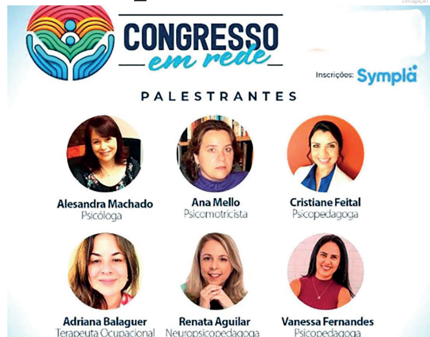
Profissionais do congresso

Está sendo realizado entre os dias 24 e 25 de julho o 'Congresso em Rede: Trilhando Caminhos Rumo à Equidade e Qualidade da Educação Municipal' para profissionais das escolas municipais de Pindamonhangaba, com a presença de profissionais especializadas nestas áreas.