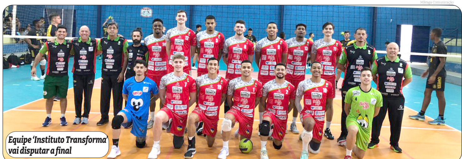
Equipe 'Instituto Transforma' vai disputar a final

reforçou o fato de não se perder a oportunidade de mostrar seu momento positivo e se impor em quadra, independente de qual seja o adversário. Na decisão, o objetivo é manter esse pensamento diante de um adversário conhecido, que merece toda a atenção.