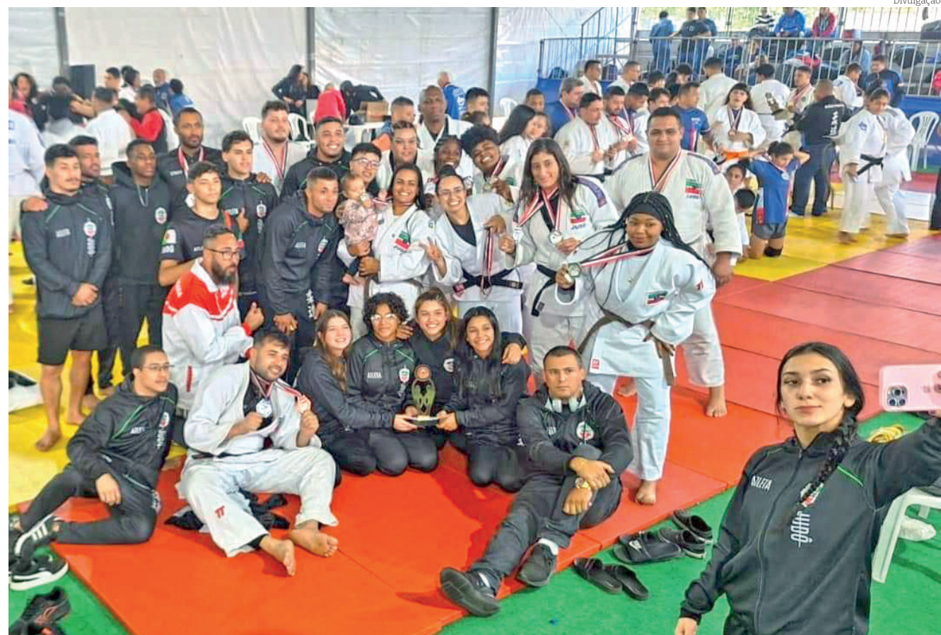
Atletas que representam Pindamonhangaba em modalidades de luta posam para a 'selfie'