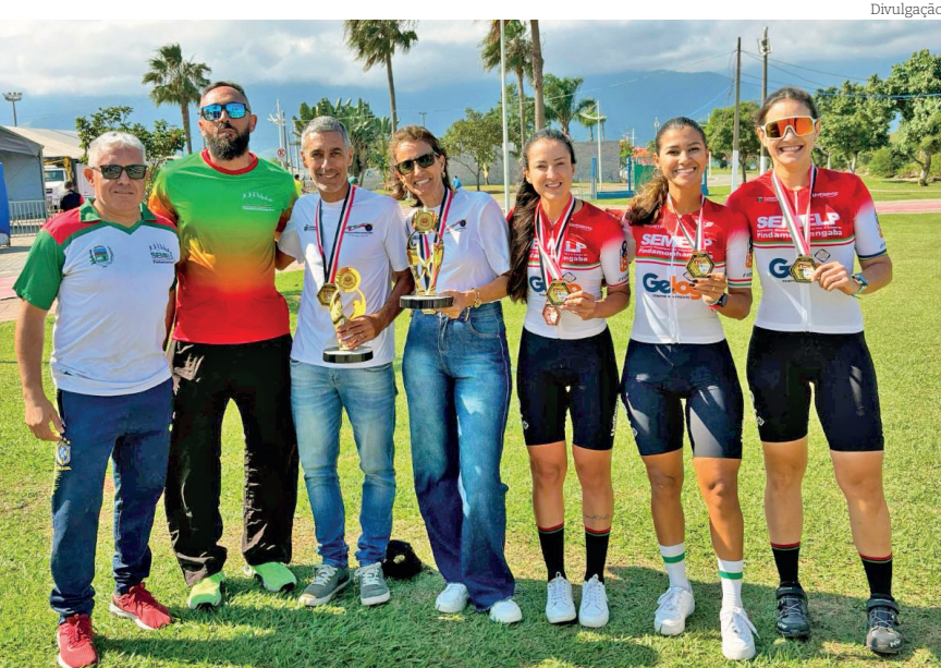
Mais vitórias para Pindamonhangaba nos Jogos Regionais