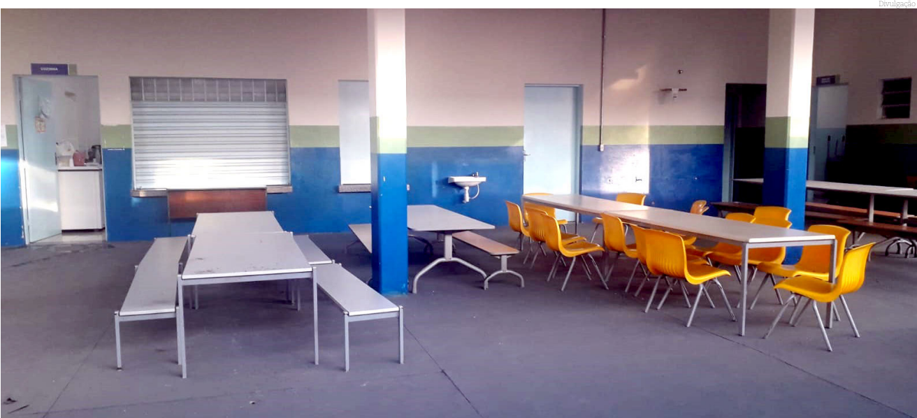
A escola recebeu a ampliação de diversas áreas

Será entregue hoje, dia 24, às 16h, a reforma e ampliação da Escola Municipal Professor Alexandre Machado Salgado (Rua José Benedito Quirino, 280, no Bairro das Campinas).