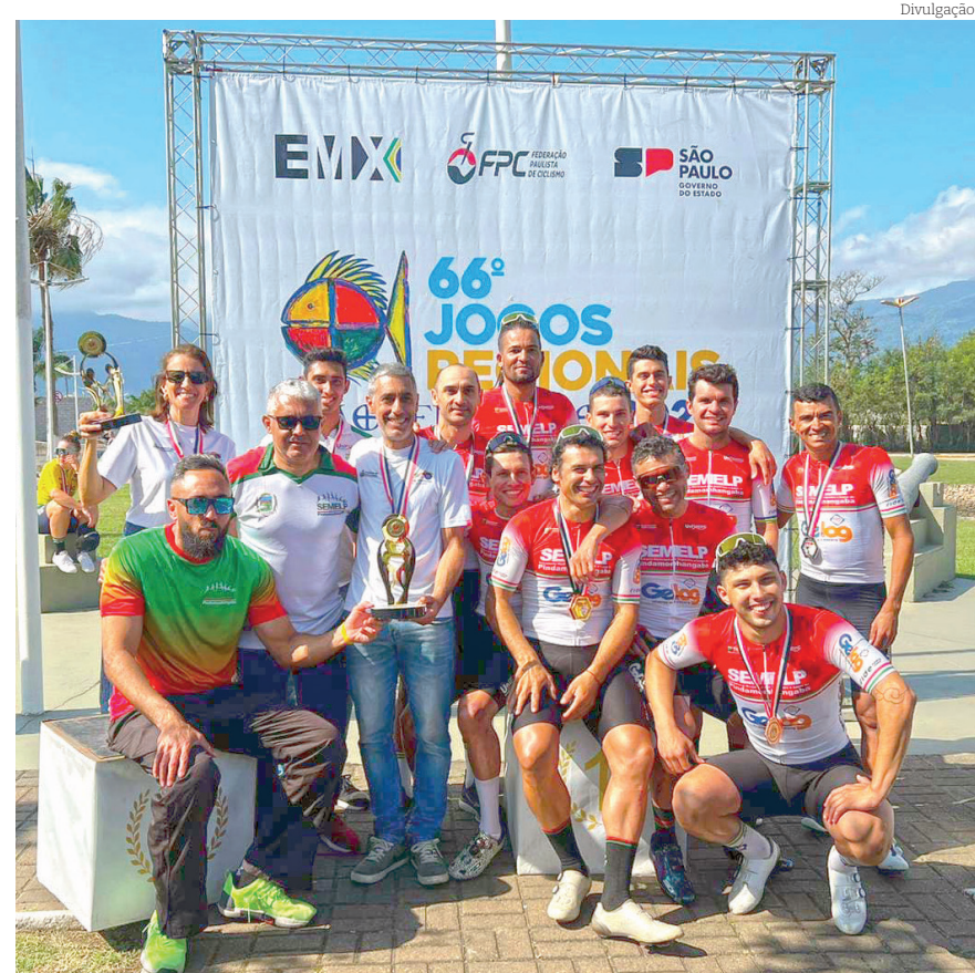
Atletas da SEMELP posam com as medalhas