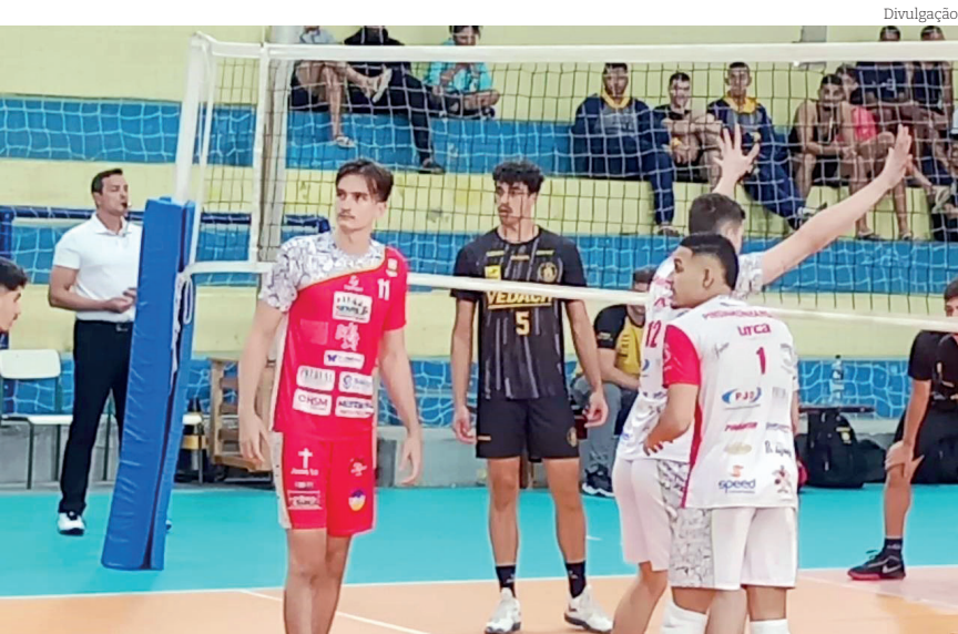
Vôlei masculino venceu Cruzeiro por dois sets a zero

A equipe de Pindamonhangaba segue fazendo uma excelente participação na 66ª edição dos Jogos Regionais do Interior que, pela terceira vez, está acontecendo na cidade de São Sebastião, no Litoral Norte.