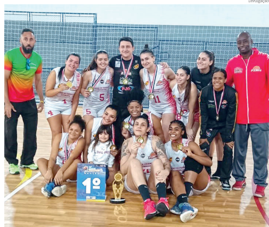
Basquete feminino exhibe o ouro conquistado