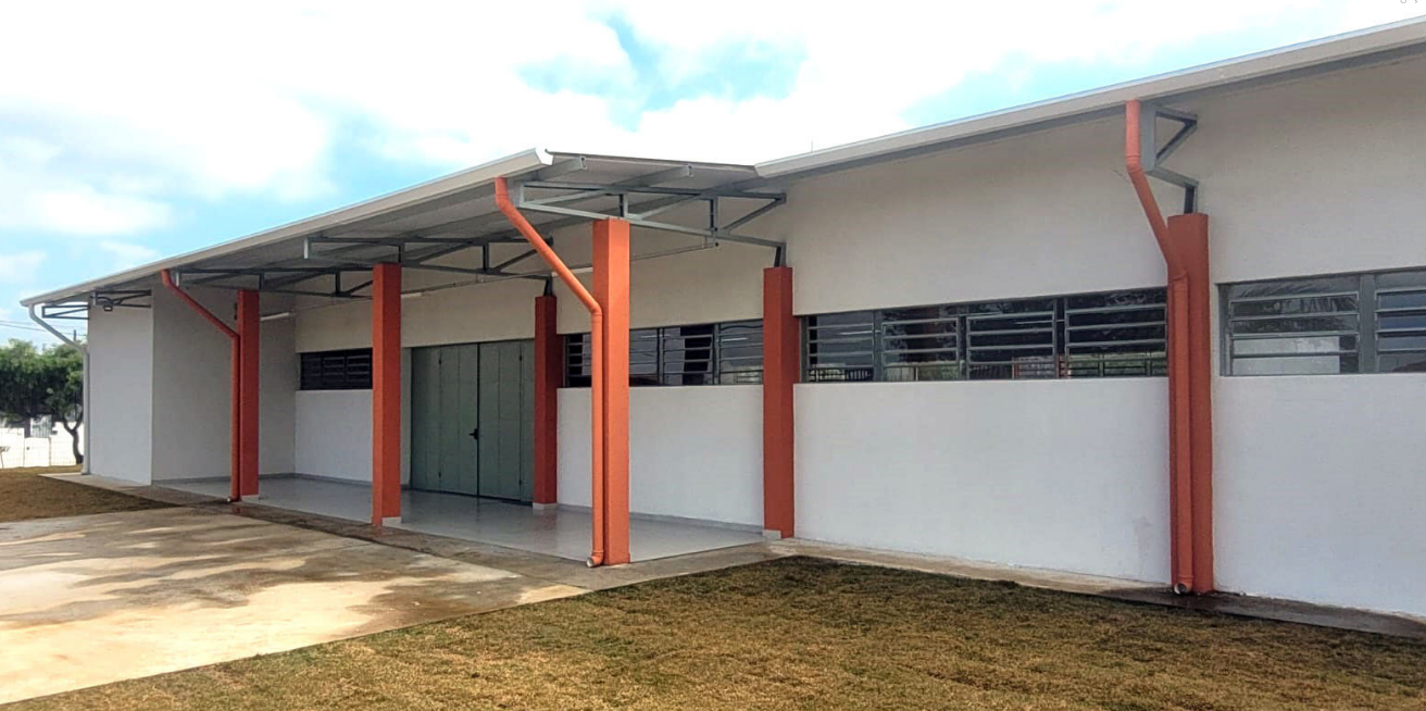
O centro comunitário recebeu um investimento de R$ 1.558.798,72

Foi inaugurado nesta terça-feira (23), o Centro Comunitário do bairro Castolira. O novo centro comunitário está localizado à Syllas Brandão, ao lado da quadra coberta. O espaço foi construído por uma empresa especializada.