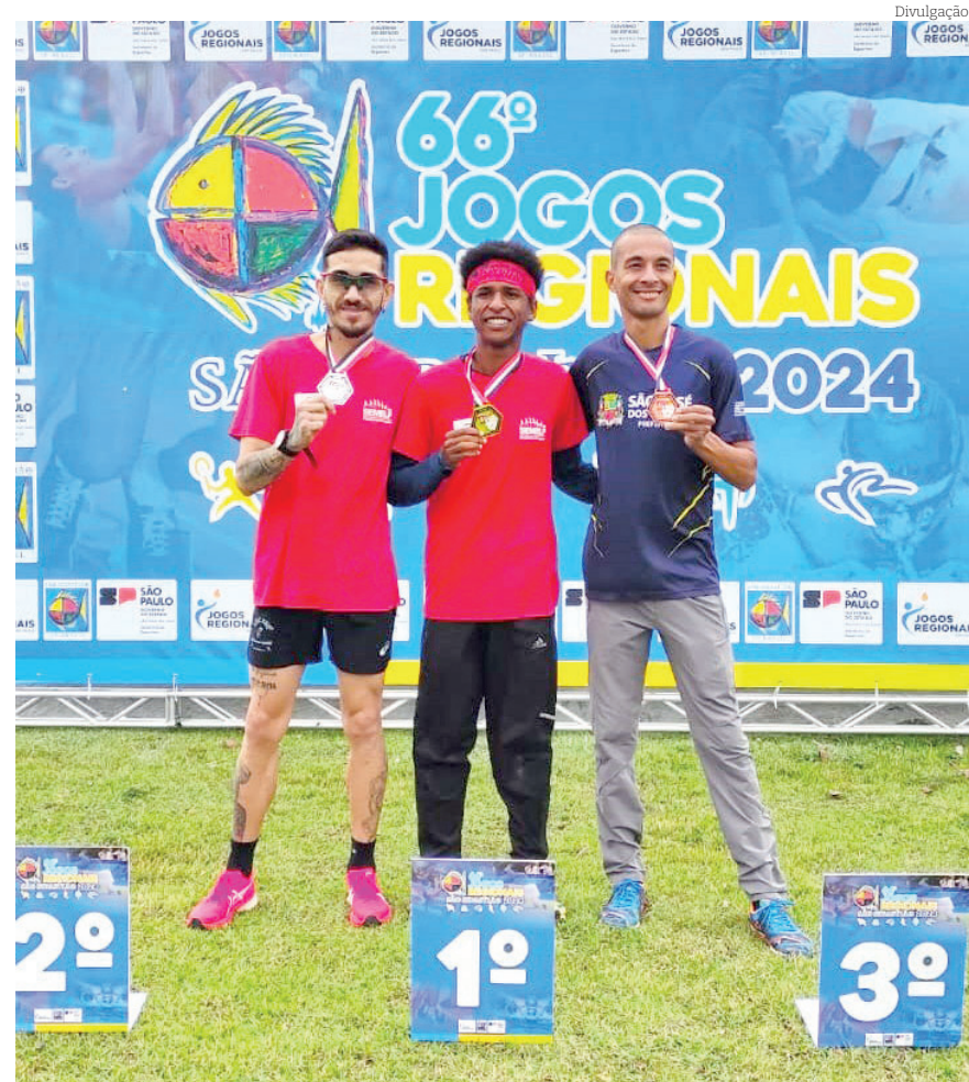
O Atletismo tem obtido ótimos resultados para a cidade

A equipe espera agora o resultado do confronto entre Poá ou Ferraz de Vasconcelos para saber seu próximo desafio no torneio. Vale destacar que o grupo venceu as duas últimas edições dos Jogos Regionais batendo, em ambas, o time de São José dos Campos.