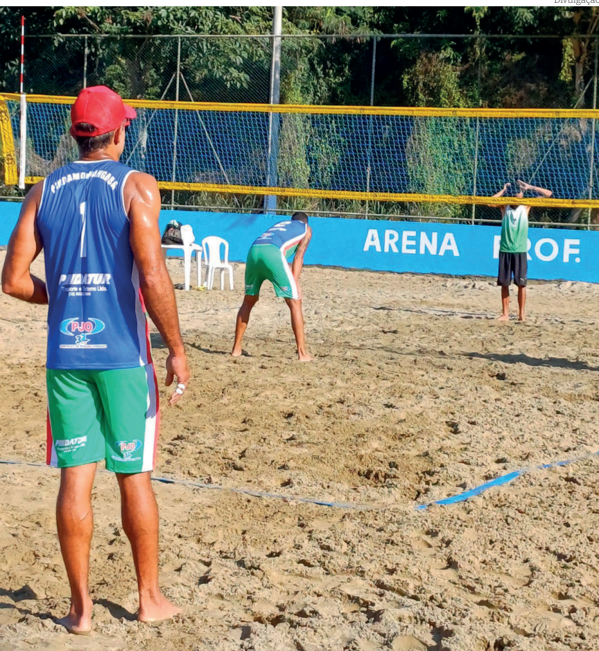
Pinda está representada também no vôlei de areia

Competição segue até o dia 27 de julho no Litoral Norte