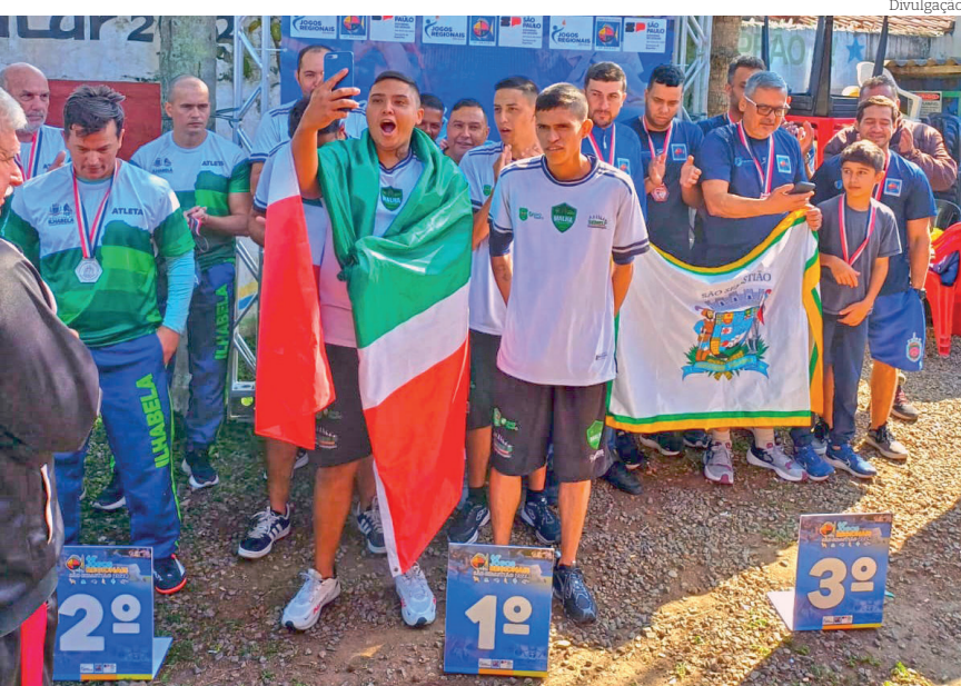
A bandeira de Pinda tem estado presente no pódio