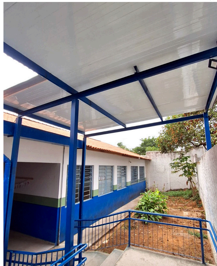
A reforma também incluiu a construção de uma rampa de acesso que conecta os prédios.

A escola Professor Alexandre Machado Salgado, no bairro das Campinas, atende 372 estudantes da pré-escola ao 5º ano do ensino fundamental anos iniciais.