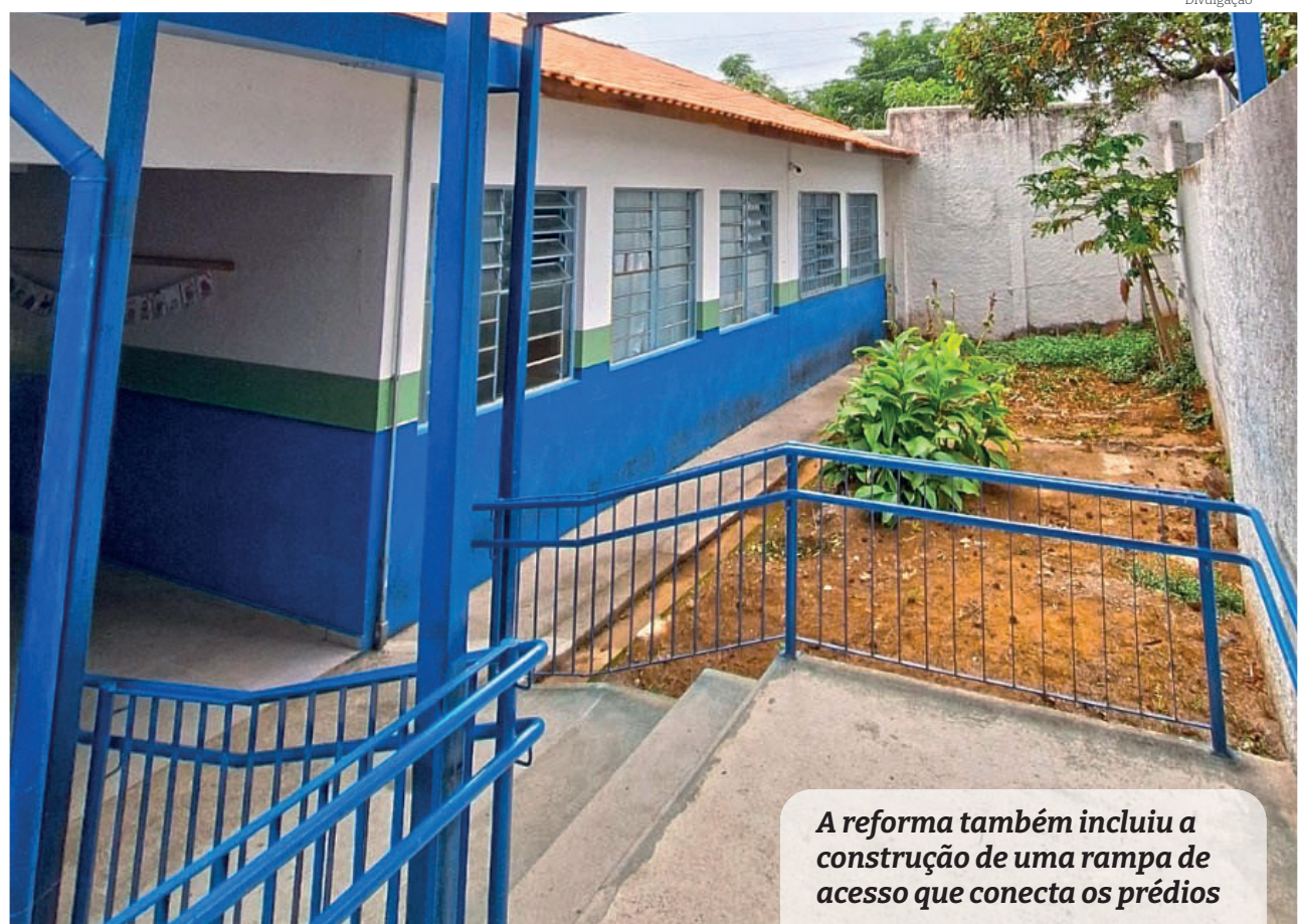
A reforma também incluiu a construção de uma rampa de acesso que conecta os prédios