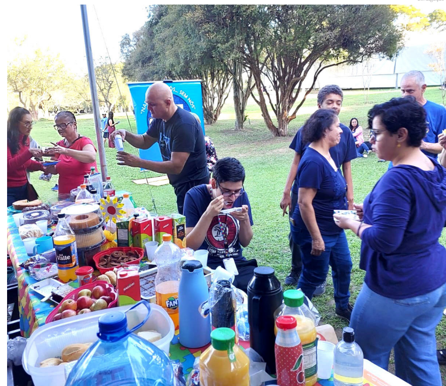
Os participantes do 'Grupo Autismo Pinda' gostaram muito de ter realizado o encontro

Quem quiser conhecer o trabalho do 'Grupo Autismo Pinda' pode procurar pelo instagram @autismo-pinda.