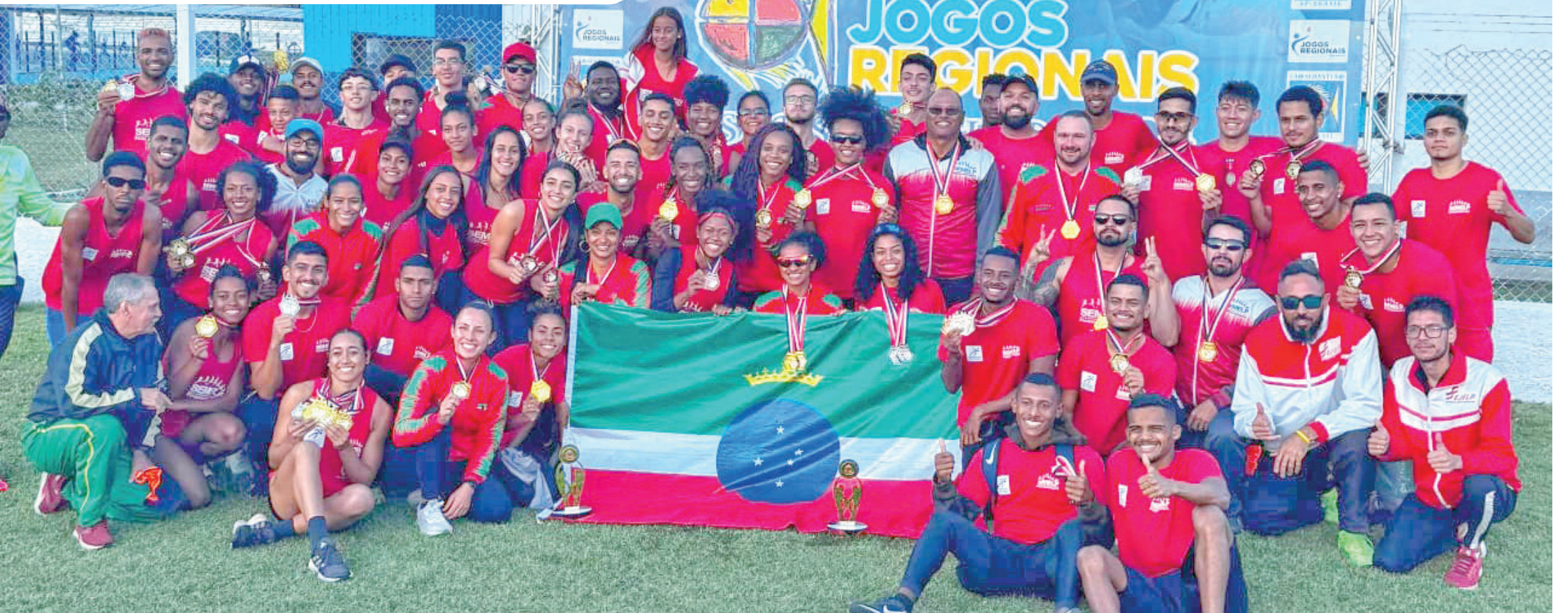
Equipe de Atletismo que compõe a delegação de Pindamonhangaba em São Sebastião posa com medalhas; Pinda está a apenas 27 pontos de São José dos Campos

Competição segue até o dia 27 de julho no Litoral Norte