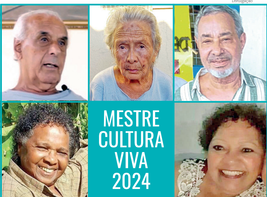
Cinco mestres da tradição oral são escolhidos anualmente