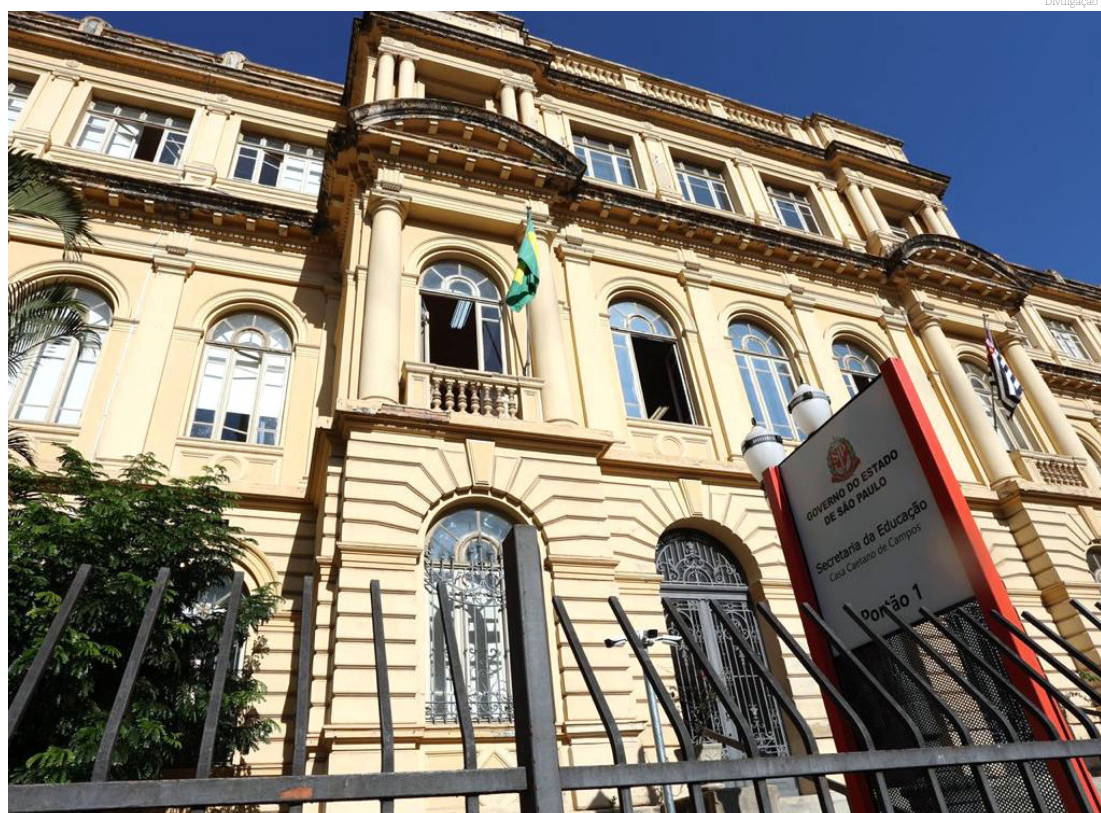
Expectativa é que 45 escolas se tornem cívico-militares em 2025

Comunidade escolar tem até o dia 15 de agosto para manifestar o interesse no novo modelo; expectativa é que 45 escolas se tornem cívico-militares em 2025