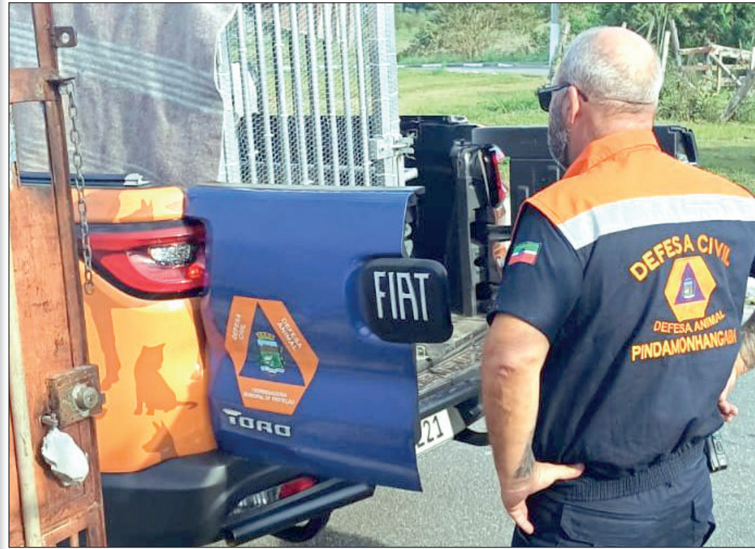
O tutor perdeu a guarda do animal, que foi encaminhado ao Cepatas

O tutor perdeu a guarda do cachorro, que foi encaminhado ao Cepatas. A operação contou com a participação da Polícia Militar Ambiental e o apoio da Secretaria de Meio Ambiente e Defesa Animal e da Secretaria de Segurança Pública.