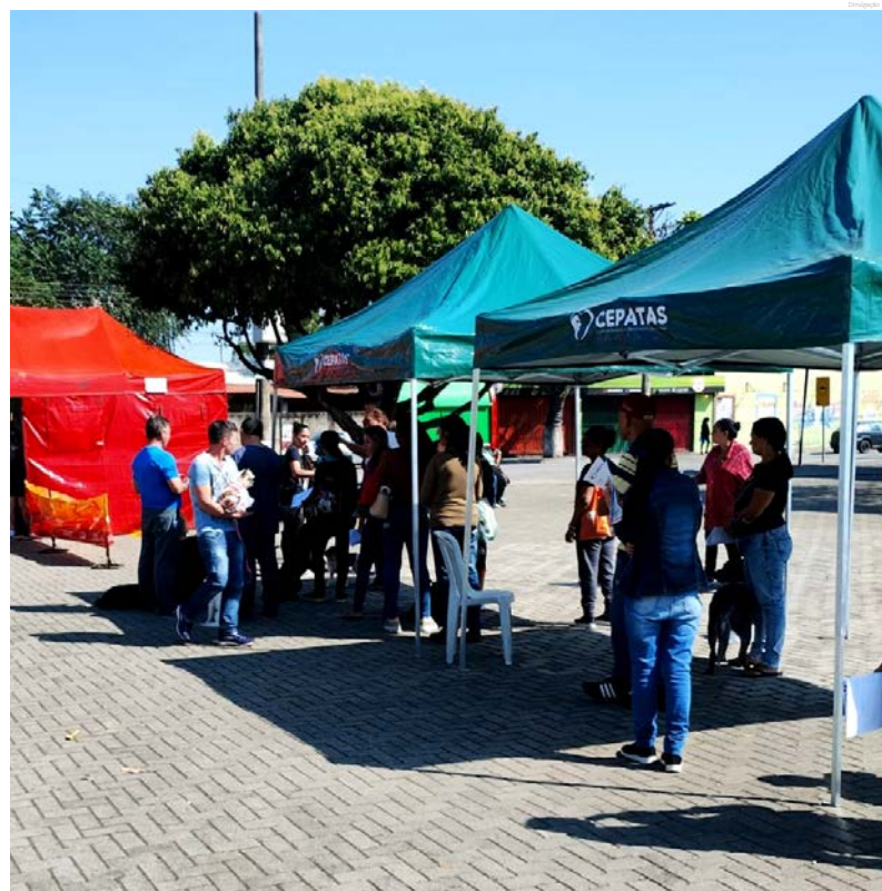
As castrações seguem até dia 22 de julho

No ano de 2023 foram castrados 3,5 mil animais em Pindamonhangaba e neste ano a previsão é castrar 4,3 mil animais até o fim de 2025.