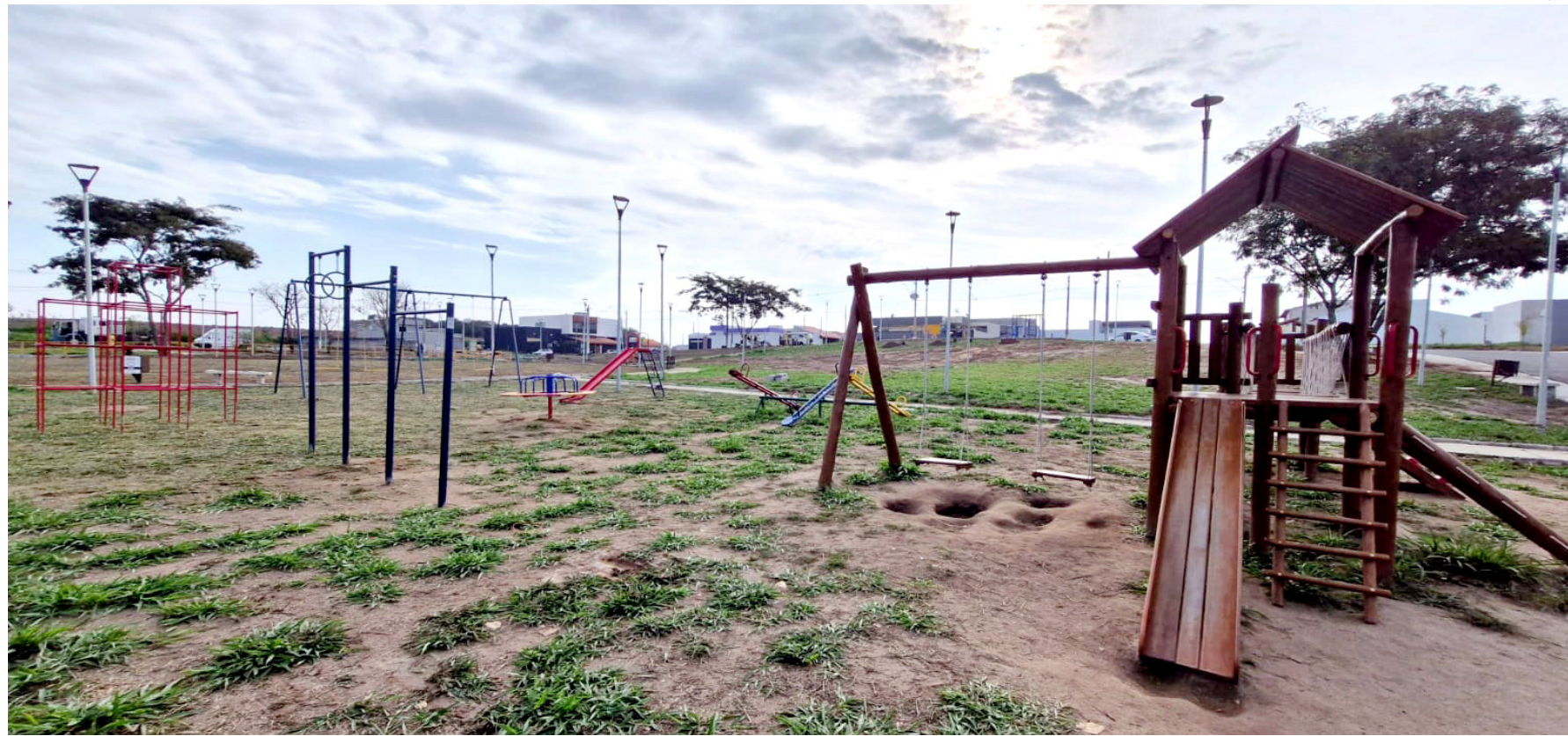
A praça será entregue nesta quarta-feira

Em 1951 foi membro fundador do Rotary Clube de Pindamonhangaba. No período de 1956 a 1959, foi Vereador em Pindamo-