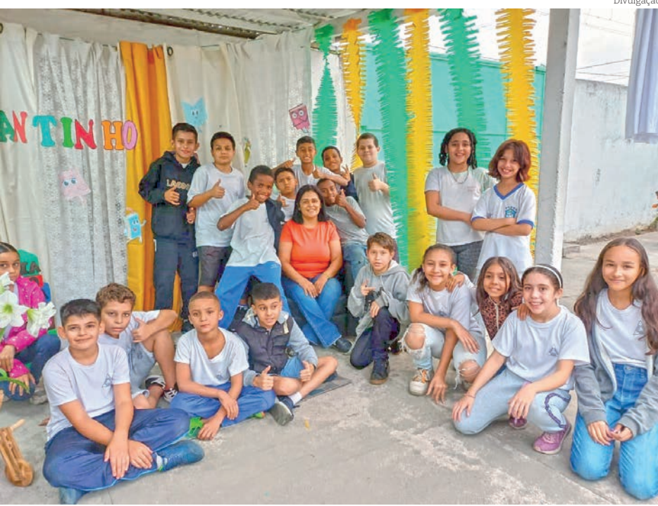
Cantinho da Leitura: um ambiente acolhedor para ler