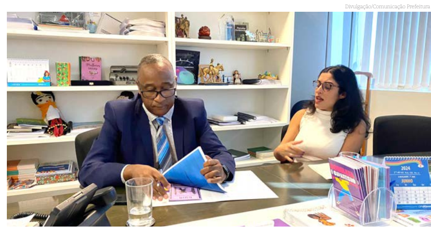
Pinda discute a adesão ao plano nacional 'Viver sem Limites'

O programa Incluir para Evoluir, implantado pela atual gestão municipal, já desenvolve diversas ações voltadas para a inclusão e melhoria da qualidade de vida das pessoas com deficiência na cidade. Com a possível inclusão no Viver Sem Limites, Pindamonhangaba terá a oportunidade de ampliar ainda mais suas iniciativas em quatro eixos fundamentais: Gestão e Participação Social, Enfrentamento