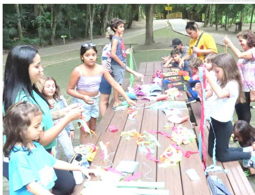
Cheias de energia, as crianças poderão brincar no Parque da Cidade e no Bosque da Princesa