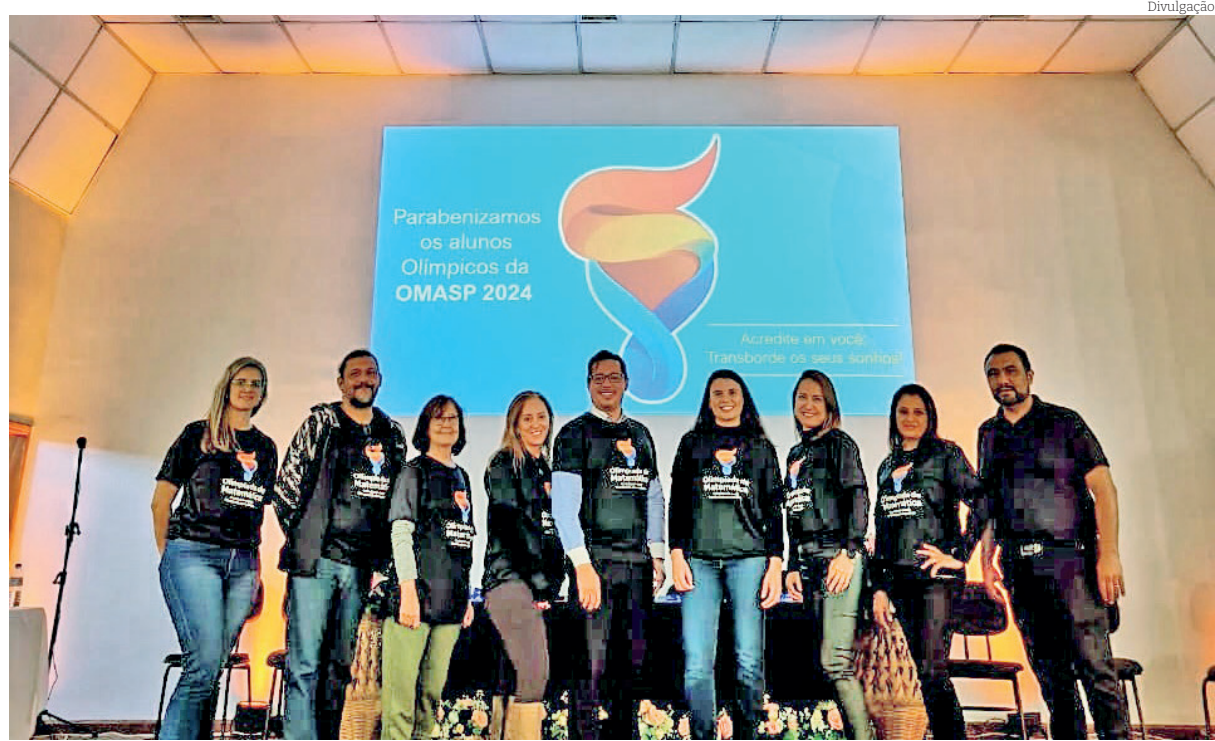
Equipe DER Pinda 2024: desenvolvendo os valores da escolas pública