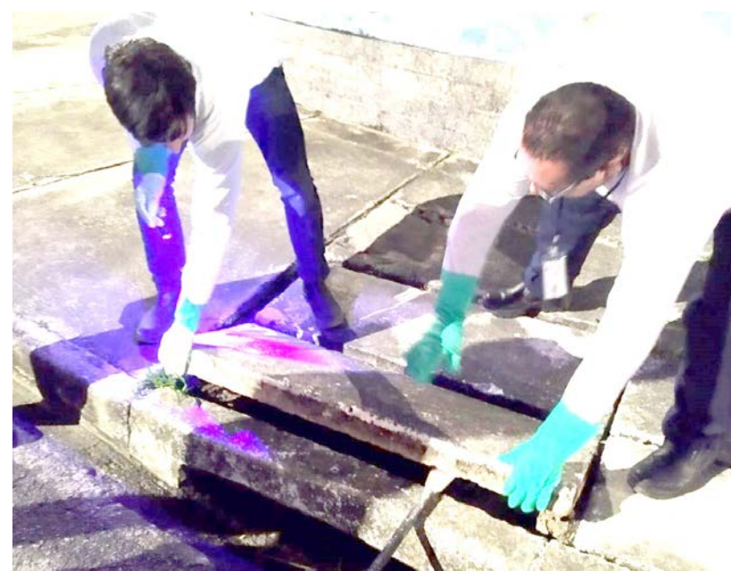
O objetivo das buscas noturnas é diminuir a população desses aracnídeos e alertar a população se defender

Reclamações sobre aparecimento de escorpiões devem ser feitas via 1 DOC ou E-ouve e Ouvidoria.