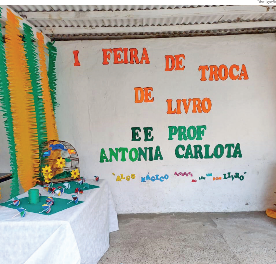
A I Feira de Troca de Livros aconteceu nos dias 25 e 26 de junho

E ainda o Cantinho da Leitura, que proporcionou fotos aos alunos num ambiente acolhedor.