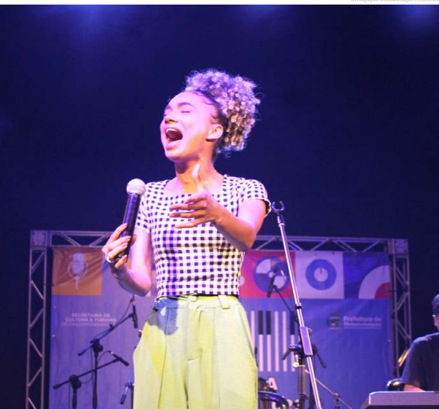
O festival vai abranger todos os gêneros musicais

A Prefeitura de Pindamonhangaba, por meio da Secretaria de Cultura e Turismo, anuncia a abertura das inscrições para o '11º Festival de Música da Juventude'. O evento, que busca incentivar a música entre os jovens, revelar novos talentos e promover o intercâmbio artístico-cultural, será realizado nos dias 31 de agosto e 1º de setembro, no Teatro Galpão.