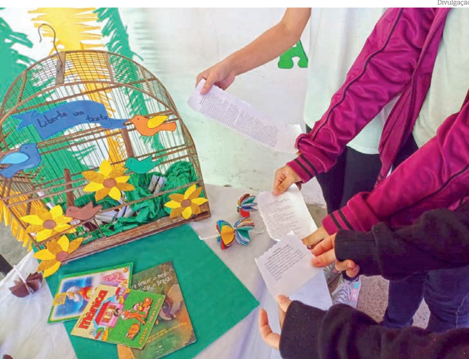
Alunos liberaram textos que estavam 'presos' na Gaiola Literária