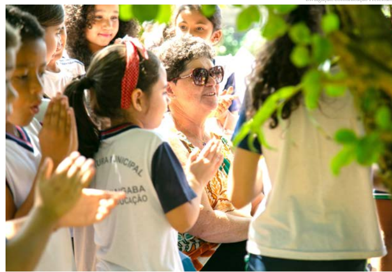
Mais um vídeo que aborda importantes ações socioambientais

O quinto e último vídeo das ações desenvolvidas pelos grupos de trabalho (GTs), na Formação Mov.Cicla 2023, foi lançado hoje nas redes sociais do programa e da Prefeitura Municipal de Pindamonhangaba.