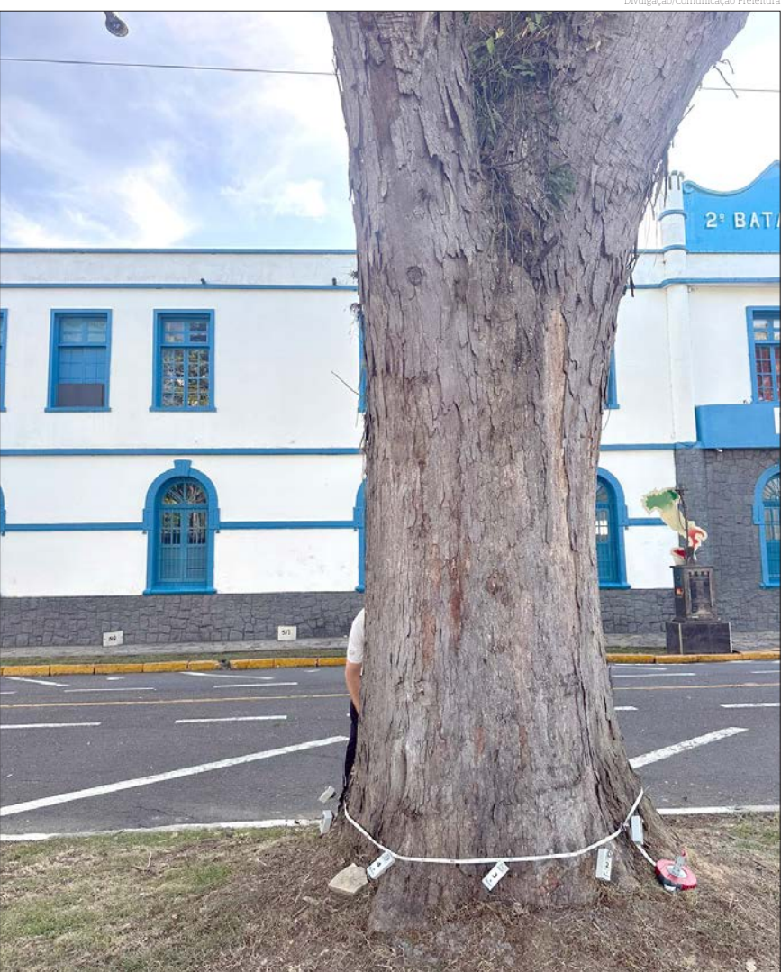
O trabalho identifica a sanidade das árvores, propondo ações para sua conservação

do realizado pela Secretaria de Obras e Planejamento em conjunto com a Secretaria de Habitação e tem como objetivo desapropriar parte da área para a instalação do viaduto da Via Estrutural.