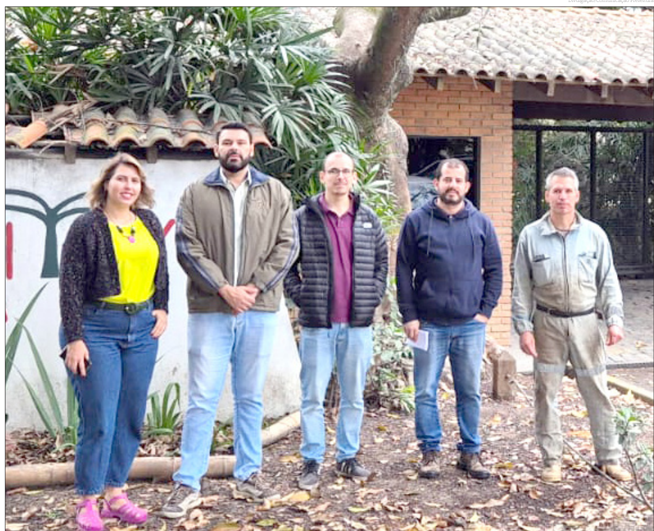
O trabalho da equipe tem como objetivo desapropriar parte da área para a instalação do viaduto da Via Estrutural