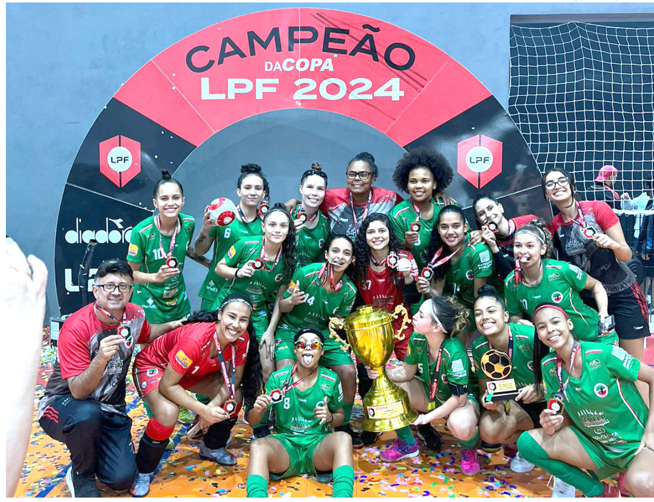
Com 35 gols marcados e um excelente desempenho, a equipe celebrou o novo título estadual

Após as comemorações, as atletas receberam alguns dias de folga antes de retomarem os treinamentos para os Jogos Regionais, que acontecerão no final do mês em São Sebastião.