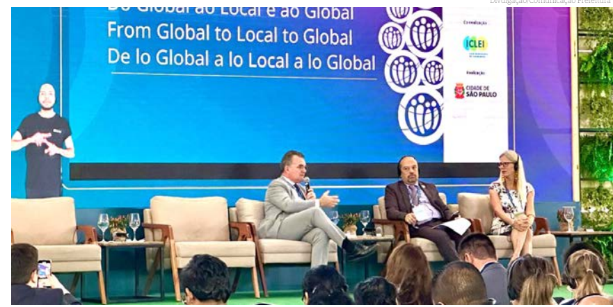
O congresso é uma oportunidade de interagir com outros modelos de governo

Por meio de plenárias de alto nível lideradas por personalida-