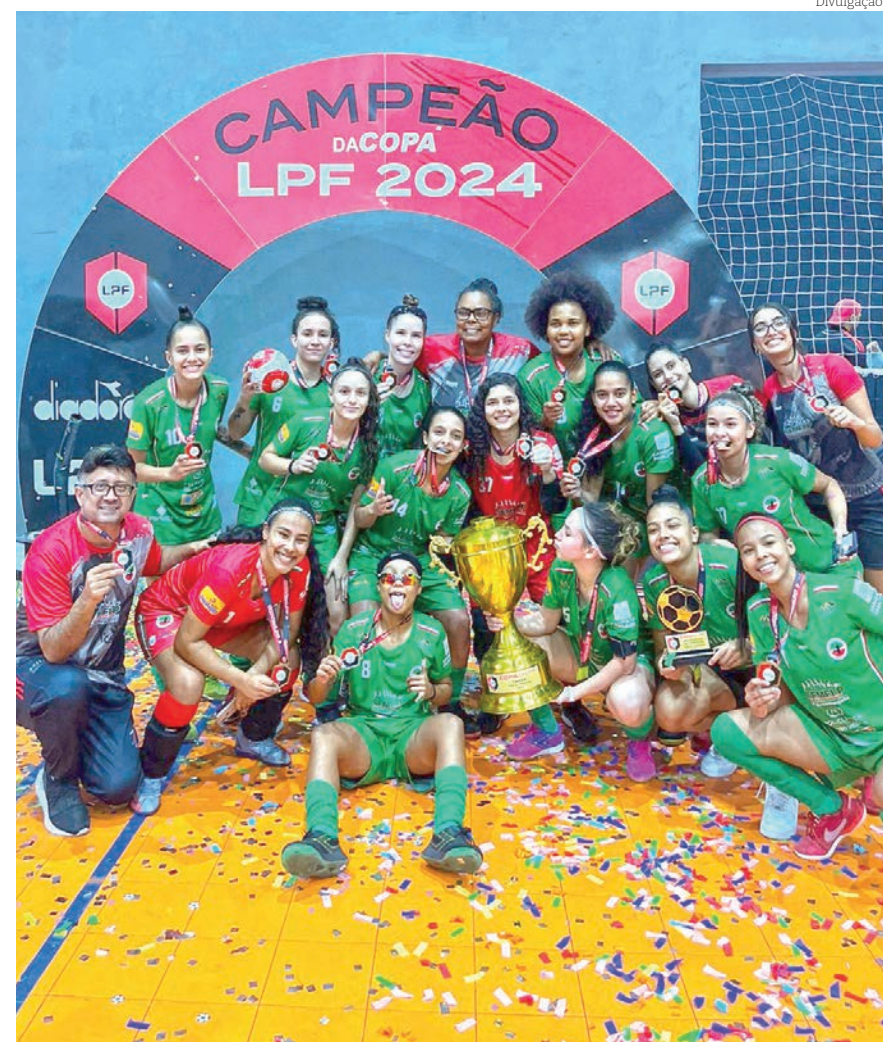
Título foi decidido na prorrogação com vitória de 2 a 1 para Pinda