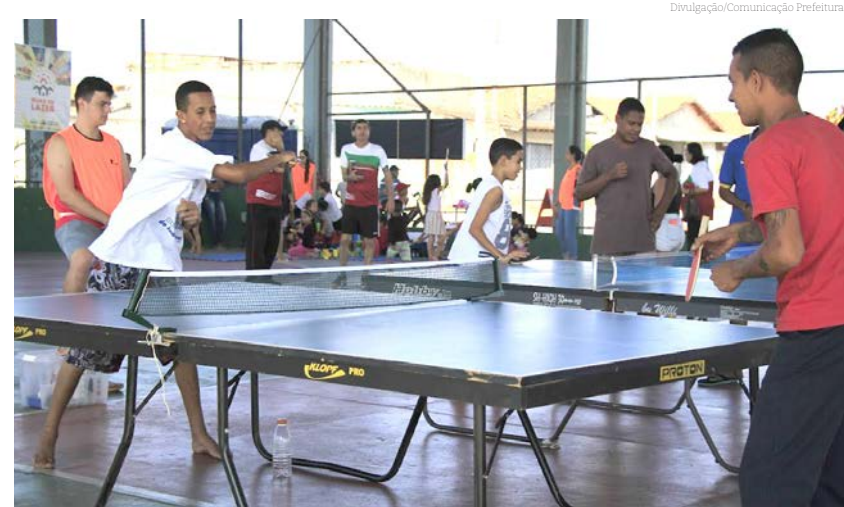
O evento promete um dia de muitas atividades divertidas para toda a família