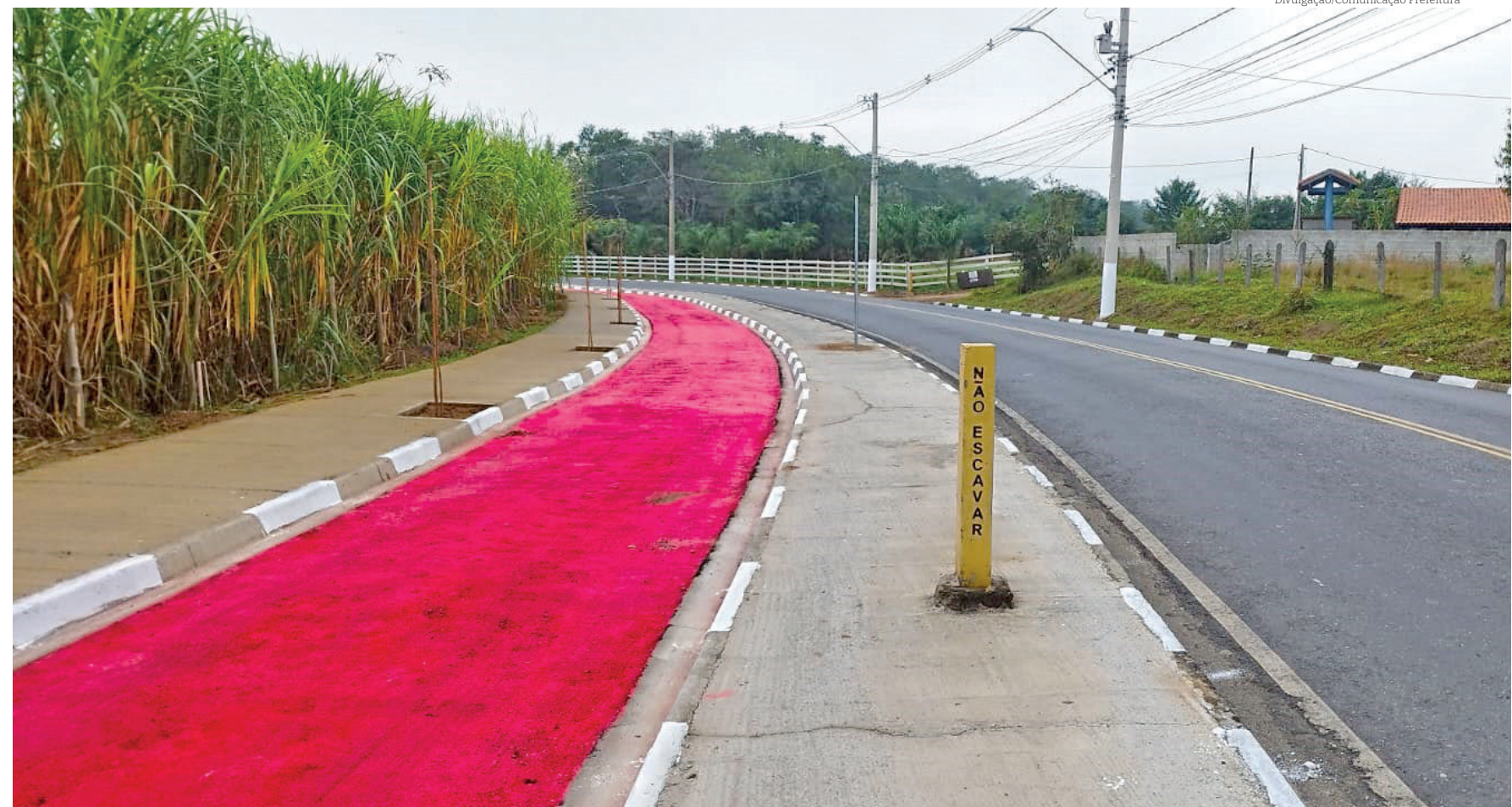
A ciclovía tem cerca de 1.500 metros de extensão por 2,5 metros de largura e está sinalizada e pintada de vermelho. Ela começa na região da serralheria do bairro Padre Rodolfo e vai até as proximidades com a Avenida Burity, no bairro do Feital