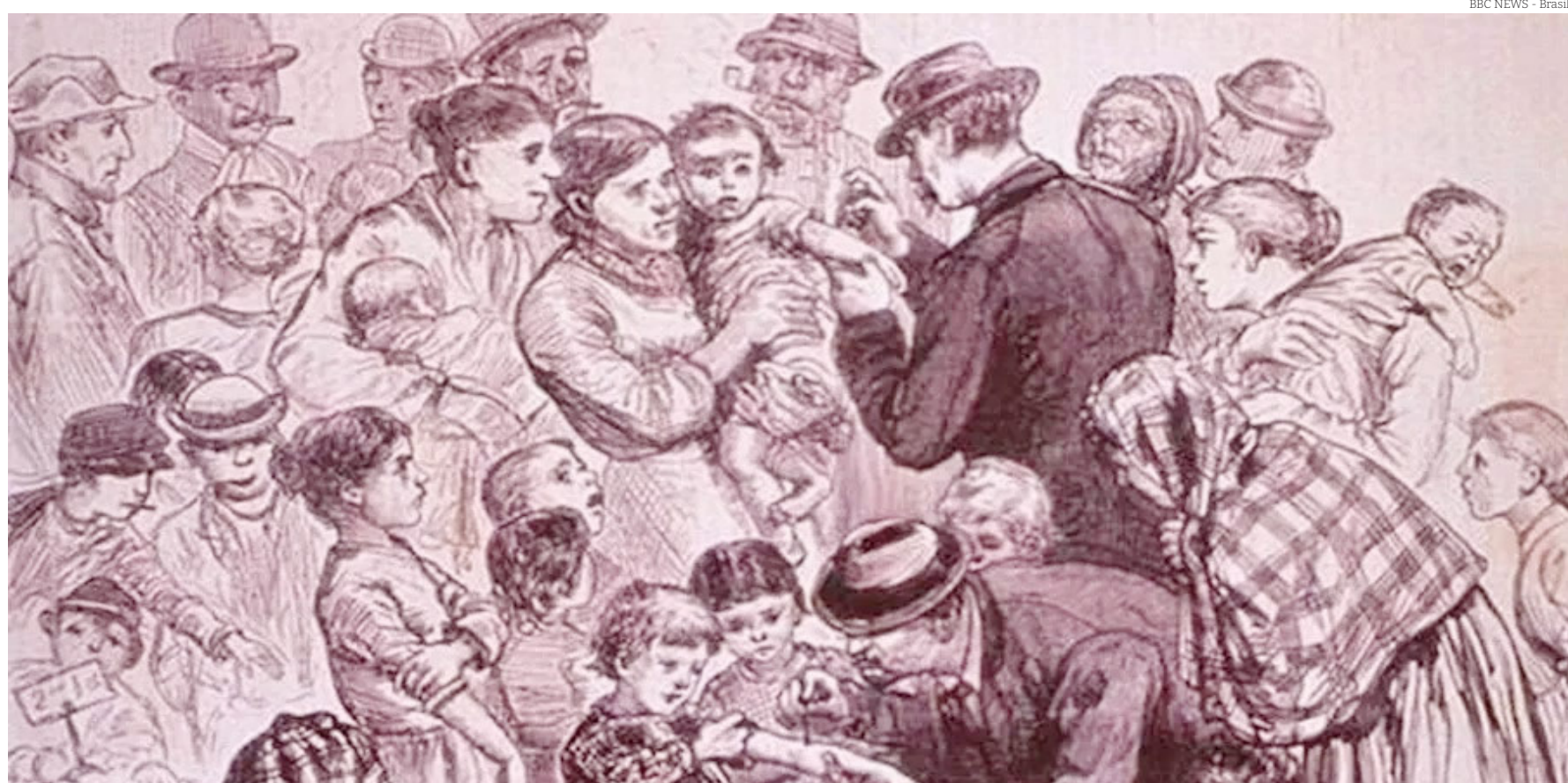
“A vacinação obrigatória nos acompanha há séculos, silenciosamente salvando vidas” (BBC NEWS – Brasil)