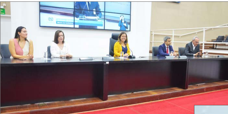
Ao lado, as autoridades e convidados na Mesa Diretora da sessão solene; na foto abaixo (à esquerda), o público que participou da solenidade comemorativa ao 'Dia Municipal de Combate às Drogas'