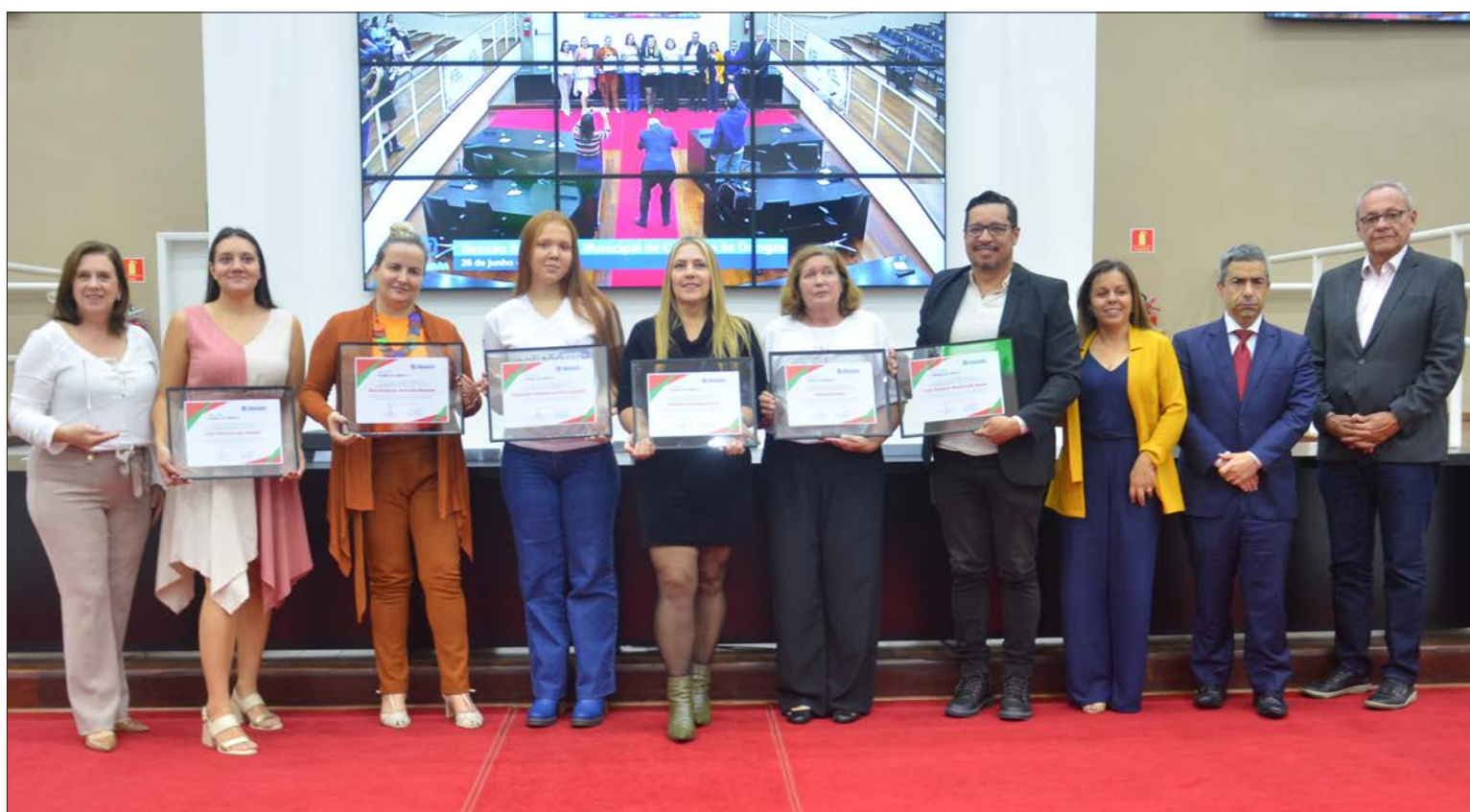
As personalidades homenageadas, a oradora oficial e as autoridades na Sessão Solene que lembrou o 'Dia Municipal de Combate às Drogas'