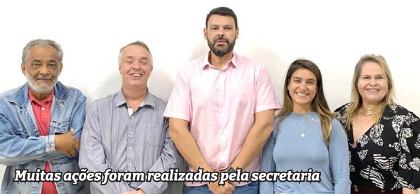
Muitas ações foram realizadas pela secretaria