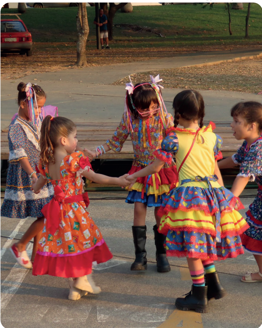
O projeto cria laços entre os pequenos

A Prefeitura de Pindamonhangaba, por meio da Secretaria de Esportes e Lazer, realizou no último sábado (29) a 2ª edição do Projeto 'Dançar nas Ruas', na Praça da Bíblia. Com a temática junina, o evento contou com a animada Quadrilha Estilizada "Vai Quem Quer", atraindo moradores de todas as idades para um dia de dança e diversão.