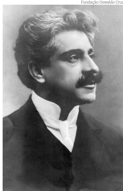
Fundação Oswaldo Cruz

Lembrava o jornal da passagem daquela mesma doença pelo município em 1903, quando