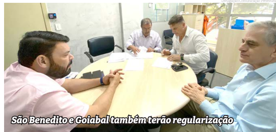
São Benedito e Goiabal também terão regularização