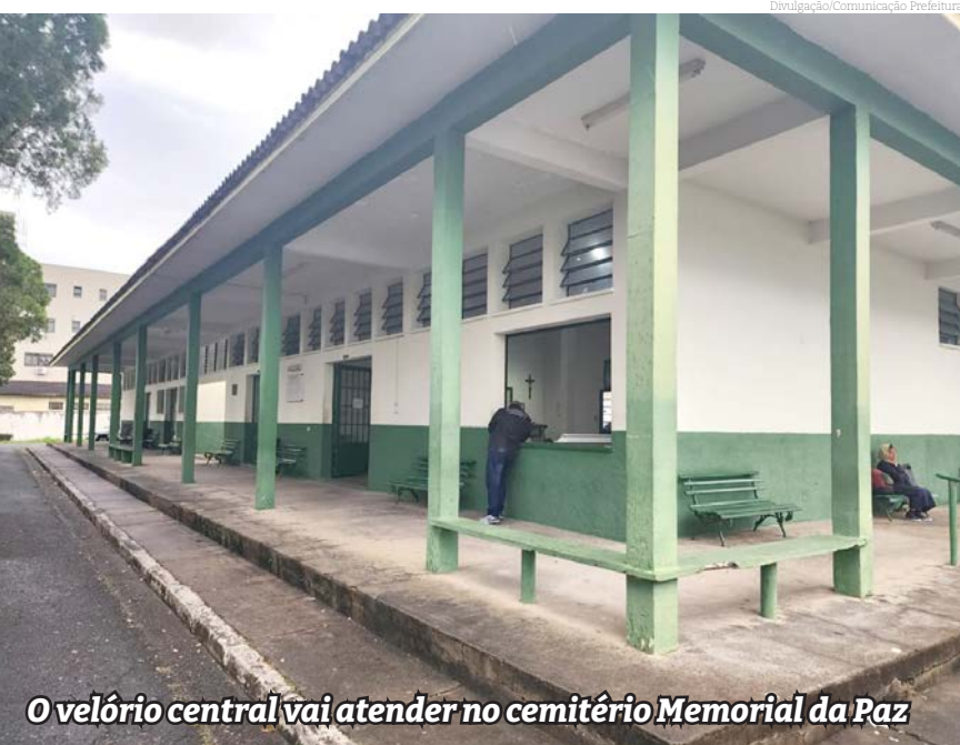
O velório central vai atender no cemitério Memorial da Paz

“Estamos entrando para realizar um trabalho de qualidade no Pronto-Socorro, atendendo as observações que o prefeito Dr. Isael nos recomendou de qualificar a equipe para um bom acolhimento e prestação de serviços, que é a nossa marca de trabalho por exemplo na UPA 24 horas em Jundiá, onde estamos atuando desde 2019 e em outras ações de gestão de saúde junto a outros governos”, explicou a gestora.