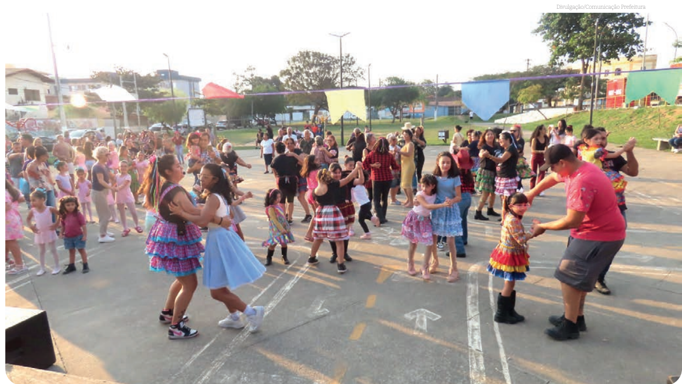
A dança promove o bem-estar e a integração comunitária

A Prefeitura reafirma seu compromisso com a promoção da saúde e do lazer para a população, proporcionando eventos que incentivam a prática de atividades físicas e fortalecem o senso de comunidade.