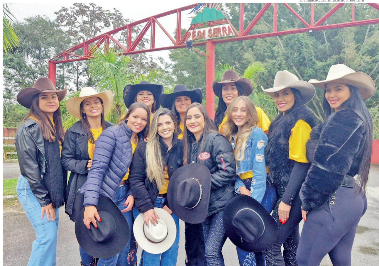
Como parte do City Tour, as candidatas fizeram uma especial no Hotel Fazenda Pé da Serra