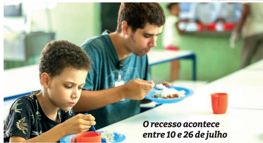
O recesso acontece entre 10 e 26 de julho

A Secretaria da Educação do Estado de São Paulo prorrogou até esta quarta-feira (3) o prazo para que familiares de estudantes de 3.534 escolas estaduais manifestem interesse em almoçar na escola durante as férias. Durante o recesso escolar, as unidades de ensino estarão abertas entre às 11h e 13h30 para oferecer refeições aos alunos e manter a oferta de comida balanceada durante o mês de julho.