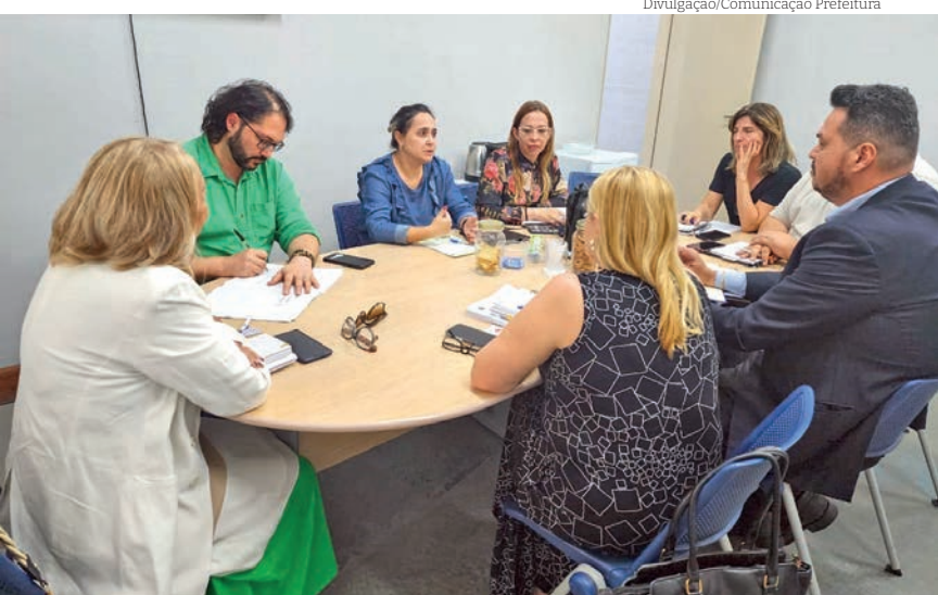
Gestão fica sob a responsabilidade da Fênix do Brasil Saúde

Novas vagas para estágio em 17 áreas de nível superior, além de ensino técnico e médio na Prefeitura