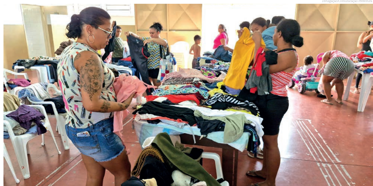
O 'Varal Solidário' atende famílias, promovendo solidariedade e apoio mútuo