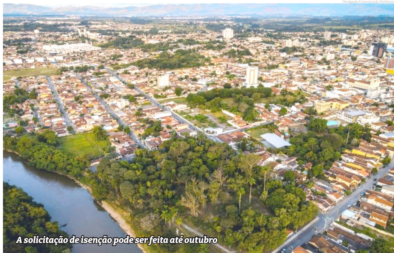
A solicitação de isenção pode ser feita até outubro

Todos os documentos devem ser digitalizados e encaminhados pela plataforma digital 1 Doc. O atendimento eletrônico pode ser acessado pelo endereço https://pindamonhangaba.1doc.com.br/atendimento ou baixando o aplicativo 1doc na Google Play para celulares Android ou Apple Store para celulares iPhone.