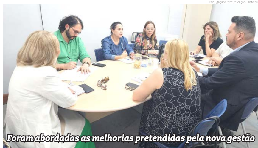
Foram abordadas as melhorias pretendidas pela nova gestão