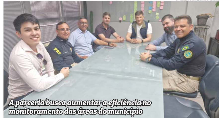
A parceria busca aumentar a eficiência no monitoramento das áreas do município

"Muitas cidades da nossa região também fizeram essa parceria, como São José dos Campos e Guaratinguetá, tornando o Vale do Paraíba uma região mais segura. Com essa nova ação, Pindamonhangaba, que já vinha trabalhando nessa área, agora pode aumentar suas informações e compartilhar com outras forças de segurança", afirmou o secretário adjunto de