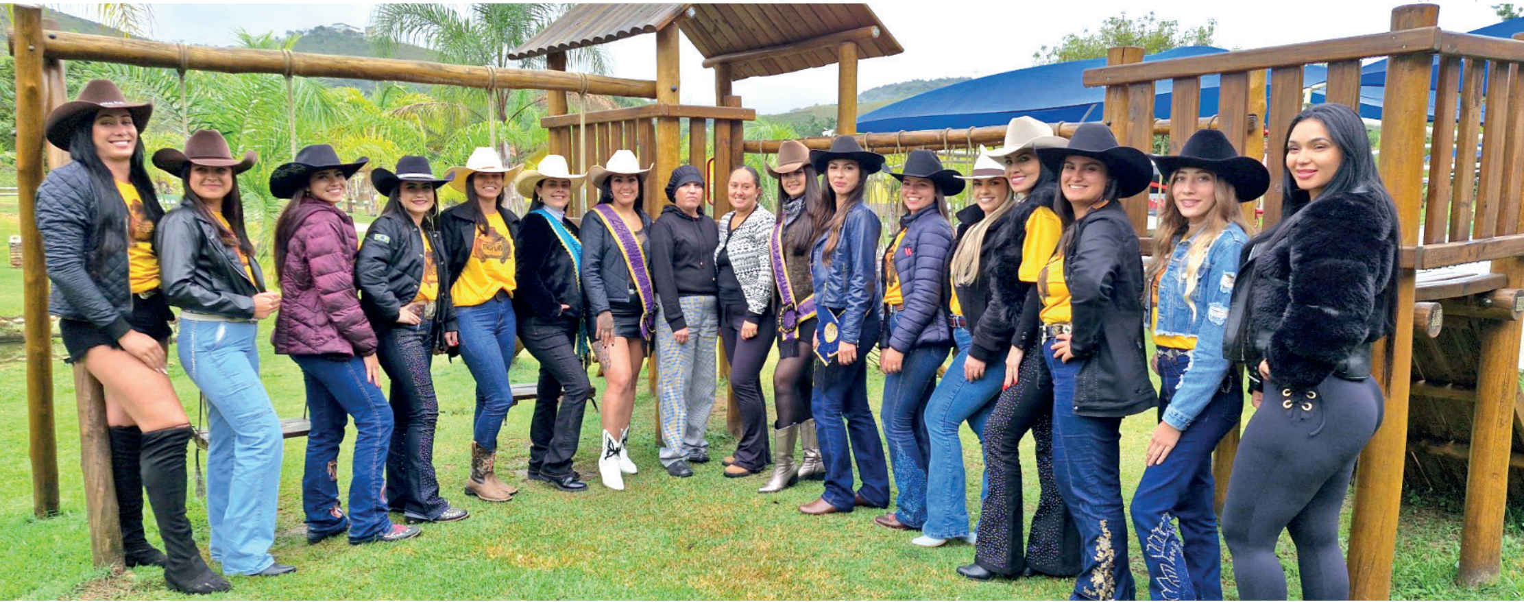
As finalistas puderam conhecer ainda mais a história da cidade participando do city tour

Na última segunda-feira (01), as finalistas do concurso Rainha do Tropeiro 2024 do Vale do Paraíba participaram do City Tour Histórico, Cultural e Gastronômico organizado pela Prefeitura de Pindamonhangaba. A iniciativa, coordenada pela Secretaria de Cultura e Turismo, por meio do Departamento de Turismo, teve como objetivo proporcionar às candidatas um dia de imersão na história e tradições locais.