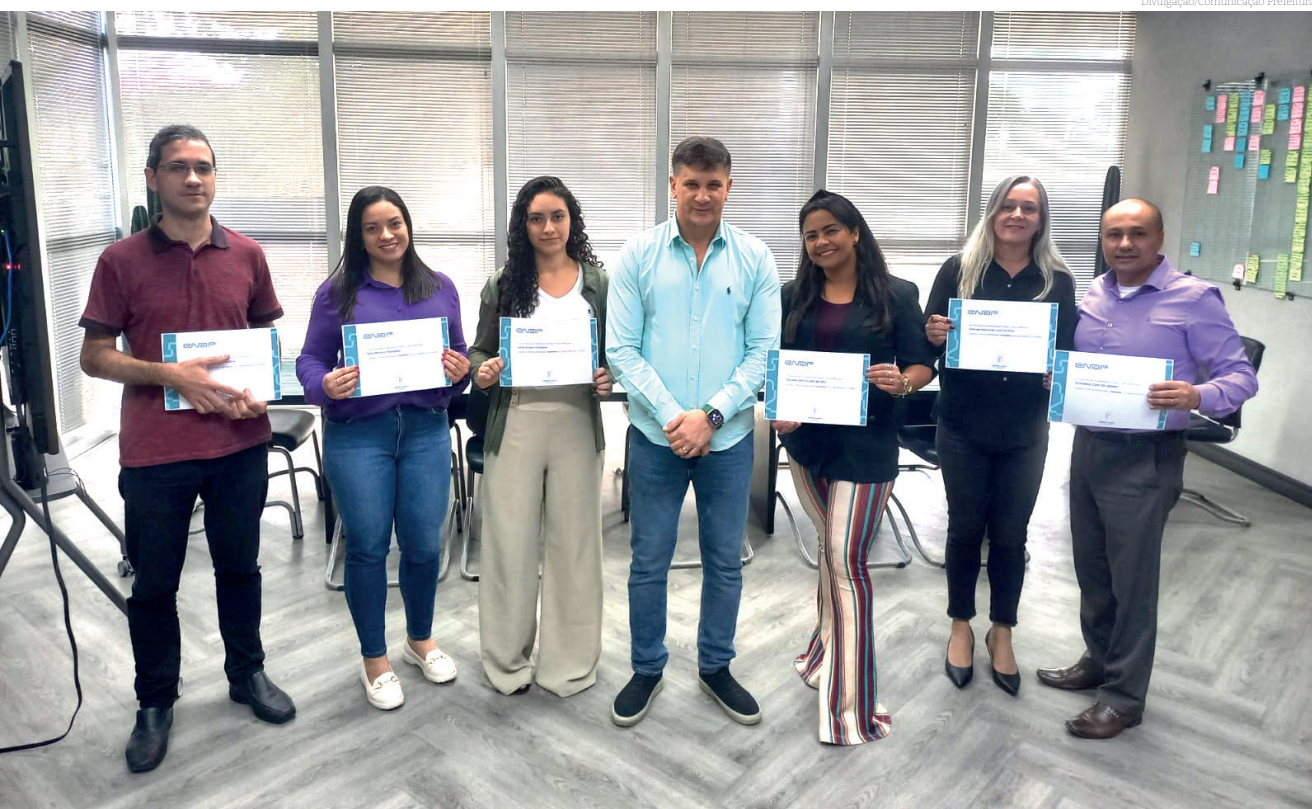
O curso buscou aprimorar habilidades na gestão da Ouvidoria