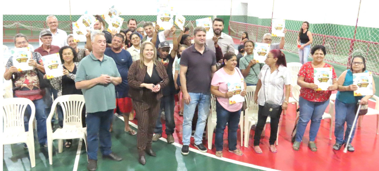
O contrato de regularização é a garantia e a proteção do imóvel