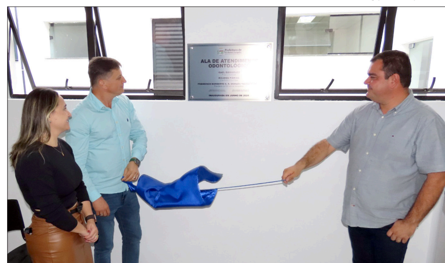
A nova ala vai ampliar o atendimento na região central da cidade