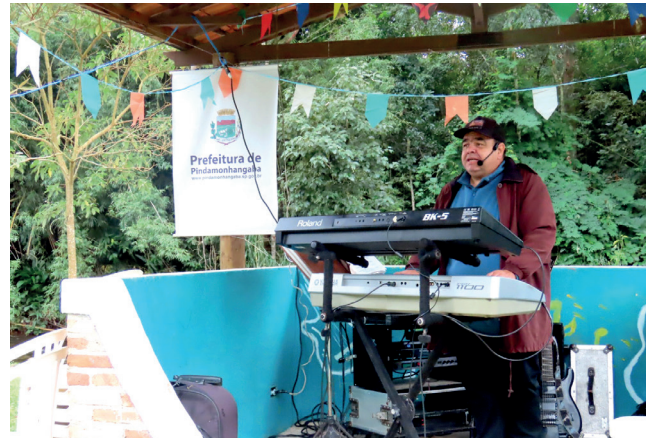
O formato atual do festival dá visibilidade a muitos estabelecimentos