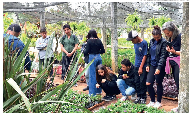
A doação de mudas - em um total de 20 por município - incentivou a importância do cultivo de árvores na redução dos impactos climáticos