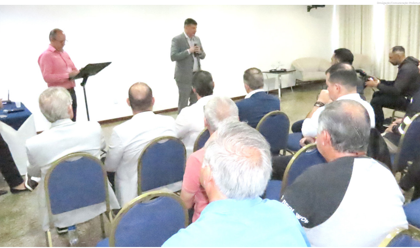
O encontro reuniu líderes empresariais para apresentar o plano de desenvolvimento regional

Sobre o Grupo Máximo: presente há 22 anos no Vale do Paraíba, o grupo conta com 8 lojas da bandeira Rede Máximo Supermercados nas cidades de São José dos Campos, Guaratinguetá, Lorena, Tremembé, Campos do Jordão e Ubatuba. Atualmente, a rede conta com 750 colaboradores diretos e estão programadas as inaugurações de duas unidades em 2024: a primeira unidade da bandeira Ache! Atacarejo em São José dos Campos e a segunda unidade em Guaratinguetá, ambas em formato de centros comerciais. Para 2025, já estão confirmadas a unidade de Caraguatuba e Pindamonhangaba (Moreira César).