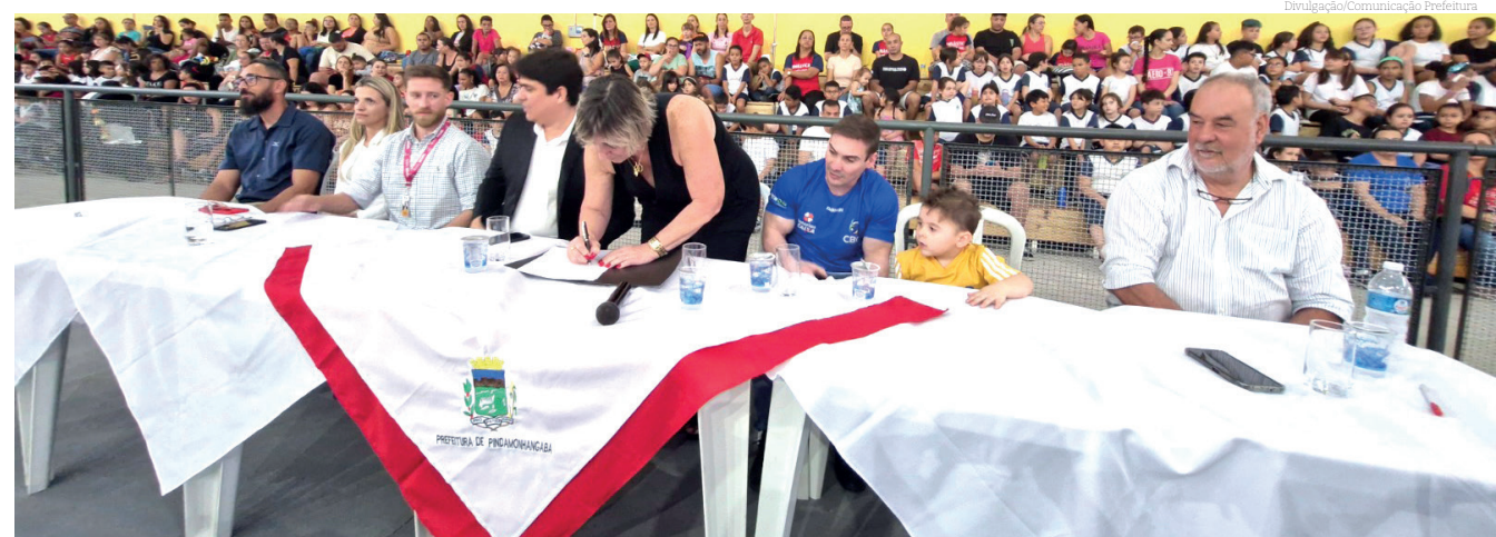
Para Arthur Zanetti, "é gratificante ver projetos como este, oferecendo estrutura e apoio às crianças"

Na última quinta-feira (27), Pindamonhangaba celebrou um marco esportivo com a oficialização do Centro de Excelência Loterias Caixa de Ginástica Artística. A cerimônia, realizada no Centro de Iniciação Esportiva (CIE), contou com a presença do secretário de Esportes e Lazer, Macedo Giudice, de representantes da Confederação Brasileira de Ginástica, da Federação Paulista de Ginástica e da Prefeitura de Pindamonhangaba, além do medalhista olímpico e campeão mundial, Arthur Zanetti.