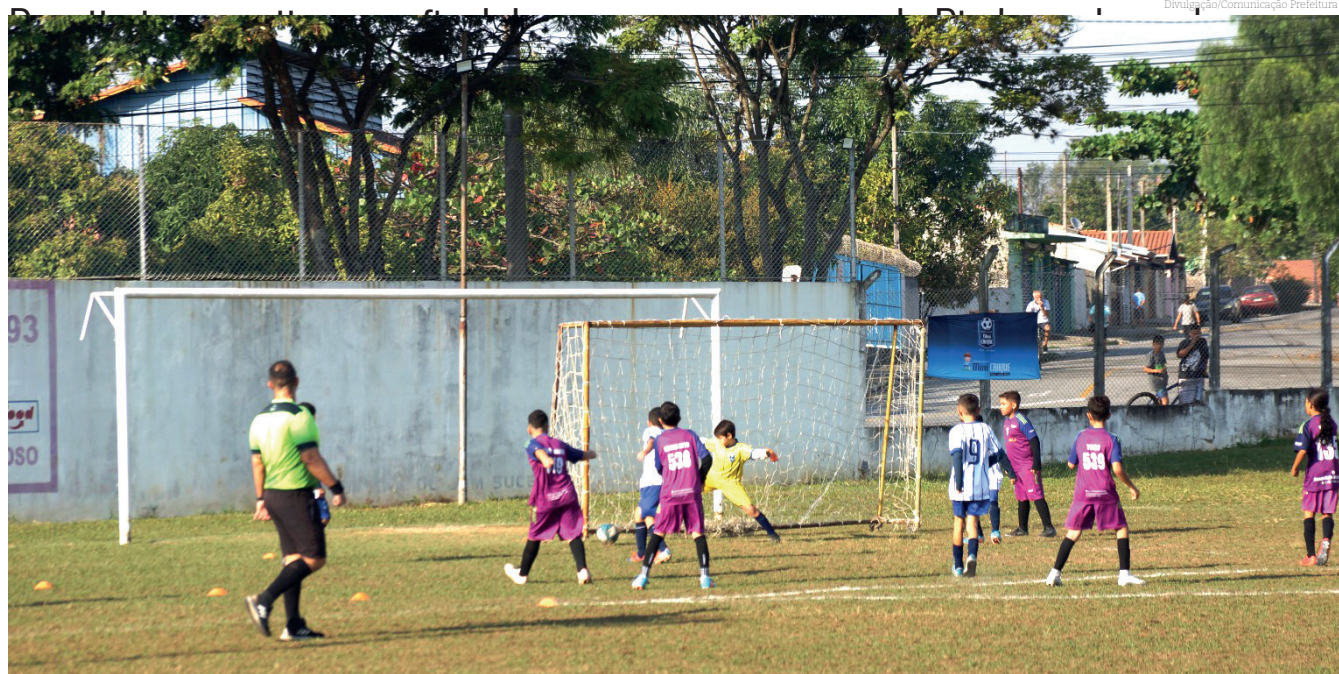
Muitos gols marcaram as partidas no fim de semana

Na Primeira Divisão - Colorado 2x1 Bandeirante, Cantareira 2x0 Tipês, Castolira 1x1 Araretama, Unidos do Araretama 1x6 Real Esperança, Cidade Jardim 0x2 MAEC, União Ressaca 1x0 Loko é Poko e Cidade Nova 2x3 Campo Alegre.