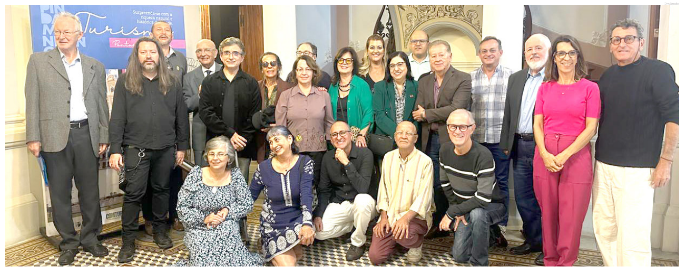
A noite foi repleta de informações e cultura

Em cada realização, reside um pedaço do nosso ser, uma prova de que somos capazes de moldar o mundo ao nosso redor. E assim, ao olharmos para nossas conquistas passadas, encontramos a força para continuar sonhando, realizando e iluminando o céu com novas estrelas.