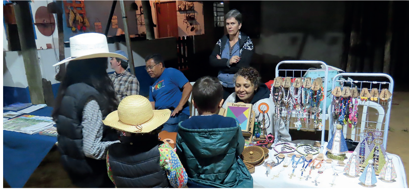
O festival vem se consolidando como o maior festival da cidade