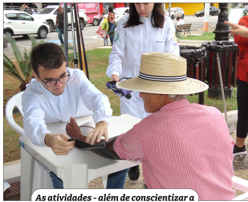
As atividades - além de conscientizar a população sobre o trabalho do CRAVI - promoveram saúde, lazer e bem-estar aos participantes

Com o objetivo de combater e prevenir todos os tipos de