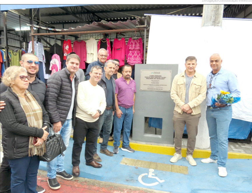
O local vai abrigar os comerciantes para garantir novas vendas