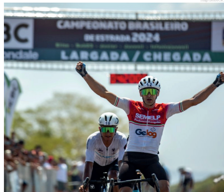
O título foi comemorado pelos atletas e comissão técnica

A equipe de Pindamonhangaba faz uma pequena pausa para descanso e então volta suas atenções para os Jogos Regionais do Interior que serão realizados este ano em São Sebastião, no Litoral Norte.