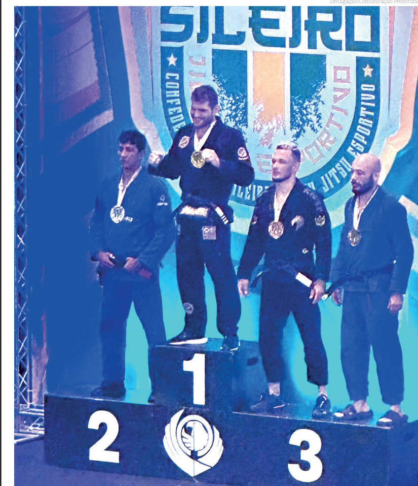
Pindense agradeceu todo o apoio na conquista do bronze

"Sou grato a Deus, a minha família, a minha equipe Almeida JJ, aos meus alunos, a Secretaria de Esportes de Pinda e a todos que me apoiaram. Desta vez não trouxe o ouro, mas em dezembro estarei novamente nos tratamos em busca de conquistar o Campeonato Mundial de Jiu-Jitsu da categoria", disse o atleta.