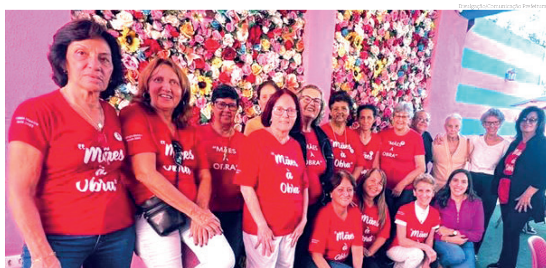
O grupo está pedindo a doação de lãs para produzir mais peças para a Campanha do Agasalho

Para toda essa produção o grupo está pedindo à comunidade que doe novelos de lã, que podem ser deixados no Colégio Mestre, à rua Dr Gustavo de Godoy, número 306, no centro.