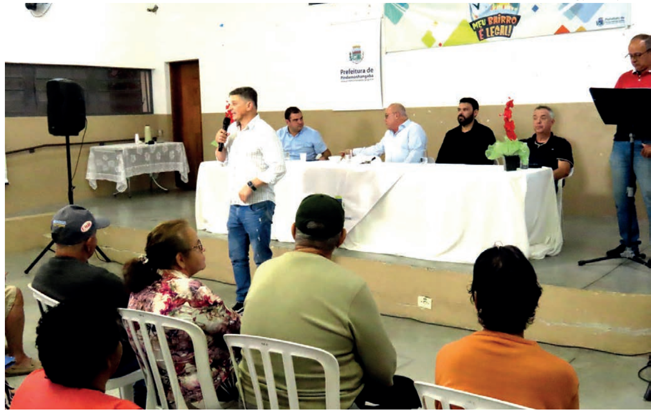
O contrato de regularização para escrituras é a garantia e a proteção do imóvel, trazendo legitimidade de titularidade