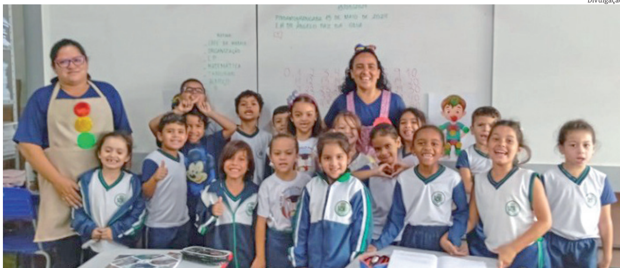
Estudantes da 'Dr. Ângelo Paz da Silva' assistiram a palestras de agentes comunitárias sobre o assunto

As profissionais de educação da escola destacaram que, por meio desta parceria entre a Saúde e a Educação, tem sido possível notar mudanças positivas no cotidiano das famílias, transformando o bairro numa sociedade melhor para as crianças.