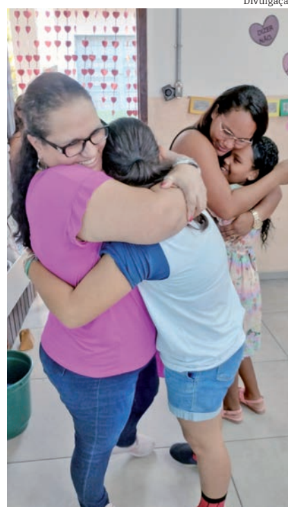
Emoção e alegria marcaram a comemoração da data na escola

Texto produzido coletivamente pelos estudantes do 5º ano B