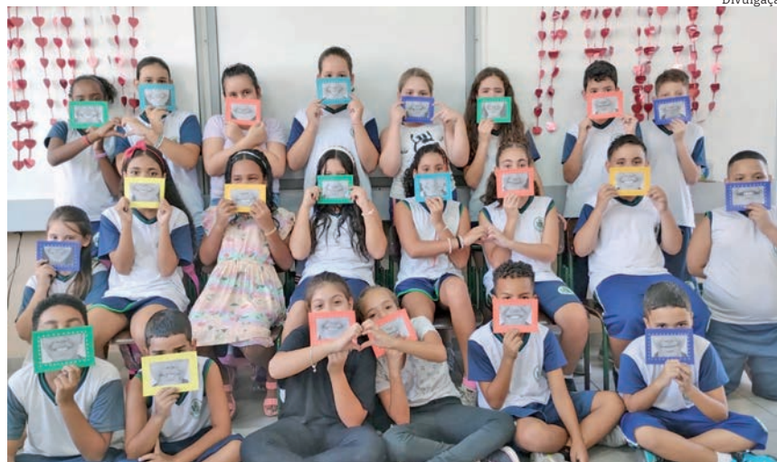
Estudantes da Padre Mário Bonotti receberam as mães com sorrisos