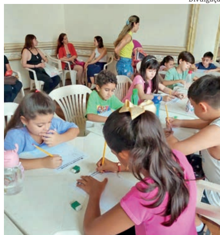
Crianças de outras cidades participaram das oficinas de cartum, além de Pindamonhangaba

O Museu Histórico recebe 6ª edição de Salão de Humor de Pindamonhangaba que fica no local até o dia 2 de junho, prometendo encantar e provocar reflexões através de charges e caricaturas. O objetivo principal deste projeto é prestigiar e dar visibilidade aos talentos do humor gráfico, destacando tanto o humor leve e descontraído quanto a crítica social afiada que essas obras podem carregar.