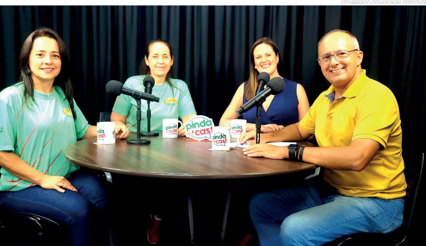
O podcast fala sobre a importância da atividade esportiva para a melhor idade