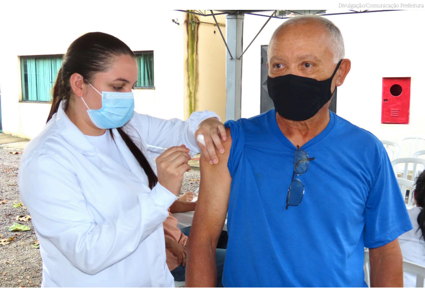
Uma nova vacina começa a ser aplicada hoje

A Secretaria de Saúde de Pindamonhangaba vai iniciar a imunização com a monovalente XBB contra Covid-19 na quarta-feira (29) em todas as salas de vacinação do município.