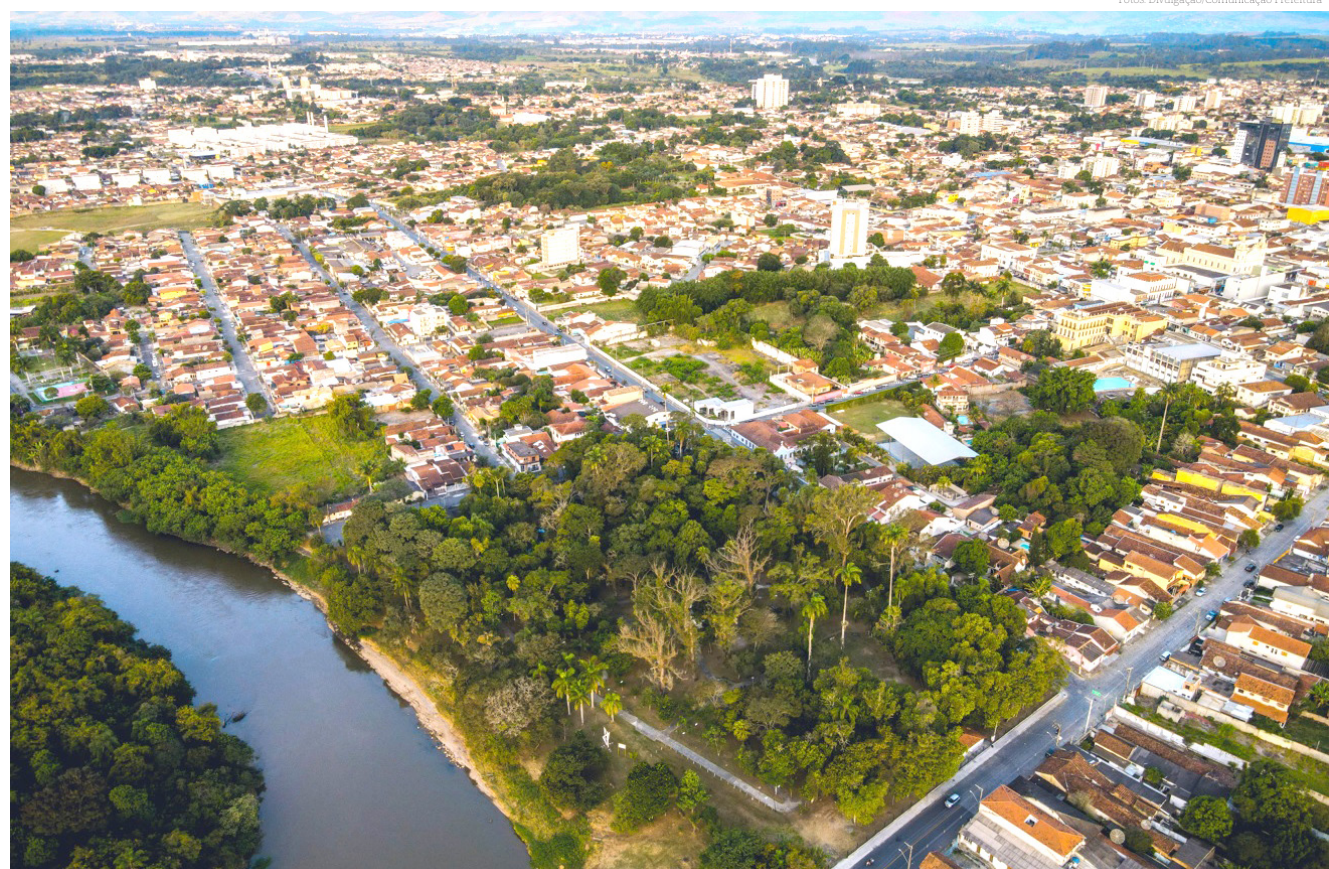
A conferência terá palestras e debates de questões para o desenvolvimento urbano

Será um dia de palestras e debates de questões fundamentais do desenvolvimento urbano divididos em 05 Eixos Temáticos: Urbanismo e Habitação, Infraestrutura e Mobilidade, Meio Ambiente e Mudanças Climáticas, Cidades Inteligentes e Governança e Participação Social, para juntos elencarmos soluções e propostas que auxiliem na construção de cidades inclusivas, democráticas, sustentáveis e com justiça social. Neste dia, também, será feita a eleição dos Delegados e ou Delegadas que representarão o município na Conferência Estadual.