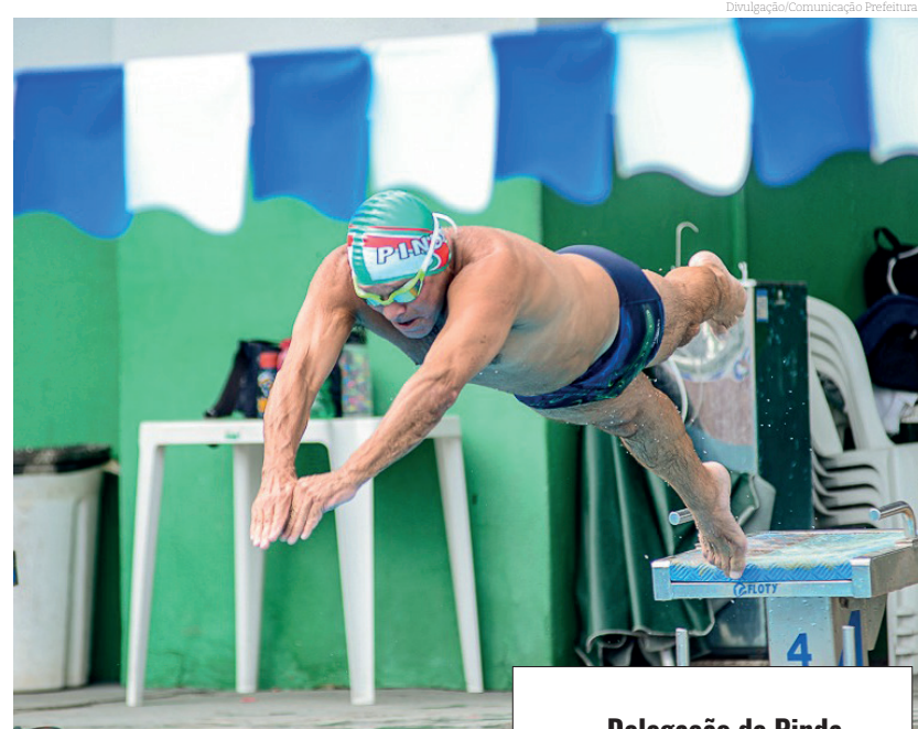
Delegação de Pinda

Quem quiser mais informações ou conferir a programação, basta acessar o site oficial dos Jogos www.pindamonhangaba.sp.gov.br/jomipinda2024 .