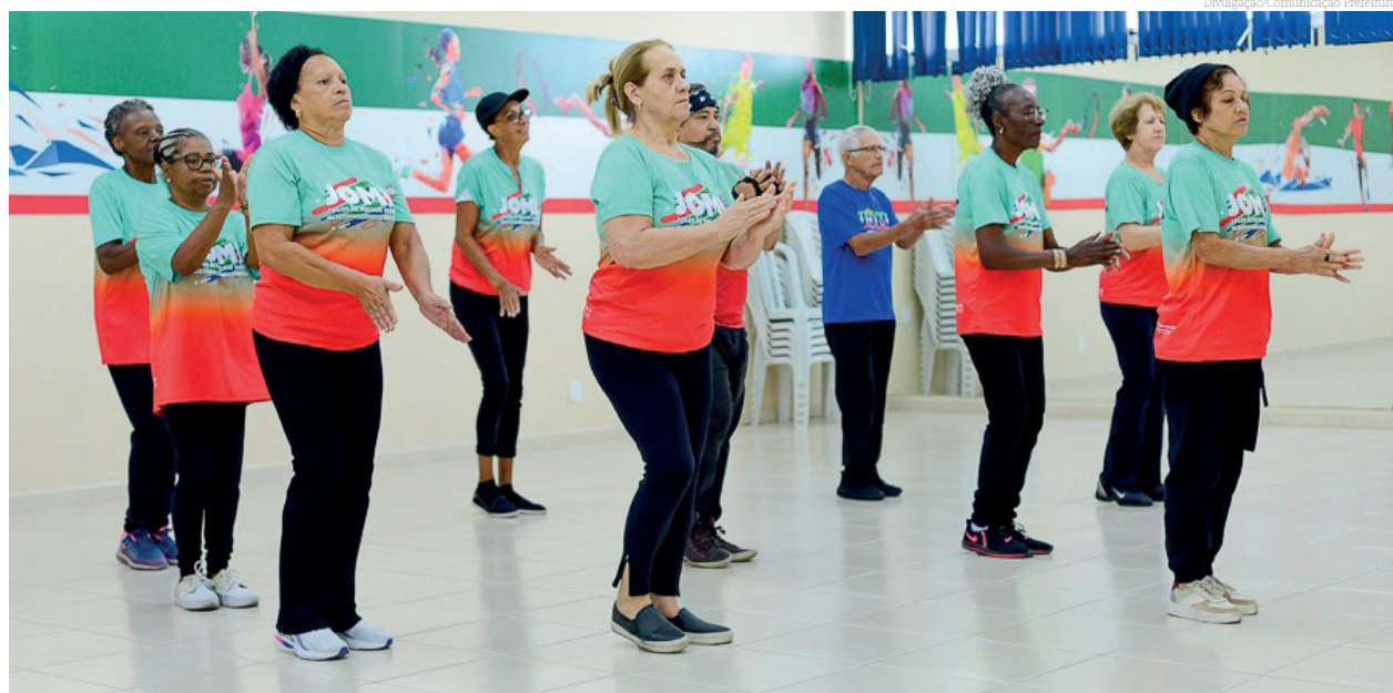
A delegação de Pinda promete muita animação e um ótimo desempenho durante os JOMI

A abertura da 26ª edição dos JOMI (Jogos da Melhor Idade) vai ocorrer na quinta-feira (30), às 18 horas, no ginásio da Ferroviária. Pindamonhangaba será sede da competição entre os dias 29 de maio e 9 de junho e vai receber cerca de 2 mil atletas da melhor idade de 38 cidades da 2ª Região Esportiva do Estado de São Paulo, além dos competidores locais.