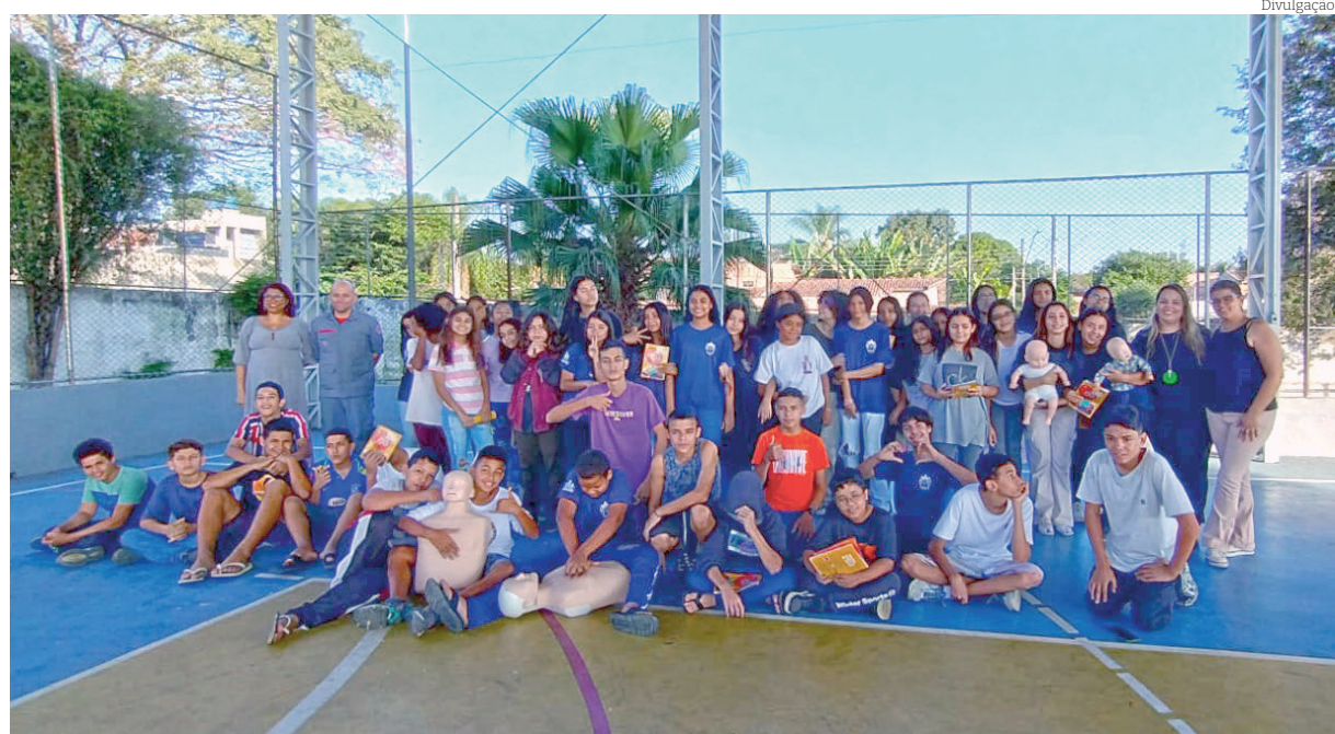
Estudantes dos 8º e 9º anos do Ensino fundamental receberam quatro aulas