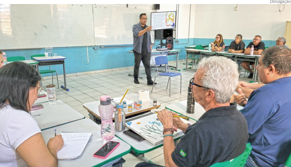
Evento tratou de questões ligadas à formação emocional do professor

O exercício reflexivo levou os professores a pensarem sobre o ponto inicial da jornada pedagógica, e a partir disso refletir sobre as marcas que são deixadas na vida das pessoas e de nossos alunos. A prática, teve como objetivo repensar nossas responsabilidades como educadores e reforçar a importância deste profissional na formação dos nossos alunos. Marcas positivas que auxiliam na formação do indivíduo corresponsáveis de sua história.