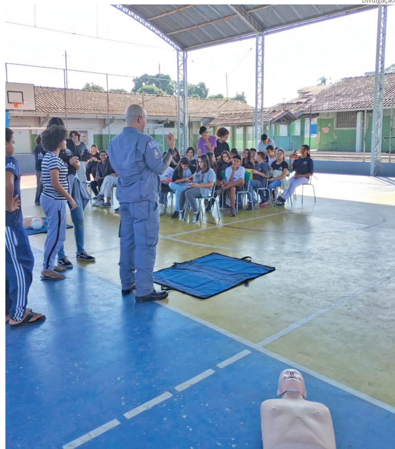
Alunos aprenderam diversos procedimentos técnicos

A importância dessas ações nas escolas, está em