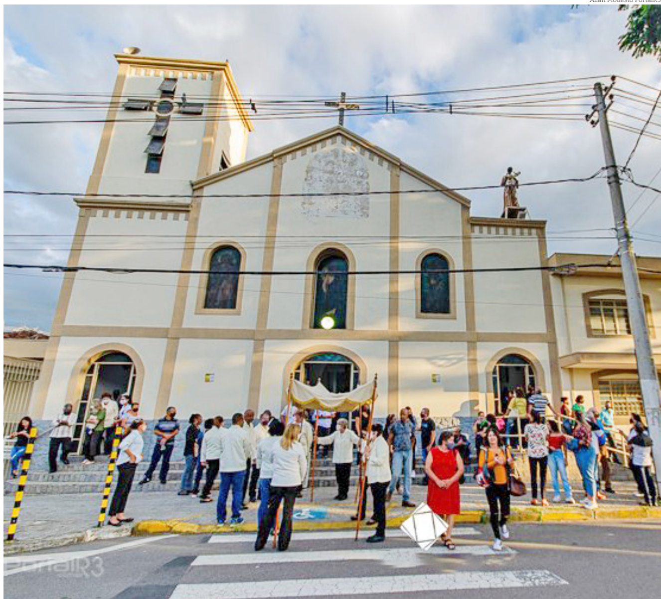
Aspecto atual da igreja em um momento festivo a São Benedito

2. Oggi non c'e segatura... (Hoje não tem serragem)