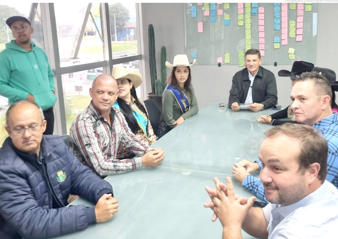
As expectativas para o evento são as melhores para comemorar o aniversário da cidade