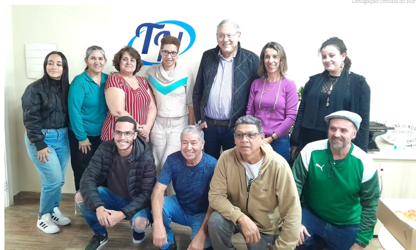
O encontro com o jornalista Milton Neves foi muito agradável para a equipe da Tribuna do Norte

Ele ainda concedeu uma rápida entrevista falando de seu relacionamento com João do Pulo, sua admiração pelo atleta que foi nomeado embaixador de Pin-