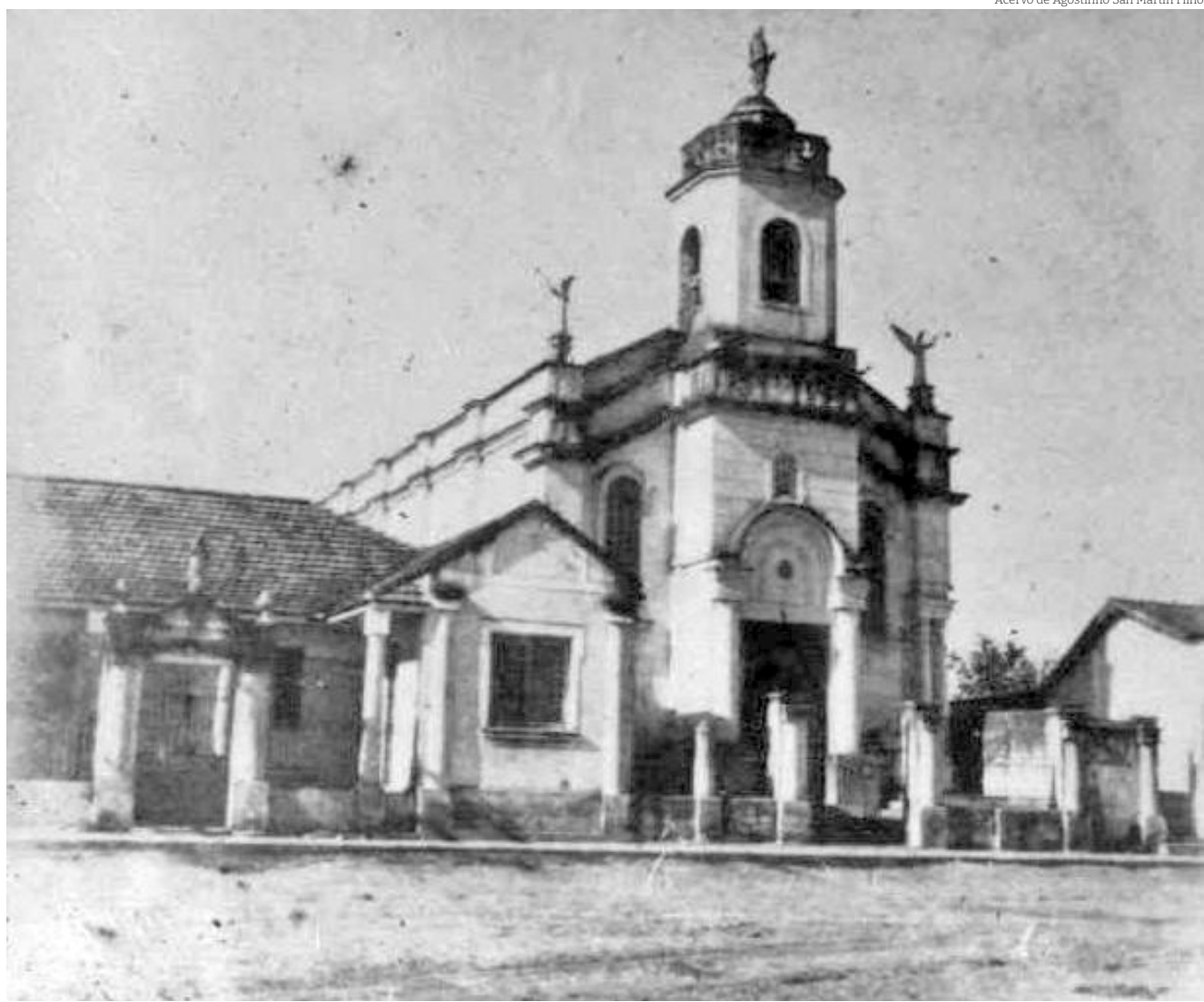
A igreja nos anos 50, quando ainda guardava os traços de sua arquitetura original

Desde 1960 a denominação “Largo Treze de Maio” foi trocada pela de “Praça Dr. Emílio Ribas”, assim passando a ser identificada oficialmente a tradicional “Praça São Benedito”.