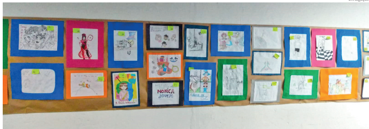
Resultado da experiência dos alunos com o concurso de desenho literário

A partir do mês de junho pretende-se levar as ações para outras unidades escolares da diretoria de ensino, para que essas possam desenvolver diversas atividades que levem os estudantes a perceber a existência do risco, analisar a situação e compreender que podem adotar práticas específicas para enfrentá-los e assim contribuir com a resiliência local.