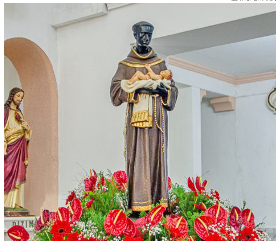
Imagem de São Benedito no interior de sua igreja