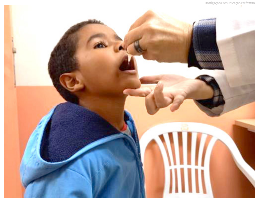
A vacinação é a única forma de prevenção da doença

A poliomielite (paralisia infantil) é uma doença contagiosa aguda causada por vírus que