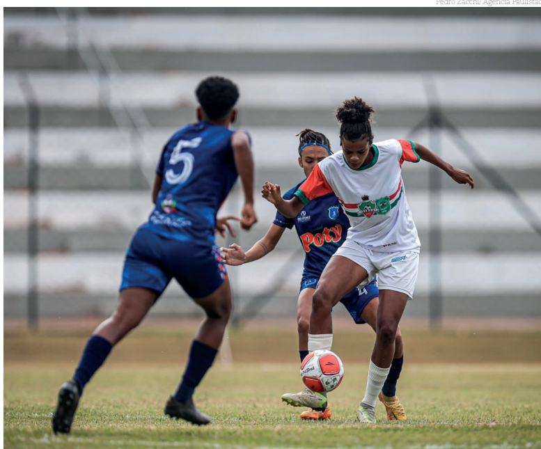
Pinda Ferroviária conquista seu primeiro ponto no campeonato