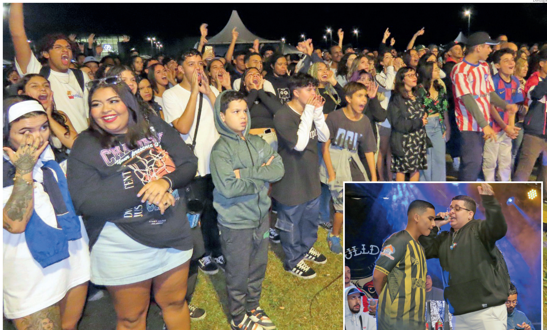
Encontro reuniu cerca de 30 mil pessoas entre sexta e sábado, com shows de DJ KLJay, do Racionais MCs e outras bandas, além de grafite, tatoo, exposição de carros e motos customizados e sorteio