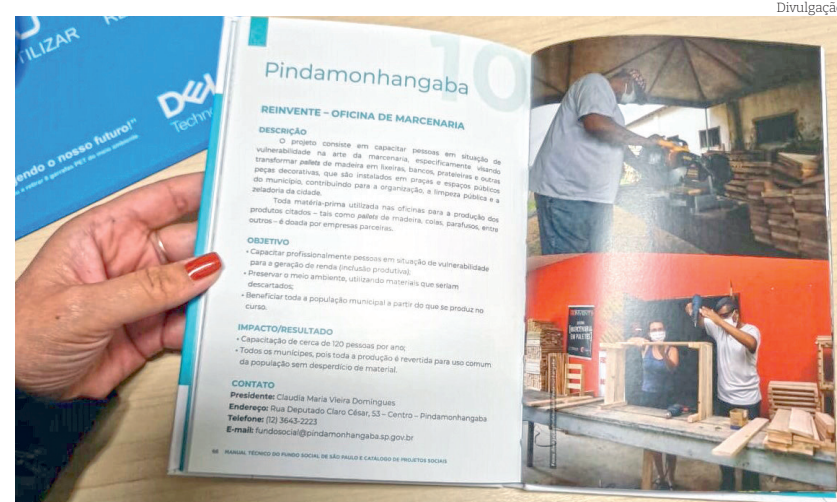
Livro é uma compilação de iniciativas sociais de sucesso