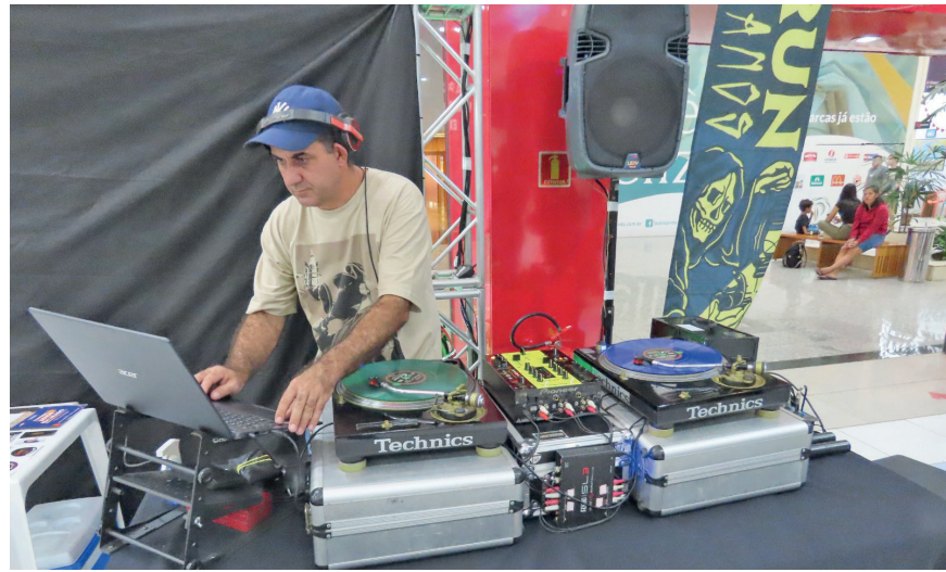
Músicos tocaram para um público de cerca de 30 mil pessoas

Livros. A iniciativa teve o apoio da equipe da biblioteca e vai entregar as peças arrecadadas ao Fundo Social de Solidariedade.