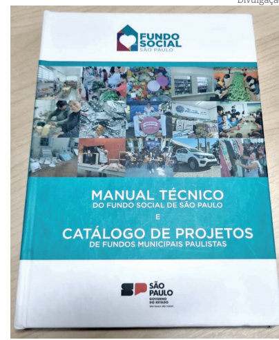
Pinda é um dos 15 municípios que integram o catálogo

Ao longo do primeiro semestre de 2023, o Fundo Social do Estado de São Paulo realizou 16 eventos em todas as regiões paulistas, onde conheceu os projetos desenvolvidos pelos fundos sociais dos municípios, ações eficazes que fomentam o desenvolvimento econômico e