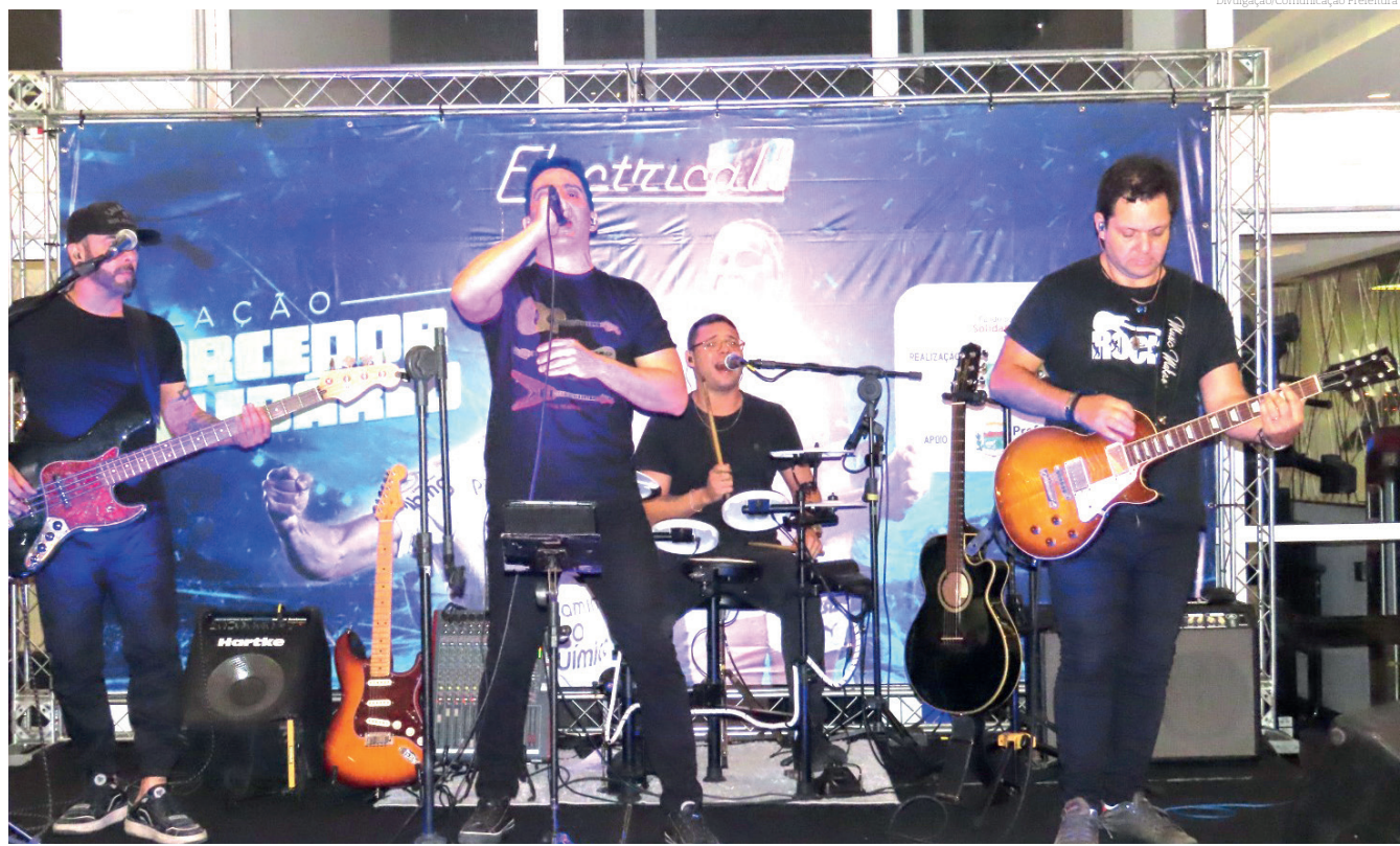
Campanha visa arrecadar doações para famílias em fase de vulnerabilidade na cidade e também para o Rio Grande do Sul

A sede do Fundo Social de Solidariedade fica na rua Deputado Claro Cesar, 53, centro, ao lado do Palacete 10 de Julho.