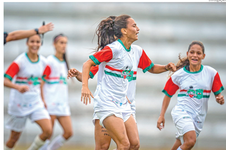
Pinda Ferroviária empatou em 1x1 com o Realidade Jovem