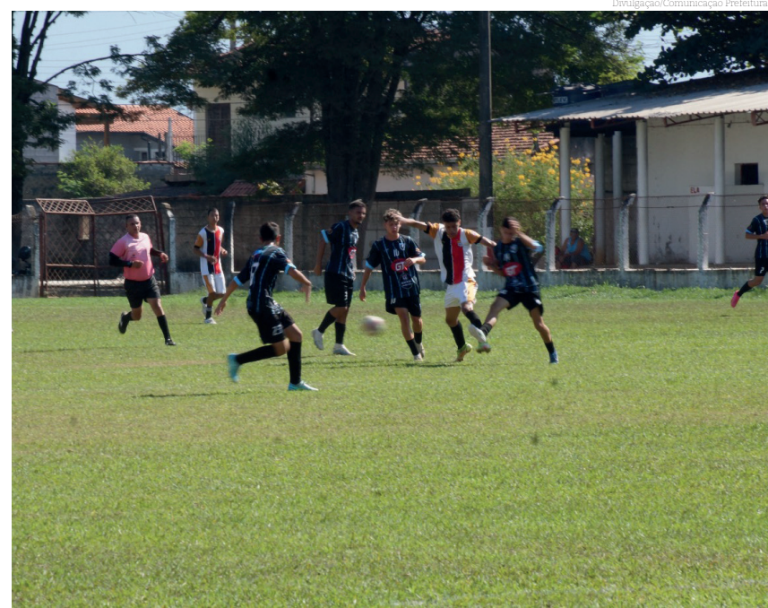
Campeonatos movimentaram fim de semana na cidade

Os campeonatos são organizados pela LPMF (Liga Pindamonhangabense de Futebol) com o apoio da SEMELP Secretaria Municipal de Esporte e Lazer de Pindamonhangaba.