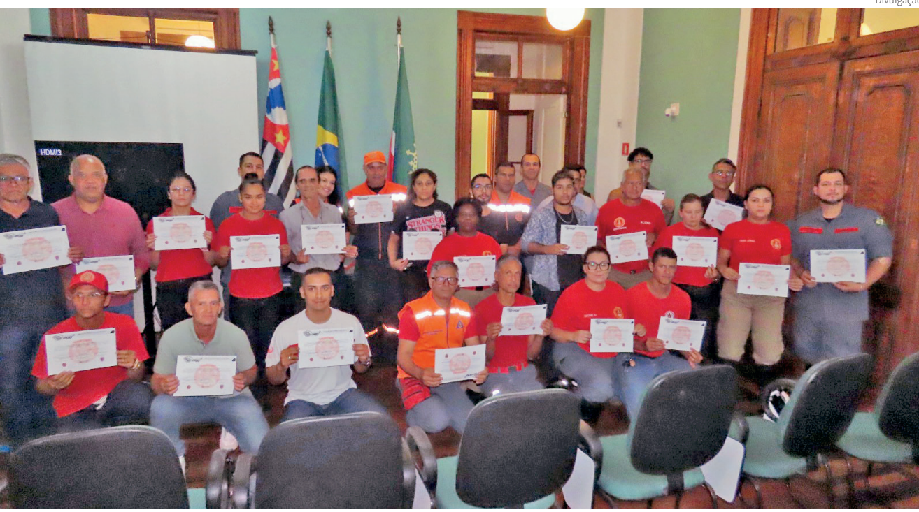
Com a formação da brigada do Araretama, Pinda passa a contar com quatro brigadas de incêndio

Ambas as iniciativas visaram adoção e a conscientização sobre a posse responsável, bem como proteção e respeito aos animais.