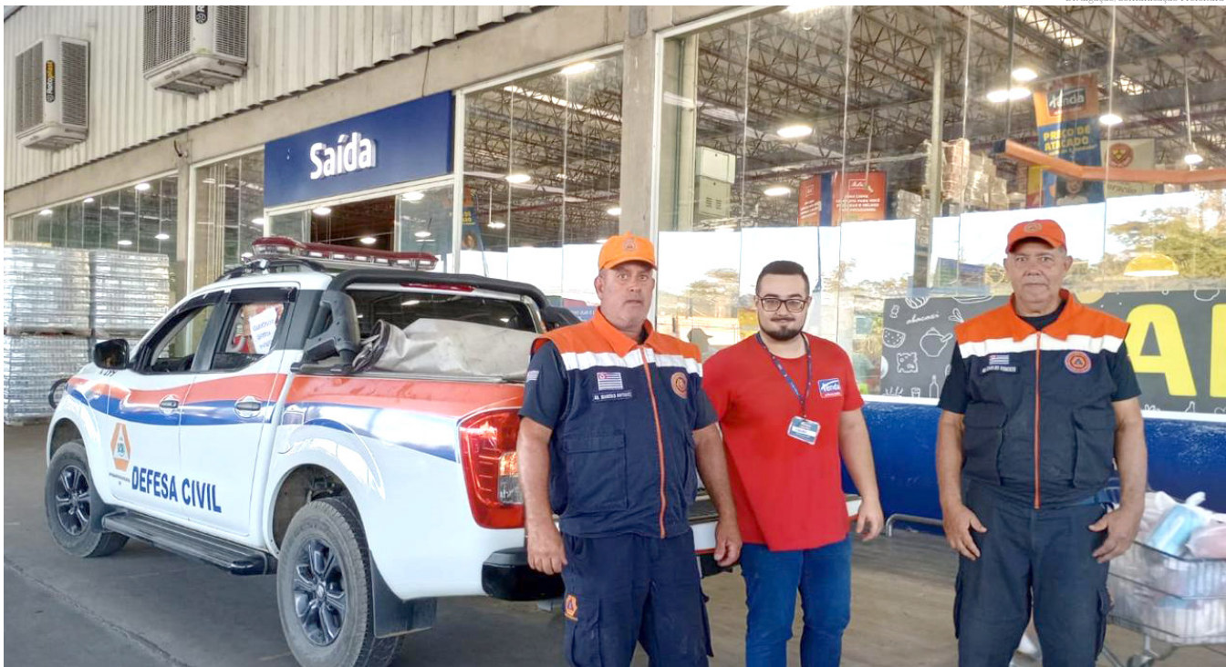
A população de Pinda é muito solidária para esta causa tão justa

As doações arrecadadas por essa campanha do Fundo Social de Solidariedade serão entregues à Defesa Civil do Estado de São Paulo, que encaminhará à Defesa Civil do Rio Grande do Sul.