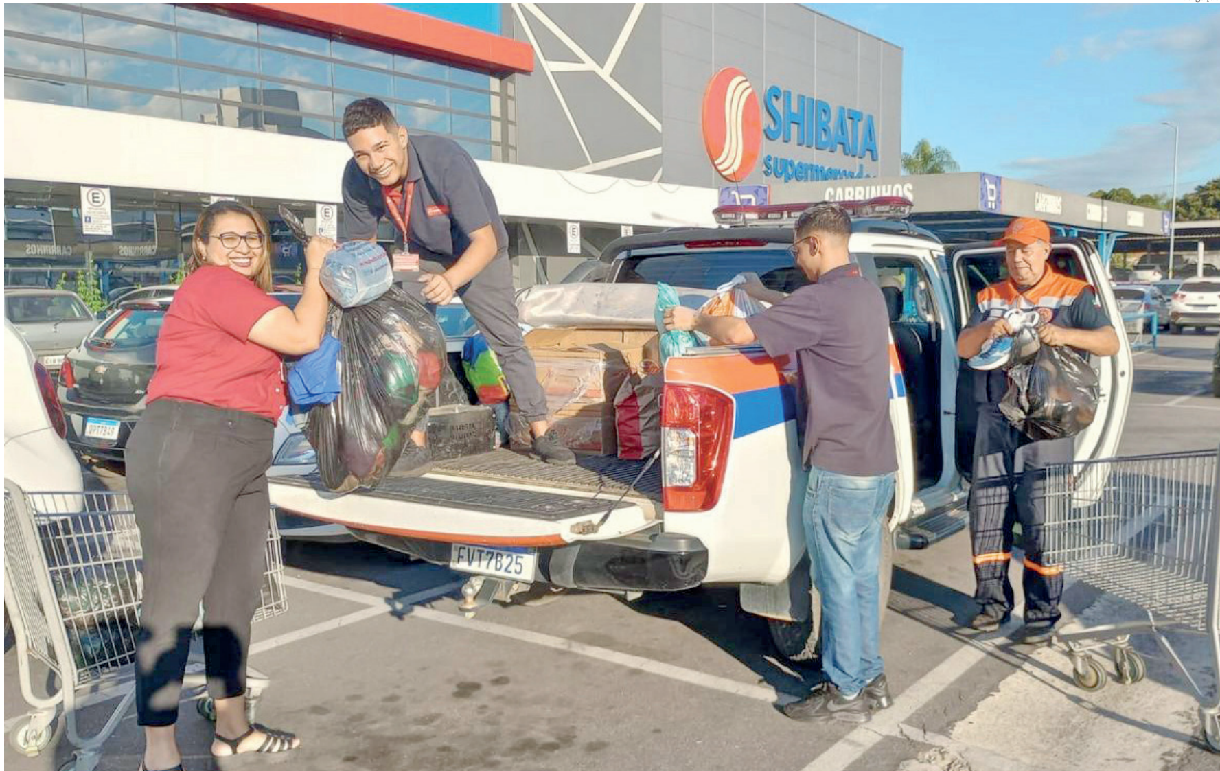
O Fundo Social de Solidariedade conta com o apoio da Defesa Civil para a retirada dos suprimentos doados às vítimas do Sul