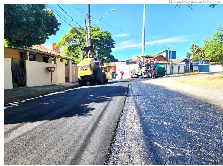
Início dos trabalhos no Campo Alegre

Desde 2023, o programa de modernização do piso asfáltico está investindo R$ 53 milhões em asfalto novo para modernização de 65 quilômetros de 184 ruas e avenidas, beneficiando 26 bairros do município. A essa ação soma-se os trabalhos de pavimentação asfáltica dos bairros Portão do Eucaliptos e Shangri-lá (em execução final).