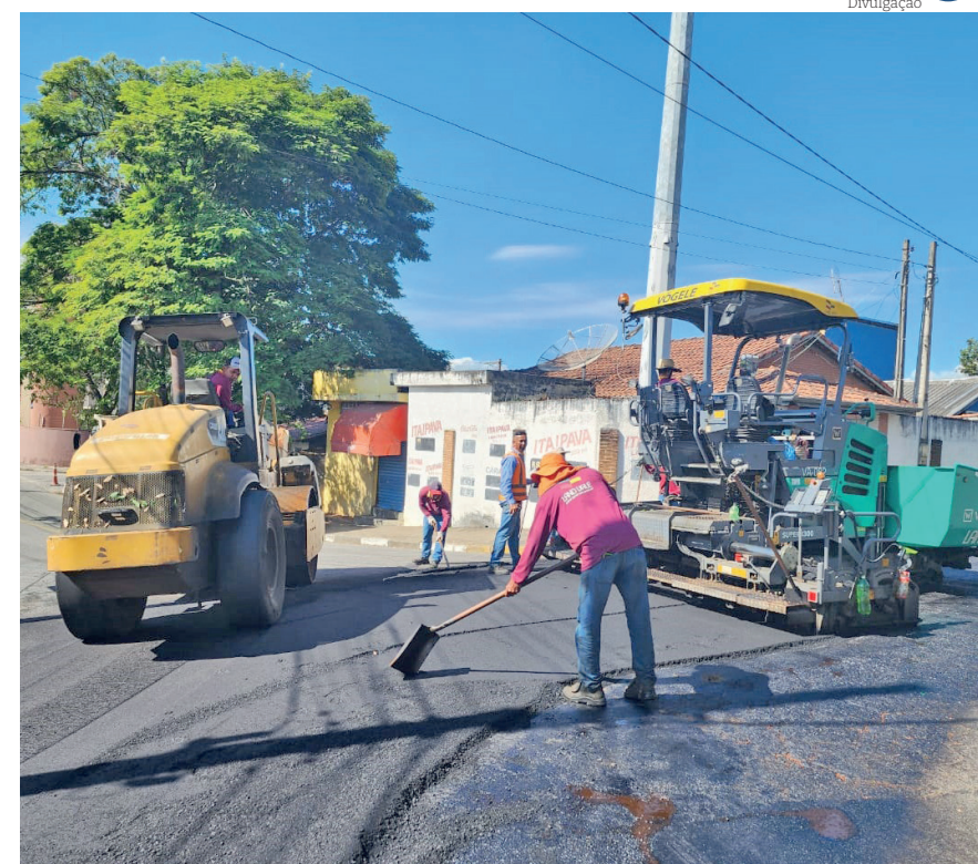
Desde 2023, são R$ 53 milhões em modernização do piso asfáltico