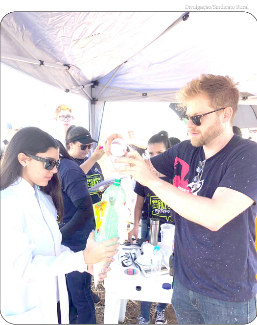
Os alunos participaram em duas categorias: lançamento por pressão e por reação química. O evento foi realizado na Fazenda Princesa do Norte, do Sindicato Rural de Pindamonhangaba