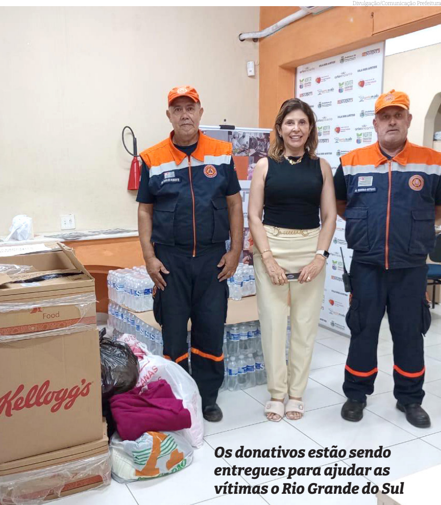
Os donativos estão sendo entregues para ajudar as vítimas o Rio Grande do Sul

A Defesa Civil Animal e o Cepatas de Pindamonhangaba são os novos parceiros do Fundo Social de Solidariedade na arrecadação de suprimentos para as vítimas das enchentes no Rio Grande do Sul. A campanha realizada pelo Fundo Social, sob orientação da Defesa Civil do Estado e com o apoio da Defesa Civil de Pinda, agora também vai arrecadar rações para pets, além da água, produtos de limpeza e produtos de higiene pessoal.