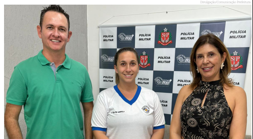
O lançamento da Campanha será no dia 21 de maio

Campanha do Agasalho 2024 será no dia 21 de maio, às 10 horas, na Praça Padre Antonio Faria Fialho “Praça do Quartel”. O slogan deste ano será “Aquecendo vidas, aquecendo corações”. A dinâmica da campanha será a coleta casa a casa, com