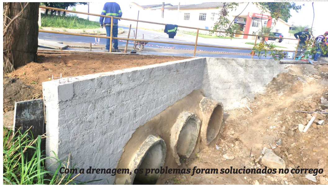
Com a drenagem, os problemas foram solucionados no córrego