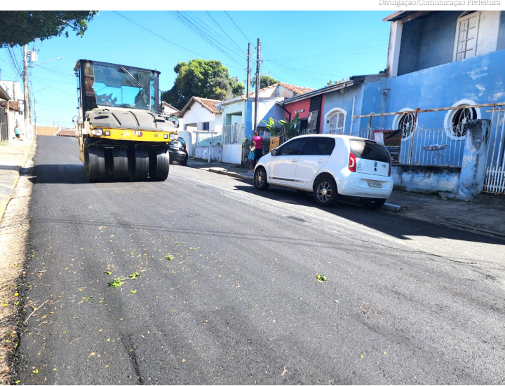
Término trabalho Alto Cardoso