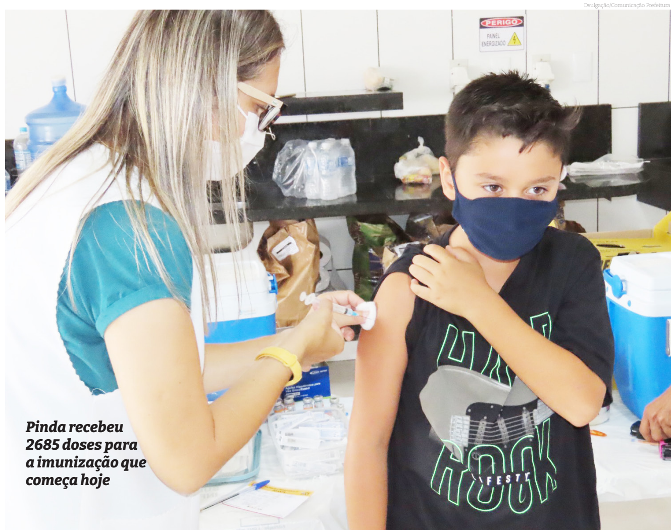
Pinda recebeu 2685 doses para a imunização que começa hoje

Diante dessas perspectivas promissoras, a população de Pindamonhangaba é incentivada a participar ativamente deste esforço coletivo de prevenção, comparecendo aos postos de saúde designados para receber a vacina contra a dengue.