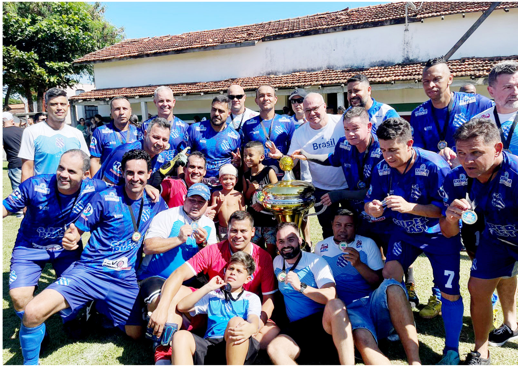
O campeão - conhecido após a disputa de pênaltis - festejou a vitória no último domingo

Pelo sub-17, MiniCraque 1 x 1 Fluminense e Vila Sapó 0 x 12 Ferroviária.