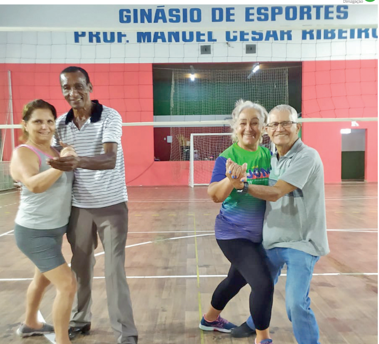
O evento é realizado pelo Governo de SP e a organização interna fica por conta da Prefeitura