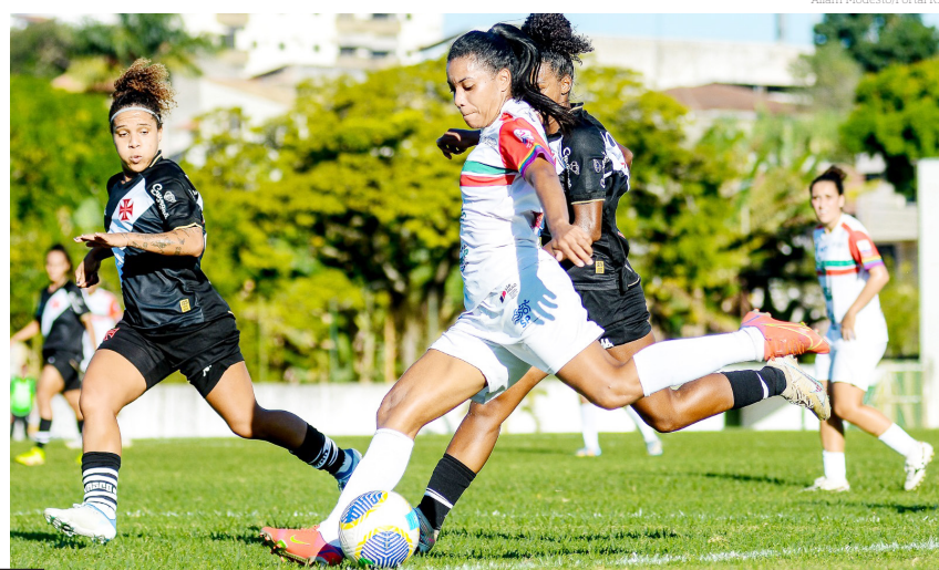
Allan Modesto/Portal R3

(11), às 15 horas, o time do Pinda Ferroviária vai até o Rio de Janeiro para o jogo de volta, precisando tirar diferença de três gols.