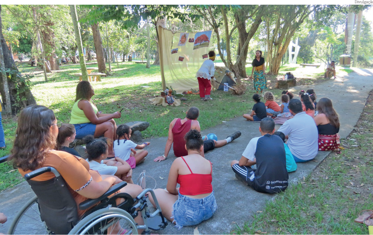
Evento no Bosque da Princesa ofereceu uma programação com temas antirracistas

O lançamento oficial da Campanha do Agasalho 2024 será dia 21 de maio, às 10 horas, na Praça Padre Antônio Faria Fialho "Largo do Quartel". No dia do lançamento, os munícipes poderão levar suas doações até a praça. Também haverá caixas de coleta em diversos pontos da cidade e arrecadação nos bairros, com equipe devidamente uniformizada.