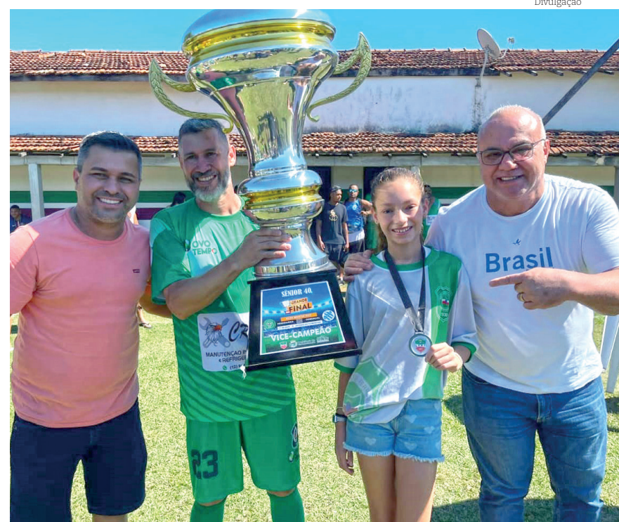
Vice-campeã, Ferroviária. Na última página, a foto do campeão