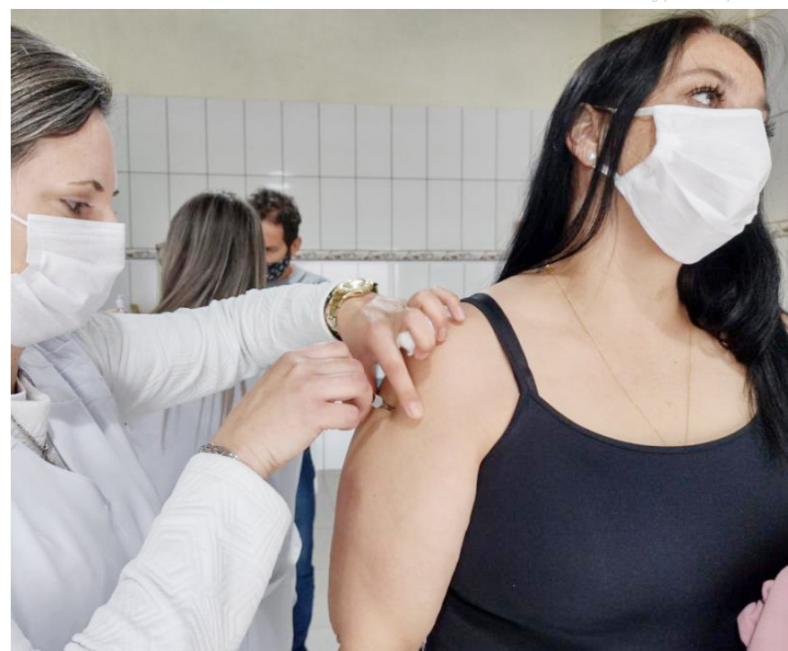
A vacina protege contra complicações que a síndrome gripal pode trazer

A Prefeitura de Pindamonhangaba, por meio da Secretaria de Saúde, deu um passo significativo na luta contra a gripe, expandindo a oferta de vacinação contra a influenza para toda a população a partir dos seis meses de idade. Essa medida, que teve início no dia 2 de maio, abrange tanto pessoas com comorbidades quanto aquelas que ainda não se vacinaram contra a gripe este ano. Agora, qualquer cidadão pode receber a vacina comparecendo a uma das Unidades Básicas de Saúde do município, portando CPF (ou cartão SUS) e carteira de vacinação, de segunda a sexta-feira, das 08 às 11 e das 13 às 16 horas.