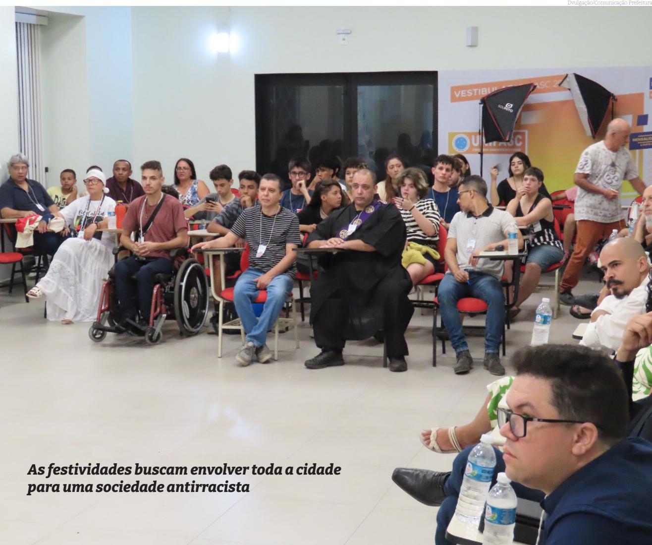
As festividades buscam envolver toda a cidade para uma sociedade antirracista

A programação completa está no site da Prefeitura www.pindamonhangaba.sp.gov.br .