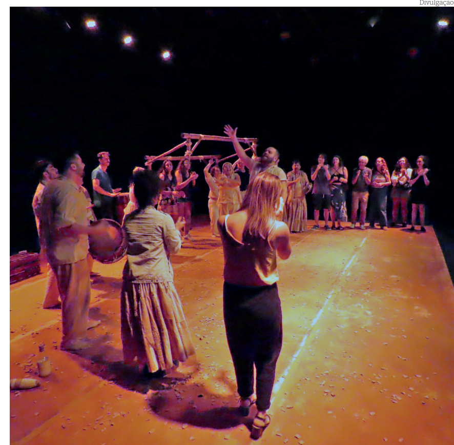
'Trilogia Flores' apresentou três peças distintas na sexta-feira (3), no sábado (4) e no domingo (5), no Teatro Galpão