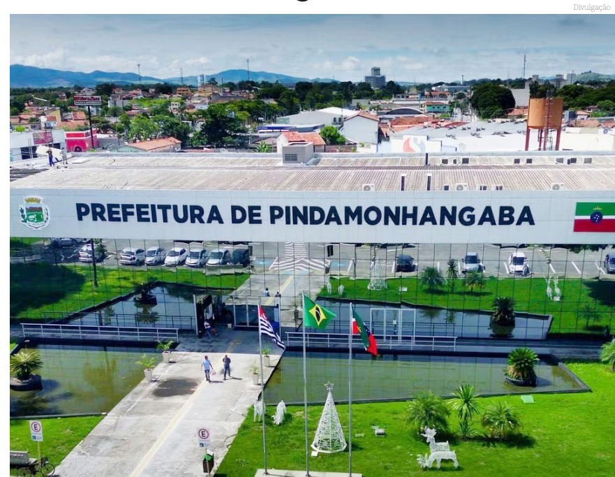
A adesão ao ‘Facilita SP’ vai modernizar ainda mais e desburocratizar os serviços da prefeitura