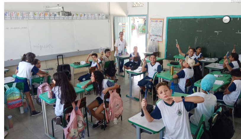
Ensinar que hábitos corretos de higiene bucal previnem doenças foi o objetivo do projeto

lizadas periodicamente pelos profissionais das unidades de saúde nos bairros, contribuem para a prevenção de doenças e para a saúde bucal das crianças.