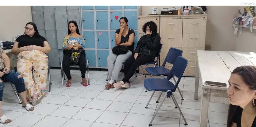
O encontro ressaltou os cuidados com a higiene íntima feminina

Essas orientações visam não apenas promover a saúde física, mas também o bem-estar emocional e psicológico das mulheres, fortalecendo sua capacidade de cuidar de si mesmas e de suas famílias. A reunião proporcionou um espaço seguro e acolhedor para discutir esses temas importantes, capacitando as mulheres para viverem vidas mais saudáveis e felizes.