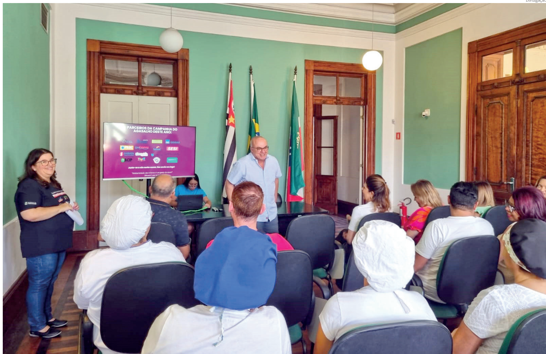
Fundo Social de Solidariedade deve realizar a arrecadação nos bairros e também em pontos de arrecadação por toda a cidade