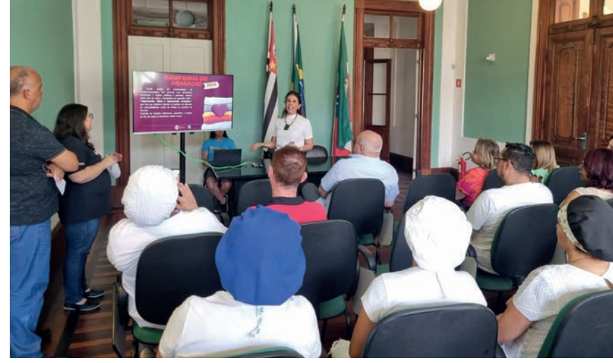
A presidente do FSS salientou que todos podem se unir para ajudar aqueles que mais precisam