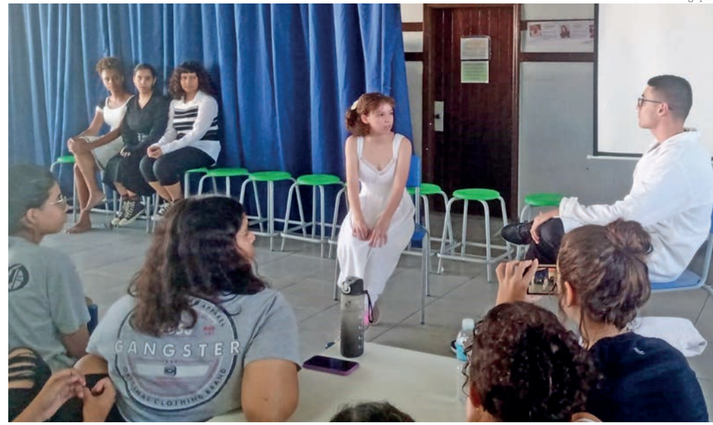
O objetivo do projeto da Sala Ambiente de Leitura (SAL) era a reflexão e mudança de comportamento para o respeito e valorização da mulher