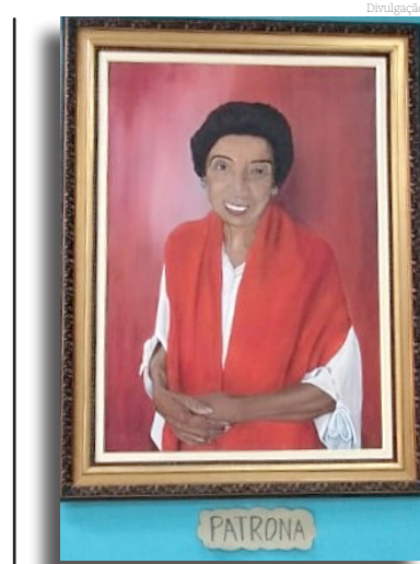
Conheça a Patrona da Biblioteca: