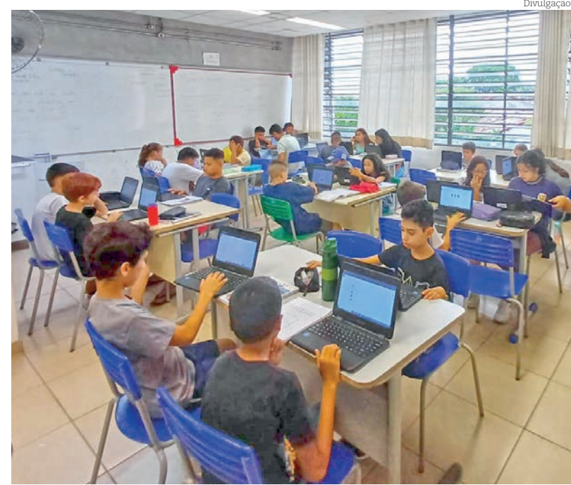
Plataforma trabalha fala, audição, leitura e escrita

A Secretaria de Educação espera despertar um maior interesse dos alunos, melhorando a comunicação em língua estrangeira, oferecendo