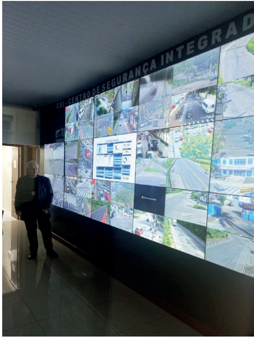
O objetivo é aprimorar o combate à criminalidade

A Prefeitura de Pindamonhangaba anunciou nesta semana a integração de seu aparato tecnológico de segurança pública junto ao programa Muralha Paulista, lançado recentemente pelo Governo do Estado de São Paulo e dá mais um importante passo no uso da tecnologia para o combate à criminalidade.