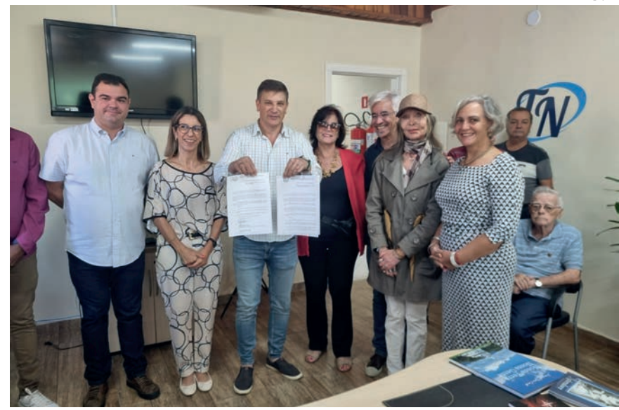
Juntos - poderes executivo e legislativo - e conselheiros, preservando a história de Pindamonhangaba

“Foi muito importante que esta assinatura fosse em nossa sede, para que nossos funcioná-