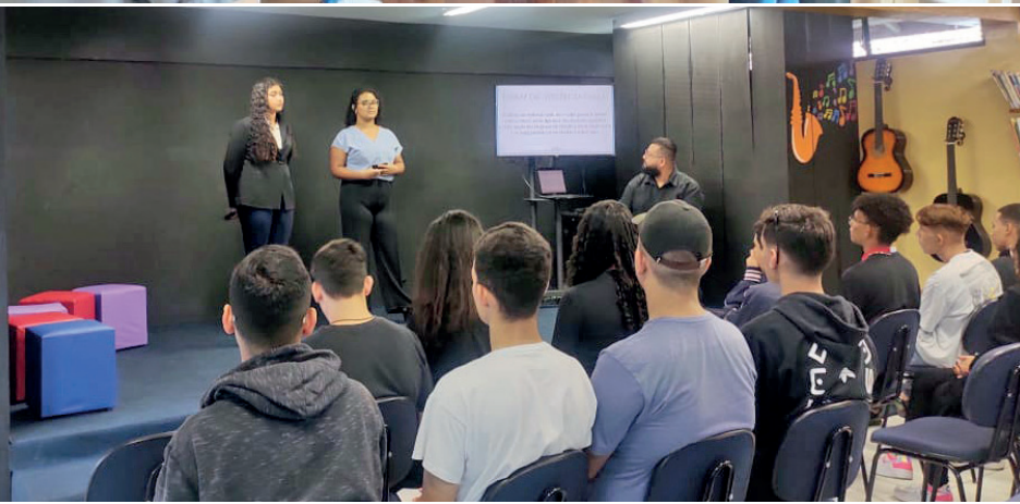
Seminário visa criar uma atmosfera rica de saberes que, posteriormente, os colocarão mais perto das demandas do ensino superior