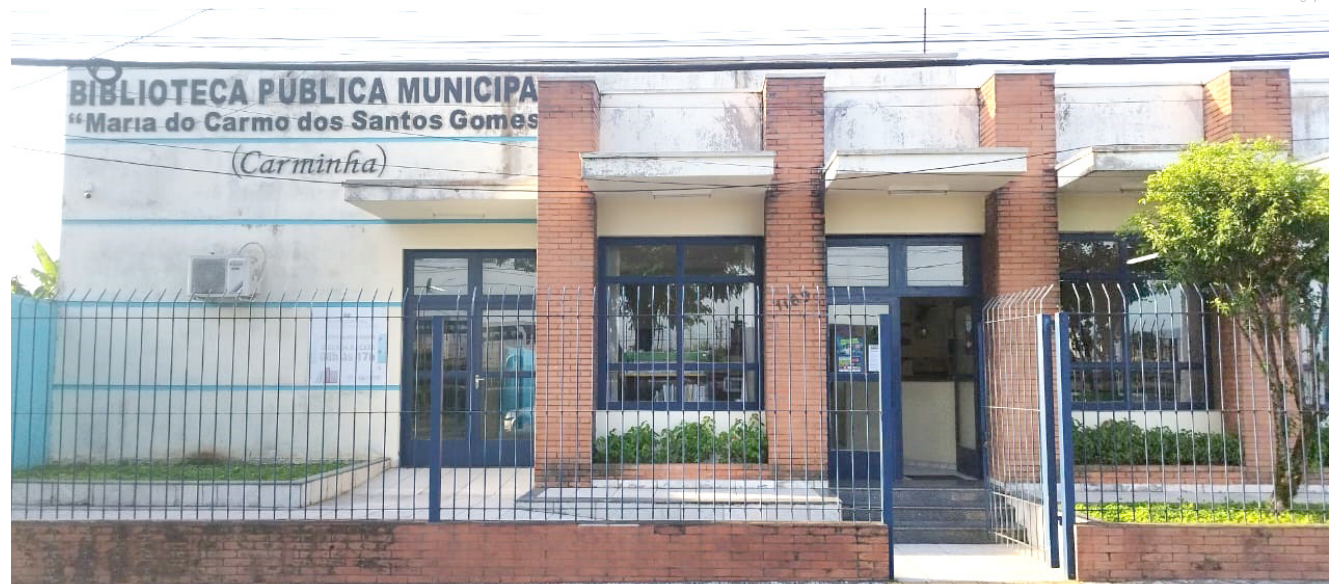
A biblioteca se destaca como um centro de inclusão social

"Acabamos de receber uma bibliotecária para fazer a automação dos livros e empréstimos. Grande parte dos livros no local ainda não foram cadastrados, contudo, a ideia é que, a partir de este ano, pelo menos 90% dos livros estejam disponibilizados no sistema online de bibliotecas", afirmou a responsável pelas bibliotecas públicas municipais, Rosi Cardoso.