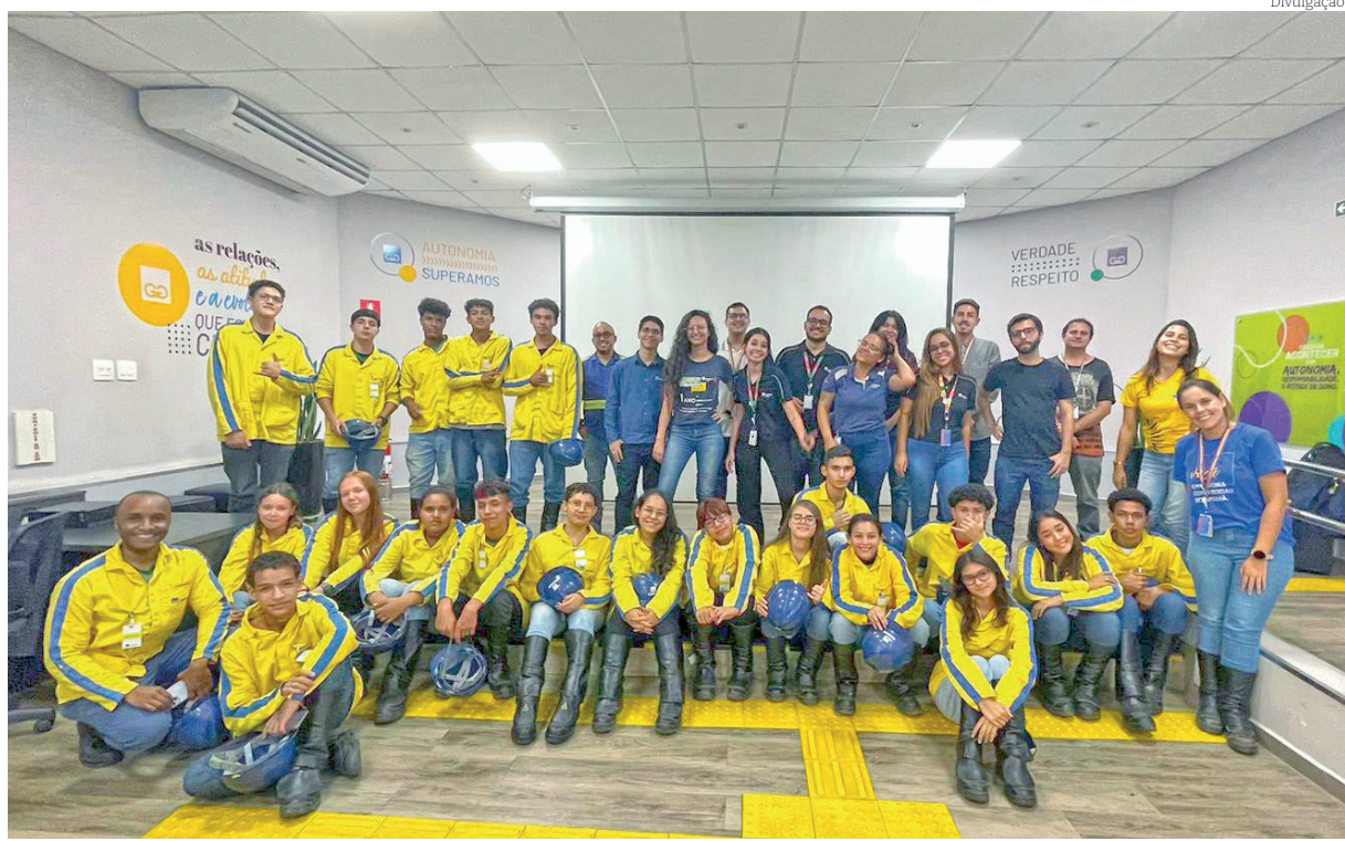
Alunos da escola estadual Rubens Zamith participaram do projeto ‘Um dia na Gerdau’