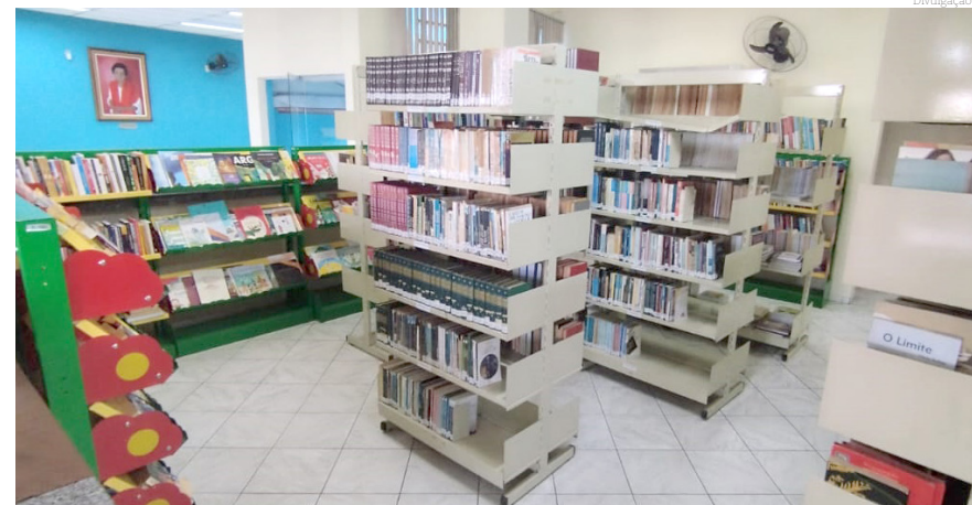
O local abriga atualmente um acervo diversificado de quase 11 mil exemplares