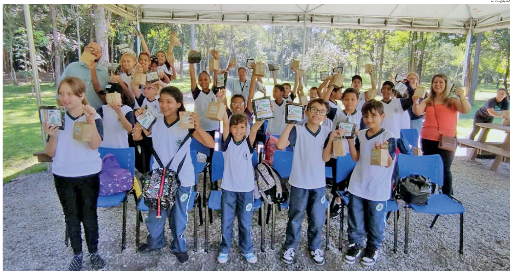
'DIA INTERNACIONAL DA TERRA' NO PARQUE DA CIDADE. Cada criança ganhou adubo orgânico produzido no Parque, por meio da composteira do Programa Composta Pinda e duas mudinhas (alface e cebolinha) para incentivá-las a plantar