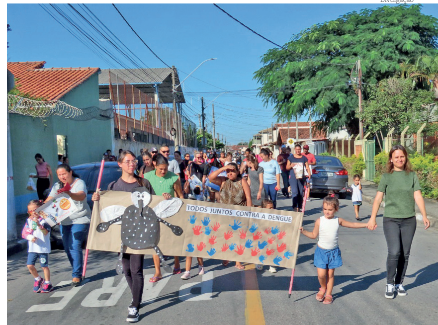
Cartazes foram exibidos, destacando medidas simples que podem evitar a proliferação do mosquito se adotadas no dia a dia