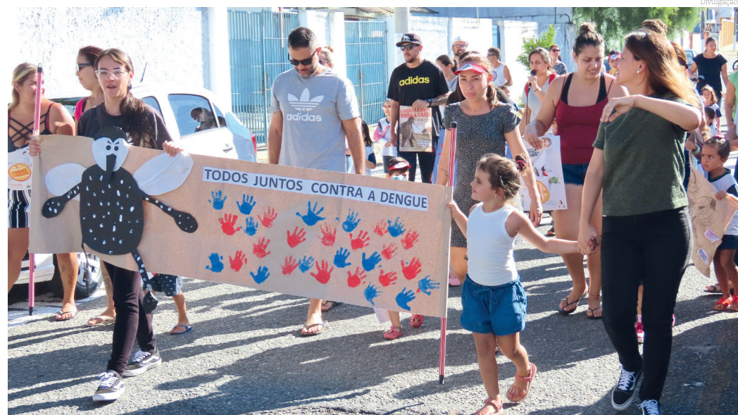
Professores, alunos e familiares juntos, buscando as melhores ações para conscientizar sobre a Dengue