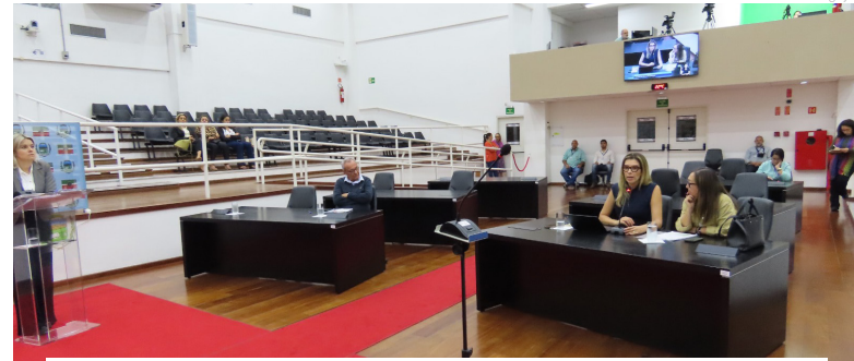
A audiência esclareceu dúvidas sobre as mudanças que a revisão pretende implementar

A Prefeitura de Pindamonhangaba promoveu, na última quinta-feira (18 de abril), uma Audiência Pública que discutiu a revisão do código de edificações do município, na Câmara dos Vereadores. Essa audiência esclareceu as dúvidas sobre as mudanças que a revisão pretende implementar no código de edificações do município, além de ouvir a opinião pública e receber sugestões e observações sobre as propostas da minuta elaborada para o tema. Vale ressaltar que o documento completo, que foi elaborado pela Secretaria Obras e Planejamento, em parceria com profissionais da área, está disponível desde o dia 8 de abril no site da Prefeitura. Nesta semana, a Secretária de Obras e Planejamento, por meio do Departamento de Licenciamento, irá encaminhar a revisão do código de edifica-