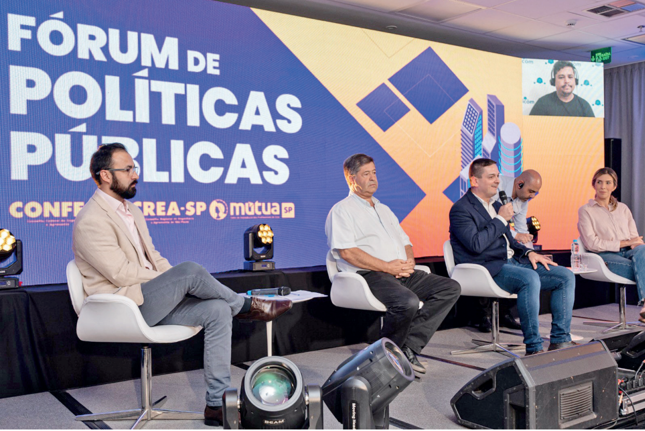
Fórum sobre gestão e desenvolvimento aconteceu na última sexta-feira (19), em Taubaté