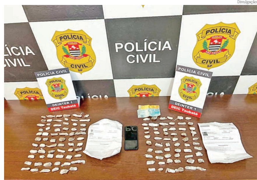
Polícia Civil apreendeu mais de 600g em drogas em Taubaté

Ainda na Av. Dom Pedro em Taubaté, os policiais civis abordaram um ônibus que vinha da capital paulista e após as devidas orientações policiais, foi identificado um homem de 31 anos que ao ficar em pé para sair do ônibus, encontrou-se em seu assento uma sacola com 37 unidades de cocaína e 25 de maconha.