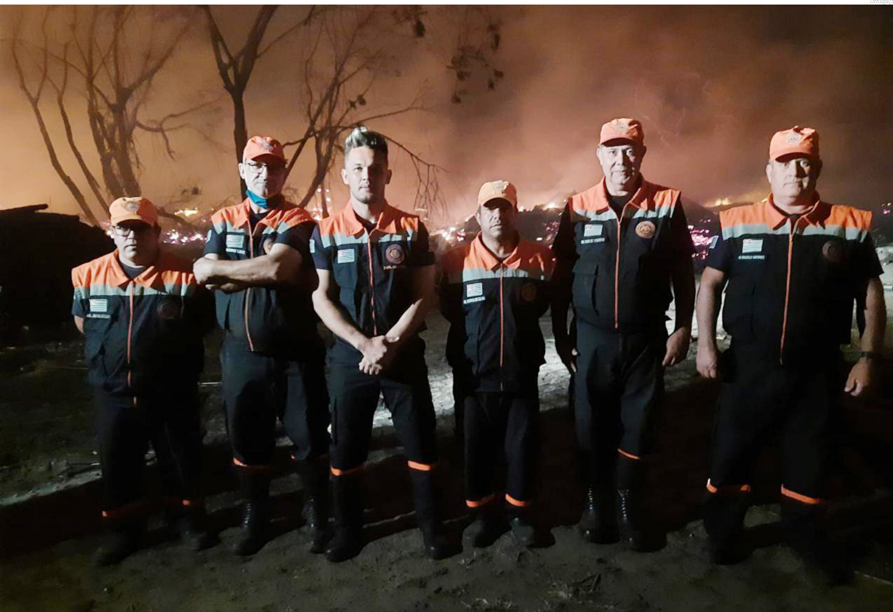
O treinamento tem como objetivo preparar os participantes para uma Brigada Voluntária

A Secretaria de Segurança Pública, por meio do Departamento de Defesa Civil, convida os moradores de Pindamonhangaba a serem voluntários e fazerem a diferença na sua comunidade, participando do Treinamento de Brigada Voluntária em Vegetação Rasteira.