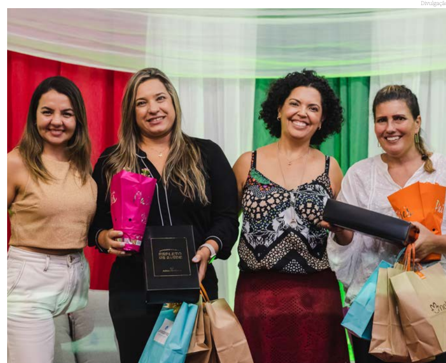
Mulheres que participaram do podcast descrevendo conquistas e vivências

Foram depoimentos espontâneos e muito significativos, descrevendo suas conquistas na vida, marcos importantes alcançados ao longo de suas jornadas pessoal e profissional, momentos de sucesso, superação e realização, que as ajudaram a crescer, evoluir e se sentirem