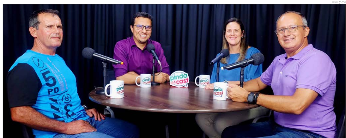
Neste episódio, o foco foi no trabalho prático da Prefeitura em relação ao combate à dengue

“O PindaCast é mais uma ferramenta da Prefeitura na luta contra a dengue, levando informação para a população, de uma maneira simples e objetiva”, disse o secretário adjunto de Governo e