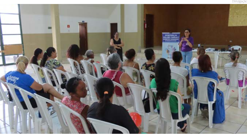
A oficina destaca a inteligência emocional no público