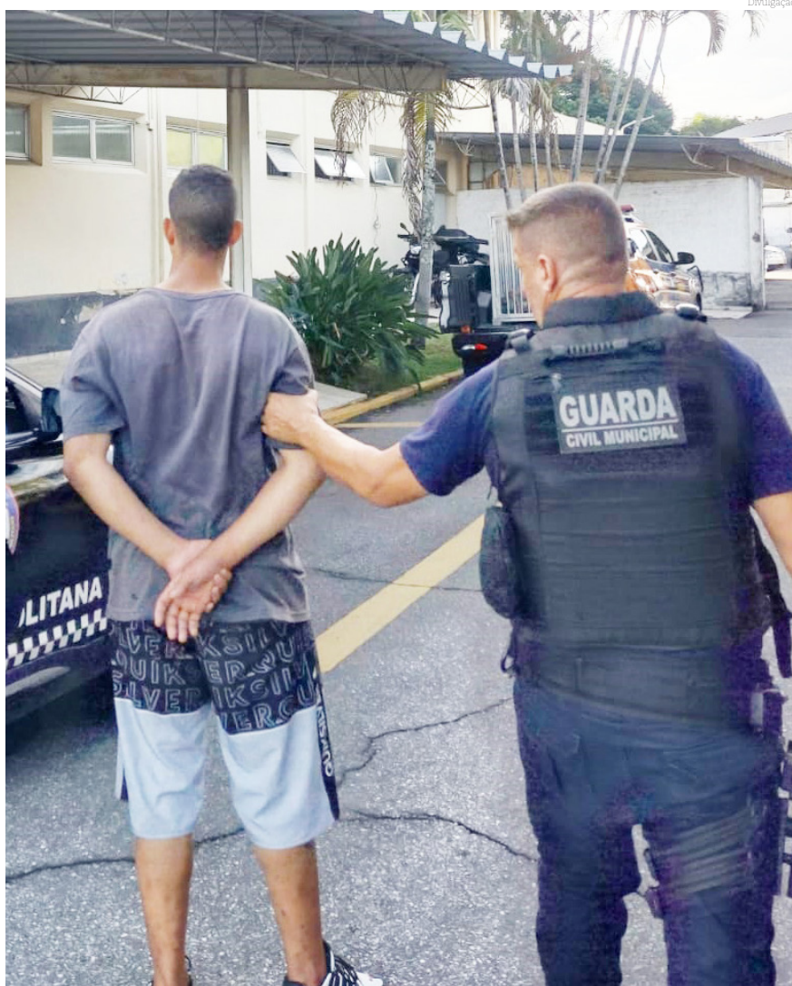
A GCM vem realizando um amplo trabalho em todo o município