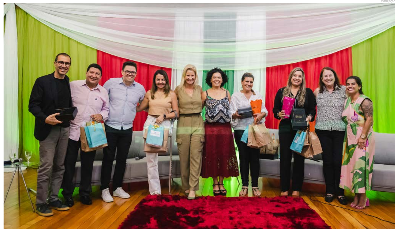
Toda a equipe organizadora e parceira do evento

A ACIP (Associação Comercial e Industrial de Pindamonhangaba), promoveu no dia 21 de março, um evento dedicado ao mês das Mulheres, com a realização de um podcast ao vivo com o tema "O desafio extraordinário de ser Mulher".