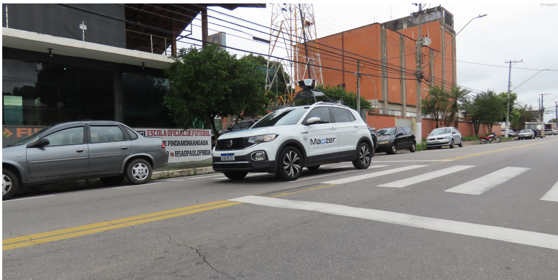
O trabalho dá agilidade à manutenção de ruas e avenidas

Além do investimento no Tapa Buraco, a Prefeitura de Pindamonhangaba também está investindo no Recapeamento Asfáltico visando modernizar o pavimento e trazer melhor qualidade de mobilidade para os motoristas e ciclistas que utilizam a via pública. Nos últimos meses mais de 150 ruas e avenidas estão recebendo o recapeamento num investimento de R$ 22 milhões que irá melhorar mais de 50 quilômetros de ruas e avenidas.