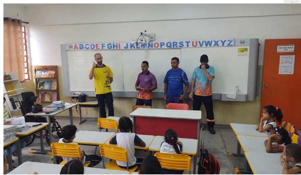
A ação faz o exercício de combate à dengue junto dos alunos e suas famílias

Na terça-feira (26), o trabalho será desenvolvido com alunos da Escola Municipal José Gonçalves da Silva (Seu Juquinha).