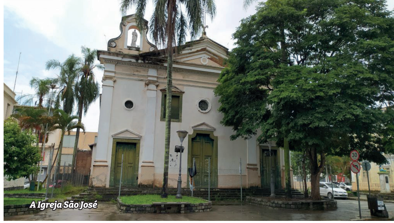
A Igreja São José

"Há muitos anos nossa Igreja São José encontra-se neste estado e mais recentemente com as provocações da Paróquia NS Bom Sucesso e do próprio Conselho de Patrimônio temos discutido