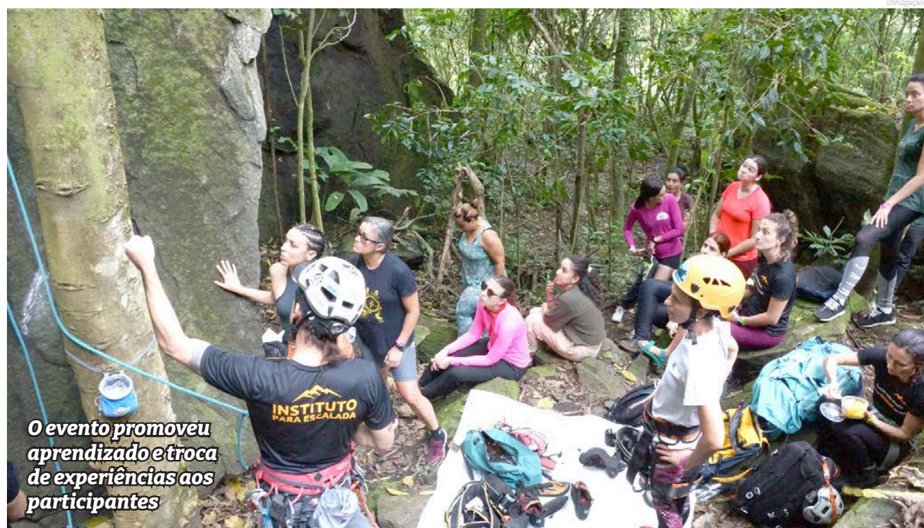
O evento promoveu aprendizado e troca de experiências aos participantes

Ao preservar nosso patrimônio histórico, estamos investindo no futuro, garantindo que as próximas gerações tenham acesso às mesmas fontes de inspiração, conhecimento e orgulho cultural que nós.