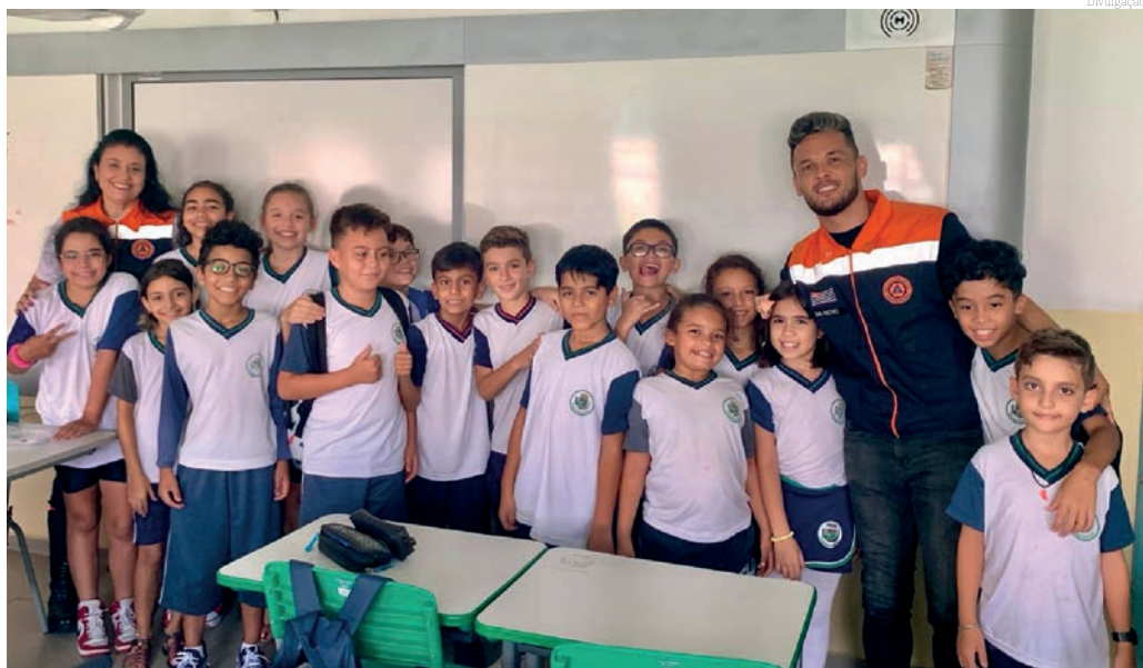
O programa educa as crianças sobre importantes questões de segurança

O Programa EDUSEG representa um passo significativo em direção à construção de uma comunidade mais segura e preparada. Ao equipar as crianças com conhecimentos e habilidades essenciais de segurança, a Prefeitura de Pindamonhangaba demonstra seu compromisso com o bem-estar de seus cidadãos, hoje e no futuro. Que essa iniciativa inspire outras cidades a investirem na educação preventiva e na formação de cidadãos conscientes e responsáveis.