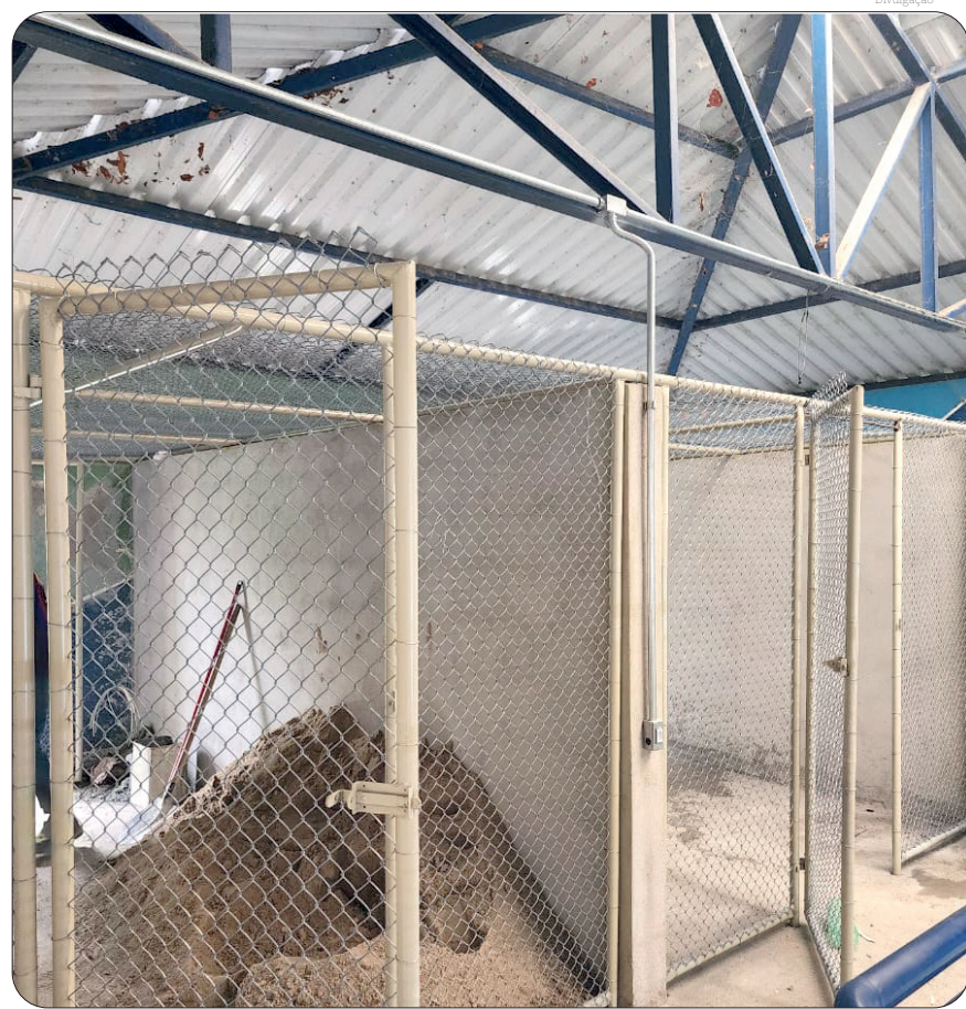
O cuidado da saúde animal é prioridade da atual gestão

Outra importante conquista foi a contratação de uma clínica veterinária para dar melhor su-