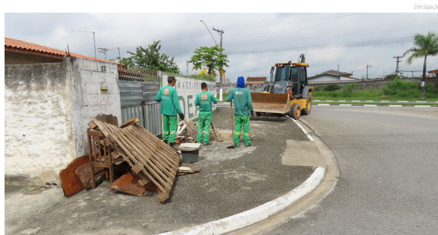
Várias ações foram realizadas e contaram com a participação das escolas

Em Moreira César, com trabalho que já começou há 10 dias,