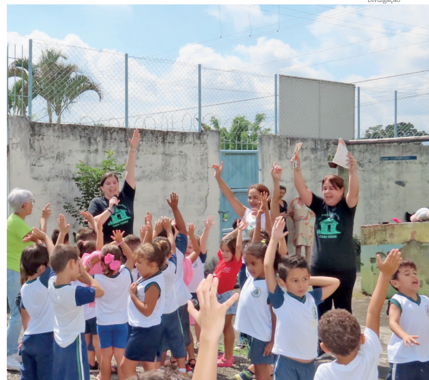
Algumas unidades escolares montaram peças de teatro, outras apostaram em músicas, exposições, orientações, cartazes, distribuição de panfletos, além de vistorias