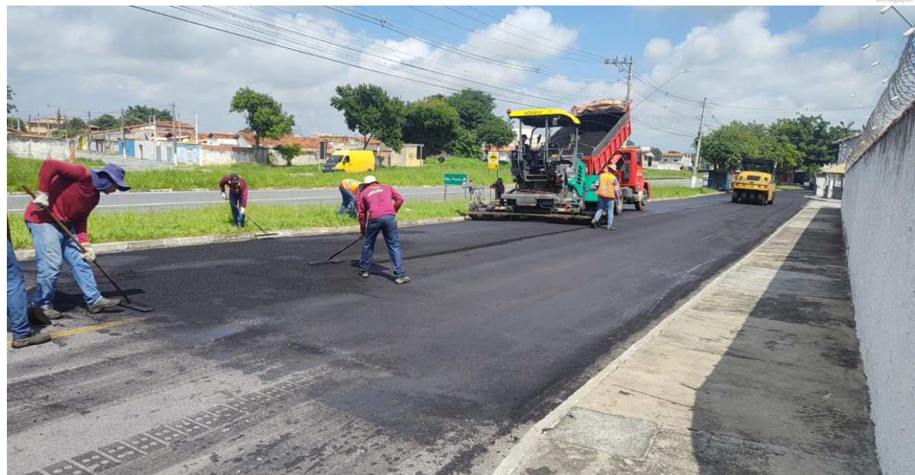
... para modernização de 65 quilômetros de 184 ruas e avenidas