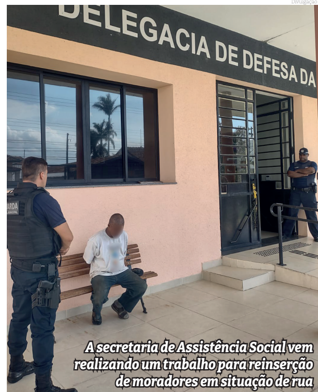
A secretária de Assistência Social vem realizando um trabalho para reinserção de moradores em situação de rua

A vítima foi orientada quanto ao prazo decenal de seis meses para representação criminal contra o autor.