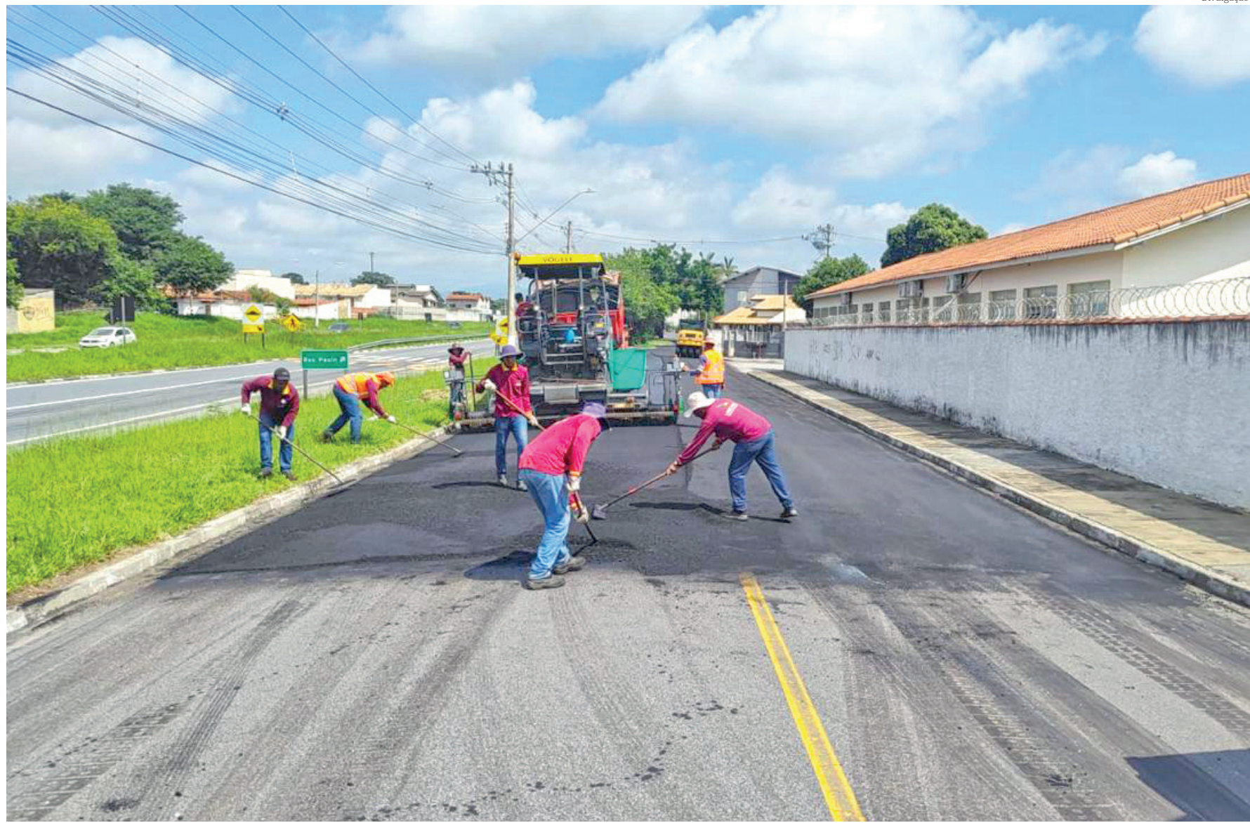
Desde 2023, o programa de modernização do piso asfáltico está investindo R$ 53 milhões nas vias públicas de Pindamonhangaba