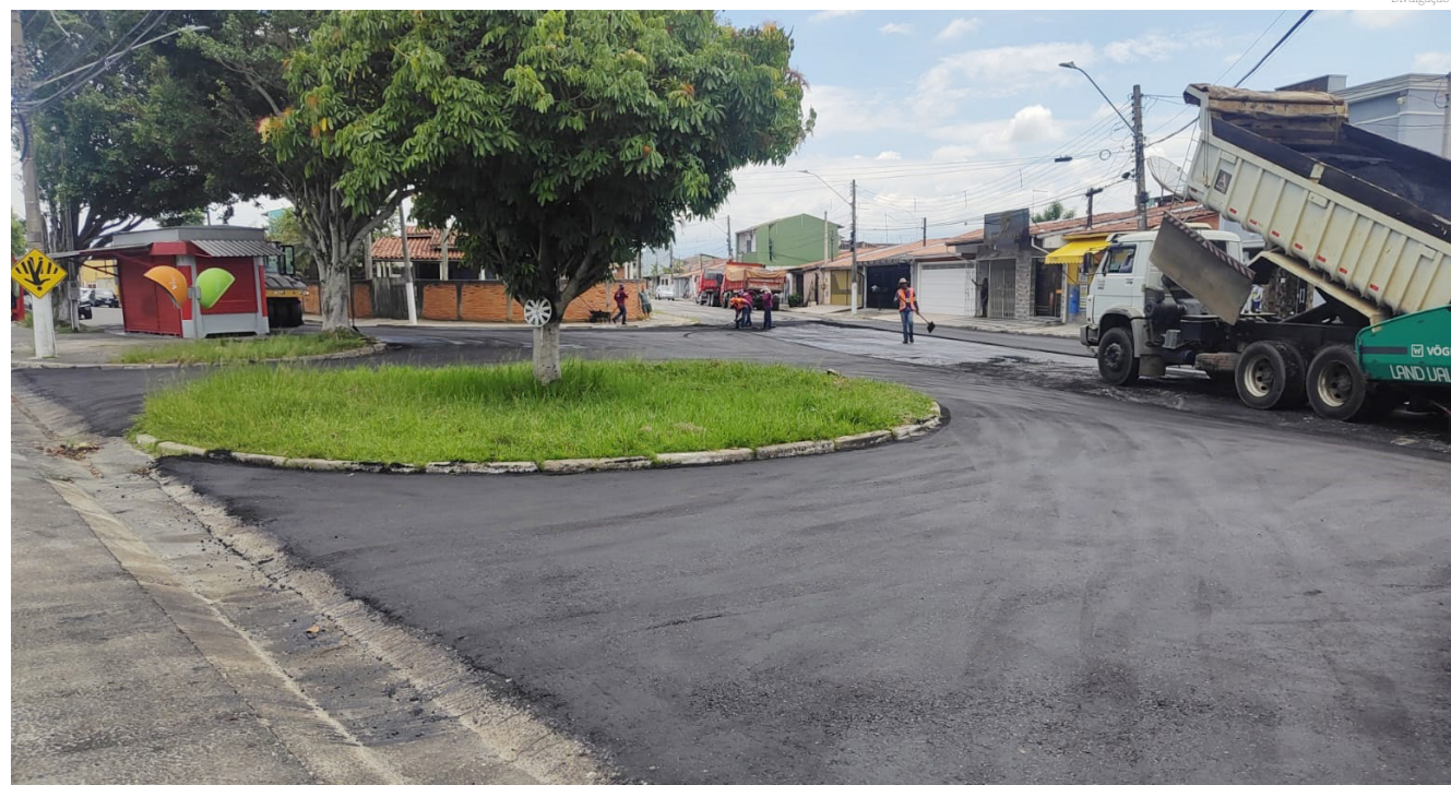
Todo o programa de modernização do piso asfáltico está investindo R$ 53 milhões...

Diversas ruas que estavam num estado muito crítico estão ficando melhor com essa revitalização. Bairros como Carangola, Pasin, Karina foram recapeados praticamente 100%. Vamos deixar nossa cidade cada vez mais bonita e segura", afirmou.