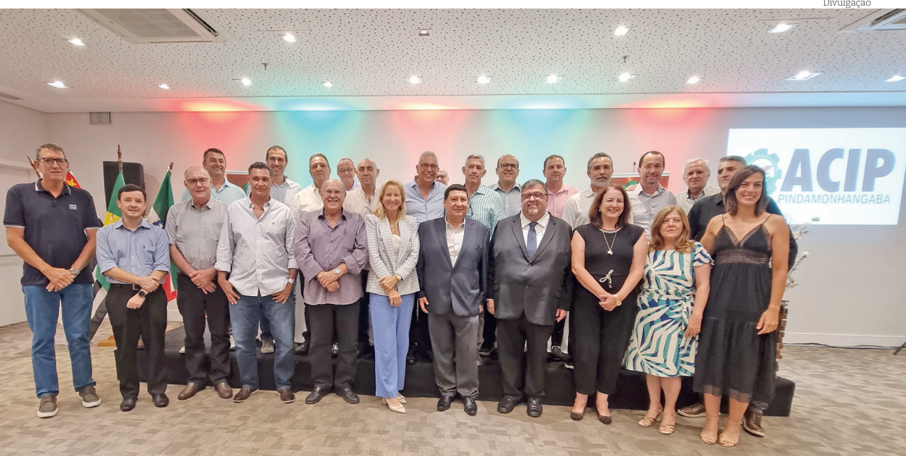
Diretoria da Acip, eleita na última quinta-feira (28), será responsável pela gestão 2024/2026