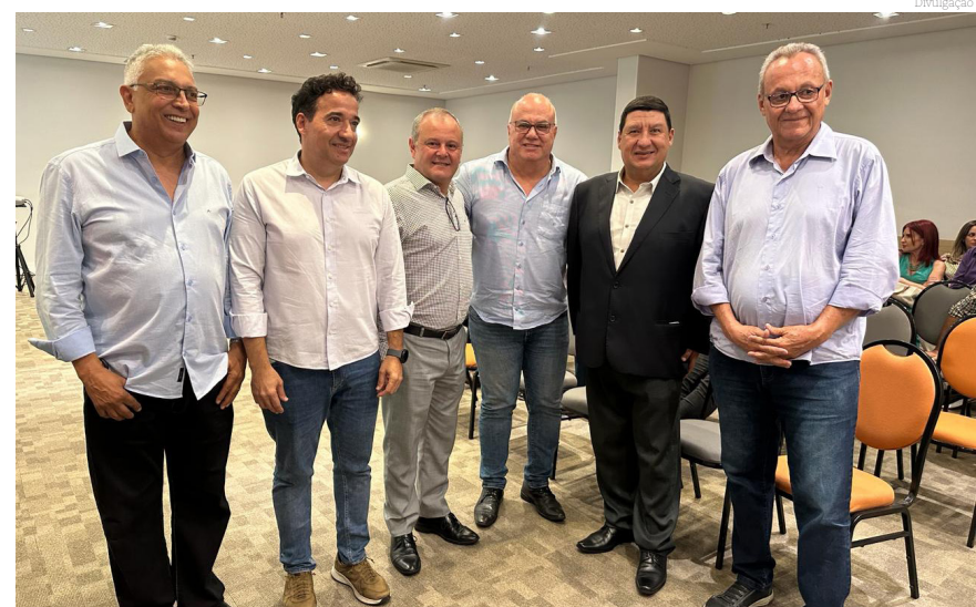
Autoridades prestigiaram a posse da nova diretoria