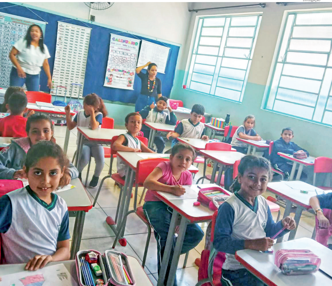
As aulas seguem normalmente nas unidades afetadas pelo rompimento das adutoras de água