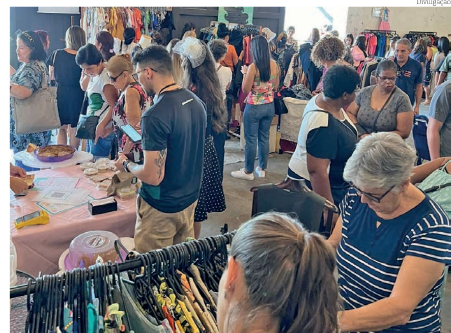
Encontro de Brechós reuniu 14 brechós no Armazém da Lagoa