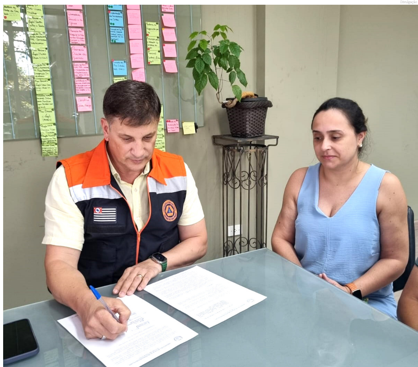
O decreto permite maior rigor em notificações e multas e potencializar as ações de combate à dengue

O decreto também autoriza o município a agir com maior rigor em notificações e multas a proprietários de imóveis que se recusarem a colaborar com os agentes, impedindo visitas