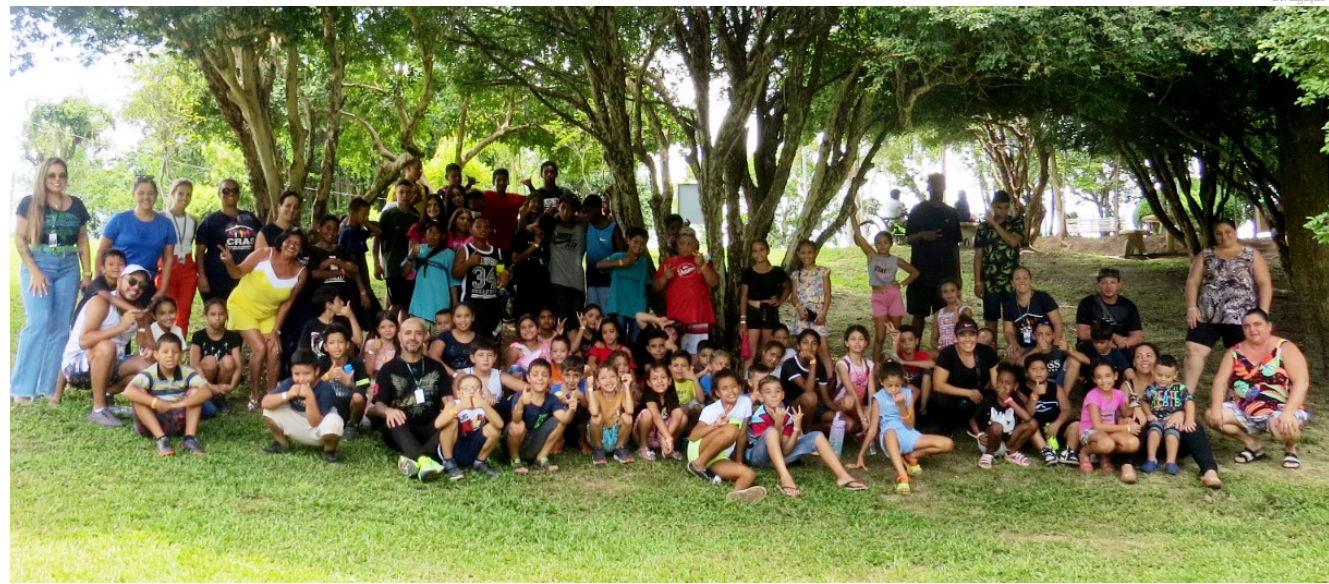
Crianças assistidas pelo CRAS de Potim tiveram um dia de diversão e muita interação