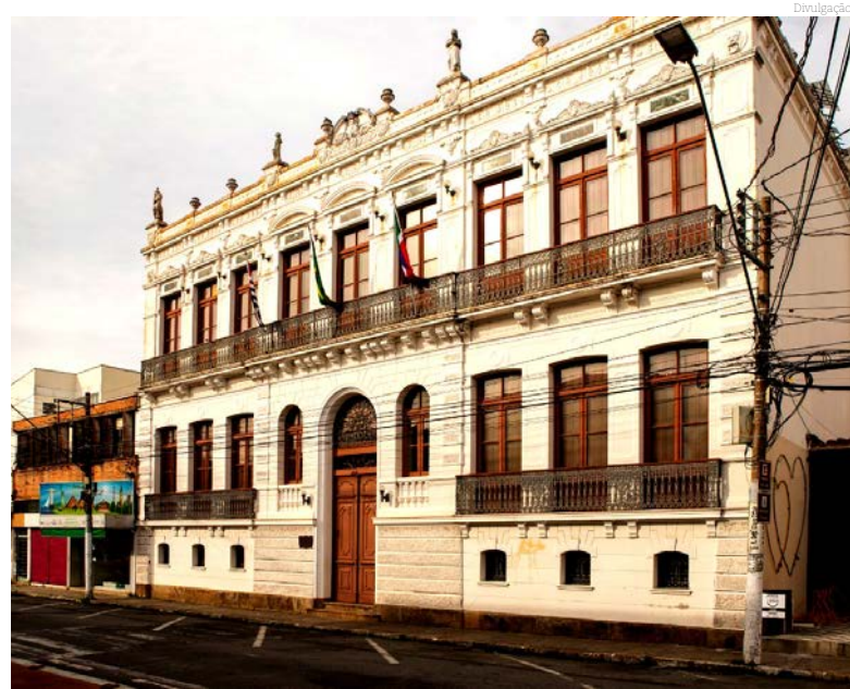
A oficina vai acontecer no Palacete 10 de Julho