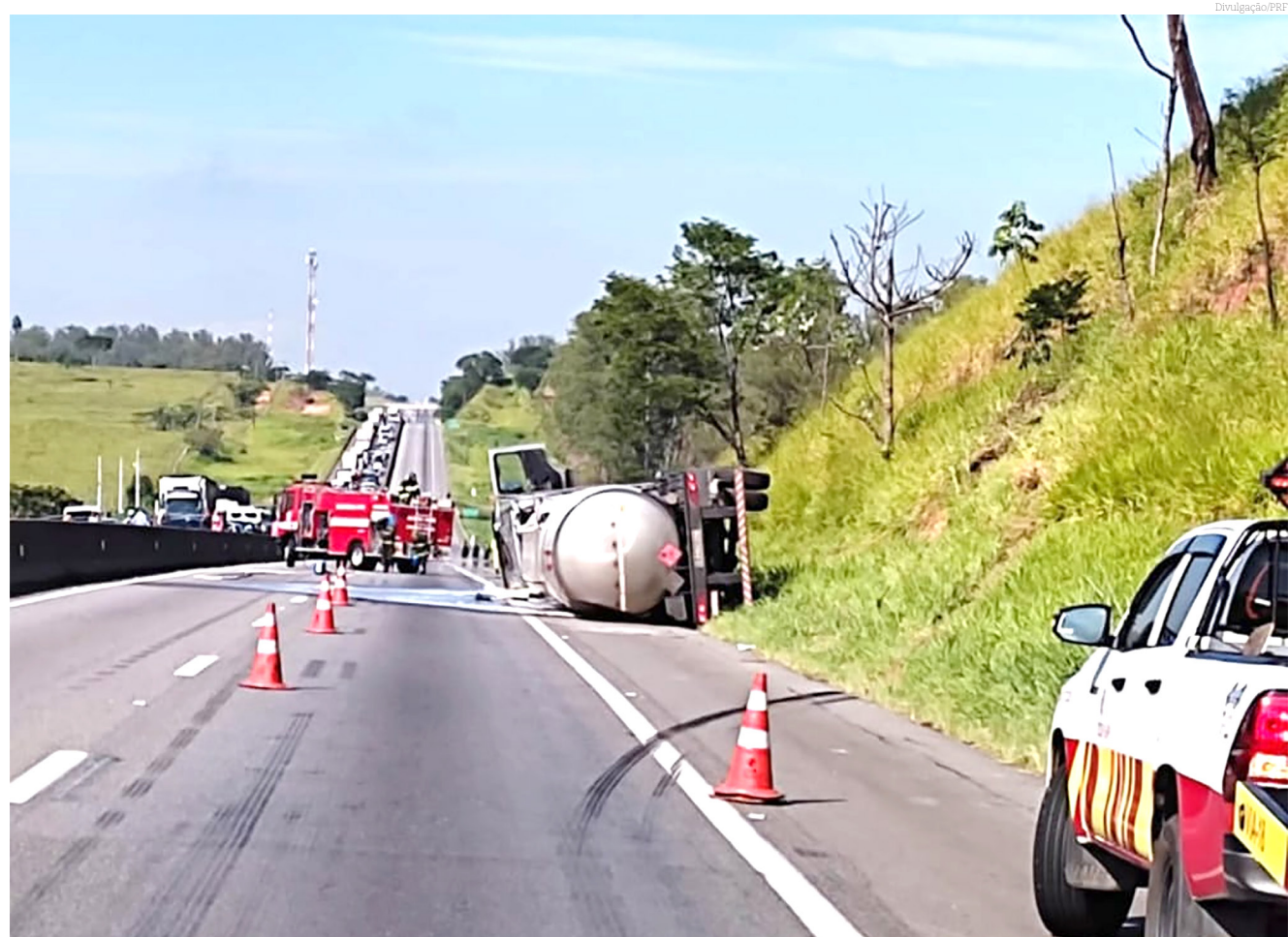
Momento em que o Corpo de Bombeiros fez o atendimento à carreta tombada na Via Dutra

O Departamento de Trânsito da Prefeitura segue monitorando a situação.