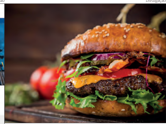
Entre as opções oferecidas está o curso de Hamburguer Artesanal