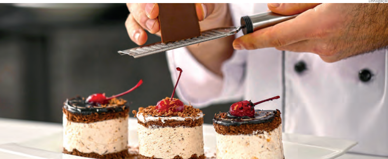
Entre as opções oferecidas pelo Senac de Pinda está o Curso de Hamburguer Artesanal