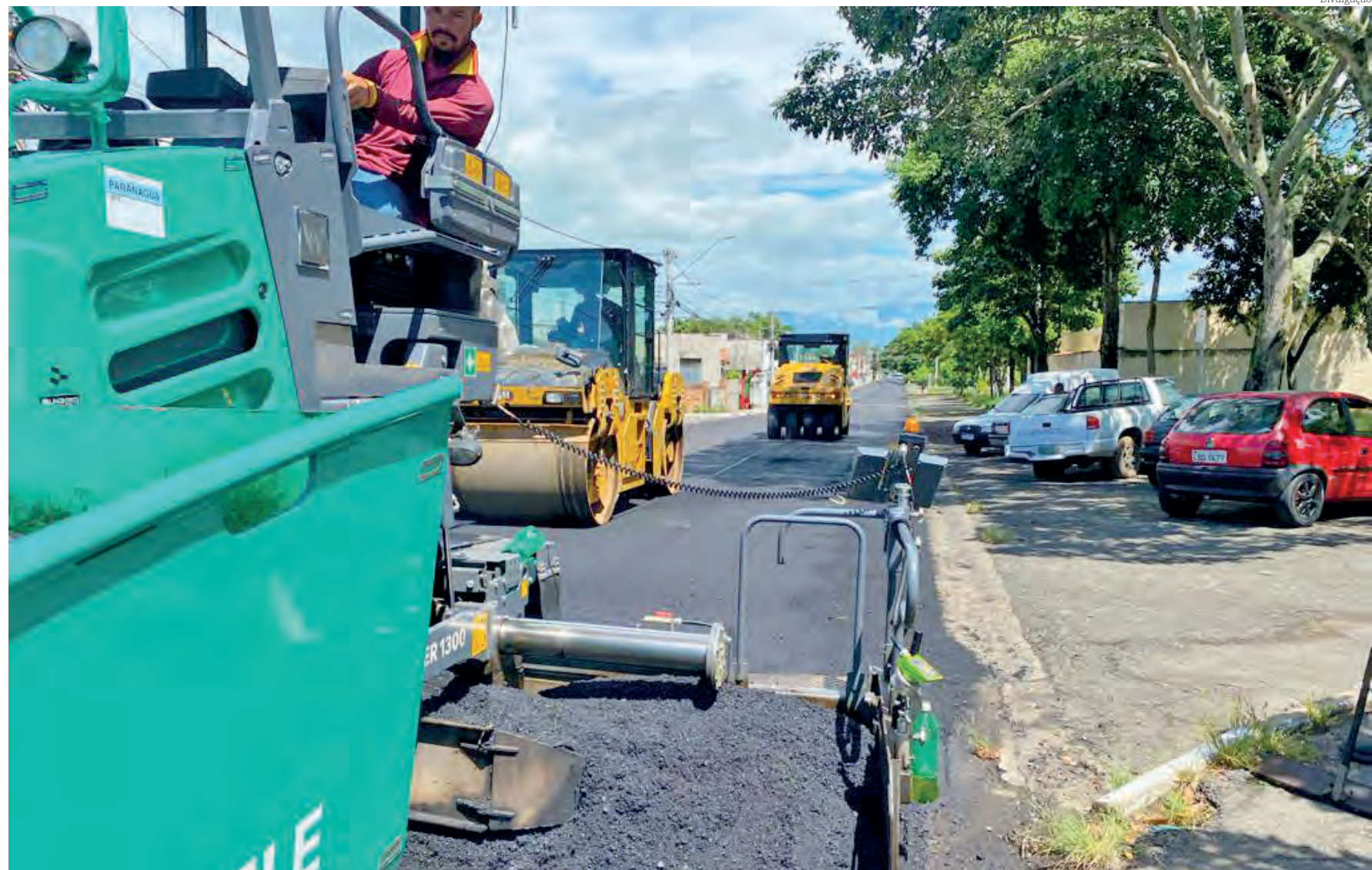
Ao todo, serão investidos mais R$ 12,6 milhões em recapeamento de mais 25 quilômetros de vias, totalizando 71 ruas e avenidas