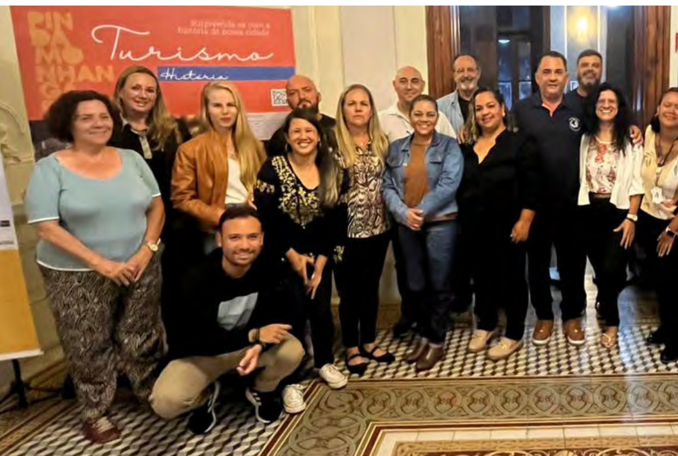
Membros e presidente da nova diretoria do Comtur, e integrantes da Secretaria de Turismo e Cultura da prefeitura