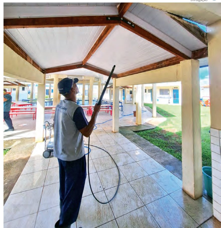
Preparativos incluem treinamento de professores e melhorias nas escolas que acolherão cerca de 14 mil alunos