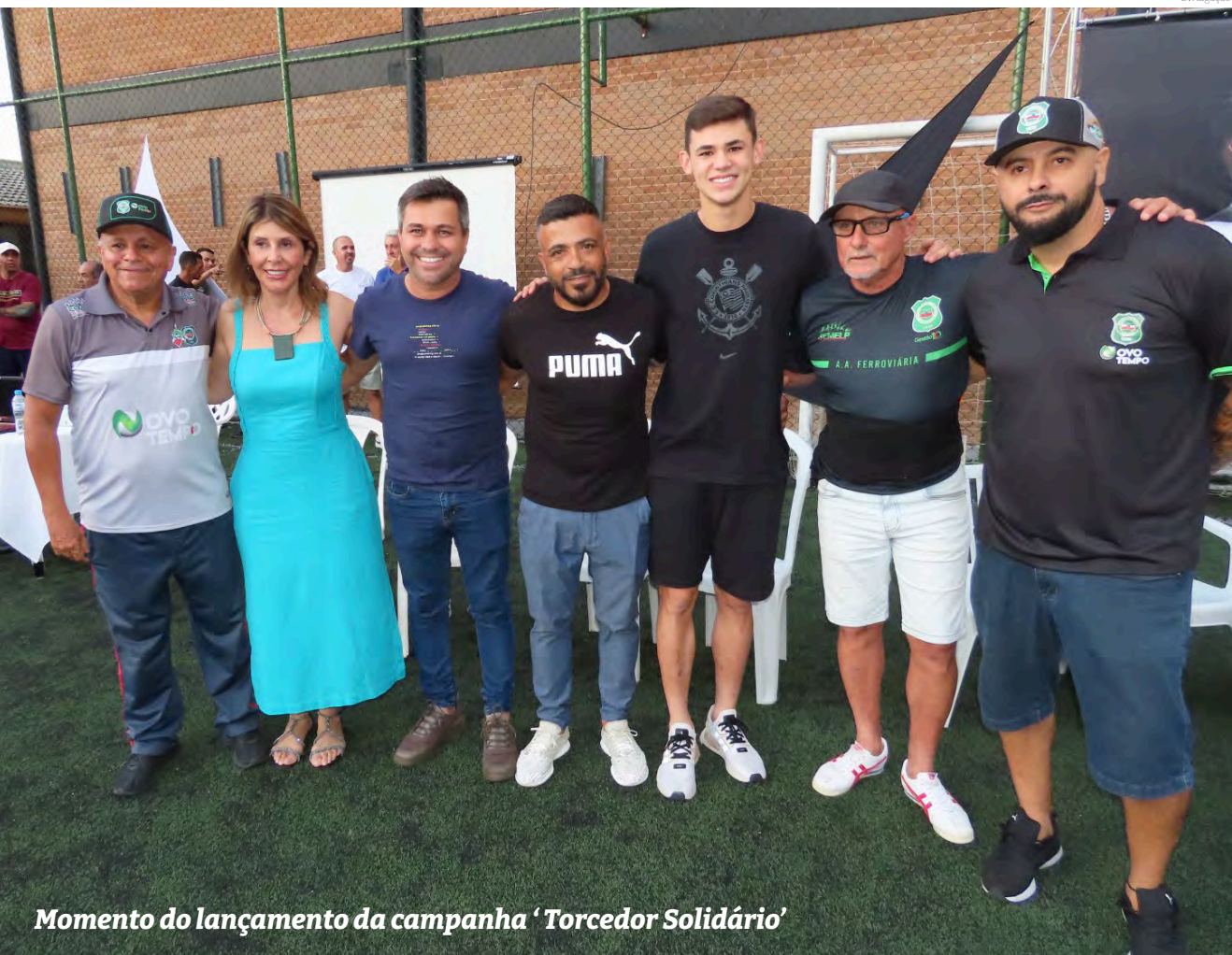
Momento do lançamento da campanha 'Torcedor Solidário'

A campanha 'Torcedor Solidário' é uma iniciativa importante para ajudar famílias carentes da cidade. A arrecadação de arroz irá beneficiar famílias que estão passando por dificuldades financeiras e também diversas entidades que precisam de ajuda para arrecadar alimentos.