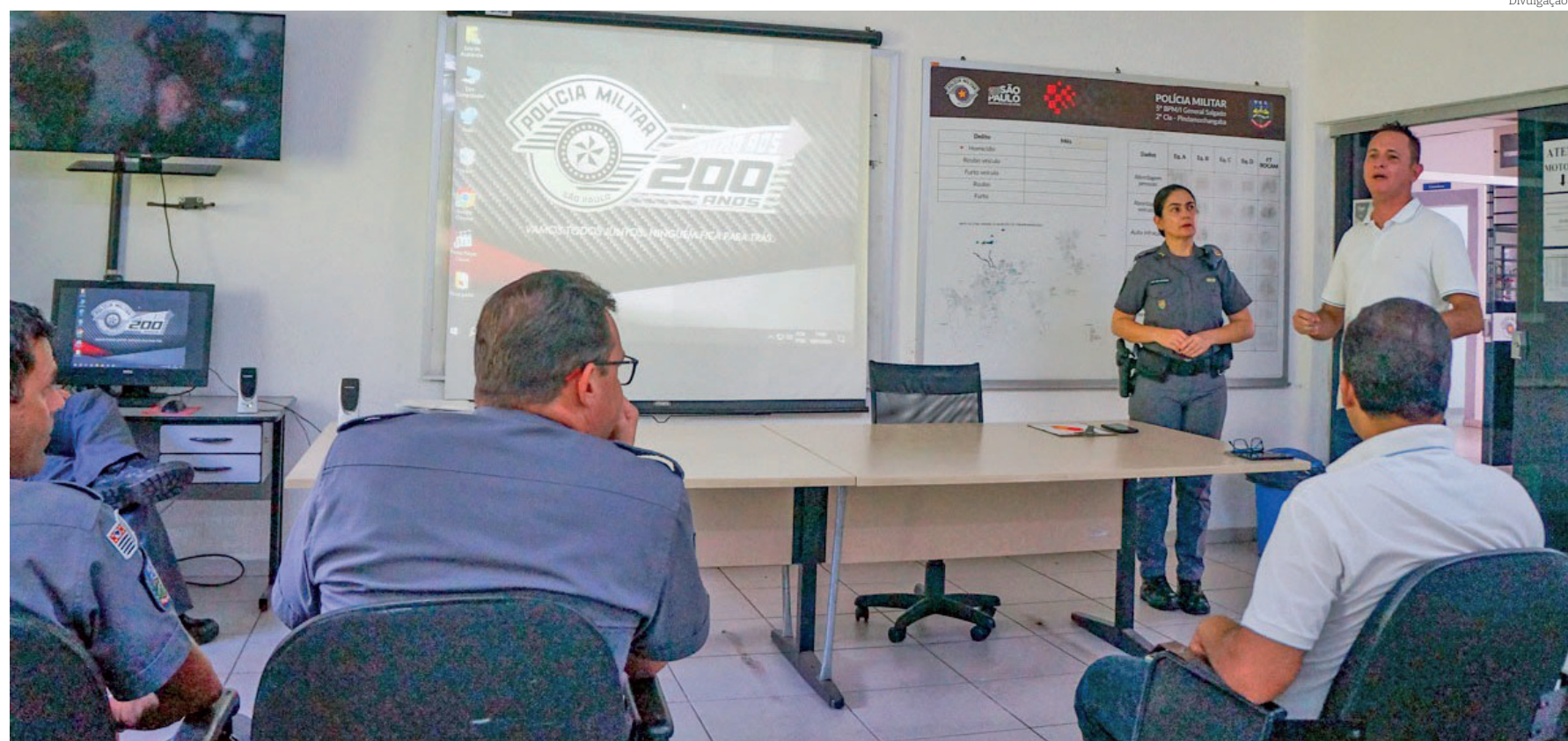
Os últimos detalhes foram definidos em reunião realizada entre a Polícia Militar e a Prefeitura na última quarta-feira (10)

Assim, a 'Arena do Carnaval' receberá já no dia 27 de janeiro o concurso da Corte do Carnaval 2024, na sequência, de 1 a 4 de fevereiro, o Festival de Marchinhas, e de 10 a 13, as matinês e matinoites de Carnaval. Os des-