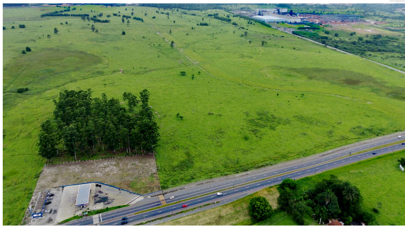
A Avenida Estrutural receberá investimentos estimados em R$ 20,7 milhões, a maior realização na área pelo município nos últimos anos

“Já apresentamos o projeto ao vice-presidente Geraldo Alckmin e aos ministérios envolvidos em Brasília e estamos recebendo retorno positivo. O crescimento da cidade está intenso e temos que pensar de forma visioná-