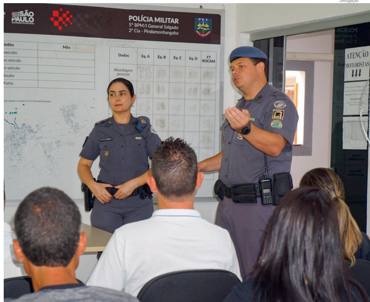
As providências foram definidas após reuniões entre a Prefeitura e a Polícia Militar