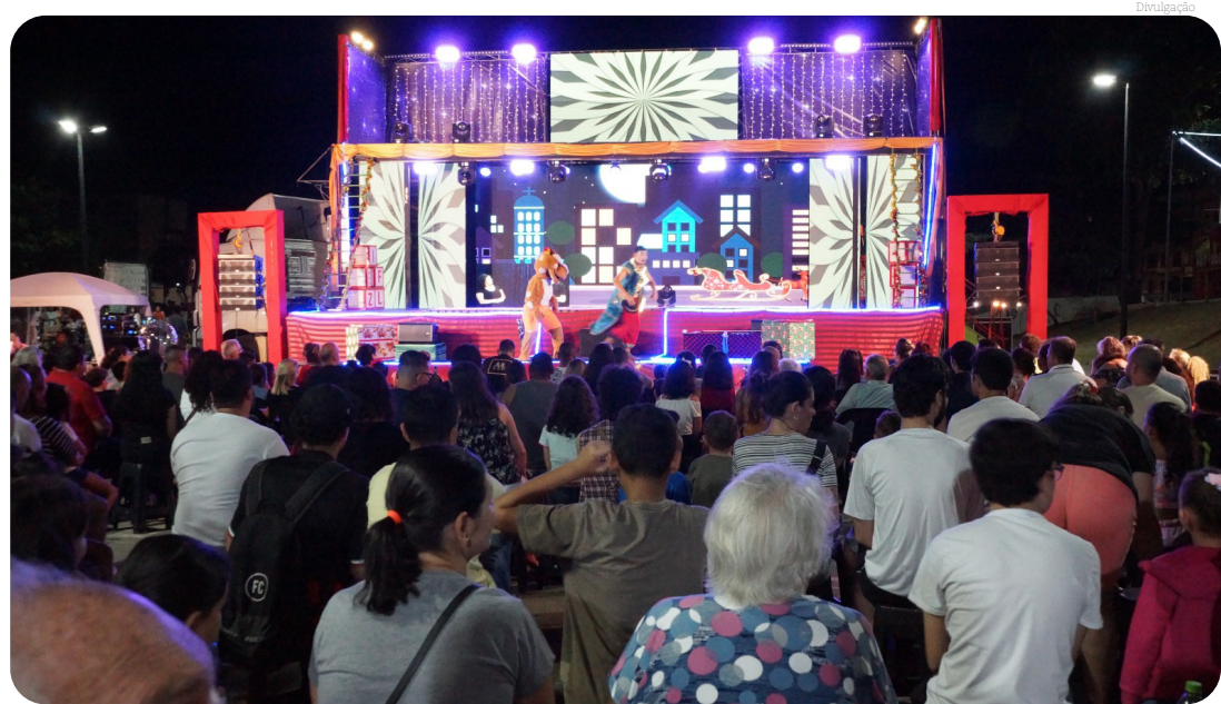
O público lotou a Praça da Bíblia para conferir o teatro