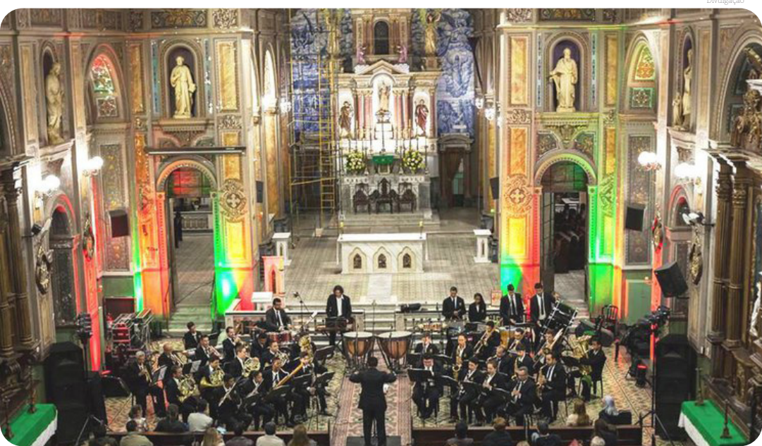
Uma das apresentações da Banda Euterpe na Igreja Matriz