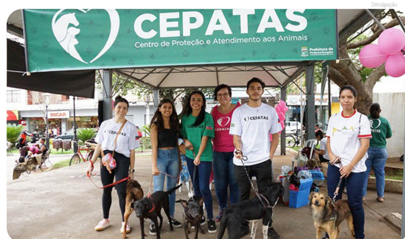
O Cepatas realiza mais um evento para conscientizar a população do cuidado com os pets

Ela explicou que "além da vacinação no Natal Animal, quem quiser pode levar os animais de estimação para serem vacinados contra raiva diretamente no Cepatas, às terças-feiras e quintas-feiras, na Estrada Municipal do Maçaim, ao lado do Escoteiros Itapeva.