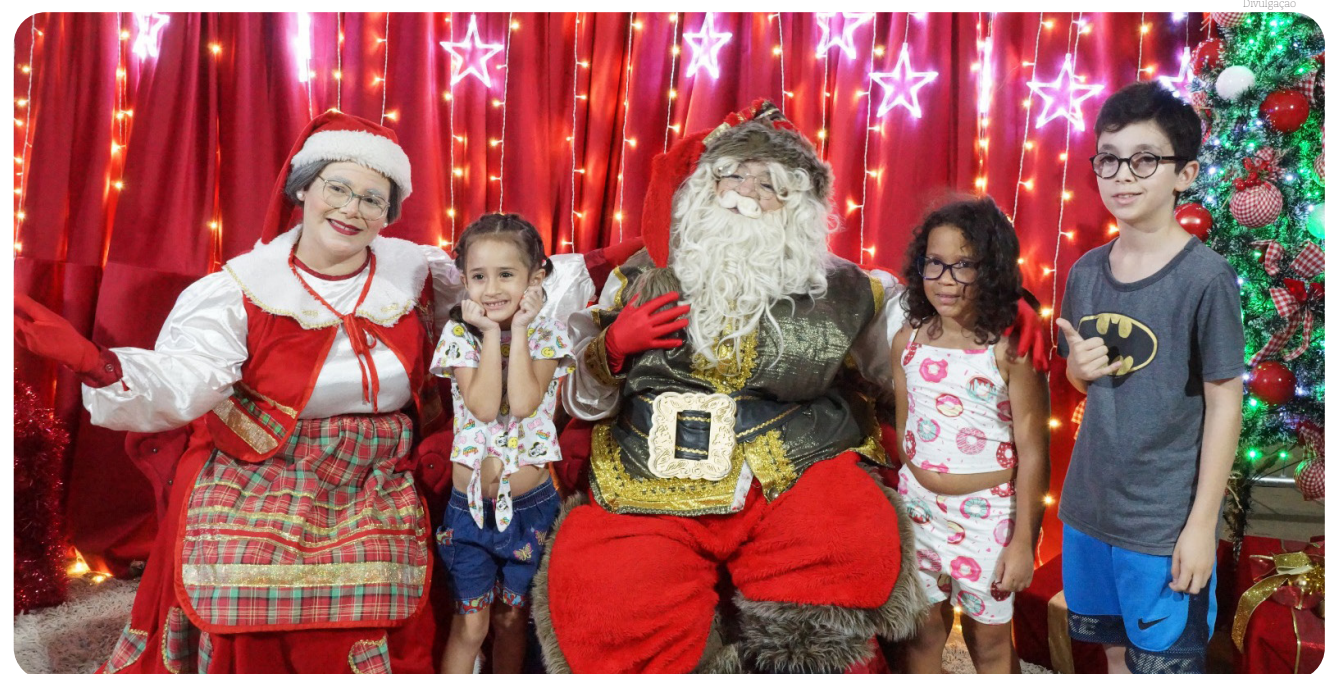
O casal Noel está sempre recebendo as crianças com muito carinho