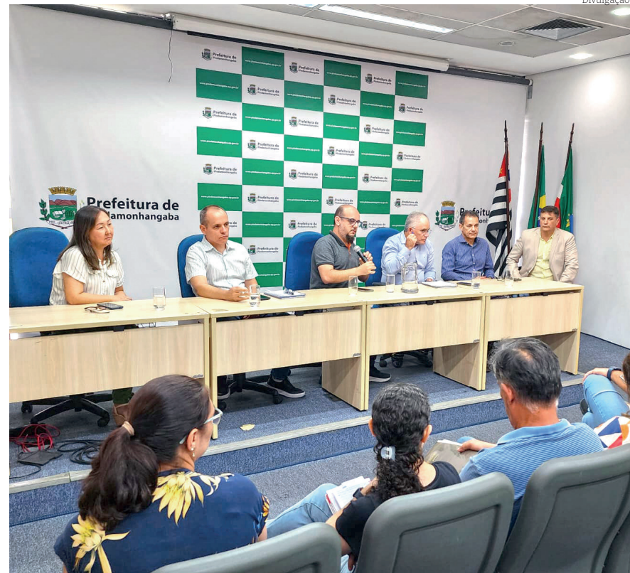
Encontro na última terça-feira (13) tratou das demandas do setor