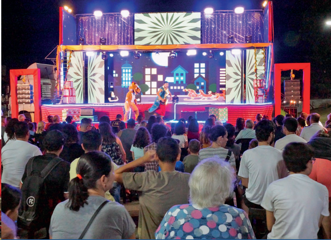
Casal Noel recebeu as crianças e peça de teatro divertiu o público na Praça da Bíblia