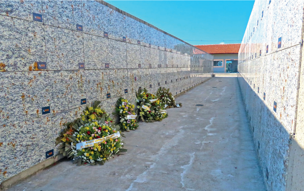
O novo cemitério em Moreira César utiliza um moderno sistema de sepultamento, ecologicamente correto, por meio de decomposição aeróbica assistida por calor e baixa pressão