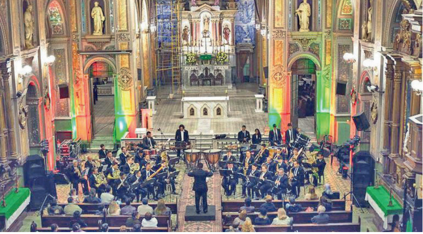
A Corporação Euterpe se apresenta neste sábado (16), na Matriz