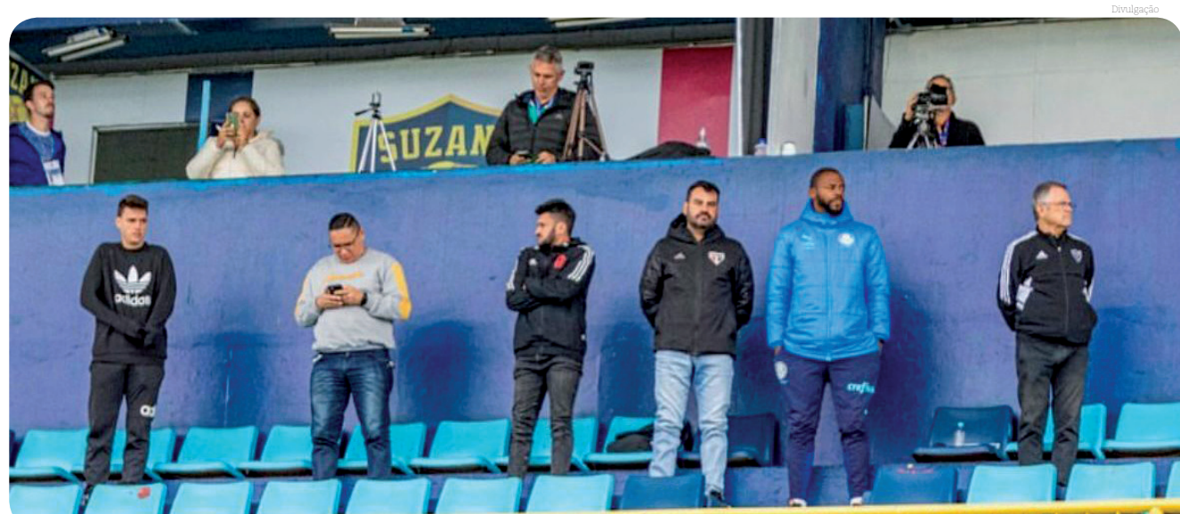
Cruzeiro, RedBull Bragantino, Flamengo, São Paulo, Palmeiras e Atlético Mineiro