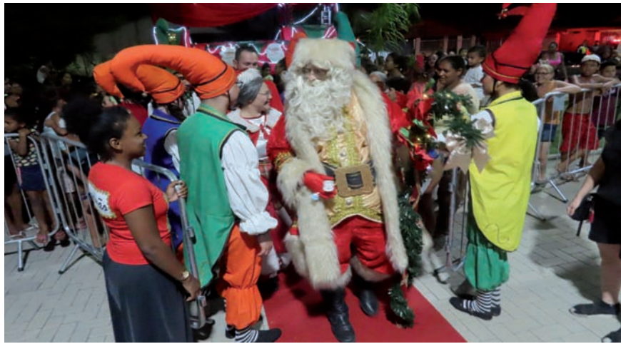
O 'Natal Encantado' continua neste fim de semana com muitas atrações

Além das chegadas do Papai Noel, a programação do Natal