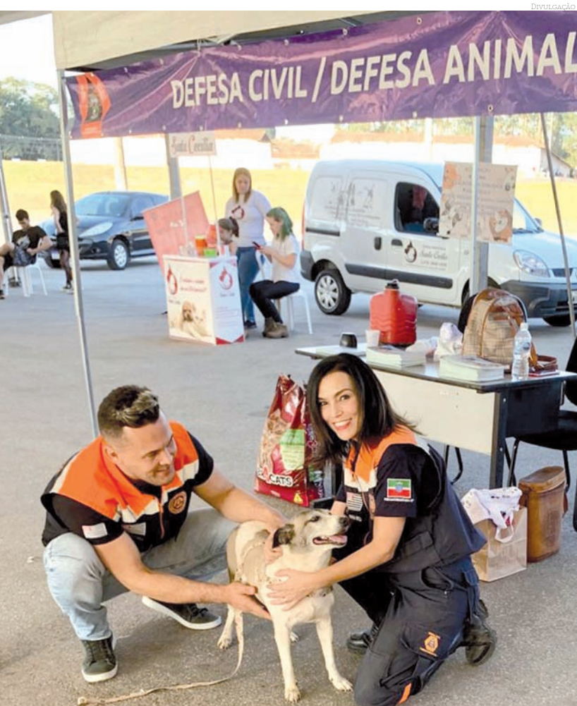
Mais uma edição do encontro que busca a conscientização da população quanto aos pets