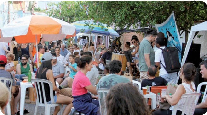
No evento pode-se encontrar muitos presentes para o Natal

Vem aí mais uma edição da 'Feira da Vila'! Ela acontece neste sábado, dia 09 de dezembro, no Bosque da Princesa, das 10h às 21h. A programação está repleta de atrações, incluindo prática de Yoga, música, artesanato, oficinas e até a presença do Papai Noel.