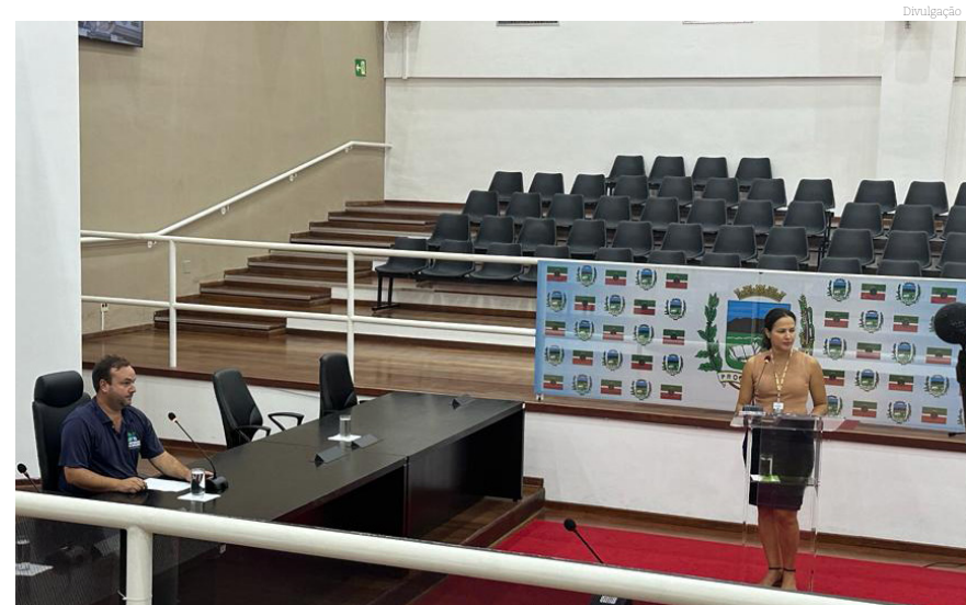
Cinco principais pontos foram apresentados durante a audiência pública

A audiência pública de apresentação da Revisão/Atualização do Plano Municipal de Saneamento Específicos dos Serviços de Abastecimento de Água Potável e Esgotamento Sanitário, dos municípios regulados e fiscalizados pela Agência Reguladora de Serviços Públicos do Estado de São Paulo (ARSESP), foi realizada no dia 1º de dezembro, no auditório da Câmara Municipal de Vereadores de Pindamonhangaba.