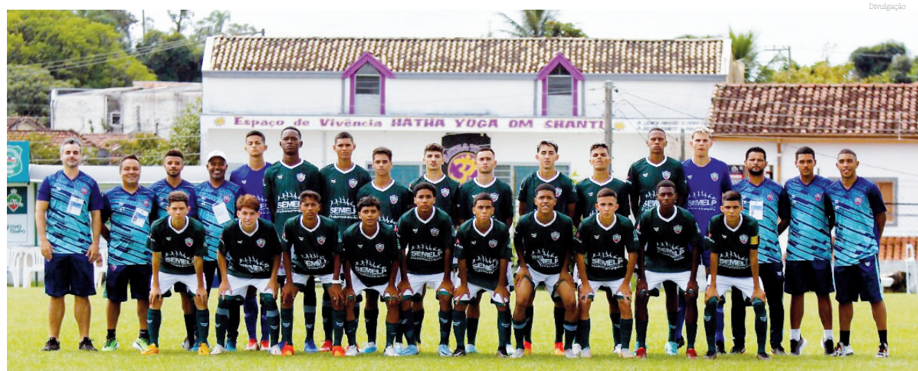
Equipe Sub 17/ Pinda FC