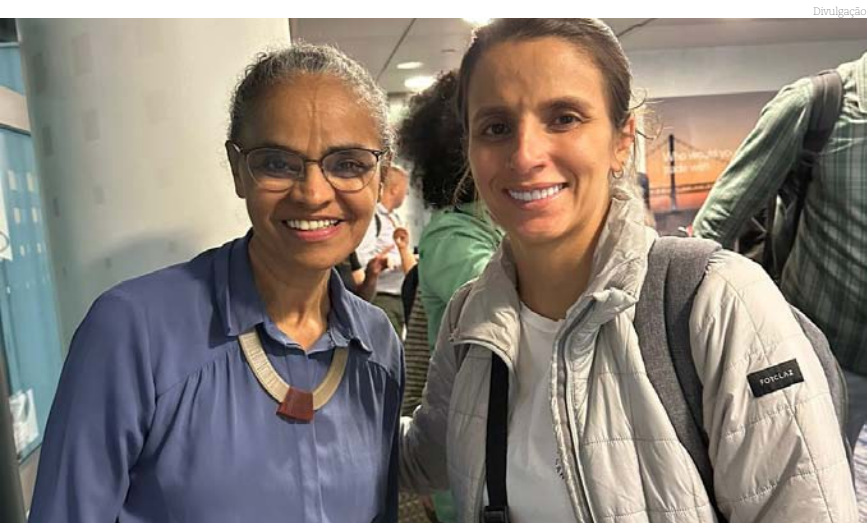
Ministra do Meio Ambiente - Marina Silva