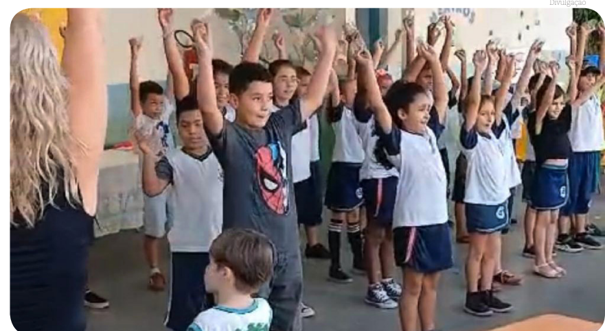
Estudantes comprometidos e engajamento das escolas foram evidenciados

O prefeito Dr. Isael Domingues, destacou conversas com representantes de estados e municípios. "É um momento muito importante para todos. Temos aqui na COP28 representantes de todo o mundo, governantes e técnicos, cientistas debatendo o aquecimento global e o futuro do planeta. Além de acompanhar essas discussões, também aproveitamos para estreitar relações e debater assuntos com membros de prefeituras e governos estaduais, governo federal, órgãos e agências do governo. Nessas conversas nós trocamos experiências, discutimos questões que temos em comum, podemos entender como cada local age em determinada situação e isso tem sido muito positivo, muito proveitoso para balizarmos nossas ações e avaliarmos decisões a serem tomadas na área do meio ambiente e sustentabilidade. Temos muito a aprender uns