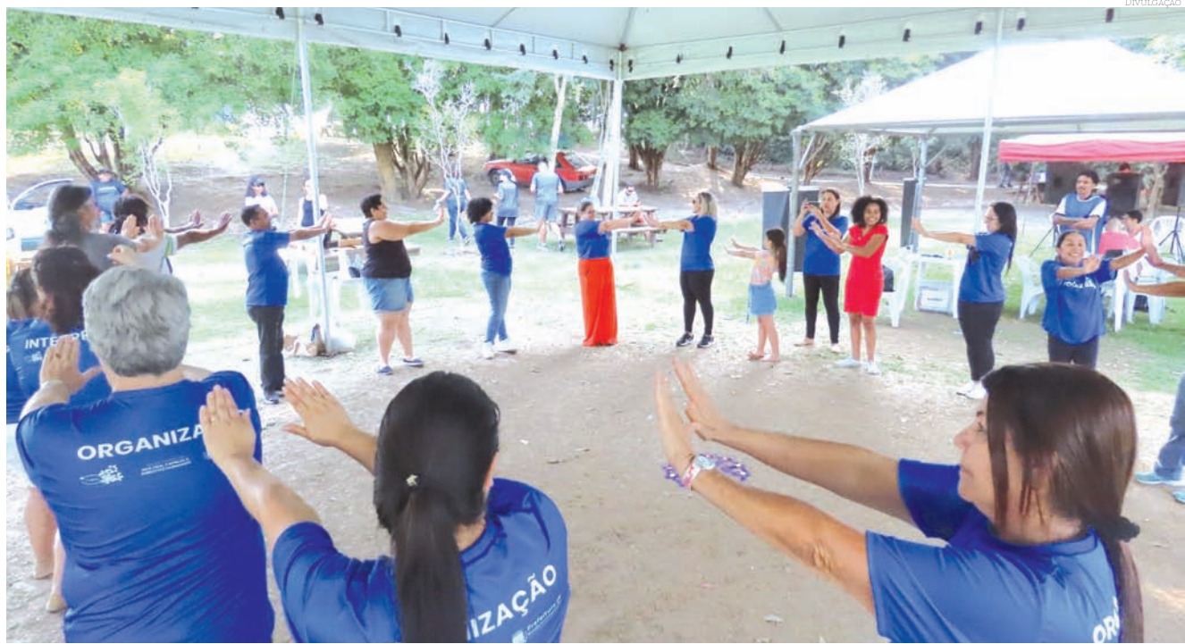
As atividades prometem movimentar ainda mais o Parque da Cidade neste sábado