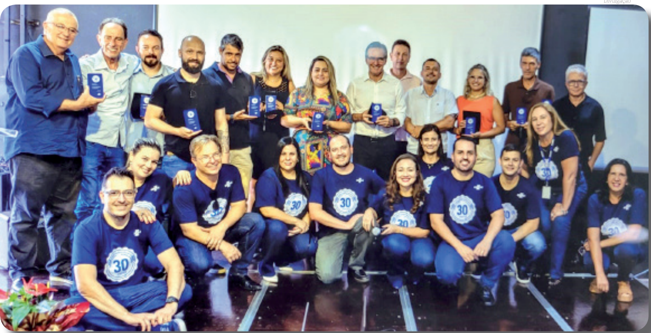
Mais de 20 municípios da região do Sebrae de Guaratinguetá foram homenageados