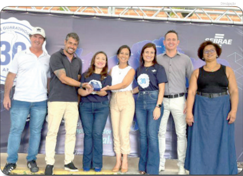
Representantes de Pinda participaram do evento