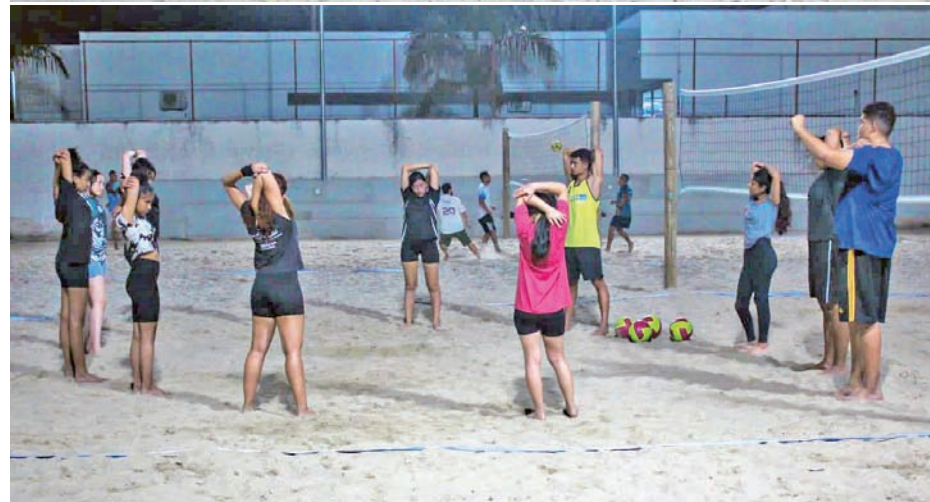
As aulas de vôlei acontecem no João do Pulo, às terças e quintas-feiras