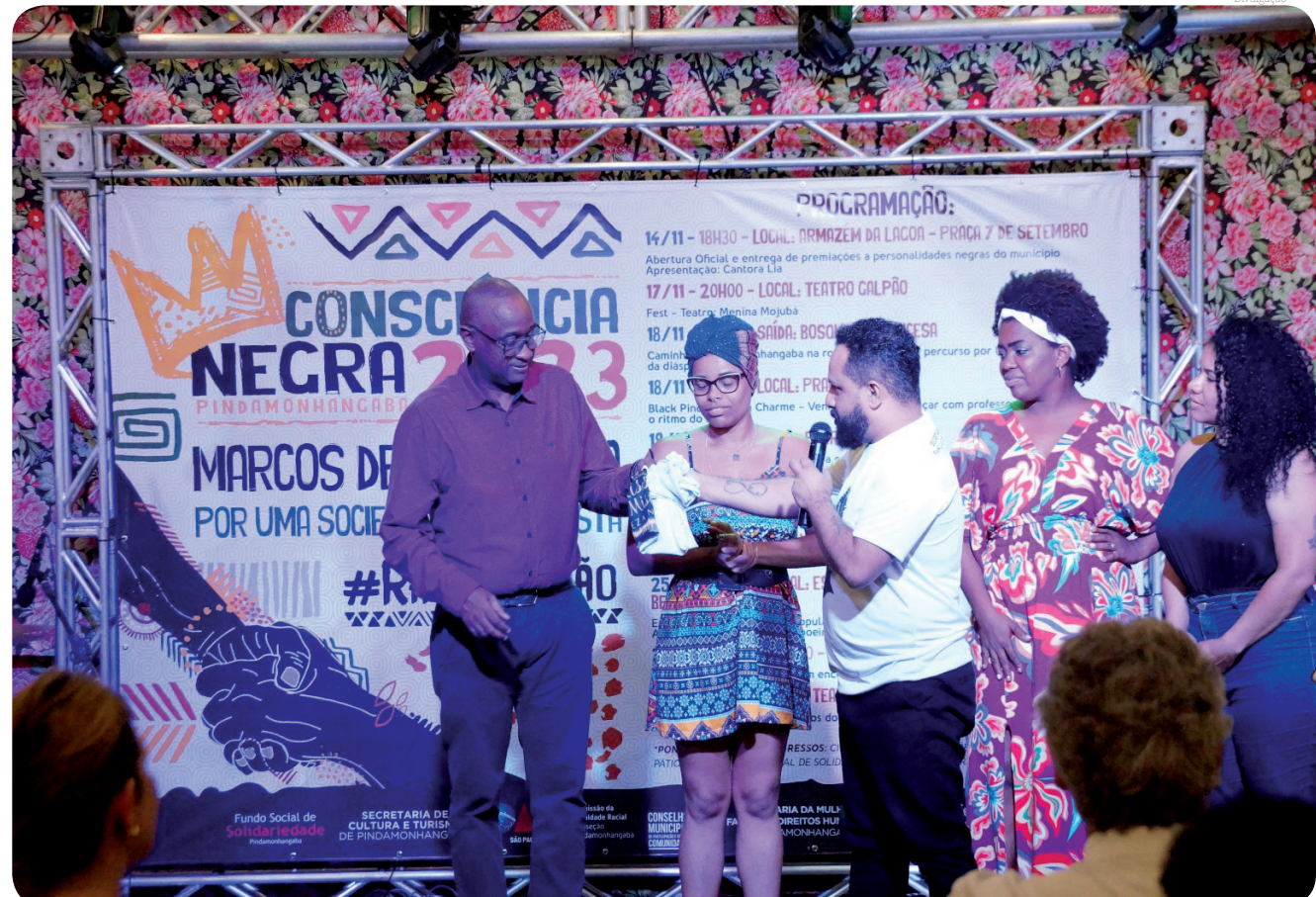
Momento de abertura das atividades do Mês da Consciência Negra