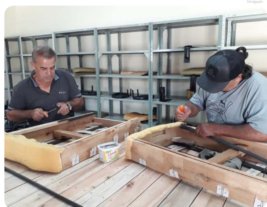
... e com isso, melhorar as condições financeiras dos participantes