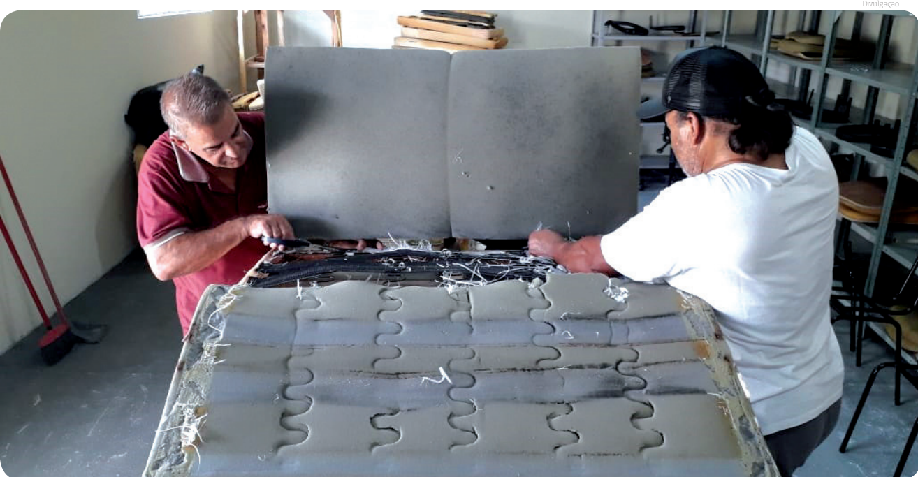
O curso de Tapeçaria vai ensinar técnicas de recuperação de sofás usados...

O Fundo Social de Solidariedade (FSS) de Pindamonhangaba deu início a um projeto inovador neste mês de novembro, unindo aspectos sociais, ambientais e empreendedores. Por meio das oficinas profissionalizantes do Projeto Reinvente, foi lançado o curso de Tapeçaria, uma iniciativa que visa qualificar indivíduos interessados na área, melhorando as condições de suas rendas familiares. Além disso, o projeto tem um olhar socioambiental, ao receber sofás usados para restauração e posterior doação às famílias de baixa renda.