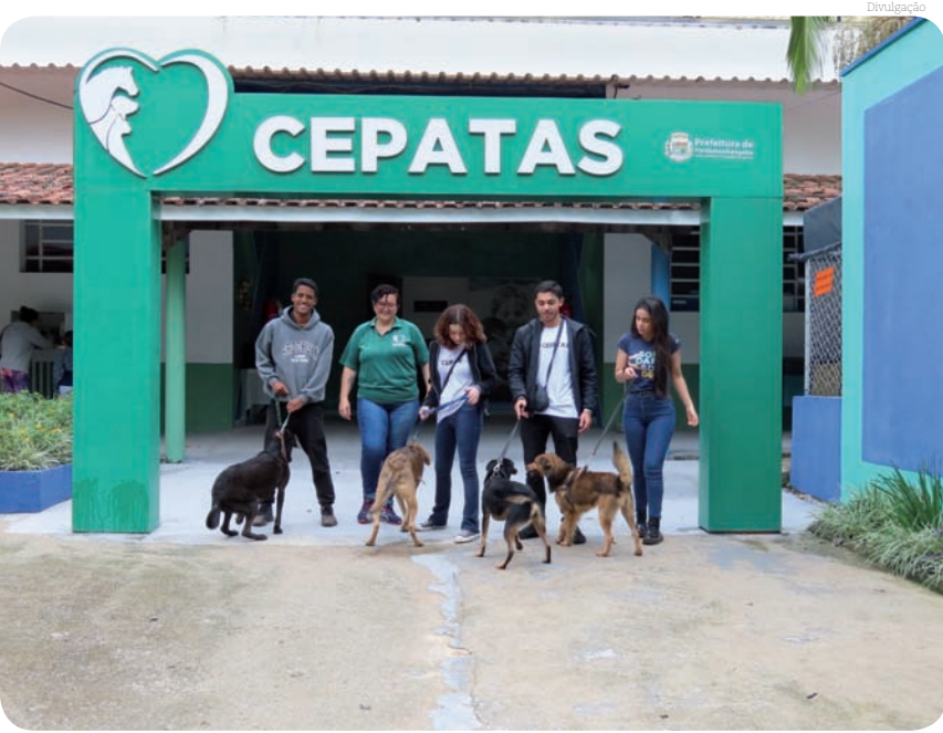
O encontro buscou conscientizar os participantes quanto à responsabilidade com os pets

O Cepatas (Centro de Proteção e Atendimento aos Animais) de Pindamonhangaba promoveu, no último sábado (25), uma feira de adoção de cães e gatos, além de ações de conscientização sobre câncer de mama animal e inscrições para cirurgias de castração de cães e gatos - previstas para ocorrer nos dias 16 e 17 de dezembro, no Shoping Pátio Pinda.