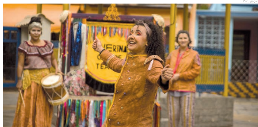
Peça 'Onde anda o Boi Jacá?'