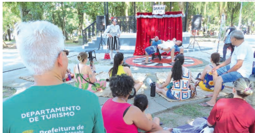
Público compareceu ao Bosque da Princesa

"Temos recebido críticas positivas por parte da população. Com a variedade no estilo, nos temas das peças, temos conseguido abranger um volume maior de pessoas", avaliou. Para assistir aos espetáculos que ocorrem nos ambientes fechados, os interessados devem retirar os ingressos gratuitamente, com uma hora de antecedência do início da peça, na bilheteria do local.