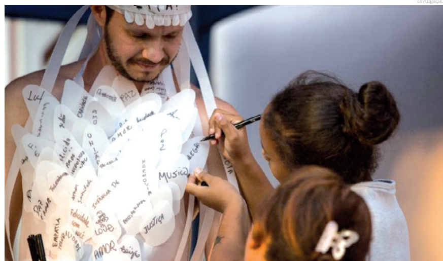
Palestra 'Recursos sensoriais como metodologia de ensino'