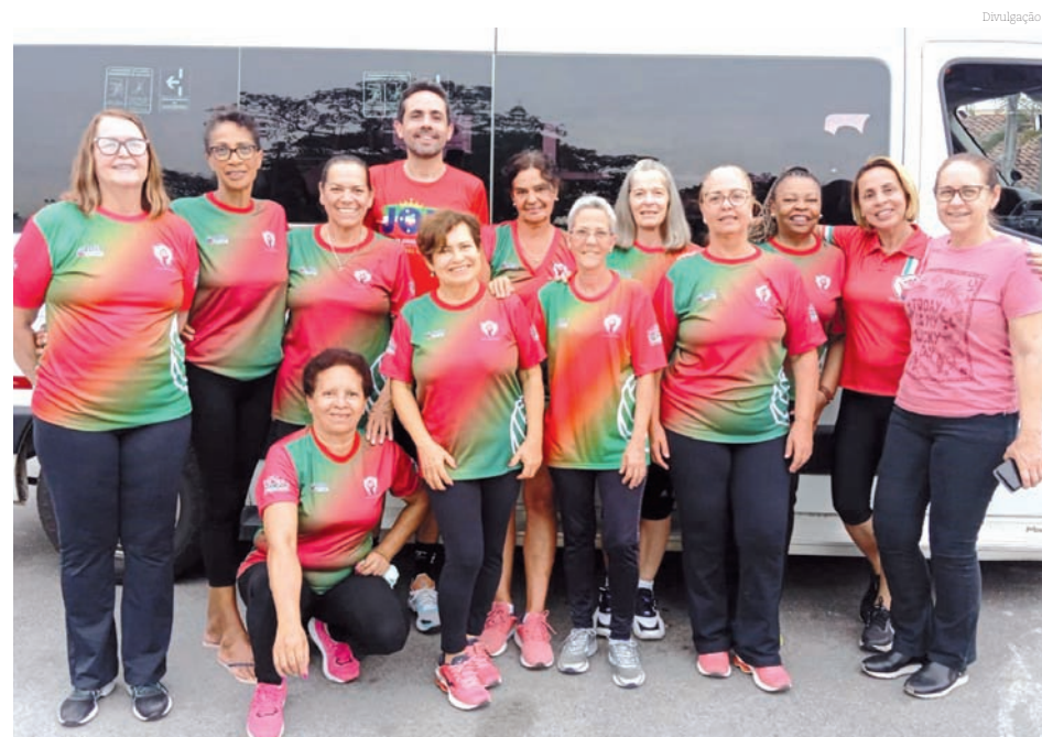
Equipe 58+ feminino, uma das representantes de Pinda na Série Prata