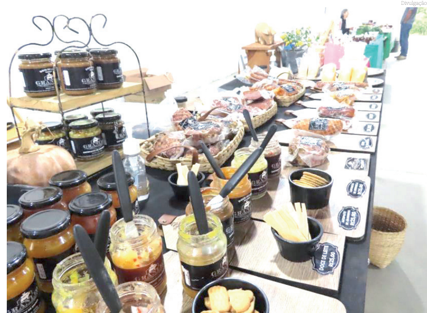
A feira contou com a participação de diversos produtores locais, que ofereceram uma variedade de produtos frescos e de qualidade, como hortifrutti, flores, queijos, doces, artesanato e outros.