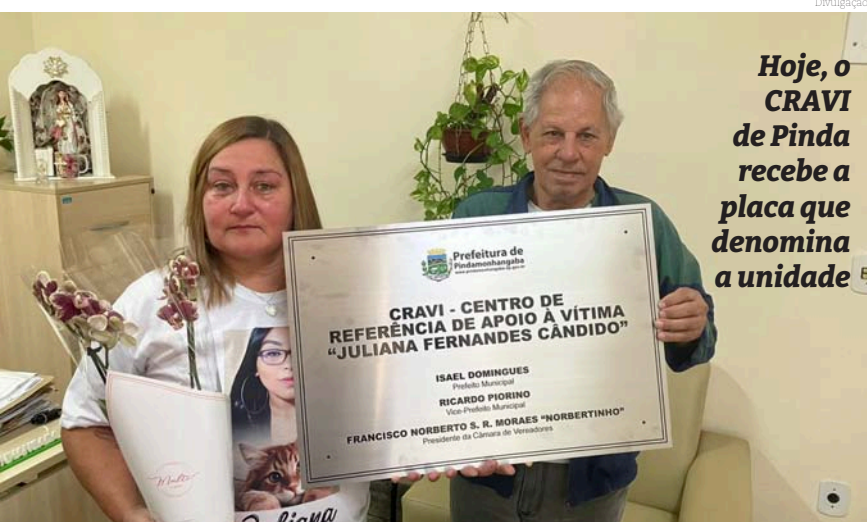
Hoje, o CRAVI de Pinda recebe a placa que denomina a unidade

Implantado oficialmente em 6 de junho de 2022, o Cravi (Centro de Referência e Apoio à Vítima) já atendeu em Pindamonhangaba 132 famílias vítimas de algum tipo de violência. O equipamento é um programa da Secretária de Justiça do Estado de São Paulo, em parceria com Prefeitura de Pindamonhangaba, através da Secretaria de Assistência Social e conta com apoio do Ministério Público.