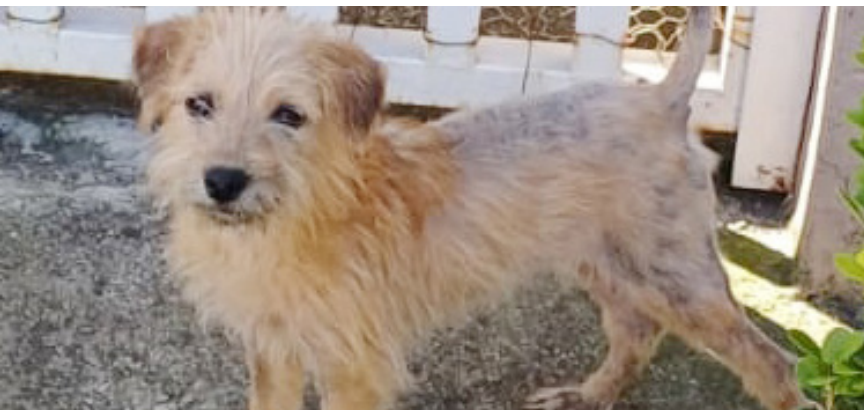
O animal maltratado foi resgatado

A Defesa Civil e Animal da Prefeitura de Pindamonhangaba realizou mais uma ação de combate a maus tratos de animais no município. Na tarde da última quarta-feira (8), após receber denúncia de maus tratos, a equipe se dirigiu ao bairro Jardim Eloyna e constatou as condições precárias que os tutores abrigavam três cães.