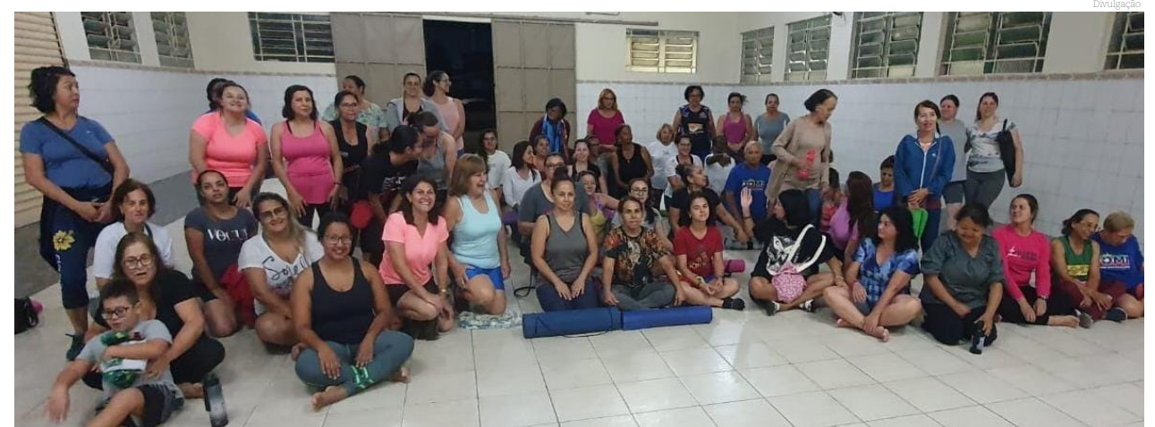
A aula inaugural de yoga teve a presença de muitas pessoas