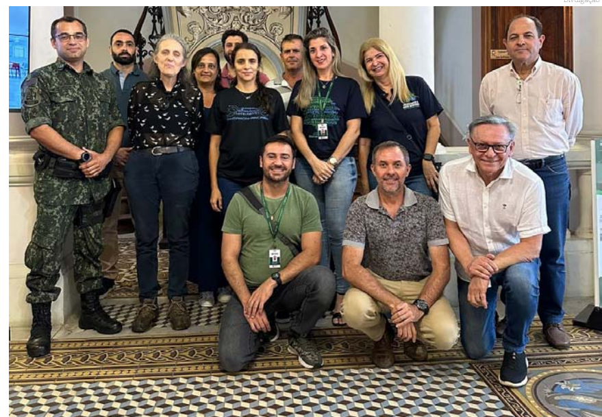
A reunião discutiu as demandas da Política Municipal de meio Ambiente

“Durante 2 anos, a Secretaria de Meio Ambiente foi responsável pela limpeza pública da cidade. Essa experiência