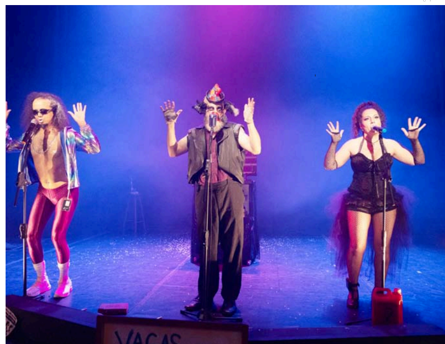
Klaus Arrependimentos Artísticos - Show De Variedades Ilícitas

Espetáculos de Sábado - No sábado (11), a programação do FESTE começa a partir das 7h30, na Praça Monsenhor Marcondes, onde o grupo Hare Krishna, da Fazenda Nova Gokula, irá realizar o "Ratha Yatra Desfile pela Paz". Às 15h, no Bosque da Princesa, o grupo Damião e Cia de Cam-