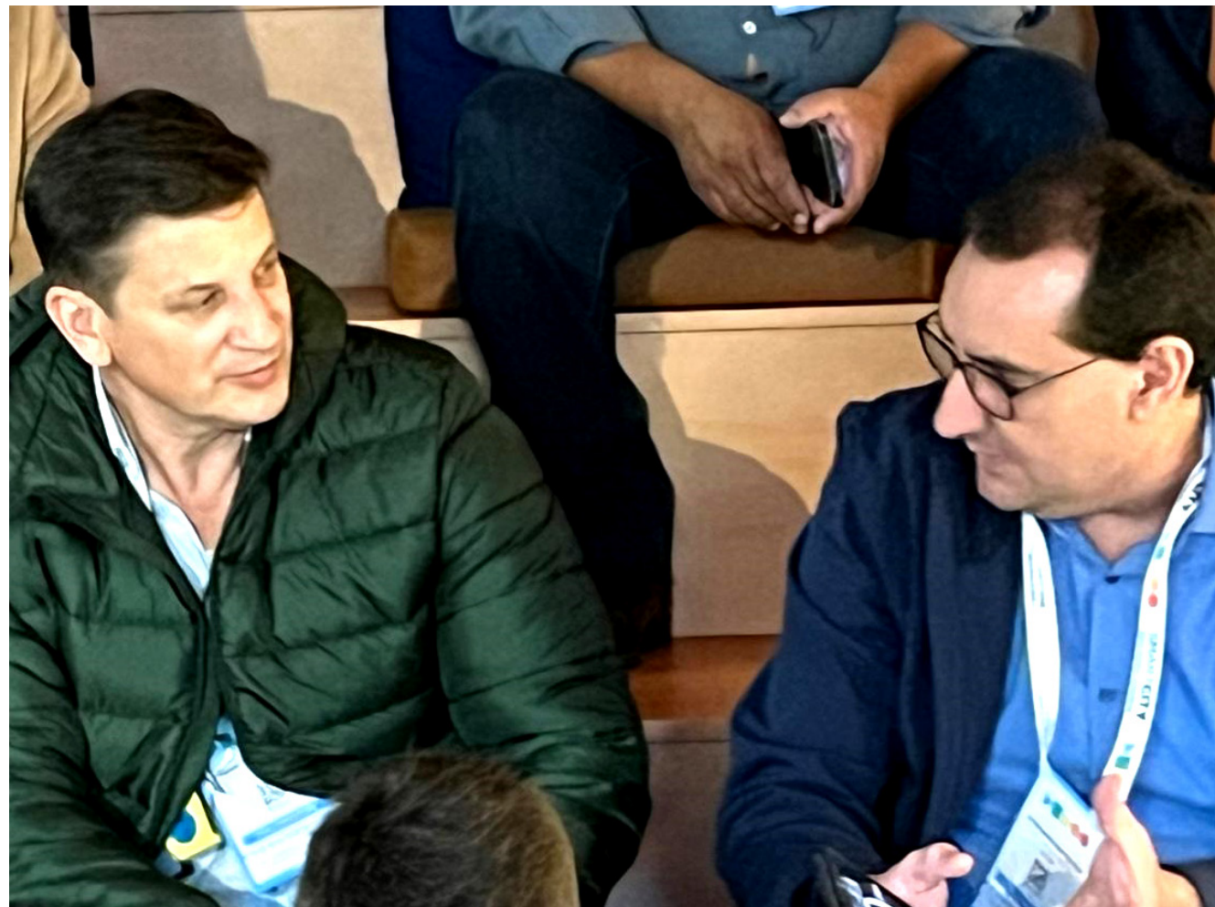
A troca de informações vem sendo muito importante para a gestão de Pindamonhangaba