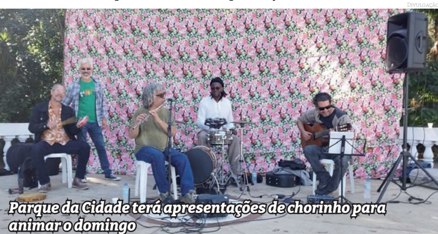
Parque da Cidade terá apresentações de chorinho para animar o domingo