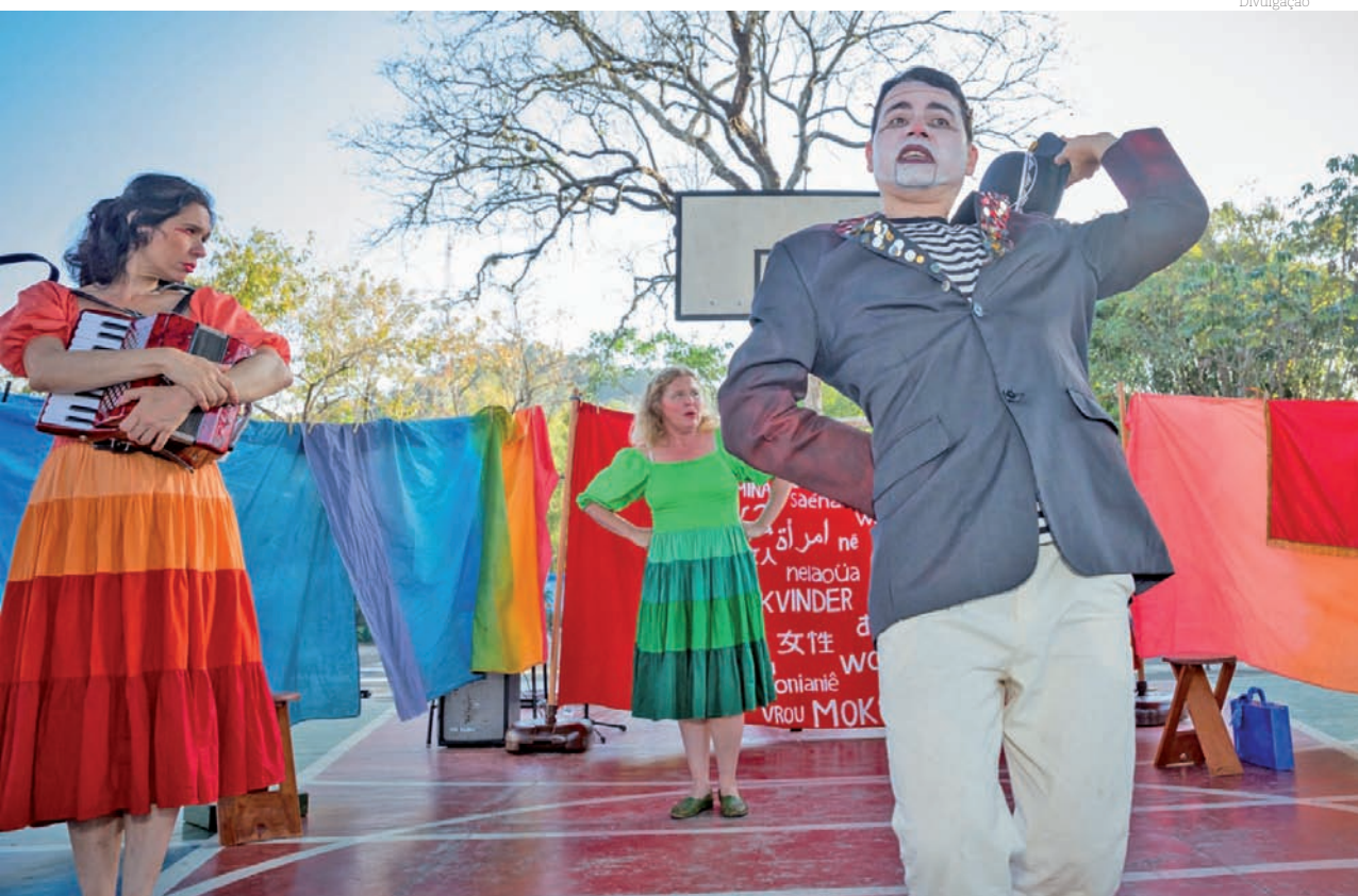
No domingo, às 15 horas, o Grupo Teatro do Improvado apresenta 'No Quintal do Mundaréu'