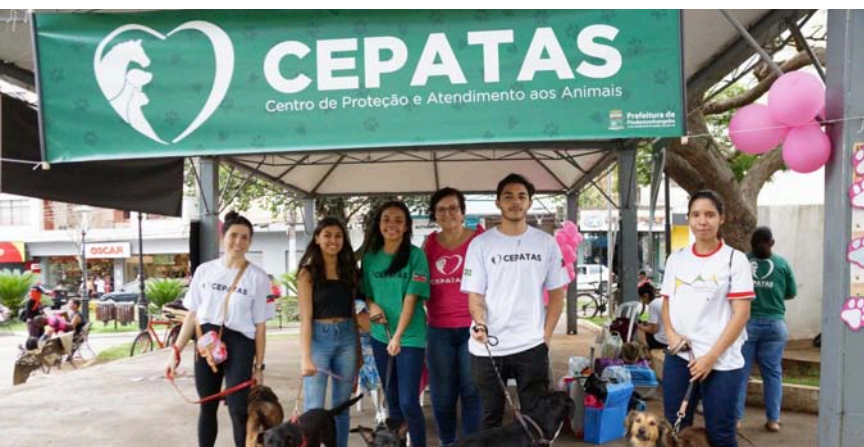
O Expopet é uma oportunidade de participar de várias ações para os pets

Pindamonhangaba vai realizar a segunda edição da ExpoPet neste sábado (11), das 9 às 15 horas, na Praça do Cisas, em Moreira César.