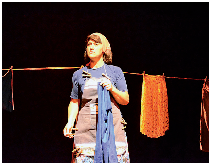
A apresentação dos poemas acontece no dia 4

O Festipoema é uma parceria entre a Secretaria de Cultura e Turismo de Pindamonhangaba e a Academia Pindamonhangabense de Letras, foi criado em 2007 e visa estimular a criação poética, valorizar e divulgar a poesia, incentivar a arte da interpretação da Poesia, estimulando o interesse pelas manifestações artísticas