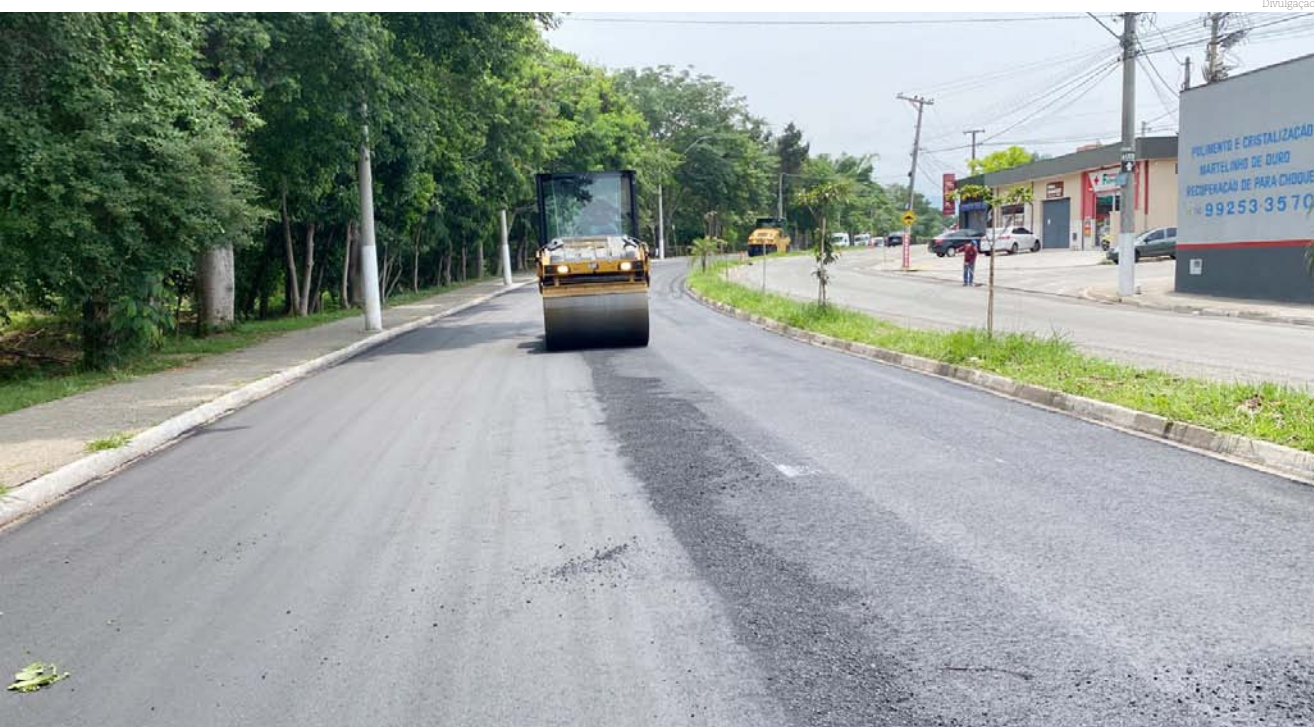
Obras de recapeamento asfáltico continuam em vários bairros

O programa de recapeamento asfáltico continua em ritmo acelerado e nesta semana as ações estão acontecendo na rua Manoel Ignácio Marcondes Romeiro, em toda sua extensão de 1,4 quilômetro.