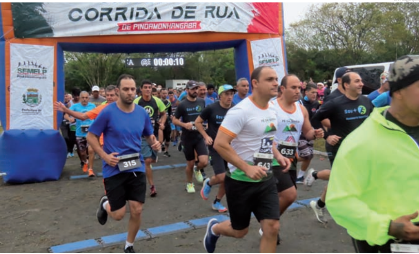
Mais uma etapa de Corrida de Rua em Pinda

A Secretaria de Esportes e Lazer da Prefeitura de Pindamonhangaba vai abrir inscrições para a 4ª Etapa Circuito de Corrida de Rua 2023 na próxima semana.