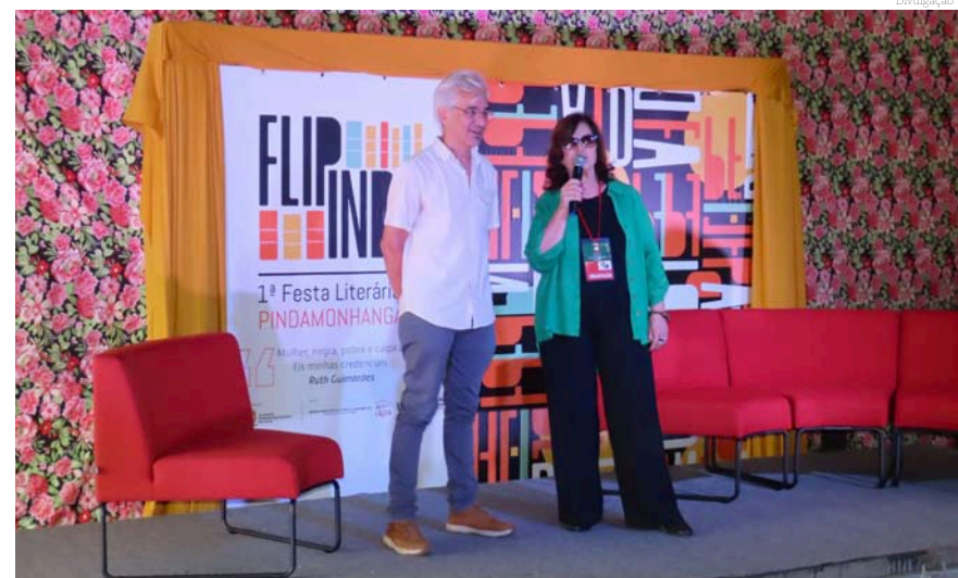
O lançamento do edital Paulo Gustavo foi feito durante a Flipinda

Ao se inscrever, os agentes culturais deverão indicar uma contrapartida social que deverá ser realizada em até seis meses após a conclusão do projeto. Além disso, eles são obrigados a