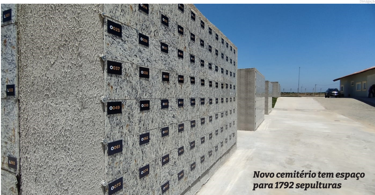
Novo cemitério tem espaço para 1792 sepulturas

Para mais esclarecimentos, o munícipe pode entrar em contato através do telefone 3642-7090 (Cemitério Centro) ou 3550-0387 (Cemitério Moreira César).