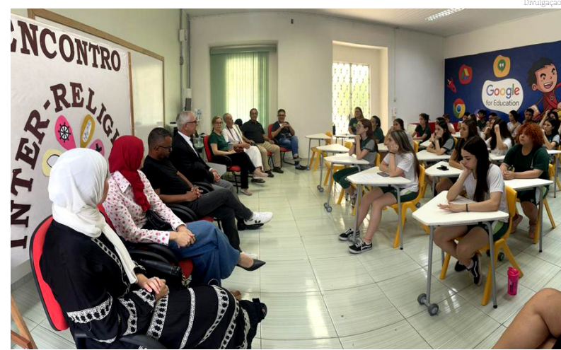
Líderes religiosos e alunos do 9º ano do Colégio Bom Jesus

O Colégio Bom Jesus – unidade de Pindamonhangaba – realizou na tarde da última terça-feira, dia 31 de outubro, um Encontro Religioso, com vários líderes religiosos da cidade. O objetivo do encontro – um projeto do 9º ano do Ensino Fundamental – é apresentar a diversidade religiosa aos próprios alunos.