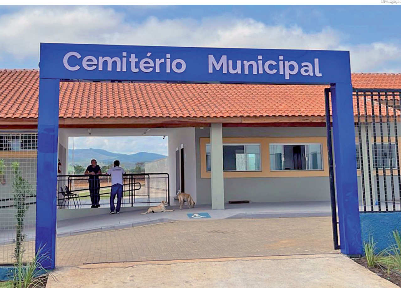
Em operação desde terça-feira (31), novo cemitério atenderá demanda por novos sepultamentos