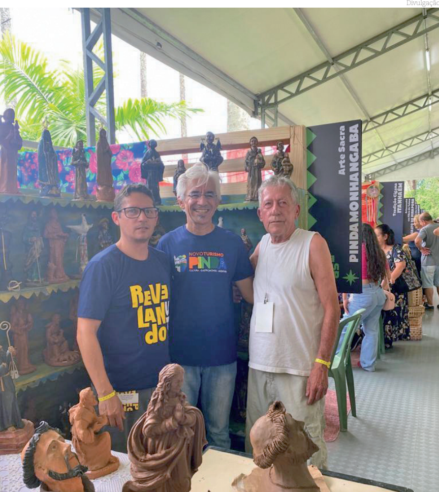
Pinda apresentou peças de arte sacra no 'Revelando São Paulo'