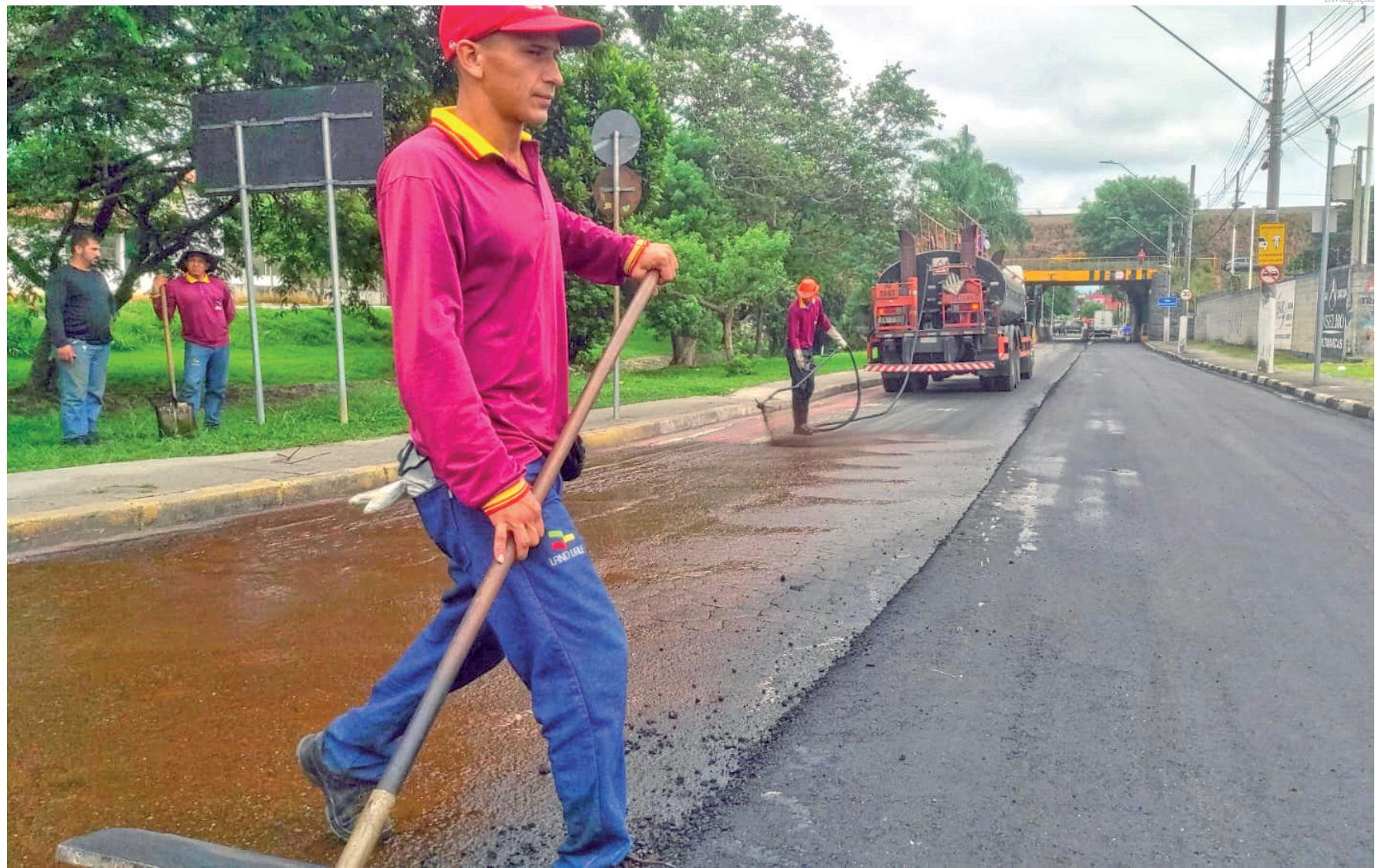
Somente neste ano, são R$ 53 milhões em asfalto novo para modernização de 65 km em 184 ruas e avenidas, beneficiando 26 bairros