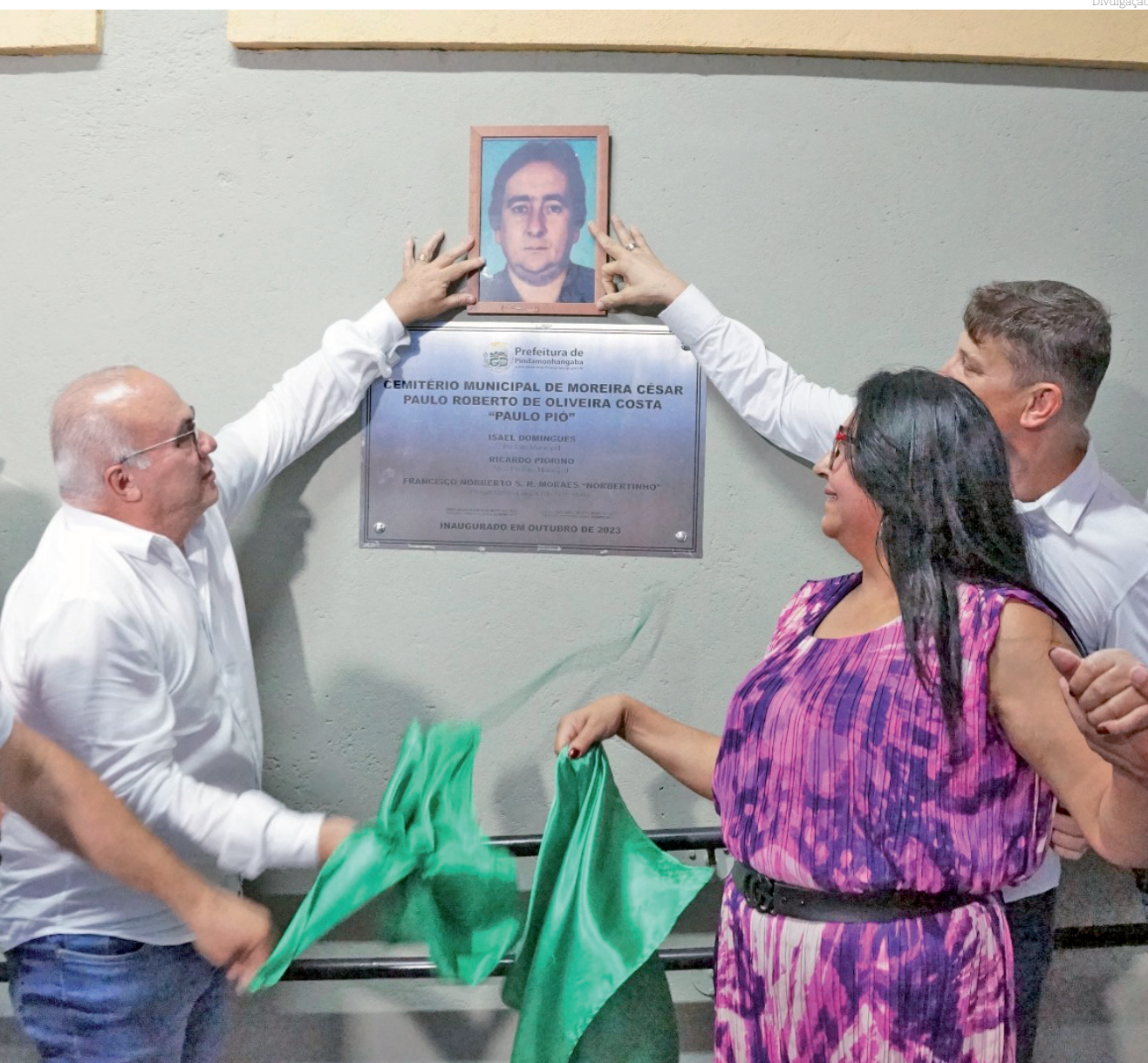
Momento de descerramento da placa de inauguração do Cemitério Municipal de Moreira César