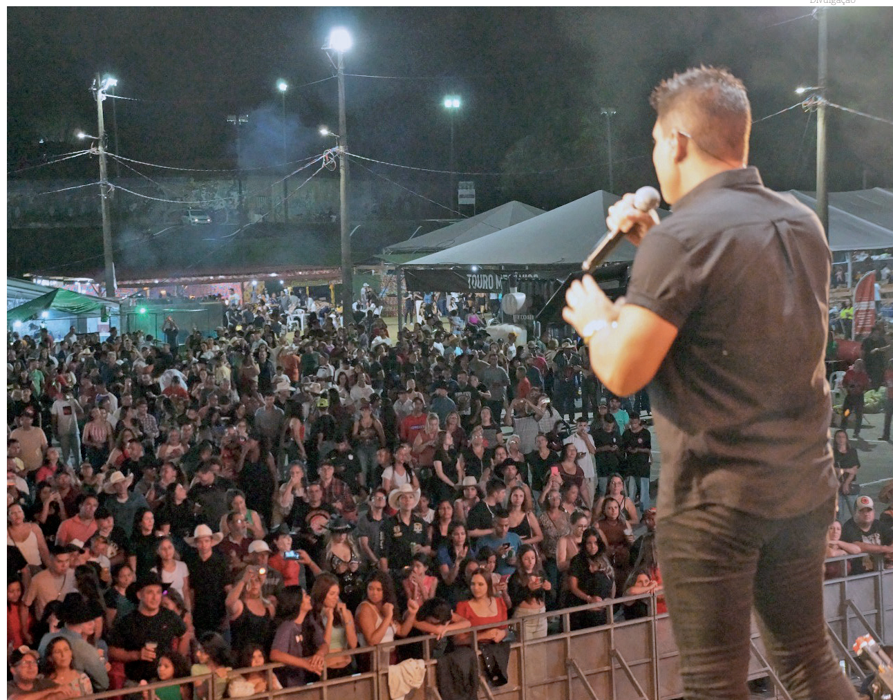
Grande público desfrutou das atrações apresentadas durante os três dias do festival