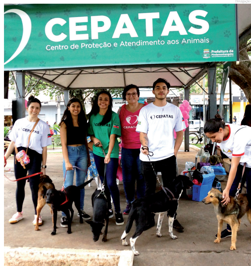
O Cepatas recebeu mais de 200 inscrições para castração

O Cepatas (Centro de Proteção e Atendimento aos Animais) de Pindamonhangaba promoveu, no último sábado (28), na praça Monsenhor Marcondes, uma feira de adoção de cães e gatos, além de ações de conscientização sobre câncer de mama animal e inscrições para cirurgias de castração de cães e gatos - previstas para ocorrer nos dias 11 e 12 de novembro.