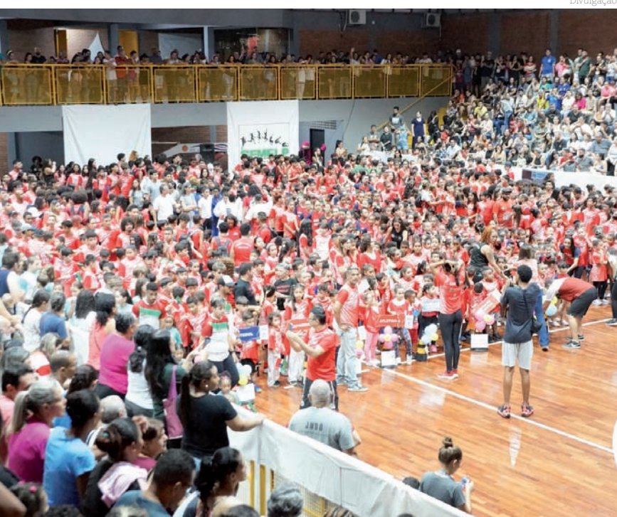
Alunos lotaram os ginásios de esportes de Pindamonhangaba