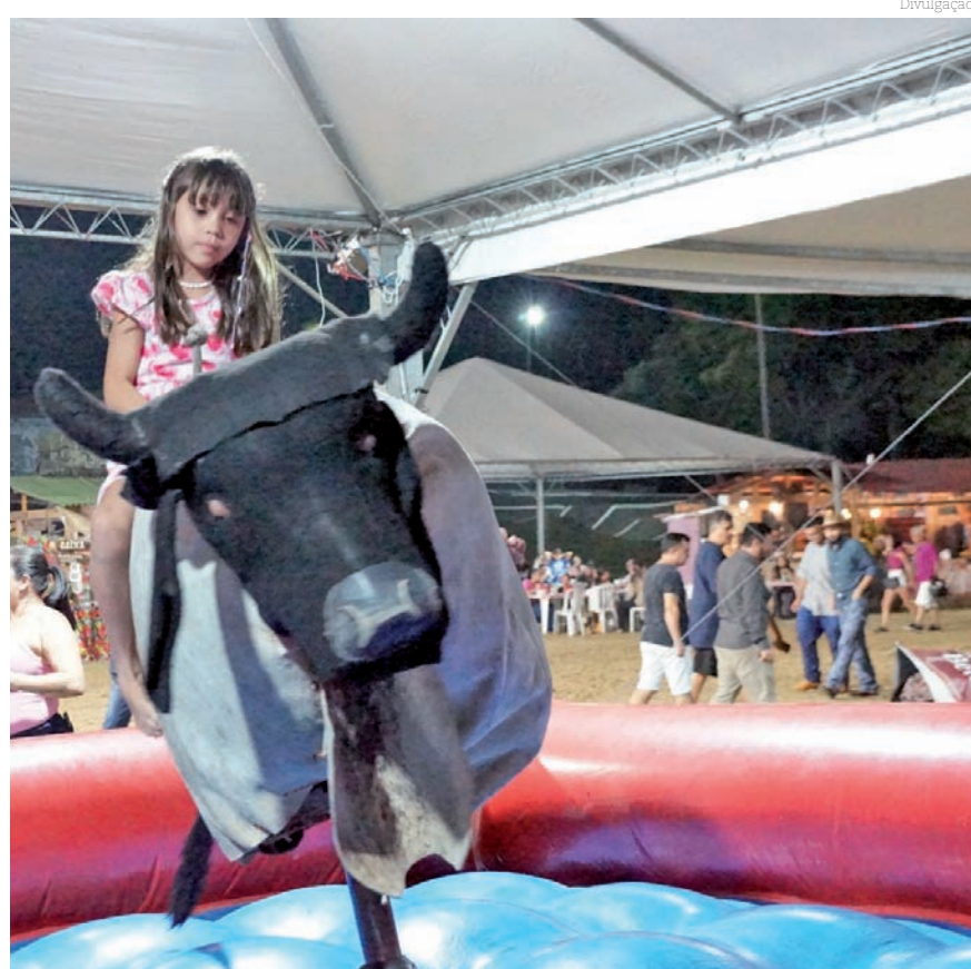
As crianças puderam brincar de 'domar' o touro mecânico