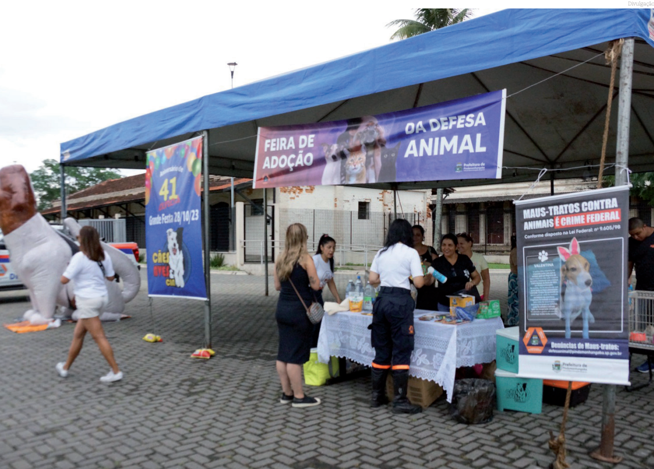
O evento mostrou que é preciso responsabilidade com os pets

Richard Rasmussen - No próximo dia 17, será realizada outra feira de adoção, também na Praça Sete de Setembro, promovida pelo Departamento da Defesa Civil de Pindamonhangaba, com parceria com a empresa Cães Aves & Cia. Através dessa parceria, o evento contará com a participação do naturólogo, economista, biólogo e apresentador brasileiro, Richard Rasmussen. Além disso, também serão realizadas consultas no local, entretanto, os detalhes desse dia ainda estão sendo acertados e logo serão anunciados.