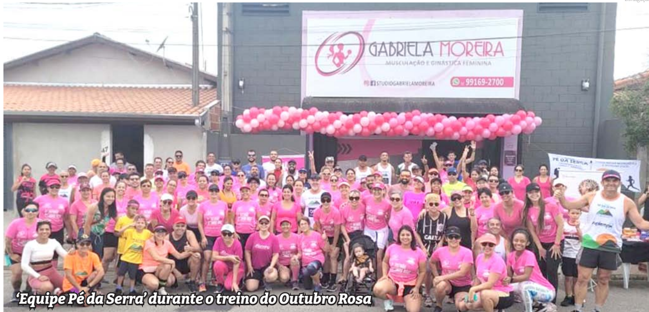
'Equipe Pé da Serra' durante o treino do Outubro Rosa

Os treinos do grupo acontecem às quartas e sextas-feiras, no Parque da Cidade, sempre às 7h20 e aos domingos, em um lugar de Pindamonhangaba, escolhido previamente, com um café comunitário.