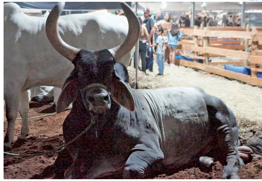
Festival teve exposição de animais, entre outras atrações