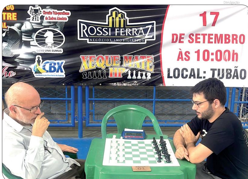
Pinda obteve novas conquistas na competição de xadrez

Os resultados podem ser conferidos no link do Chess results https://chess-results.com/tnr802492.aspx?lan=10&art=1&rd=6&turdet=YES&flag=30&fbclid=IwAROPYZQhmkBNiVKulT4xInUFL4874yrhgwnRKdZuloXH7eENRcMVJRJaAM .