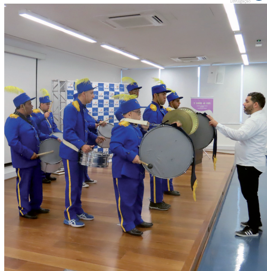
A integração da pessoa com deficiência na vida em sociedade é um dos pontos que norteiam a conferência