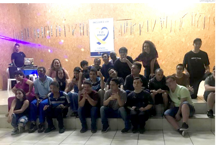
Balada terá uma programação especial para maiores de 12 anos

A Prefeitura de Pindamonhangaba, por meio da Secretaria da Mulher, Família e Direitos Humanos, irá promover uma balada inclusiva jovem durante a Conferência Municipal dos Direitos da Pessoa com Deficiência. O evento acontecerá na sexta-feira (20), no mesmo local da conferência, em uma sala especial, para que os pais possam participar com tranquilidade das atividades, enquanto seus filhos se divertem com uma programação especial.