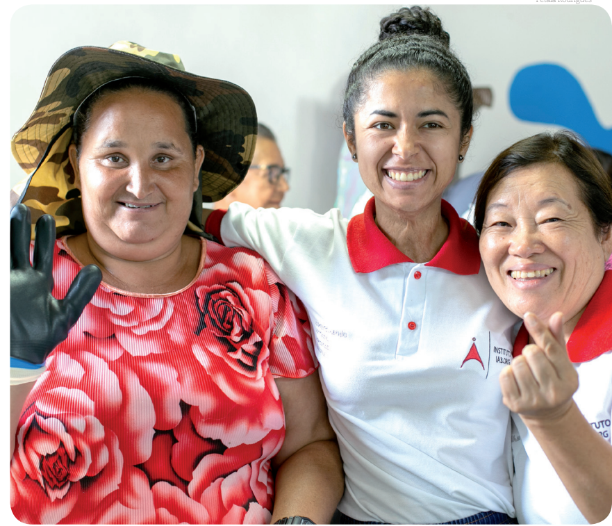
Ações como esta contribuem para a valorização dos catadores