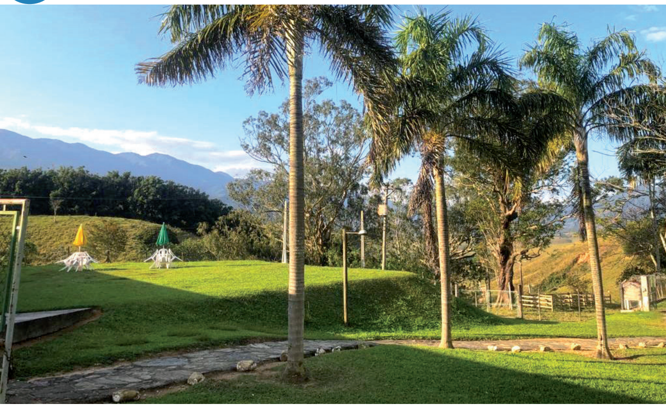
Funcionando desde 2022, o 'Parada 27' oferece aos frequentadores uma vista paradisíaca