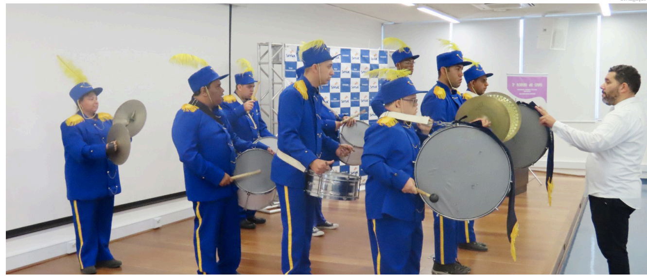
O evento terá como objetivo discutir o cenário atual e futuro na implementação de políticas públicas para pessoas com deficiência

“Estamos muito felizes em promover essa conferência, que é um importante espaço de diálogo e construção de políticas públicas inclusivas”, afirmou a diretora. “Convidamos a todos, pessoas com deficiência e população em geral, a participarem desse evento, que é fundamental para o desenvolvimento de Pindamonhangaba como uma cidade mais inclusiva”, completou.