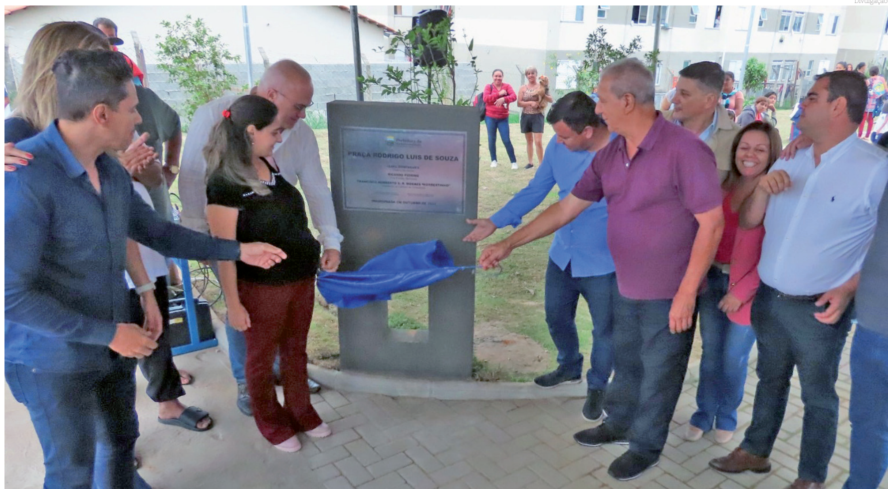
Momento de descerramento da placa de inauguração: evento contou com a presença de autoridades e muitos munícipes