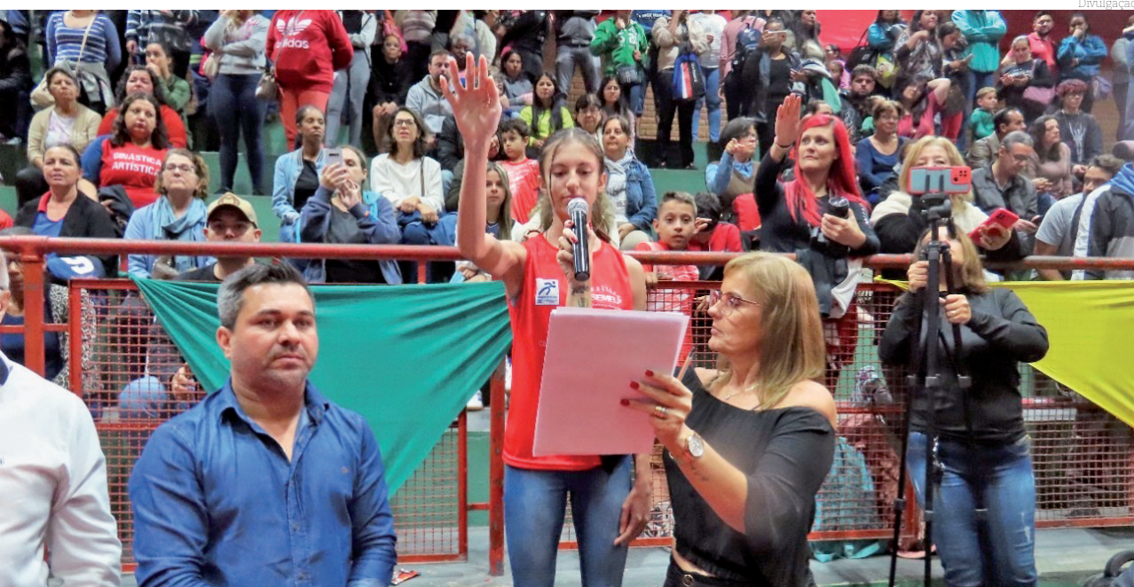
Jovem atleta faz o juramento em cerimônia de abertura de uma das edições do festival