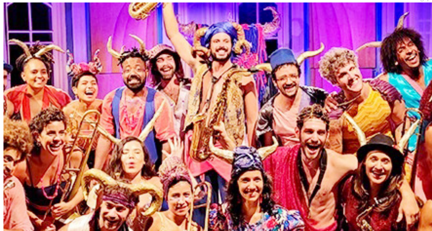
O evento vai reunir diversas atrações gratuitas para o público como oficinas, apresentações artísticas e musicais

Em Pindamonhangaba, a programação terá oficina de confecção de bonecos para brincadeiras, exibição de documentário sobre a evolução das câmeras e sobre a forma de fazer filmes, inclusive com equipamentos para serem vistos e manipulados pelo público, apresentação circense sobre o pião, apresentação de banda de metais com ritmos como samba, coco, carimbó, for-