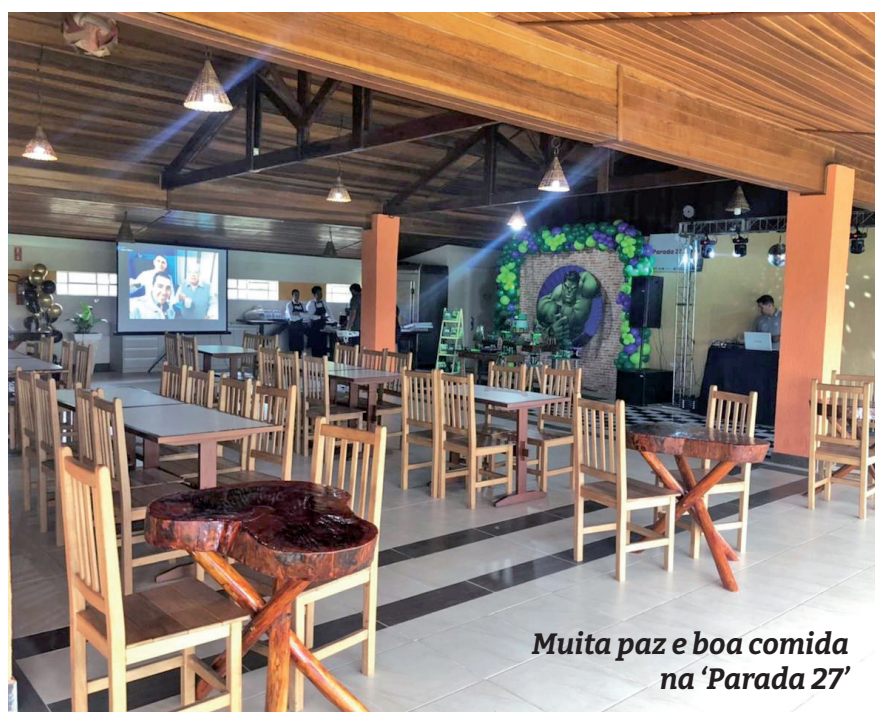
Muita paz e boa comida na 'Parada 27'

res variam de R$ 27,00 o prato a 59,90, o buffet com churrasco e música no domingo.