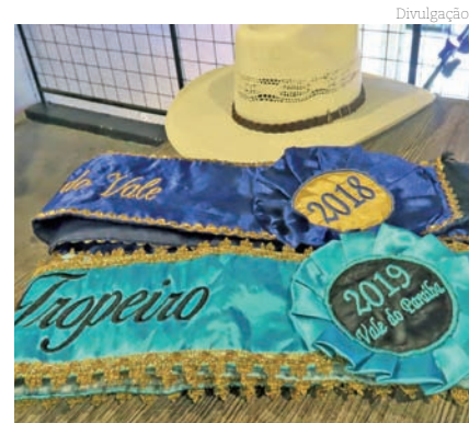
Faixas de 2018 e 2019

Além do concurso, o Festival Tropeiro contará com grandes