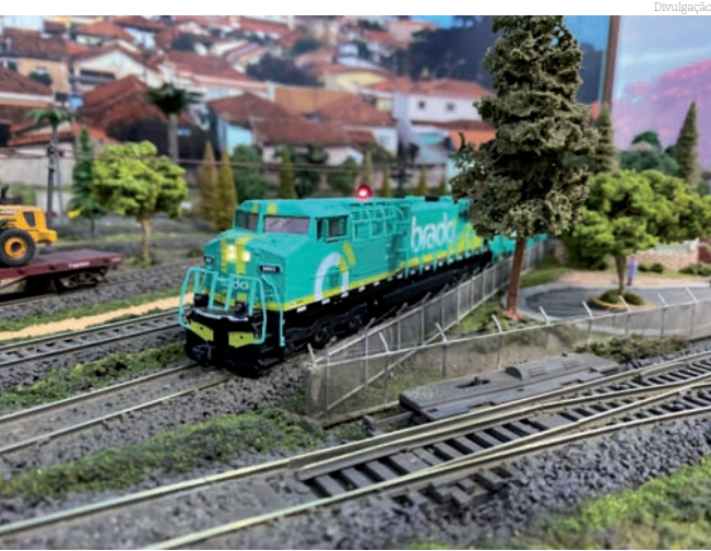
Um dos hobbies mais antigos do mundo, o ferromodelismo é uma opção de entretenimento e também passar o tempo