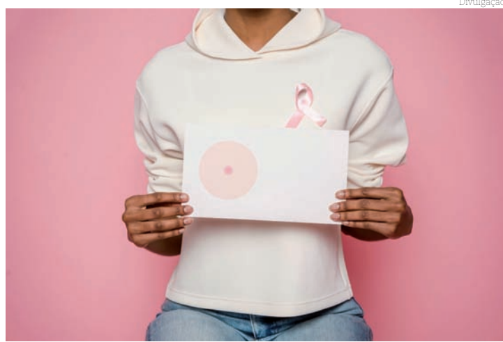
O câncer de mama é o tipo mais comum da doença

Nesse cenário, a mobilização se torna fundamental para incentivar o diagnóstico precoce da doença, uma vez que a detecção em estágios iniciais aumenta consideravelmente as chances de tratamento bem-sucedido. Dessa forma, o Outubro Rosa hoje não se limita a uma campanha, mas sim a uma importante jornada de educação, prevenção e saúde das mulheres e da população em geral.