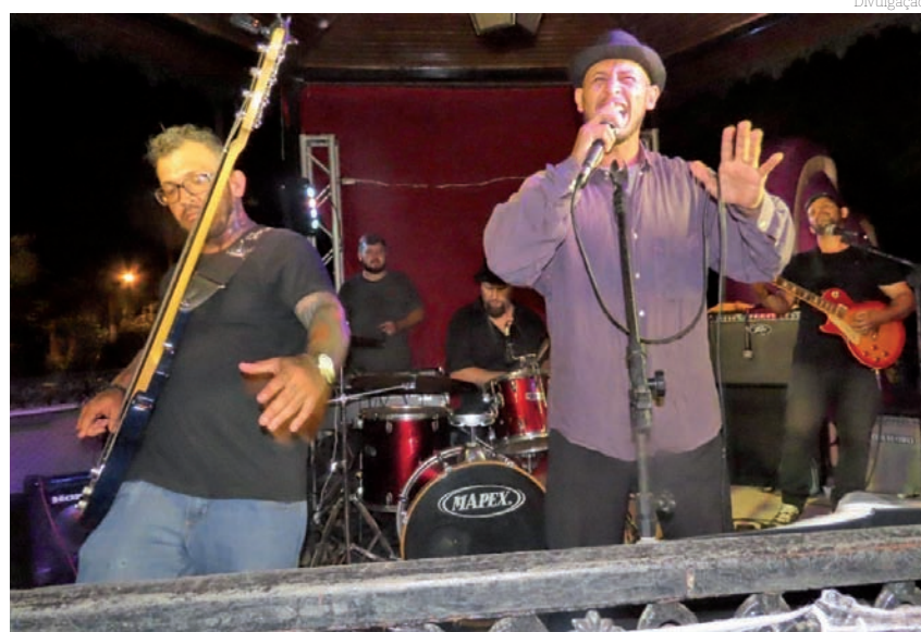
'Halloween do Saci' terá animação da banda Radiola