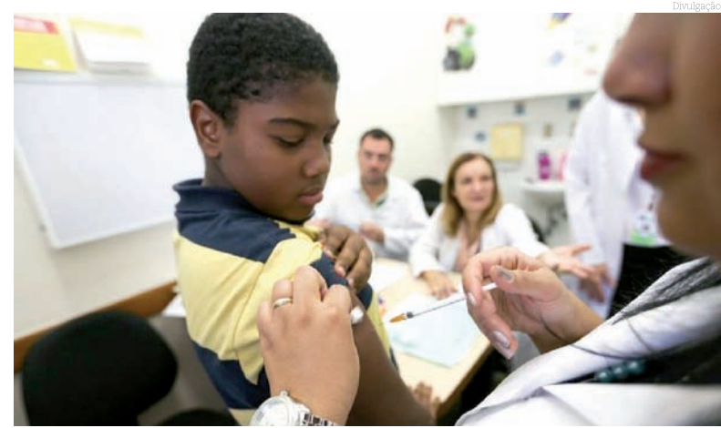
Mais uma oportunidade de atualizar a carteirinha de vacinação

O objetivo da Secretaria de Saúde é atualizar a carteirinha de vacinação do público na faixa etária definida. Para a vacinação, os pais devem levar a carteira de vacinação dos filhos.