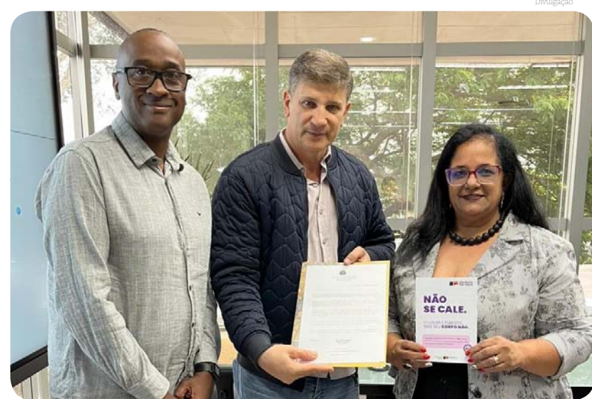
Prefeito mantém o compromisso de aplicar políticas públicas em defesa das mulheres