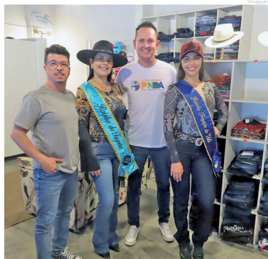
As inscrições para o concurso estão abertas até 11 de outubro