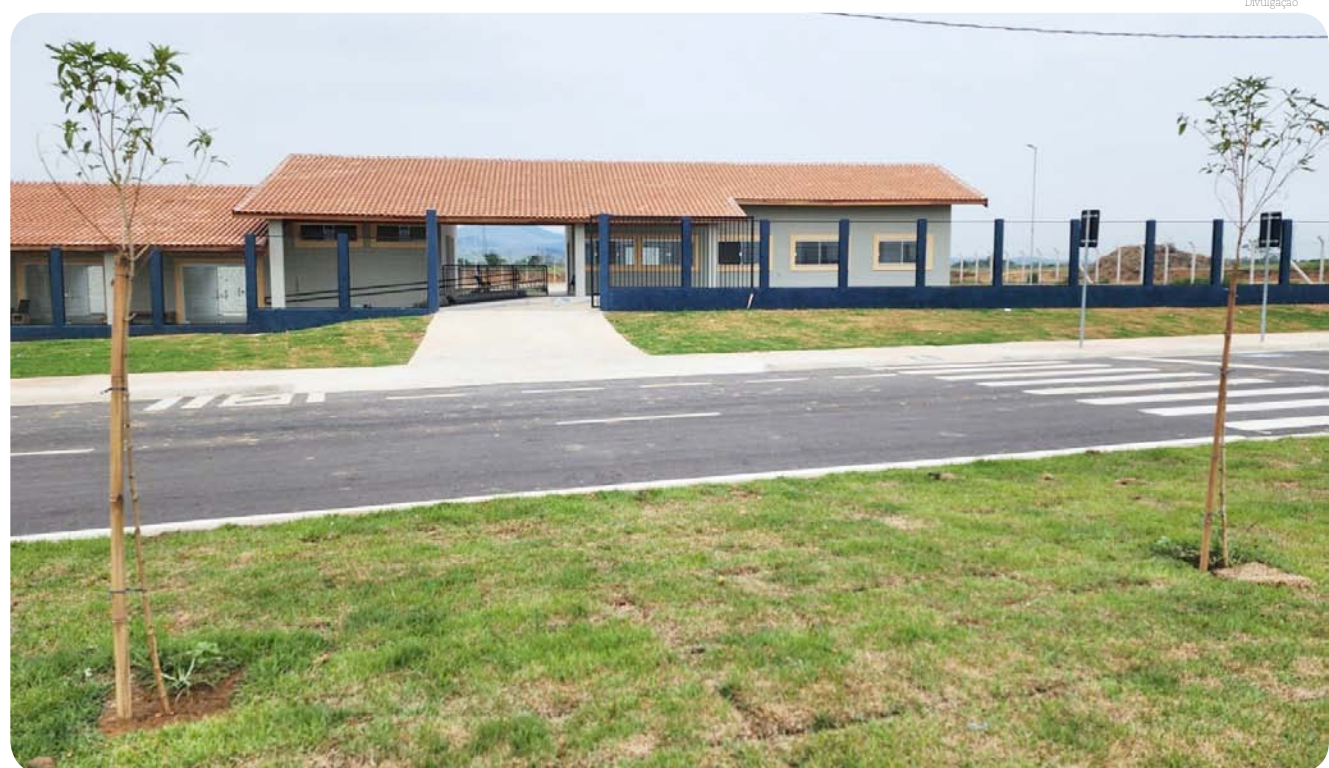
Aspecto da fachada e acesso com o prolongamento da avenida Nilceia Borges

Além da implantação dessa estação junto à SABESP, a obra está sendo finalizada com outras ações como aquisição e instalação de equipamentos de segurança como extintores e outros itens, contratação de novos servidores aprovados em concurso público como dois cozeiros e um administrativo, capacitação para novos servidores com treinamento para utilização de equipamento inativador de gases, implantação de um espaço contemplativo com Cruzeiro, serviços finais de paisagismo e jardinagem e implantação de identificação visual do novo equipamento pela equipe do Departamento de Comunicação.