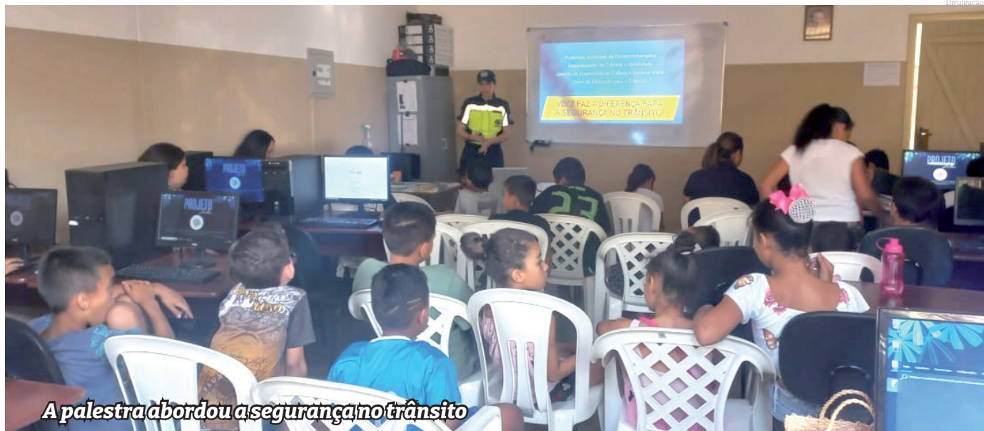
A palestra abordou a segurança no trânsito

A ação educativa do Departamento de Trânsito apresentou noções básicas de segurança no trânsito buscando promover a reflexão sobre a importância de se ter atenção ao atravessar a rua, ao brincar em áreas com movimentação de veículos, além do uso da bicicleta. Essas ações são disponibilizadas a instituições que tenham interesse em receber a equipe e ajudam a contribuir disseminando informações sobre segurança viária, importante para todos. Para receber as ações basta agendar com a equipe através do canal de atendimento 1doc, onde a solicitação deve ser oficialmente protocolada.