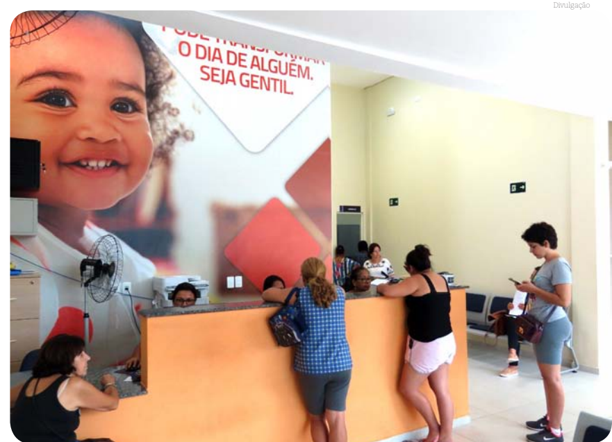
Campanha busca aumentar os exames de Papanicolau

através do exame Papanicolau. A iniciativa reforça a importância do cuidado preventivo e do acompanhamento regular da saúde feminina.