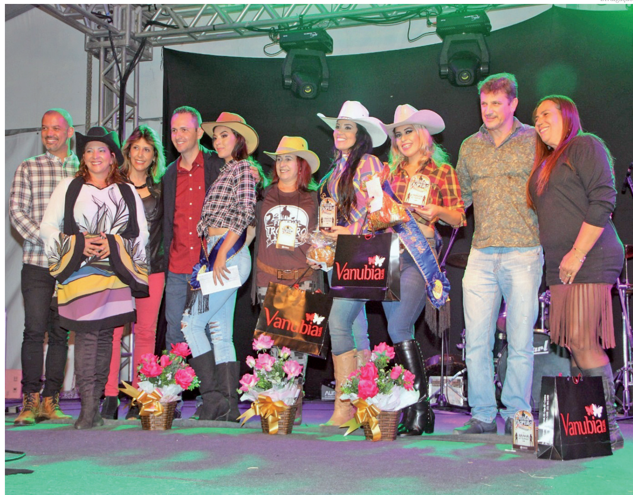
Parte da programação do Festival Tropeiro, concurso tem inscrições aberta em 2 de outubro