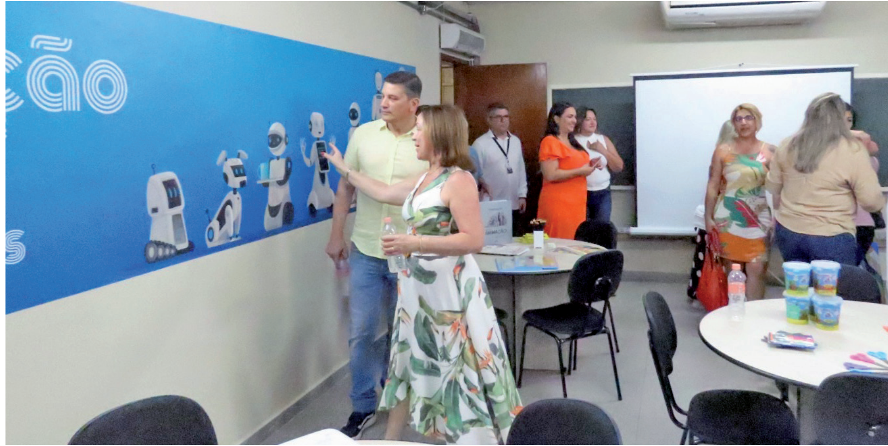
As atividades do 'Núcleo Avançado Pinda Educa Mais' começam nesta quinta-feira (28) e ainda existem vagas disponíveis

Prefeitura implanta mais três quilômetros de asfalto na Estrada Pau D'Alho