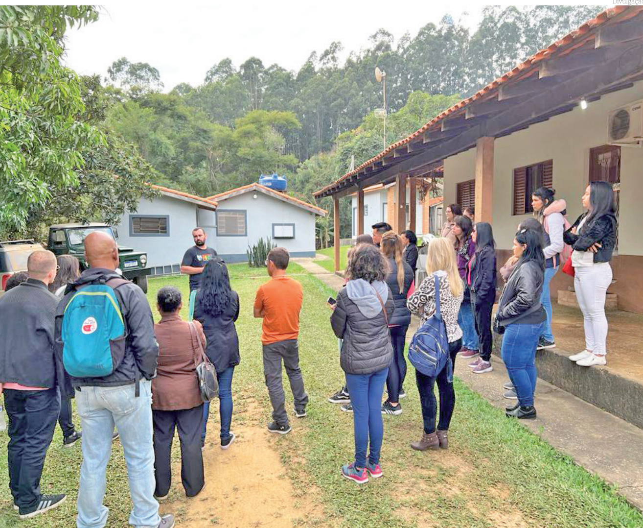
Projeto 'City Tour Histórico, Cultural e Gastronômico' foi habilitado na primeira fase do concurso