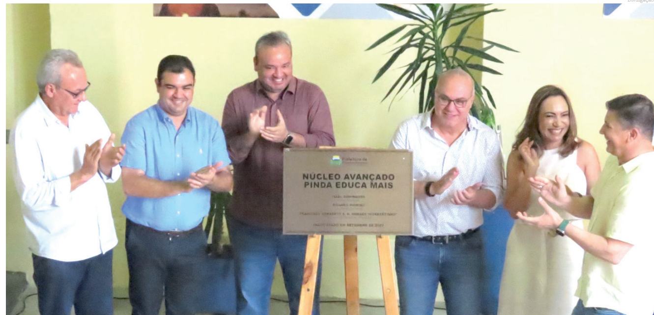
O ‘Núcleo Avançado Pinda Educa Mais’ vai oferecer cursos para a formação de alunos