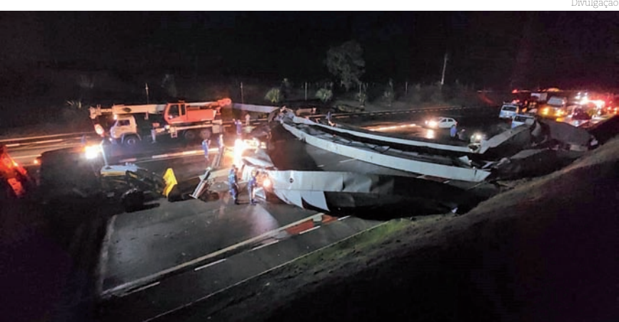
Deslizamento devido a chuvas causou interdição da pista

Na edição de sexta-feira, teremos um balanço completo de toda a situação.