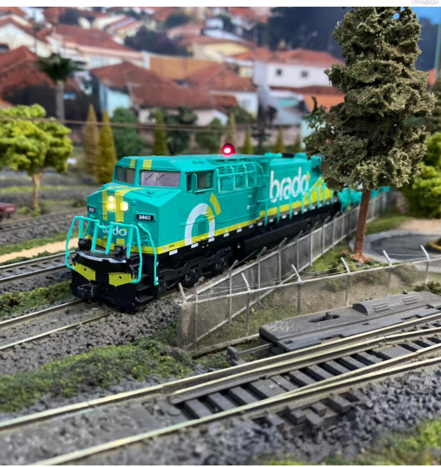
Evento acontecerá das 9h às 16h30 no complexo ferroviário da cidade, será gratuito e reunirá diversos apaixonados por este hobby