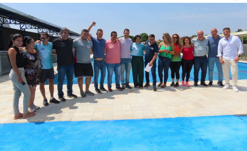
O investimento para as obras foi de R$ 500 mil