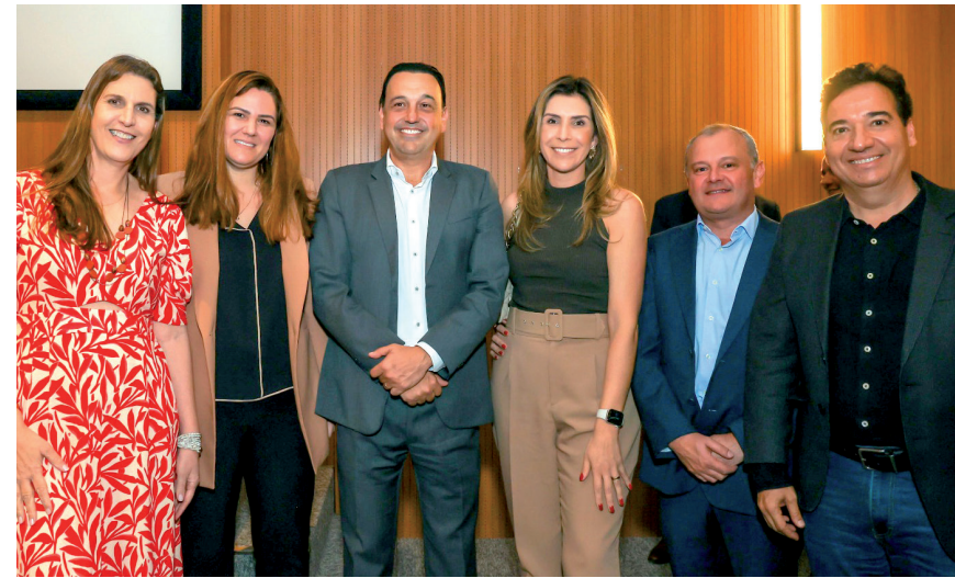
As propostas apresentadas podem transformar a região em um centro logístico

Também foram discutidas as ações sobre políticas públicas para colocar o Aeroporto de