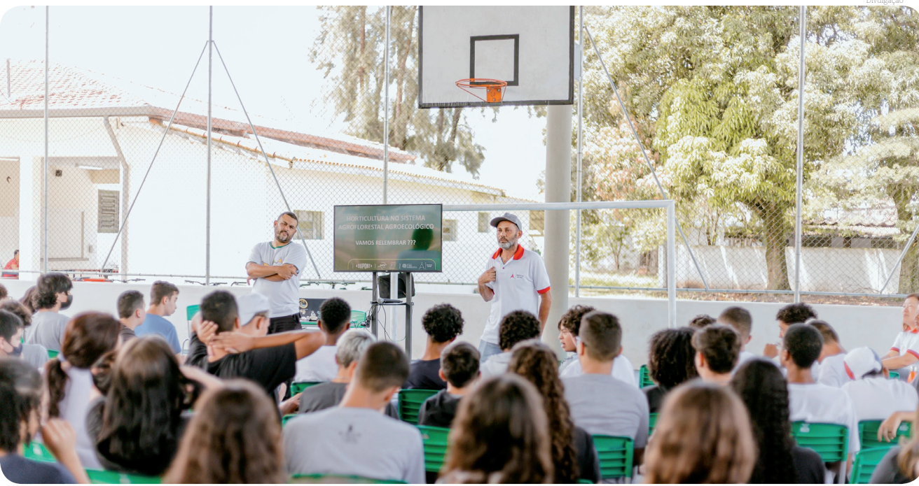
Desenvolvendo o 'Projeto Cubo Ambiental', o IA3 conseguiu a aprovação para a continuidade em 2024

O IA3.ORG – Instituto de Apoio ao Desenvolvimento Humano, a Artes e Aprendizagem – foi constituído em 15 de maio de 2008, caracterizando-se como uma associação sem fins lucrativos, com sede no bairro Feital, em Pindamonhangaba (SP), o IA3.ORG tem como missão contribuir para a formação integral de crianças, adolescentes e jovens, por meio de atividades educacionais, culturais e qualificação profissional, como alternativa de inclusão social, combate à pobreza e emancipação daqueles em situação de vulnerabilidade social. Em seus 15 anos de atuação no município, são cerca de 10 mil atendidos por meio de múltiplos projetos mantidos pela instituição, como: Jovem Aprendiz, Atores Sociais – teatro e mídias sociais, Contraponto, Vem Ser, Primeiros Passos e Cubo Ambiental.