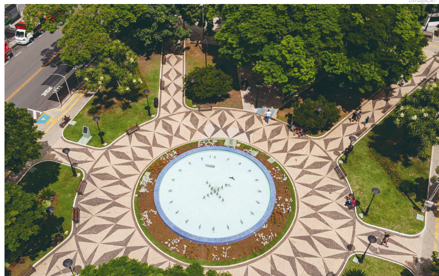
O evento acontecerá na praça Monsenhor Marcondes

Além disso, durante a semana do idoso, a prefeitura vem promovendo diversos eventos como palestras no Teatro Galpão, sessões de cinema no Shopping, Tarde de Jogos no ACCI Vila Rica, tarde de bingo no ACCI Moreira César e almoço dançante no Restaurante do Paizão.