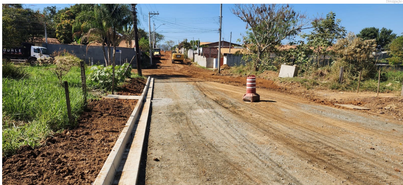
Moradores devem pedir as ligações para o término do asfalto

Prefeitura faz campanha para moradores solicitarem ligação de esgoto; asfalto deve ser aplicado nas ruas na próxima semana