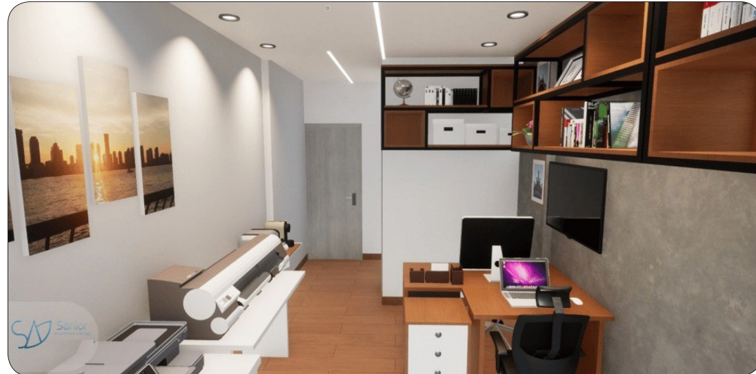
O mercado de franquia é a aposta do escritório