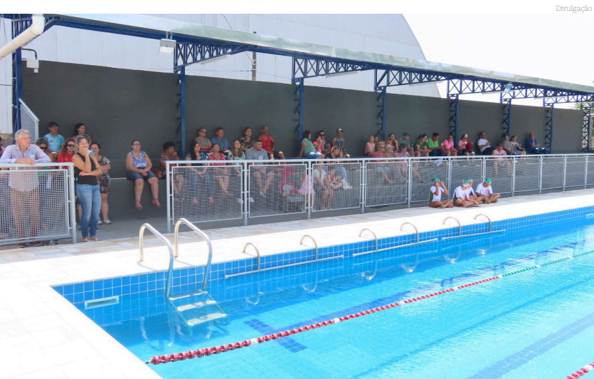
Foram várias as melhorias realizadas no local