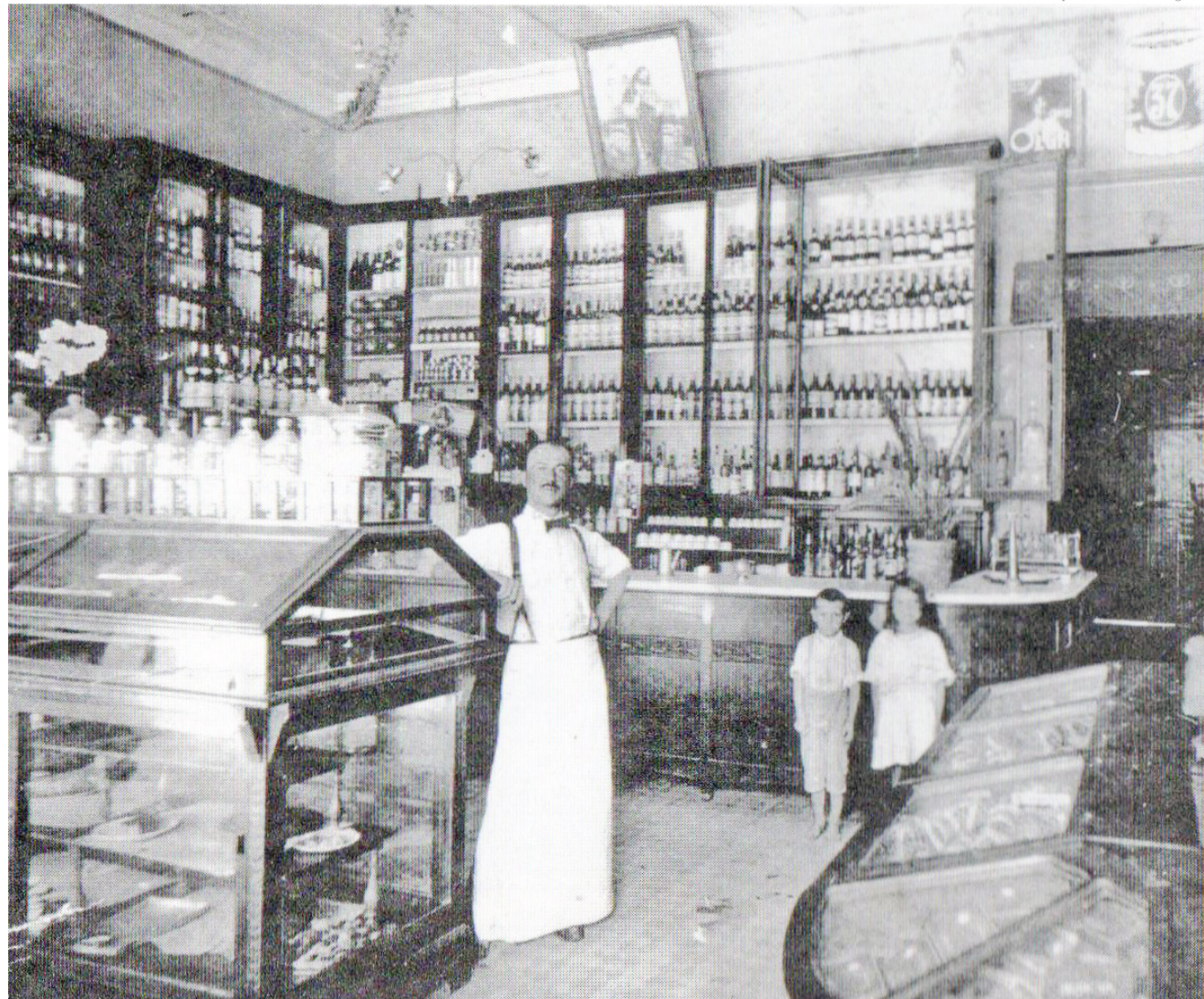
“Nos Balcões da Pequena Pindamonhangaba”

“O conhecido estabelecimento comercial era localizado na rua Bicudo Leme, na época, a principal via de comércio da cidade e tinha uma grande freguesia. O renome da confeitaria era tal que, aos domingos, muitas pessoas de outras cidades do Vale do Paraíba vinham fazer compras e de doces, aliás, saborosos doces, na confeitaria São João.