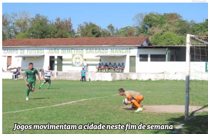
Jogos movimentam a cidade neste fim de semana

Domingo (24) – Categoria 3ª Divisão Inter Pinda x Real Mombaça – 8:00 – Estádio do Santa Luzia Unidos da 22 x Ramos – 8:30 –