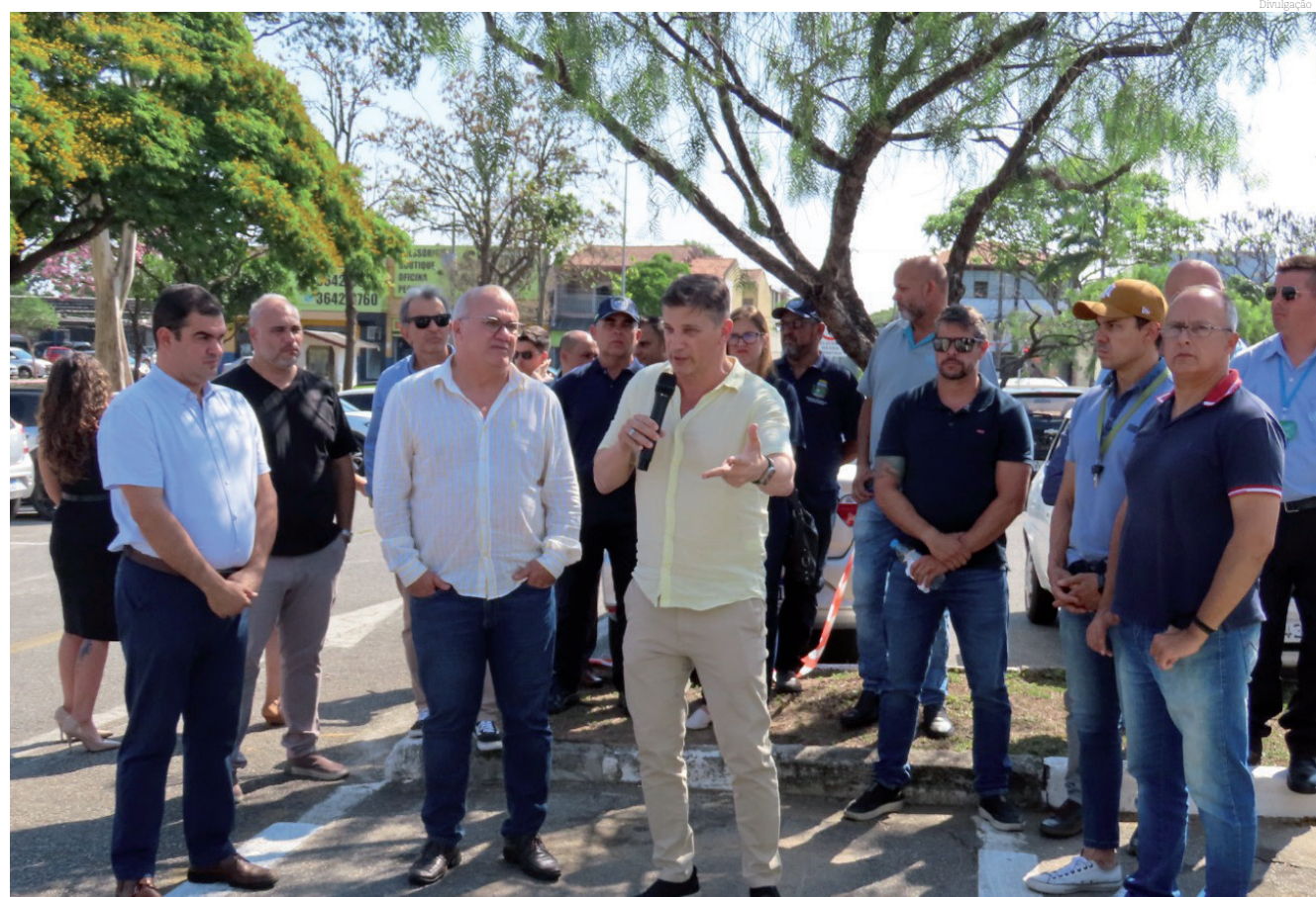
A modernização da frota é uma das ações previstas pelo novo contrato

Em breve, outras melhorias estão previstas como a tarifa a R$ 1,00 aos domingos para quem utiliza o bilhete eletrônico, a implantação do "bilhete integrado" que proporcionará o deslocamento em mais de uma linha dentro dos critérios definidos, e o aplicativo ao usuário que poderá acompanhar em tempo real o deslocamento das linhas.