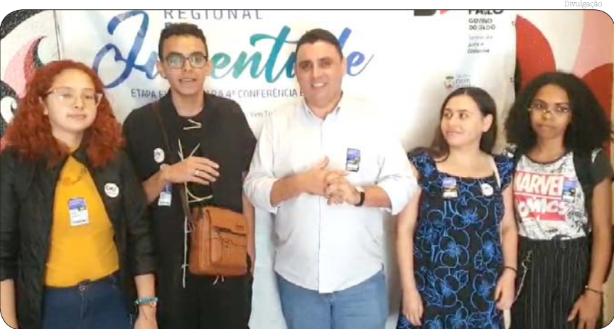
Durante a conferência será abordado a construção do futuro de Pindamonhangaba

O evento é um convite aberto para todos os jovens interessados na pauta da juventude de Pindamonhangaba, além de possibilitar aos participantes que se envolvam em discussões e decisões que terão um impacto direto nas políticas e direcionamentos relacionados à juventude em nossa comunidade.