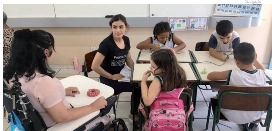
Projeto desenvolve a importância do trabalho coletivo entre os alunos

Os alunos do 1º ano B da Escola Municipal Serafim Ferreira, no Ipê 2, participaram na quarta-feira (20) de uma oficina de artesanato com confecção de elástico de recorte de tecidos. Em linguagem popular, os nomes dados aos objetivos produzidos pelos estudantes são 'xuxinha de cabelo e pulseiras de braço'.