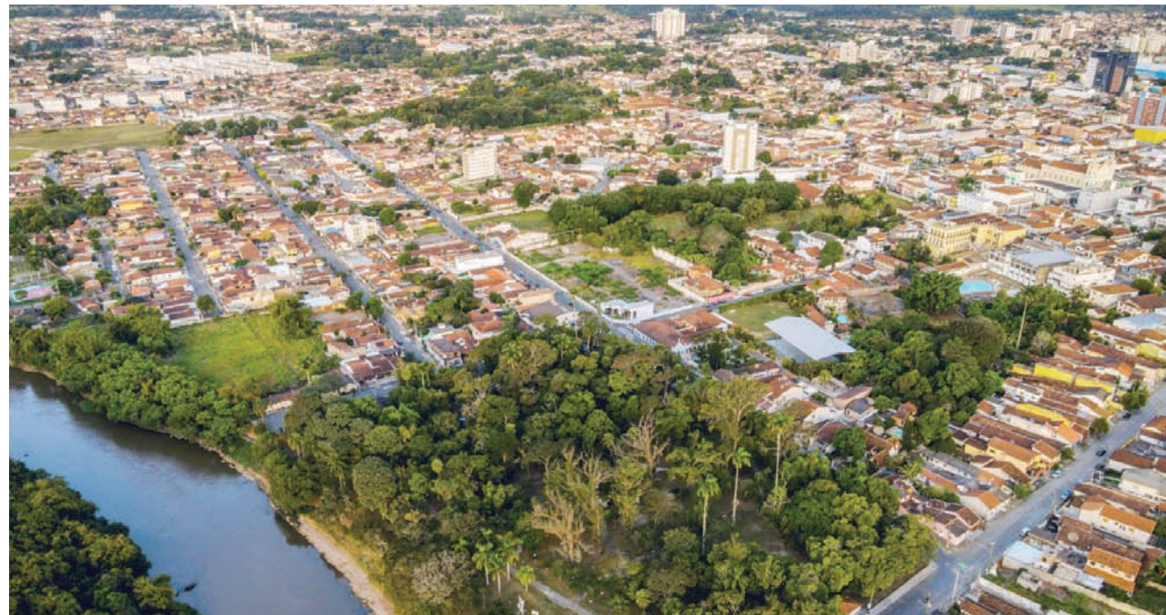
O pedido de isenção pode ser feito online ou presencialmente na prefeitura

minhados pela plataforma digital 1 Doc. O atendimento eletrônico pode ser acessado pelo endereço https://pindamonhangaba.1doc.com.br/ atendimento ou baixando o aplicativo 1doc na Google Play para celulares Android ou Apple Store para celulares iPhone.