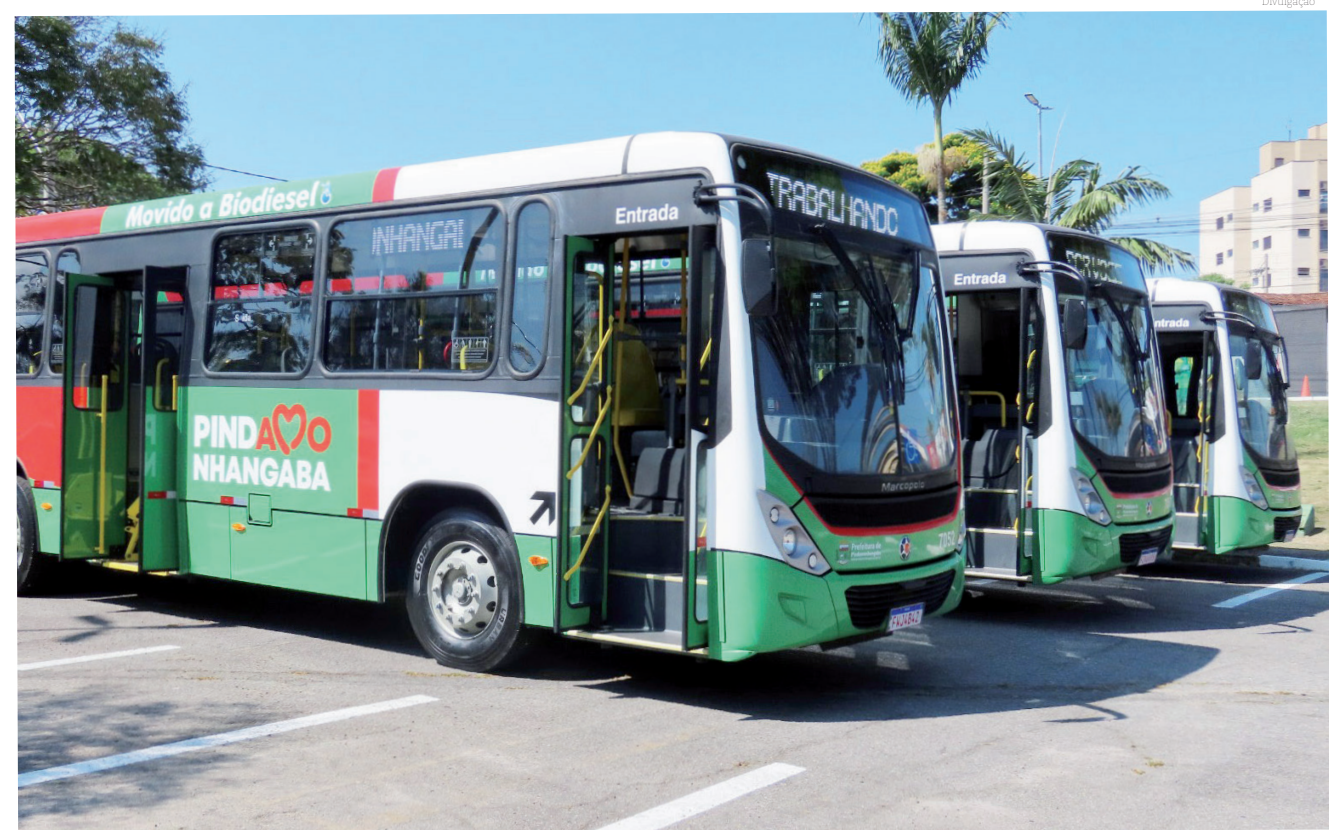
A frota da Viva Pinda conta agora com ônibus com uma nova tecnologia