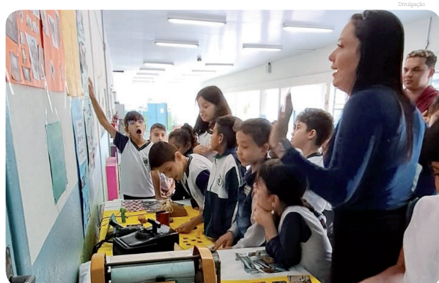
Atividade faz uma análise do presente para garantir um futuro melhor

O principal objetivo dessa atividade foi estimular a reflexão sobre como o passado continua a moldar o presente, incluindo o motivo pelo qual as coisas são como são, o que foi deixado para