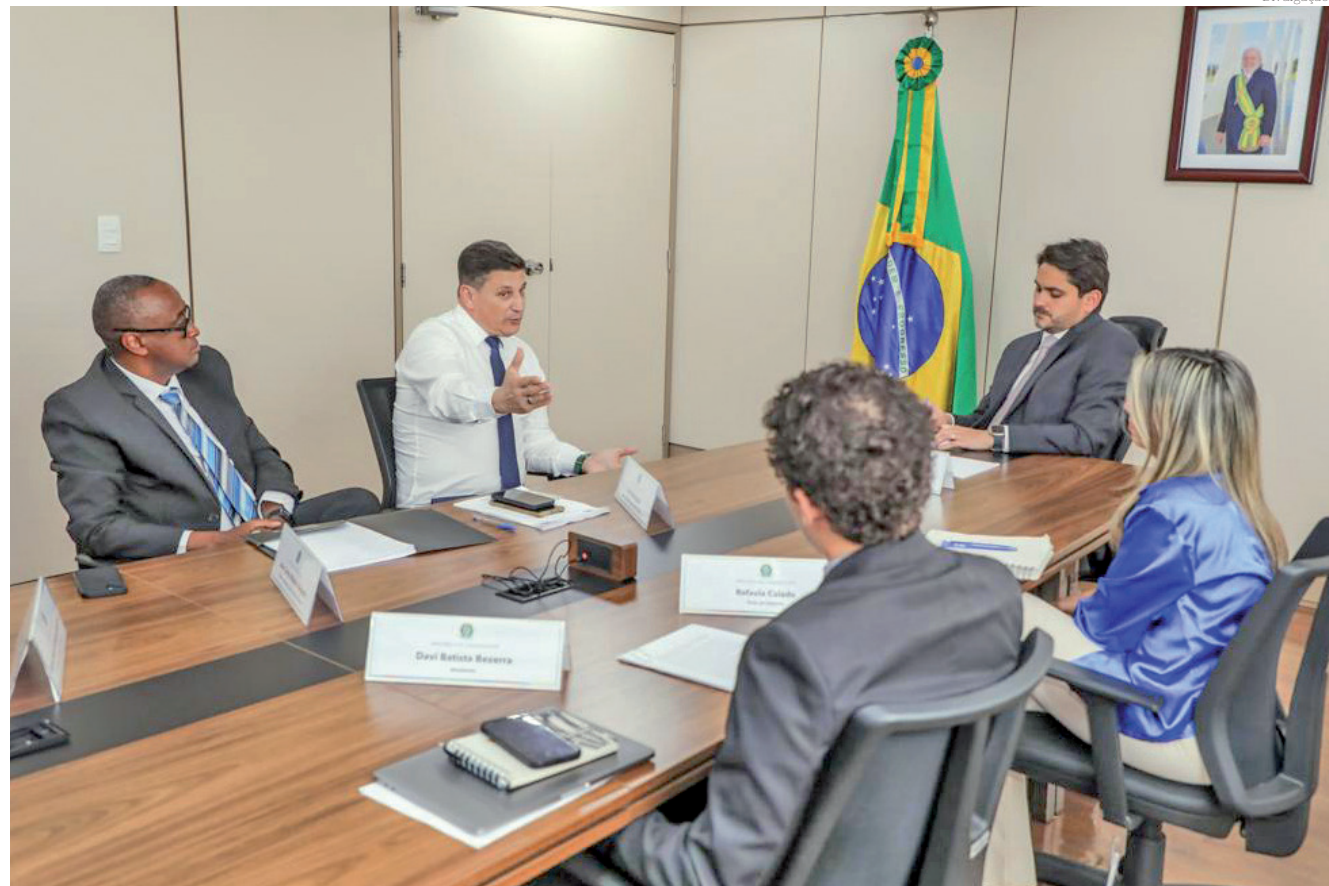
O ministro das Comunicações, Juscelino Filho, recebeu as reivindicações de Pindamonhangaba