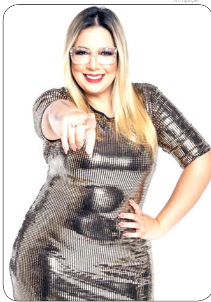
Serão muitas as atrações no 'Festival da Primavera'

A novidade este ano é o 'Festival Sertanejo', que acontecerá junto com o 'Festival da Primavera' e tem como objetivo incentivar a música sertaneja, além de revelar novos talentos e promover o intercâmbio artístico cultural. 'O Festival Sertanejo' contará com três categorias que serão: "Categoria Jovem Música Sertaneja", "Categoria Música Raiz" e "Categoria Individual" e as premiações serão as seguintes: