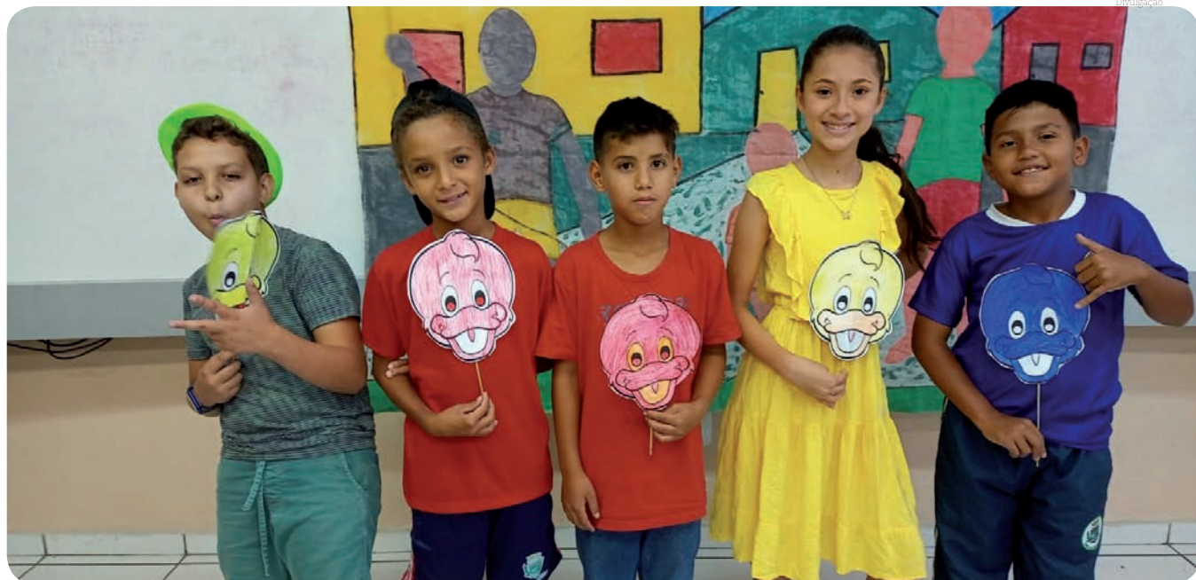
Atividade pretende desenvolver a capacidade de interpretação

A escola pretende, ao final do projeto, expor as fotos e trabalhos na Mostra Pedagógica.