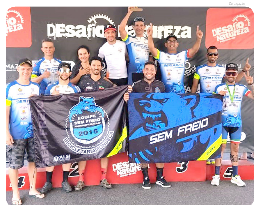
Equipe manteve o foco e trouxe muitos títulos