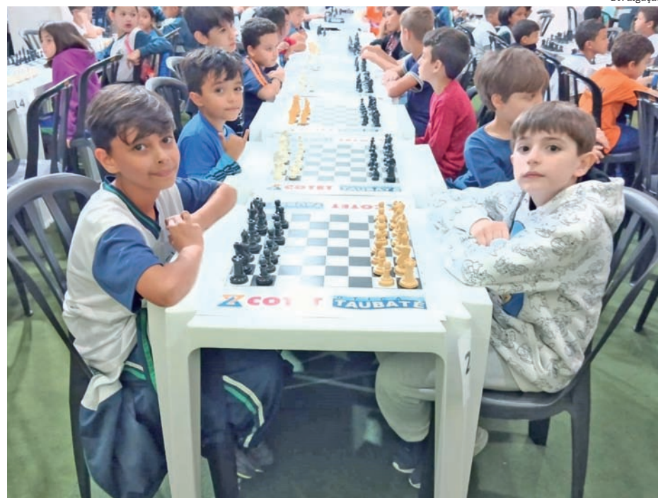
Dois alunos da escola conquistaram medalhas na competição de xadrez

O resultado obtido pelos alunos é um motivo de orgulho para a escola e para a cidade de Pindamonhangaba. Os jovens mostraram que têm talento e potencial para o xadrez, e que estão trilhando o caminho certo para o sucesso. A equipe da escola parabenizou os alunos e agradece o apoio da Secretaria de Educação.