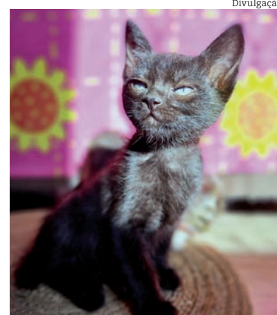
Um dos gatinhos resgatados pela Adote