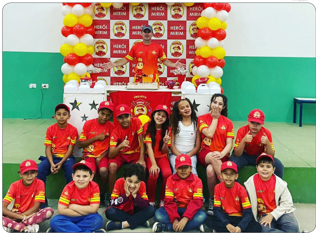
Objetivo do projeto é atingir o maior número de bairros, orientando os pequenos

"Minha ideia é levar o projeto ao maior número de bairros possível e a forma que encontrei é fazendo o projeto em bairros diferentes a cada turma, atingindo assim o maior número de crianças e de regiões da nossa cidade", enfatizou.