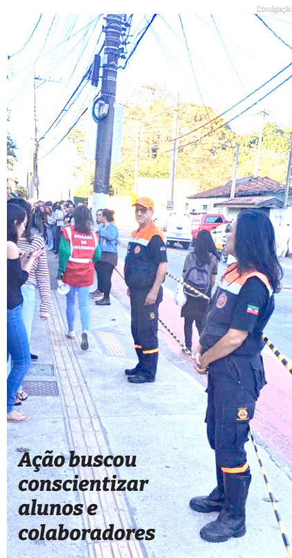
Ação buscou conscientizar alunos e colaboradores

Durante os três períodos (manhã, tarde e noite) da sexta-feira do dia 21/07, o SENAC (Serviço de Aprendizagem Comercial) de Pindamonhangaba realizou um treinamento de evacuação de prédio,