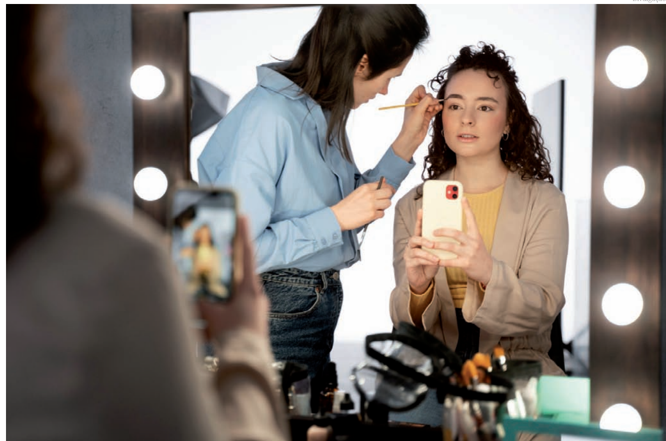
O curso de maquiagem é uma das opções oferecidas pelo Fundo Social de Solidariedade