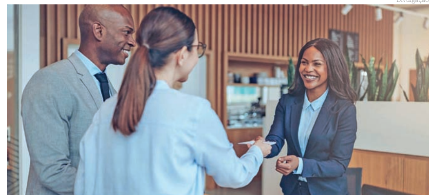
Entre as bolsas disponibilizadas pelo Senac Pinda destaca-se a oferta de cursos nas áreas de turismo e hospitalidade

“São duas áreas promissoras com tendências que absorvem cada vez mais profissionais, desde que estejam qualificados. E o Senac está conectado a esse momento e às necessidades do mundo do trabalho, colocando