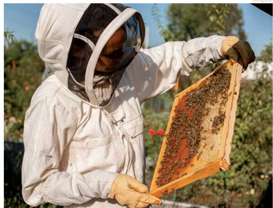
De acordo com o edital, o profissional aprovado e lotado em Pindamonhangaba, irá trabalhar com Saúde das Abelhas – Biologia, Manejo e Produção Aplicados à Atividade Apícola

A validade do concurso público será de dois anos e poderá ser prorrogada uma única vez por igual período.