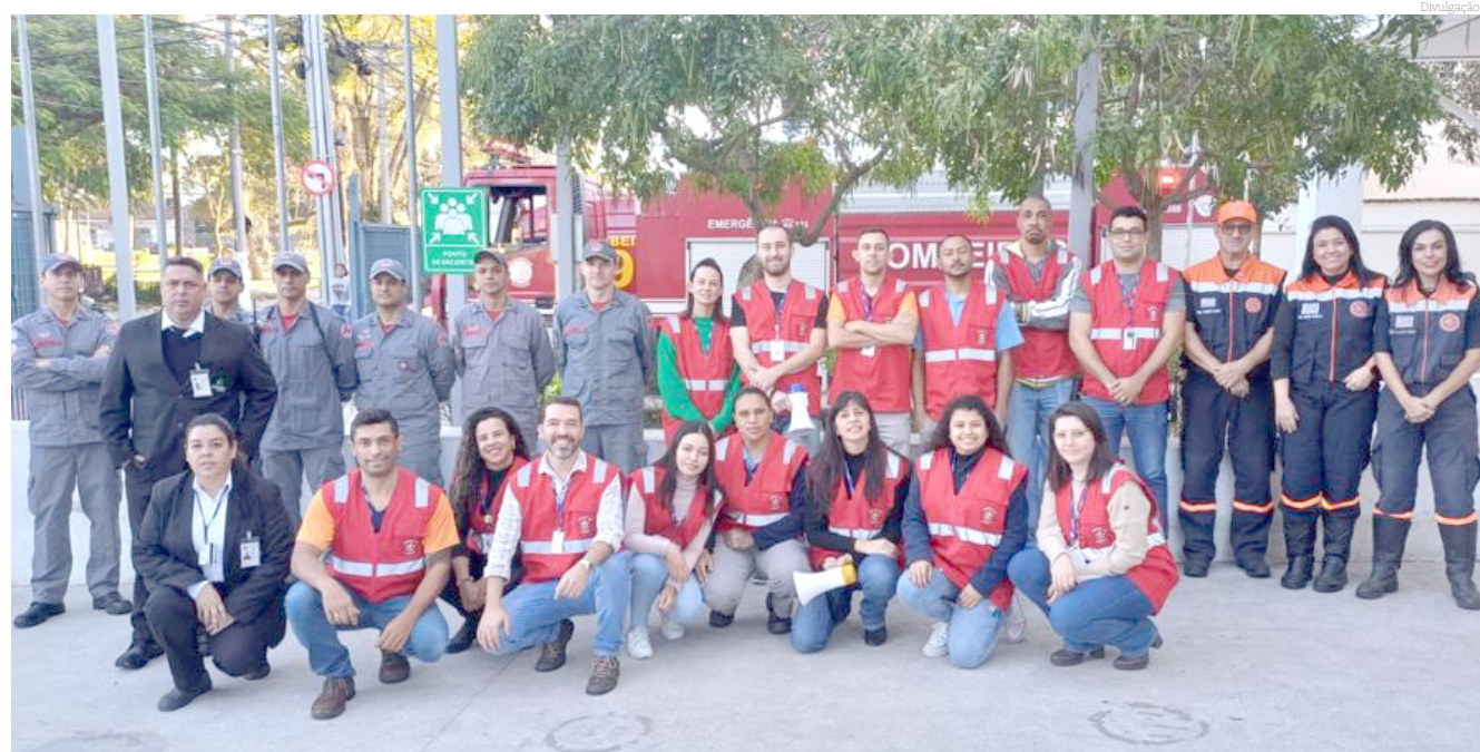
A Defesa Civil foi parceira do Senac, parabenizando o mesmo pela iniciativa

www.jornaltribunadonorte.com.br contato@jornaltribunadonorte.net