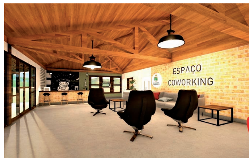
O novo coworking vai fomentar o empreendedorismo e a inovação na cidade

O investimento total do coworking é de R$ 431 mil, sendo R$ 300 mil provenientes de