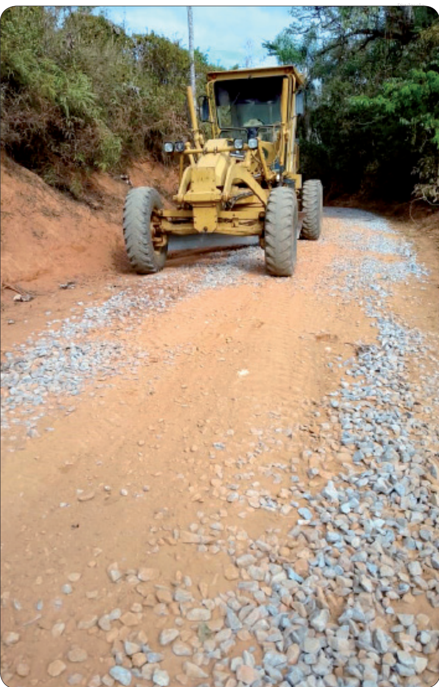
Todo o trabalho vem sendo realizado por servidores e equipamentos da Secretaria de Governo e Serviços Públicos