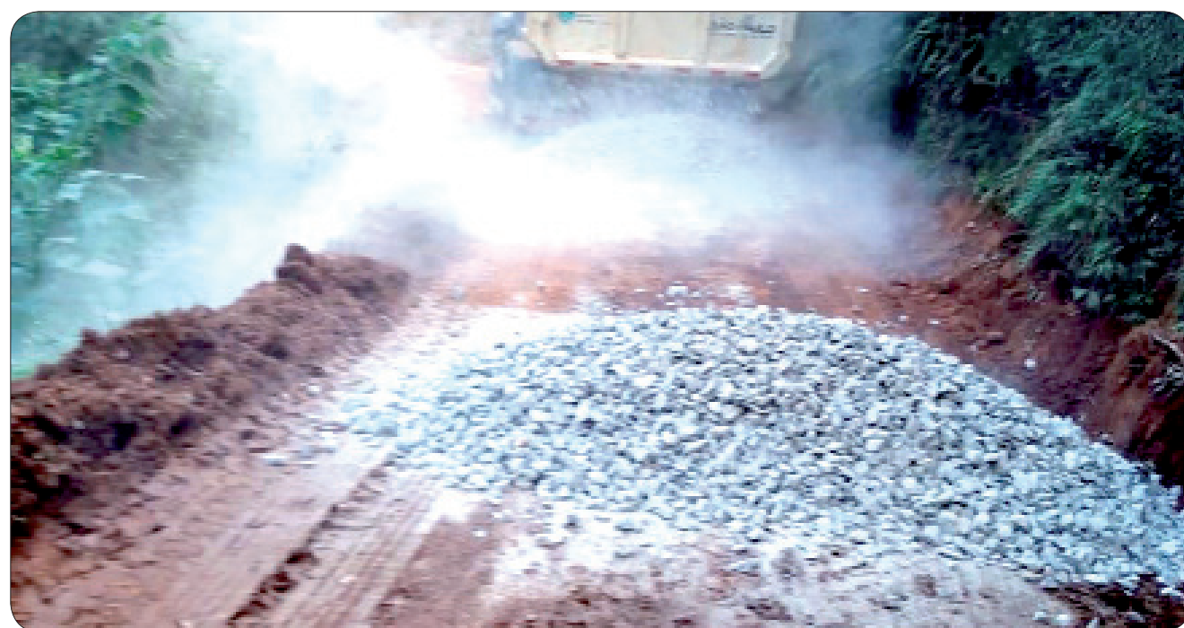
Todo o trabalho vai garantir o escoamento da produção rural da região