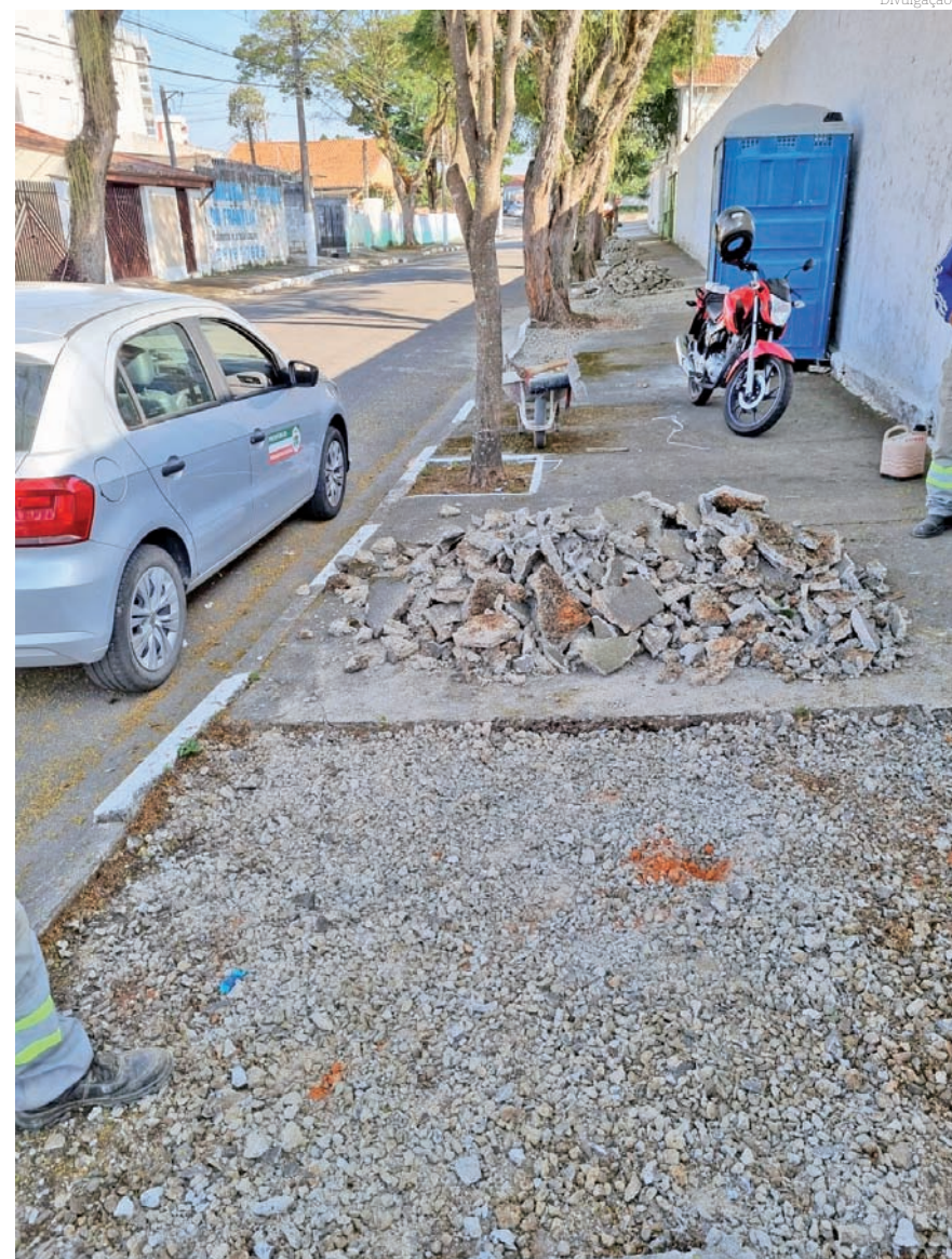
Calçadas laterais do Cemitério Municipal estão sendo reformadas