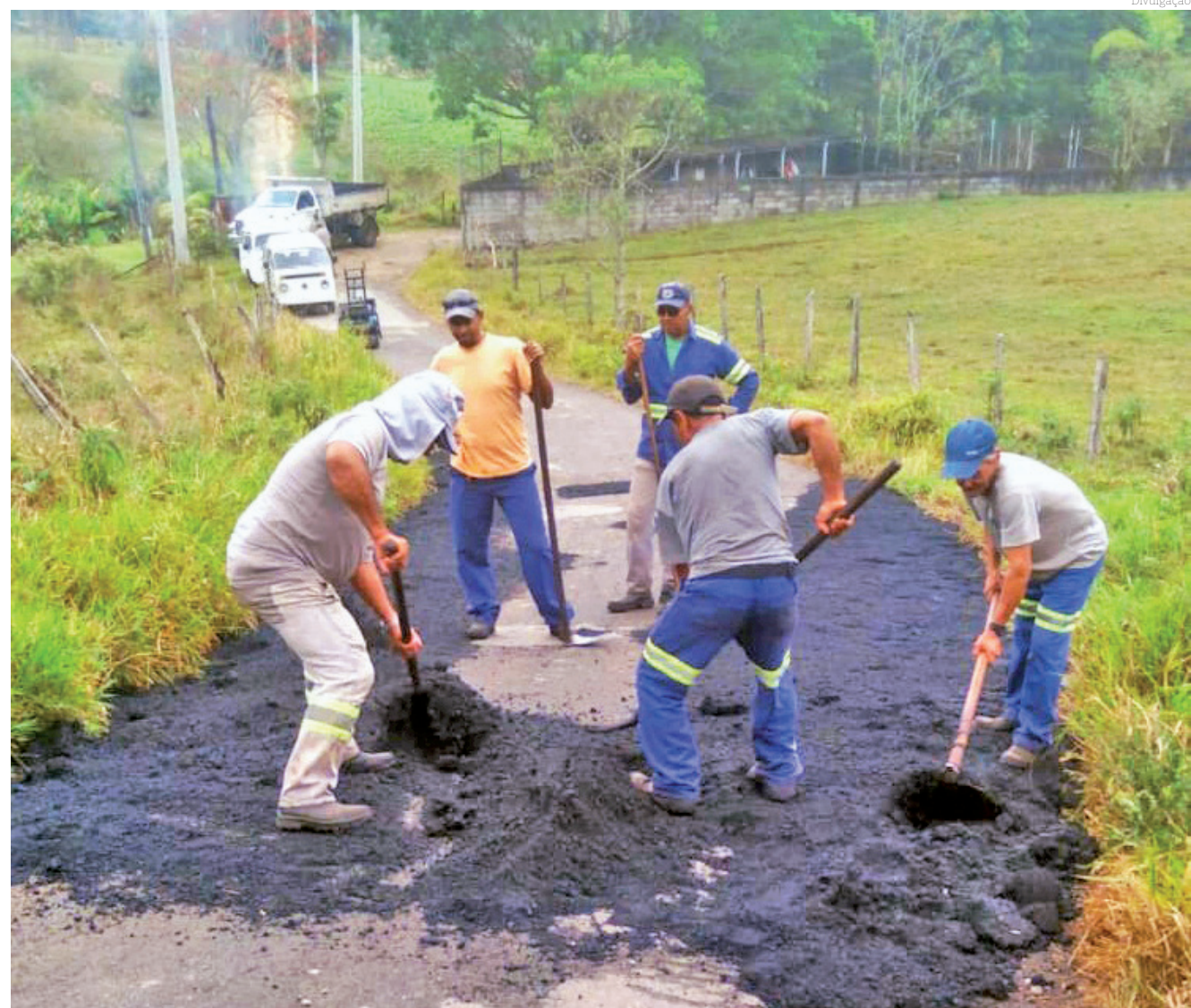
Trabalho é importante por garantir as condições para o escoamento da produção da região