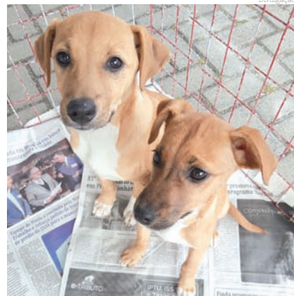
Filhotes da Feira de Adoção que teve no Encontro de Brechós

por meio da Secretaria de Cultura e Turismo, Cepatas (Secretaria de Saúde), Fundo Social de Solidariedade e Departamento de Comunicação da Prefeitura. O Encontro de Brechós foi todo realizado por meio de trabalho voluntário entre os envolvidos, motivados em ajudar a causa animal.