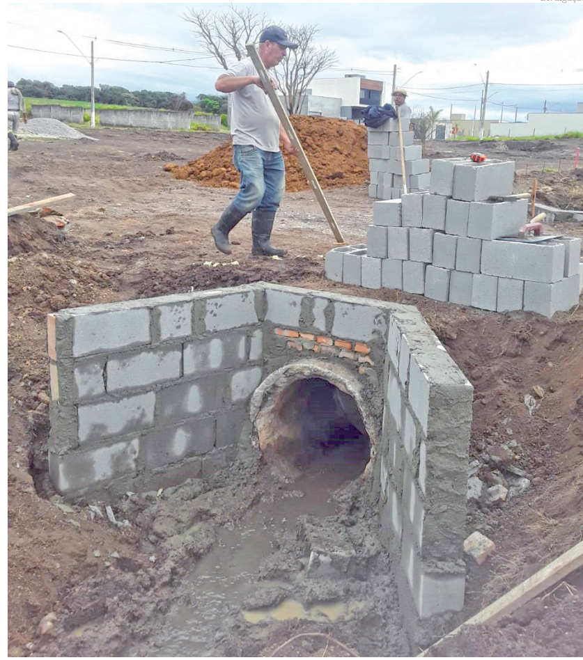
Estão sendo implantadas galerias e bocas de lobo

As obras começaram com a implantação de aproximadamente 500 metros de calçada que irão contornar todo o espaço público. Posteriormente serão realizados serviços de construção de passagens ligando alguns pontos da praça com piso concretado e implantação de passarela com corrimão. Está prevista ainda a colocação de 25 bancos de concreto e 15 lixeiras,