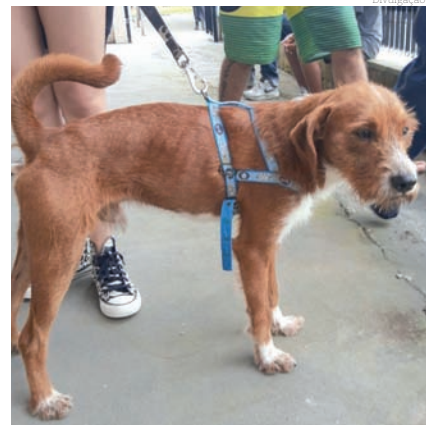
Junior Rodolfo, um dos animais da Feira de Adoção que foi sucesso no evento