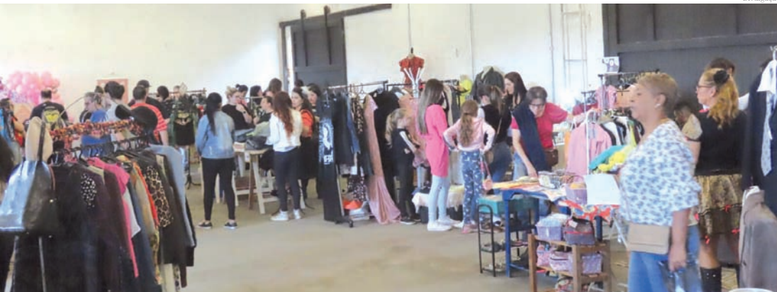
Público marcou presença durante todo o encontro no sábado