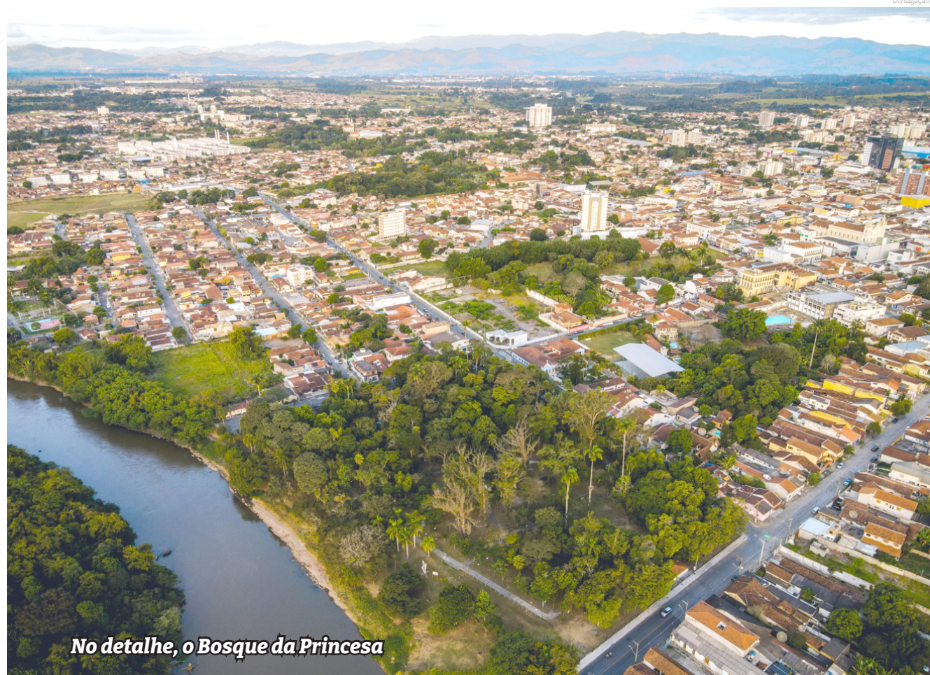
No detalhe, o Bosque da Princesa

Independentemente das notificações via e-mail, os boletos de quem tiver IPTU Complementar estarão disponíveis no site na data anunciada.