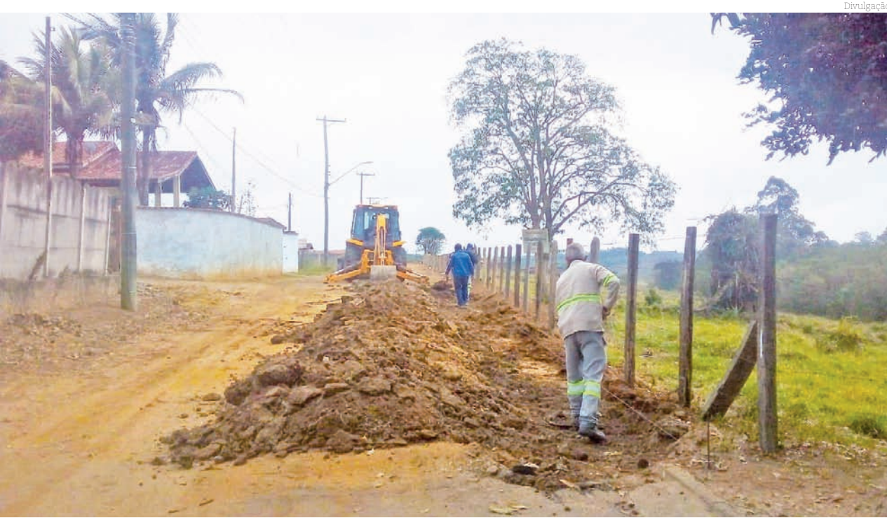
Ampliação da rua Orlando Wagner de Castro era uma antiga reivindicação dos moradores

ar livre e uma estação de playground infantil. Além disso, serão realizadas ações de jardinagem e plantio de árvores.