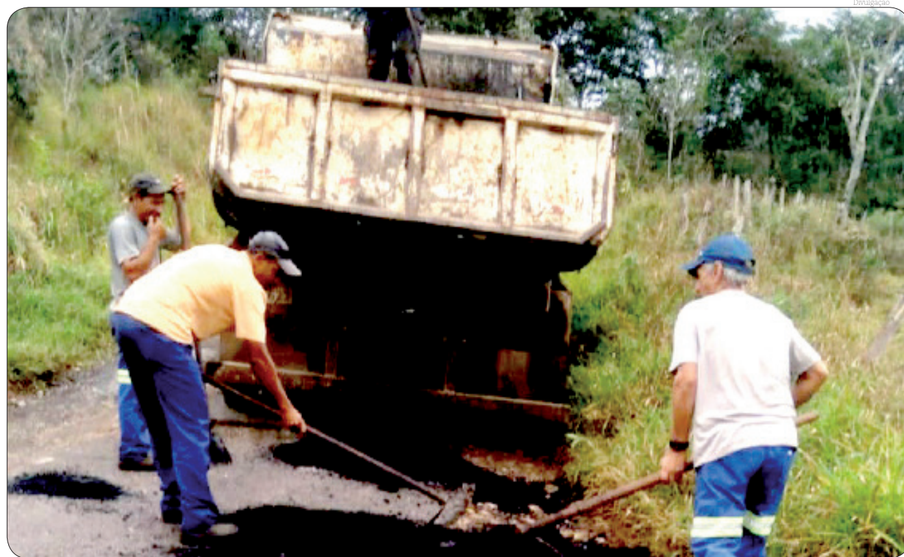
As ações de manutenção preventiva estão sendo realizadas durante o período seco