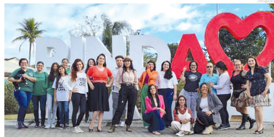
Organizadores e expositores do evento

Participaram, ao todo, para o evento, nove brechós da região: Cabide Cheio, Viva Lá Vida, Vintage Sale, Espaço Verônica Cundari, Desapega-dos Store, Bazar Home, o grupo Desapega, amiga!, e os da causa animal Ba-