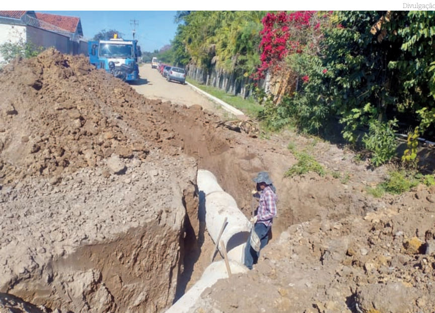
Nos próximos dias está prevista a colocação da base

A região rural da cidade também vem recebendo atenção da Prefeitura de Pindamonhangaba. A estrada municipal Carlos Giácomo Angelo Masetti, no bairro Cruz Pequena, finalizou neste mês de julho os serviços de drenagem.