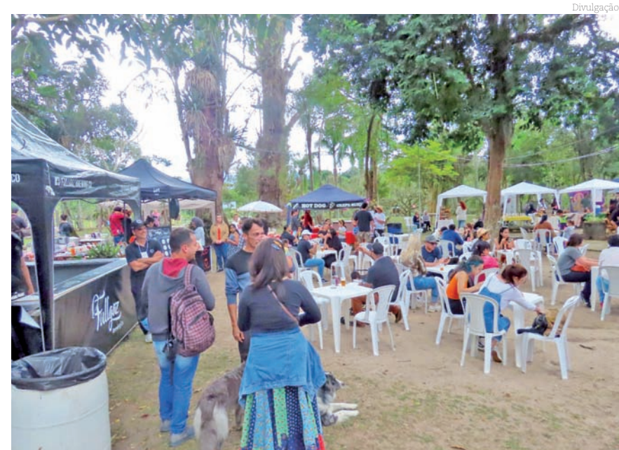
Evento reuniu cerca de 600 pessoas no último sábado (29)

SHOW DE SOLIDARIEDADE. O grande número de alimentos arrecadados surpreende visto que não era obrigatória a troca de alimentos para a retirada dos ingressos para os shows