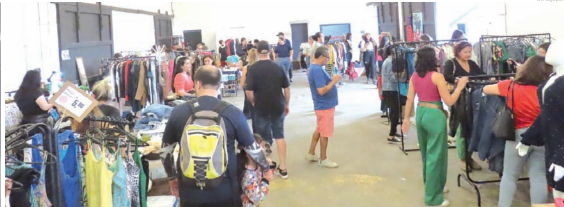
Armazém da Lagoa foi o cenário para a realização do evento de brechós