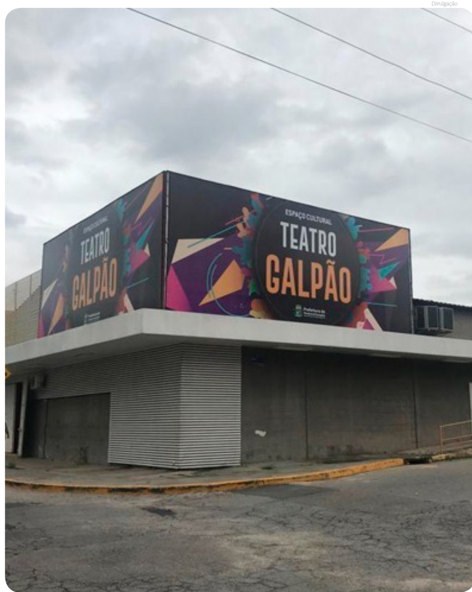
A reunião do grupo acontecerá no Espaço Cultural Teatro Galpão

De acordo com os organizadores do evento, é muito importante a presença e participação de profissionais da Educação, Saúde e Assistência Social para conhecerem a irmandade e entenderem como a instituição pode ajudar a sociedade, enquanto ferramenta de utilidade pública à disposição.