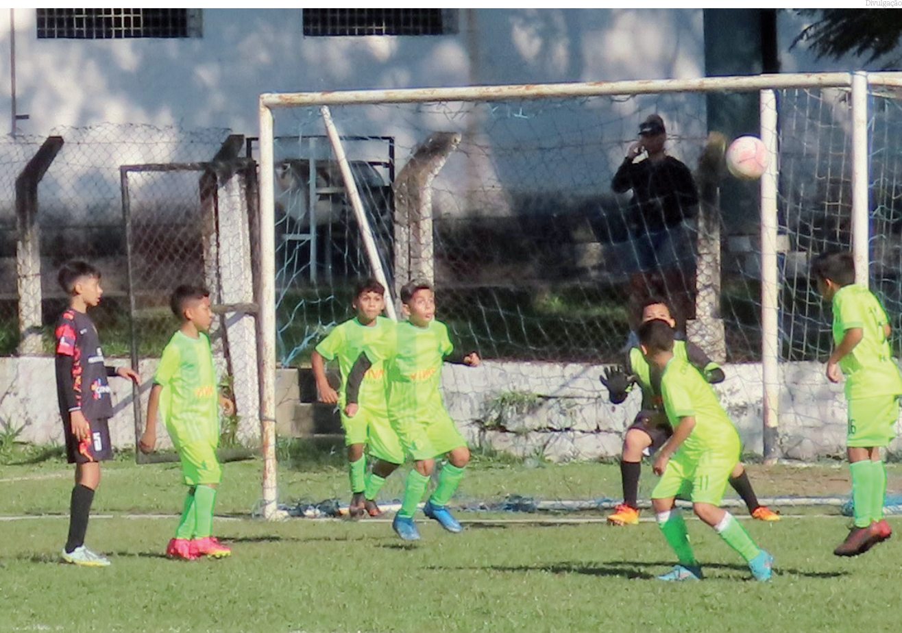
Muitas equipes entram em campo no fim de semana para as disputas