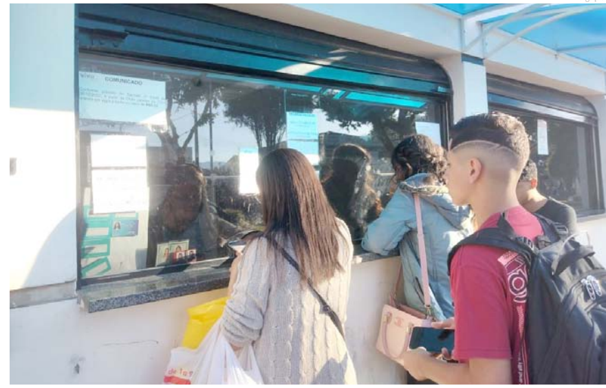
Os usuários tem até o dia 31 de julho para realizarem a troca do antigo cartão pelo novo

O procedimento deve ser realizado exclusivamente pelo titular do cartão, uma vez que o mesmo é pessoal e intransferível. Para menores de idades, o pai ou responsável pode realizar a troca. Após esse prazo, a empresa não realizará mais a troca de cartão e o usuário deve adquirir o novo cartão.