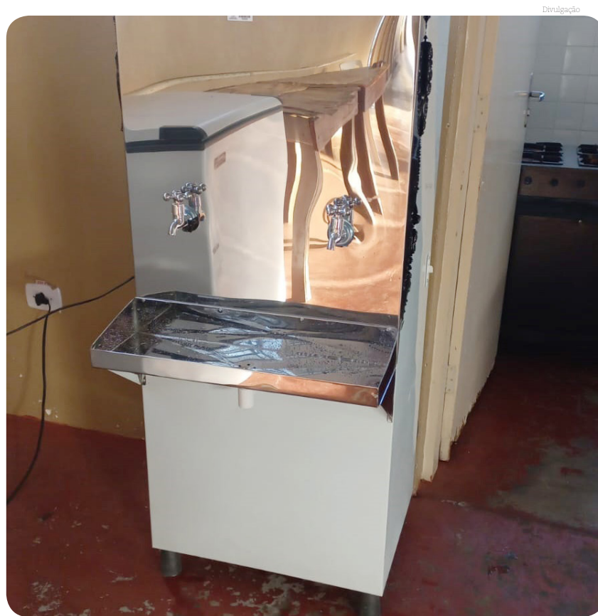
A Prefeitura investiu nos últimos dois anos, R$ 1 milhão em ações nos centros comunitários