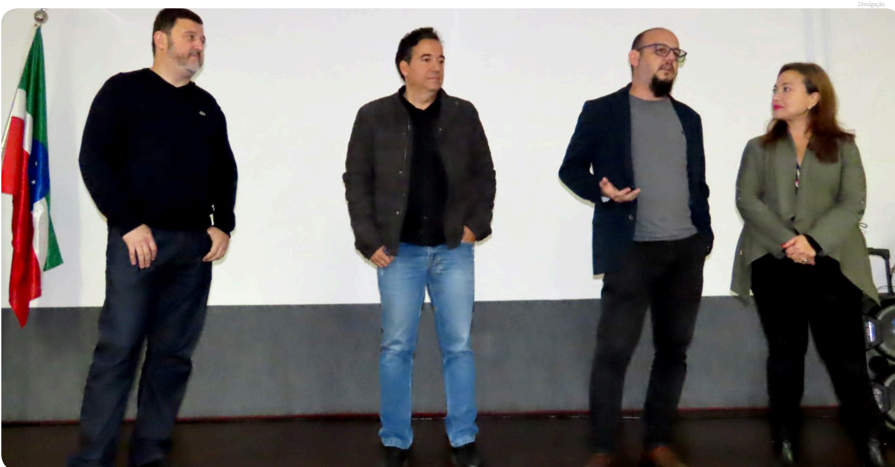
O programa irá contribuir para a criação de novas empresas e a geração de empregos

A Prefeitura de Pindamonhangaba, por meio da Secretaria de Tecnologia, Inovação e Projetos e Secretaria de Desenvolvimento Econômico, e o Sebrae realizaram, na última semana, o lançamento do programa Start Pinda, na Fatec. O programa de aceleração de startups visa apoiar e desenvolver empresas inovadoras na cidade.