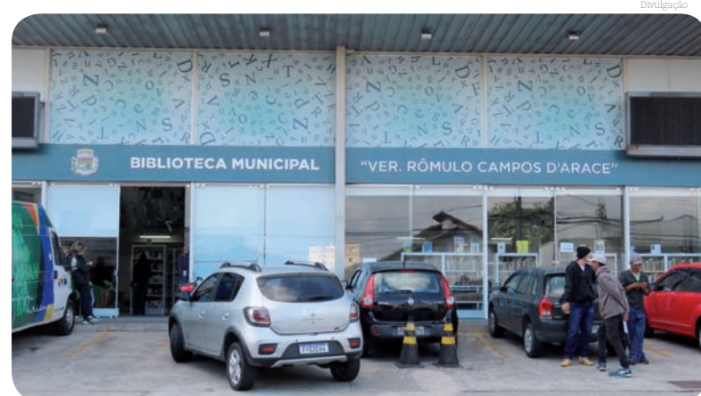
A noite terá uma programação variada, com música, exposição e contação de histórias

A 6ª edição do Fórum Vale Poético será encerrado hoje, dia 26 de julho, na Biblioteca Municipal Vereador Rômulo Campos D'Arace. O evento terá início às 19h e contará com uma programação diversificada, incluindo lançamento de livros, música, exposição e contação de histórias.