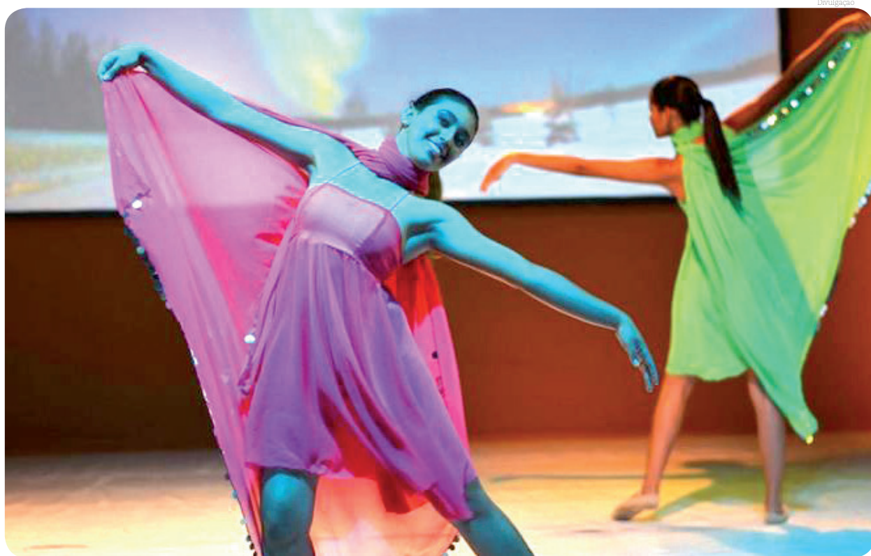
As aulas são para mulheres a partir de 18 anos, sem limite de idade

As inscrições podem ser realizadas pelo WhatsApp: 12 997203360.