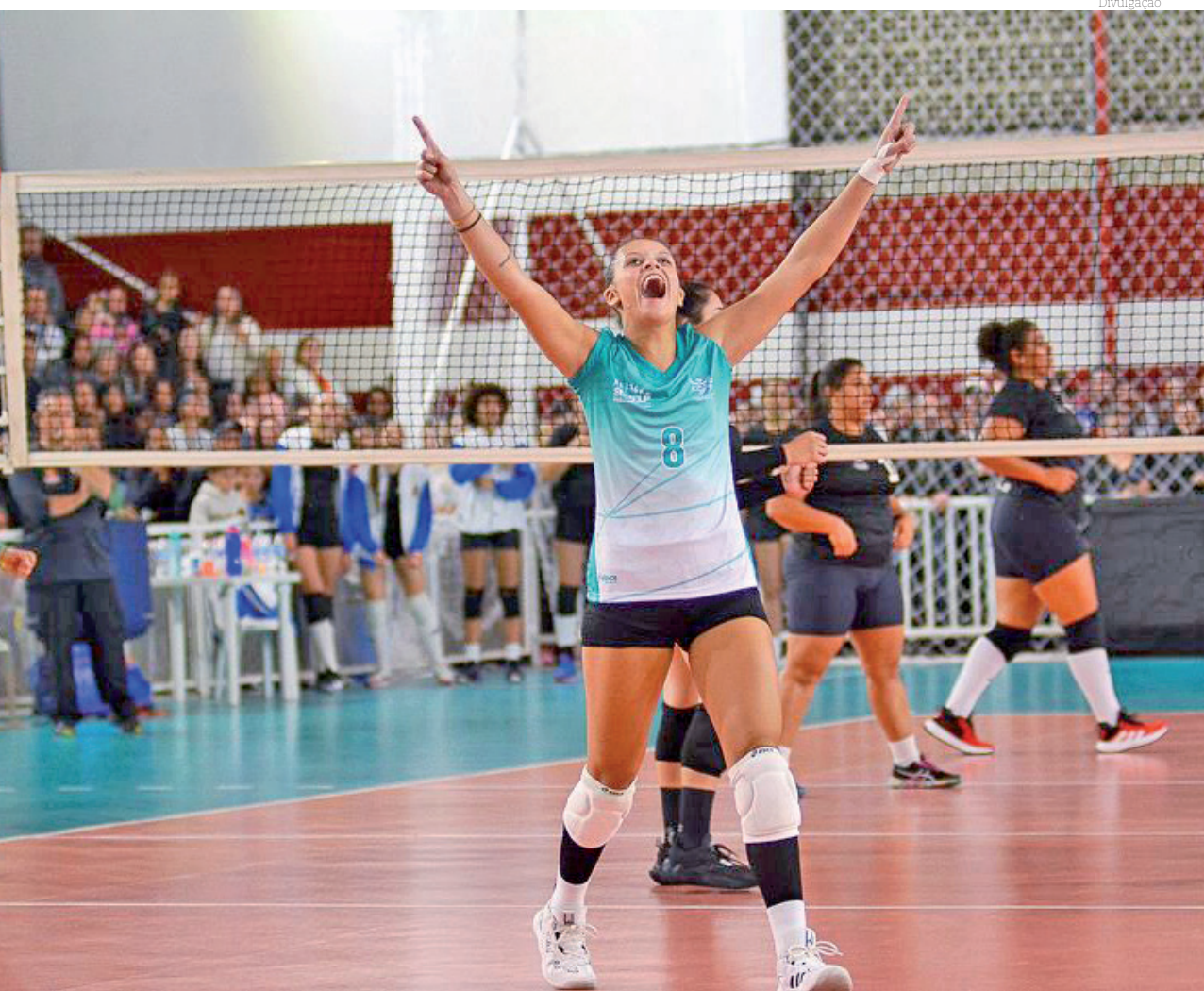
Equipe feminina de vôlei venceu Ubatuba por 2 sets a 0 no ginásio Juca Moreira, na terça-feira (4)