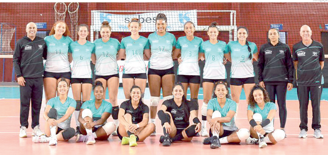
Equipes de voleibol de Pinda apresentam ótimos resultados