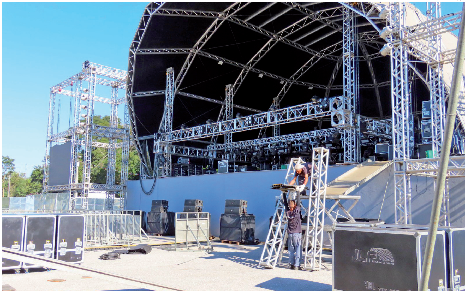
Toda a estrutura está praticamente montada e pequenos detalhes devem ser finalizados nesta quinta-feira (6) pela manhã